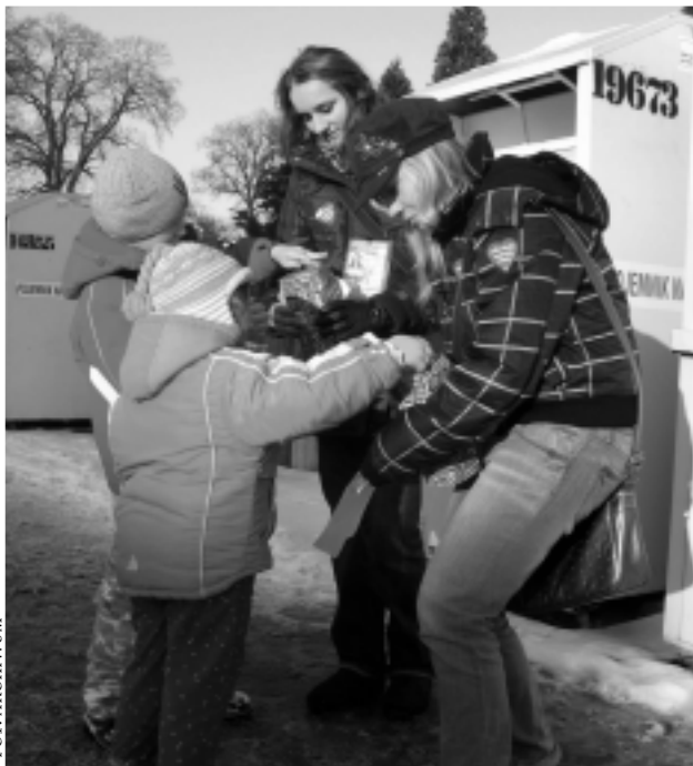
Zbiórka w Kolbuszowej