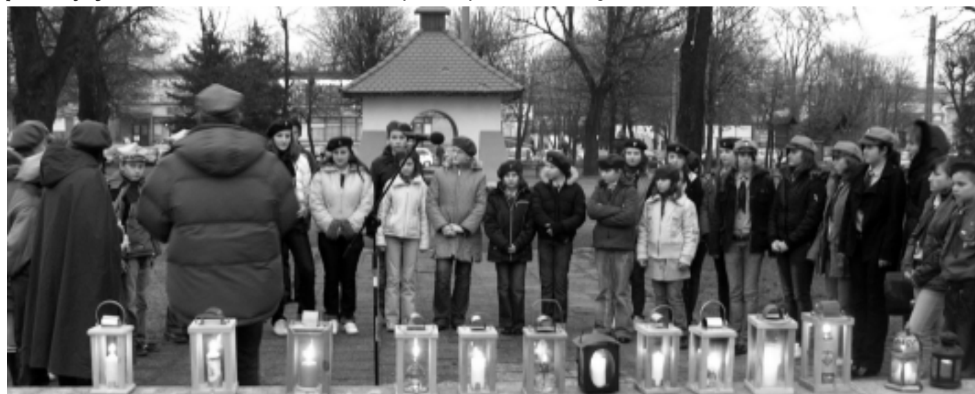
Przekazanie Betlejemskiego wiatelka Pokoju na rynku w Kolbuszowej

Wiatło z Betlejem trafiło do naszego miasta już po raz szósty.