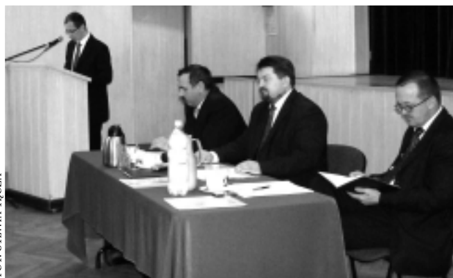
Obrady Rady Miejskiej w Kolbuszowej

Podczas bieżącej sesji radni podjęli uchwały w sprawie: - zmian w budżecie MiG Kolbuszowa, - ustalenia najniższego wynagrodzenia zasadniczego w pierwszej kategorii zaszczerowania, określonego w tabeli miesięcznych stawek wynagrodzenia zasadnicze-