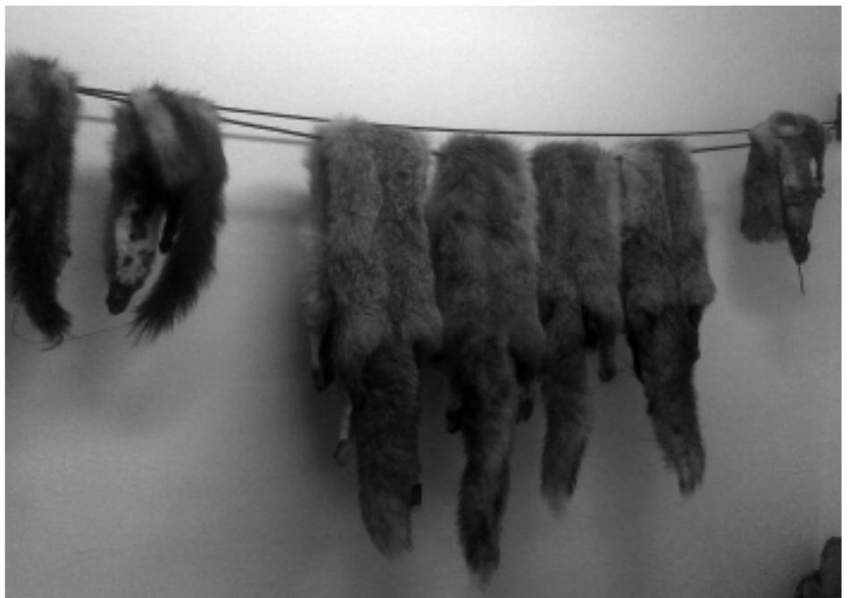
Trofea znalezione przy zatrzymanym

M czynna przyznał si do postawionych zarzutów. Ustawa Prawo Łowieckie, za przest pstwo kłusownictwa i nielegalnego posiadania trofeów zwierzyny łownej, przewiduje kar grzywny, ograniczenia wolno ci lub pozbawienia wolno ci do 1 roku.