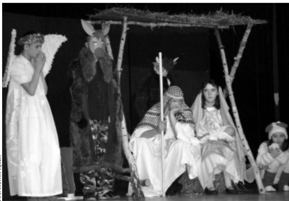
Jasełka w wykonaniu dzieci z ZSS w Kolbuszowej Dolnej

W wieczornej nastroju wszystkich wprowadziły jasełka w wykonaniu dzieci z Zespołu Szkół Specjalnych w Kolbuszowej Dolnej. Jak podkreślano w trakcie sesji, współpraca radnych i władarzy gminy w 2008 roku była owocna: W ciągu ostatniego roku na terenie Gminy zrealizowano inwestycje własne na kwotę blisko 15 mln zł., co stanowi ok. 25% tegorocznego budżetu. Dodatkowo na terenie naszej gminy wykonano przedsięwzięcia finansowane ze środków zewnętrznych, za łączną wartość ponad 55 mln zł. Gospodarz gminy podziękował wszystkim osobom współpracującym na co dzień z gminą. Życzenia i łamanie opłatkiem zakończyły ostatnią w 2008 roku sesję miejskich radnych.