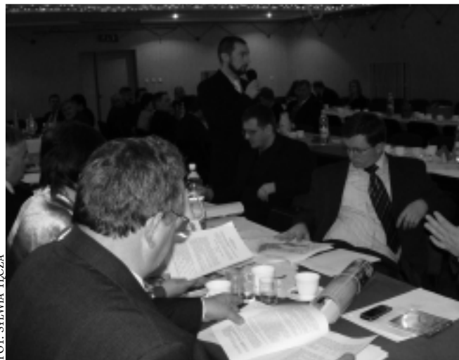
Projekty uchwał są stało przedmiotem dyskusji wśród radnych

punktu w złotych, - uchwalenia miejscowego planu zagospodarowania przestrzennego Nr 1/2008 tere-