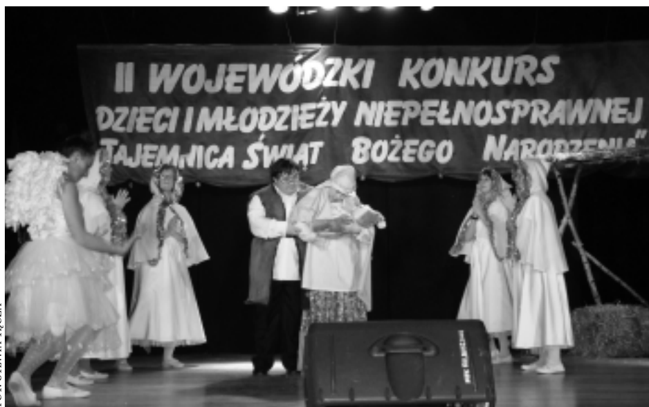
Młodzi, niepełnosprawni artyści nie tylko zachwycili publiczność. Ich oddanie i zaangażowanie w występ wzruszyły do łez niejednego widza na sali. Na zdjęciu dzieci z Rzeszowa.