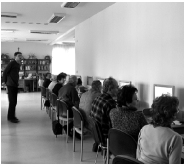
/BIB/ Pierwsze zaj cia w ramach kursu