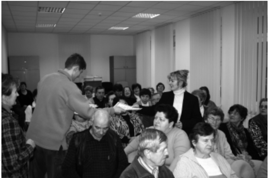
Wręczenie Dyplomów ukończenia kursu komputerowego