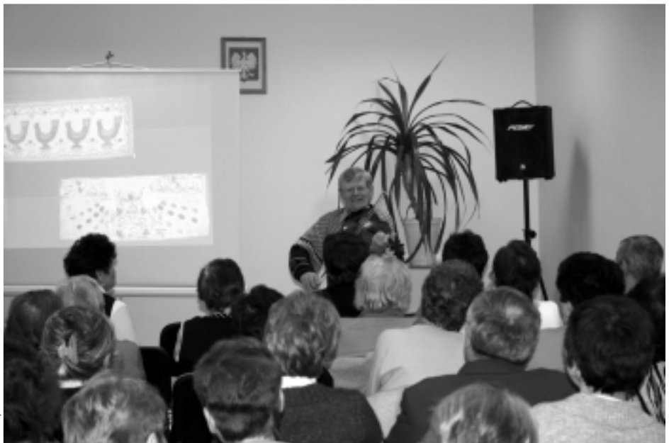
Występ Władysława Pogody