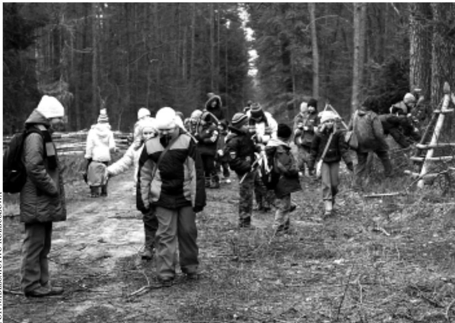
Grupa szkolna na ścieżce wierzbowej