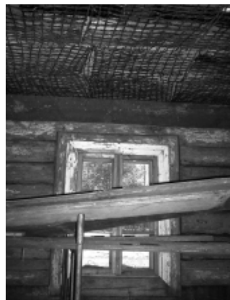
Prace przy tworzeniu stropu w chałupie (zima 2008/2009).