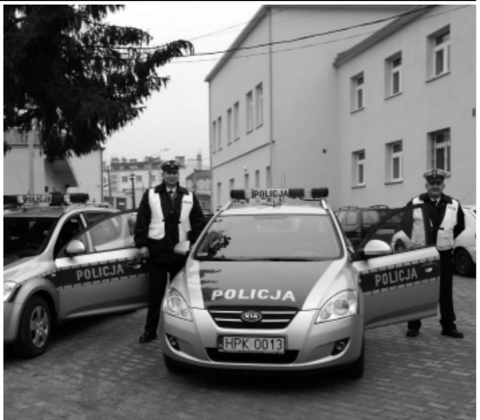
Nowe radiowozy cieszą się policjantów

Obydwa samochody będą pełniły służbę w ruchu drogowym.