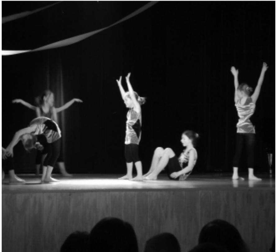
Konkursy taneczne cieszą się ogromną popularnością zarówno uczestników jak i publiczności.

Specjalne wyróżnienie przyznano zespołowi z Gimnazjum nr 1 w Kolbuszowej.