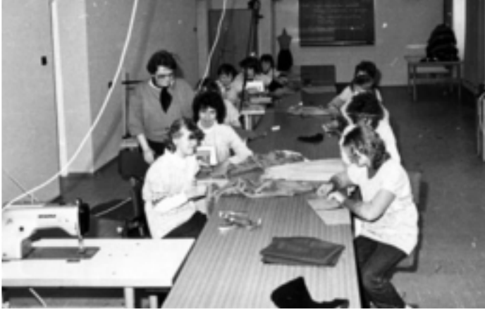
Młodzi adepci sztuki krawieckiej przy wykonywaniu swoich prac.

wano cz socjaln warsztatów szkolnych, wietlic , jadalni , zaplecze kuchenne i szatnie.