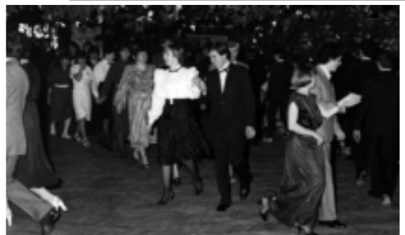
Pierwsze bale studniówkowe

Wiadomości te są jednak niekompletne. Dlatego zwracamy się z ogromną prośbą do osób posiadających jakiegokolwiek informacje, dotyczące rozwoju, osiągnięć, ważnych wydarzeń itp. o pomoc w uzupełnieniu braków i doszczegółowieniu historii Zespołu Szkół Technicznych. Osoby zainteresowane pomocą w tworzeniu „Historii Szkoły”, prosimy o skontaktowanie się z dyrekcją szkoły.