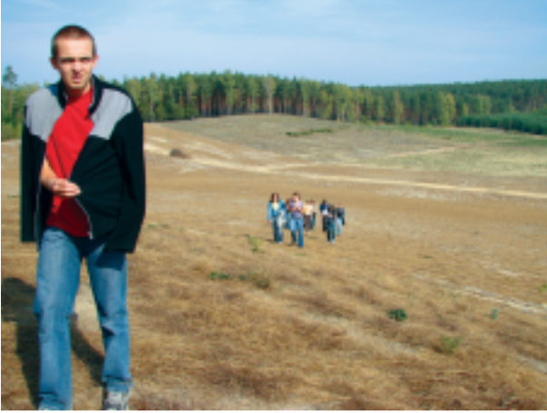
Czy to już pustynia?