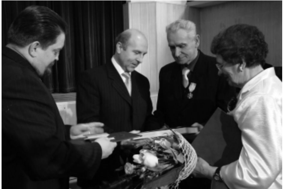
Moment przypięcia medalu oraz gratulacje niekiedy wzruszają jubilatów do łez.