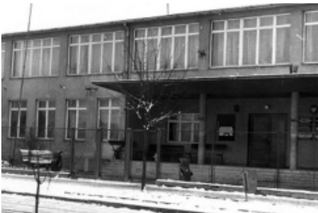
Zdjęcie budynku szkolnego ZSZ z końca lat 60-tych.

Fragmenty historii Zespołu Szkół Technicznych im. Bohaterów Września 1939 r. w Kolbuszowej