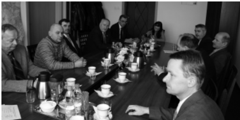
Uczestnicy spotkania w starostwie, dotyczącego przebudowy linii telekomunikacyjnej usytuowanej w poboczu drogi powiatowej nr 1227 R w miejscowości Kupno na odcinku drogi krajowej nr 9 w kierunku wsi Bukowiec.

W związku z zakwalifikowaniem się wniosku Powiatu Kolbuszowskiego do Regionalnego Programu Operacyjnego, dotyczącego przebudowy drogi powiatowej na odcinku od drogi krajowej nr 9 w kierunku wsi Bukowiec, Zarząd Powiatu Kolbuszowskiego zwrócił się z ponowną prośbą o niezwłoczne podjęcie działań mających na celu przebudowę lub likwidację istniejącej sieci telekomunikacyjnej usytuowanej w pasie drogowym drogi powiatowej. Dnia 27 lutego br. odbyły się rozmowy przedstawicieli Samorządu Powiatu, Gminy Kolbuszowa z przedstawicielami TP S.A., dotyczący możliwości realizacji zaplanowanej przez powiat inwestycji.