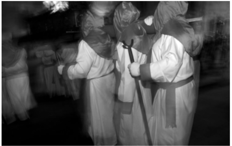
Procesja Wielkanocna w północno-zachodniej Hiszpanii.

W koszyku znajdują się między innymi pomalowane na czerwono jajka, które symbolizują krew Chrystusa, chrząstki – symbol ciała, a potica to wzór cierniowej korony. W niedzielę o 5.30 idą do kościoła, aby uczestniczyć we mszy rezurekcyjnej. Kościoły są wówczas bogato udekorowane kwiatami, gdy jest to dla katolików Słowenii najważniejszą niedzielą.