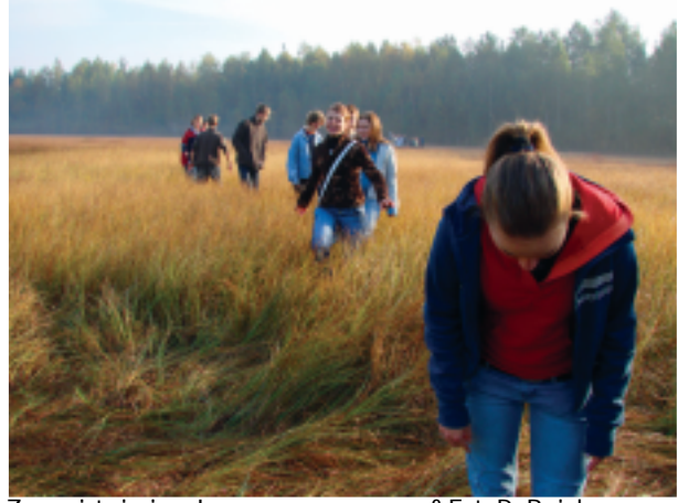
Zarówno to jest zióło Łęg - a może sawanna?