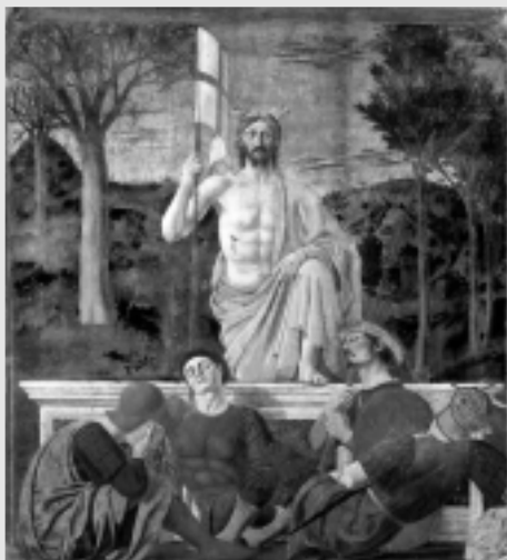
Zmartwychwstanie Chrystusa, Piero della Francesca.

Z okazji Świąt Wielkiej Nocy Mieszkańcom Powiatu Kolbuszowskiego życzę, aby paschalne orędzie dotarło do wszystkich serc, a Zmartwychwstały Chrystus obdarzył siłami do walki ze złem i śmiercią i pobłogosławił we wszystkich poszukiwaniach dobra. Oby każdy z nas został przywrócony do życia i miłości, a paschalne światło niech rozbłyśnie w naszym życiu jak najjaśniej. Niech zbawcza prawda umacnia naszą wiarę, budzi nadzieję i ożywia braterską miłość.