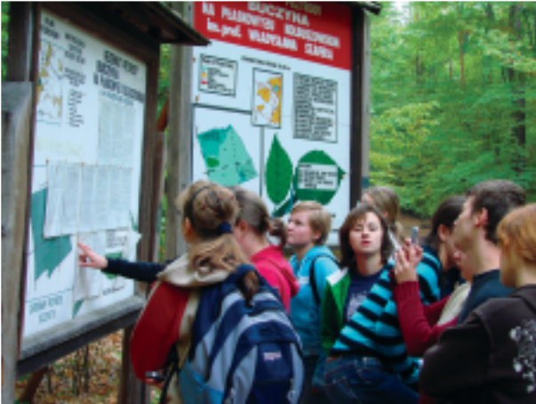
Mikroklimat jak w bieszczadach.