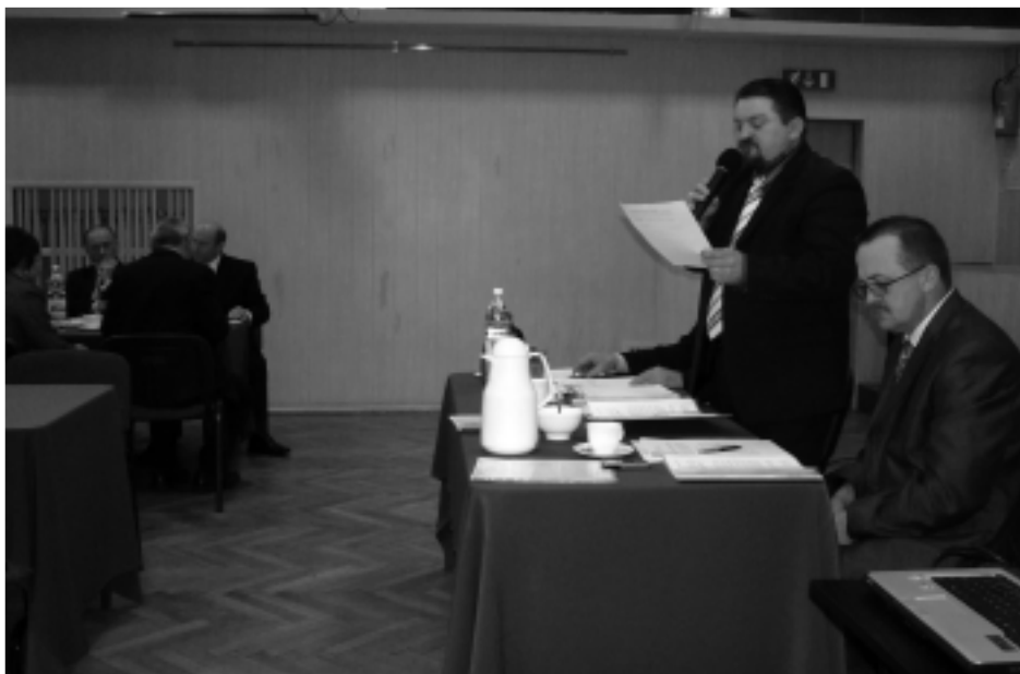
Przewodnicz cy Rady Miejskiej K. Wilk poddaje pod głosowanie uchwał Rady Miejskiej.

kowca. S to dokumenty, które w przyszło ci mog stanowi zał cznik do wniosków unijnych w ramach działania Odnowa i Rozwój Miejscowoci - PROW. Plan odnowy miejscowoci stanowi jednak bardziej dokument intencyjny ni inwestycyjny. Zawieraj m.in. wskazówki mieszka ców, dotycz ce realizacji najpilniejszych inwestycji na terenie danej wioski. Ponadto Rada Miejska podj ła uchwały w sprawie: zaci gni cia kredytu w Banku Ochrony rodowiska S.A. na finansowanie inwestycji pn. „Budowa sali gimnastycznej przy Szkole Podstawowej w Kolbuszowej Górnej”, zaci gni cia kredytu w Banku Ochrony rodowiska S.A. na finansowanie inwestycji pn. „Termomodernizacja obiektów u yteczno ci publicznej w Gminie Kolbuszowa”, ustalenia regulaminu przyznawania nauczycielom dodatków i innych składników wynagradzania w palcówkach o wiatowych, prowadzonych przez Gmin Kolbuszowa, okre lenia wysoko ci i szczegółowych zasad przyznawania i wypłacania nauczycielom dodatku mieszkaniowego w placówkach o wiatowych, prowadzonych przez Gmin Kolbuszowa, wyra enia zgody na sprzeda bez przetargu ułankowej cz ci gruntu przynale nego do lokalu w zabudowanej nieruchomo ci gruntowej, stanowi cej własno MiG Kolbuszowa, poło onej w Kolbuszowej przy ulicy Zielonej oraz udzielenia bonifkaty od ceny nieruchomo ci.