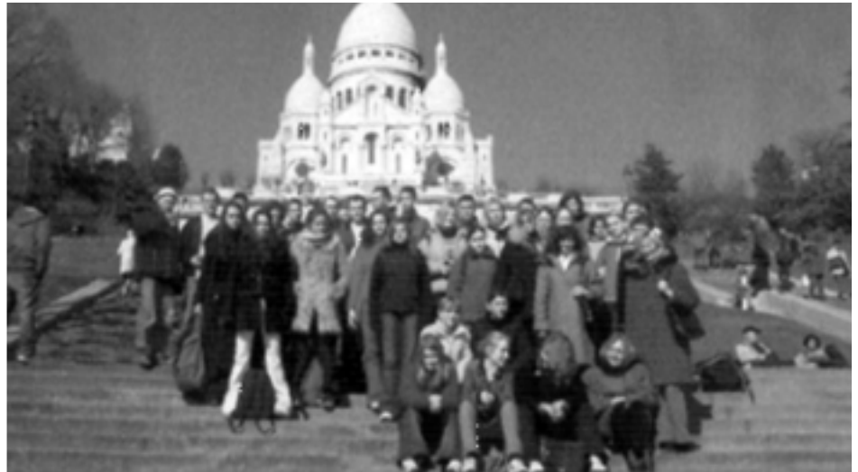
Wycieczka do Pary a w czasie wymiany

Rok 2004 – Szkoła realizuje program finansowany przez UE „Sokrates Comenius” w ramach projektu „ycie w małej Ojczy nie mo e by pasjonuj ce”. Tema-