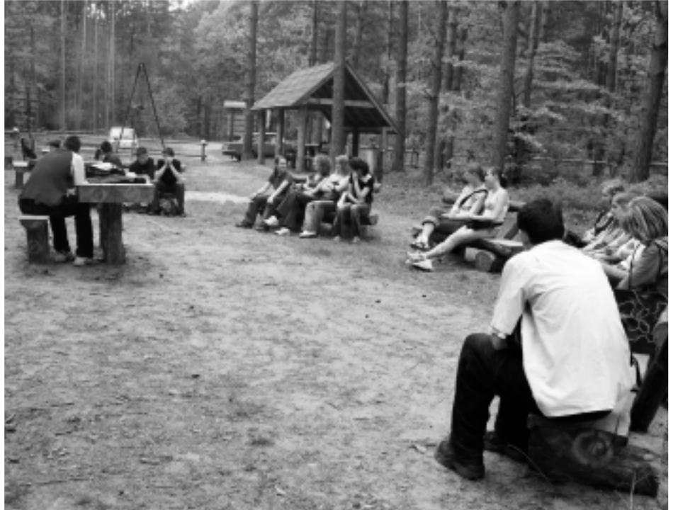
Zasłony odpoczynek w leśnej szkole.

Podczas naszych wypadów zwracamy uwagę na skały osadowe zalegające na terenie powiatu, dzięki temu możemy określić przeszłość geologiczną regionu od ostatniej epoki lodowej do współczesności. W niektórych miejscach napotykamy na dużych głazach narzutowe, przyniesione przez lodolód skandynawski setki tysięcy lat temu. Liczne wiry stanowią o potężnym wód pochodzących z topniejącego lodolodu. W okolicach Niwisk odwiedzamy dawne obszary podmokłe, które tysiące lat temu niewątpliwie były pokryte wodnymi jeziorami. Dzisiaj pozostały po nich torfowiska, gdzie możemy