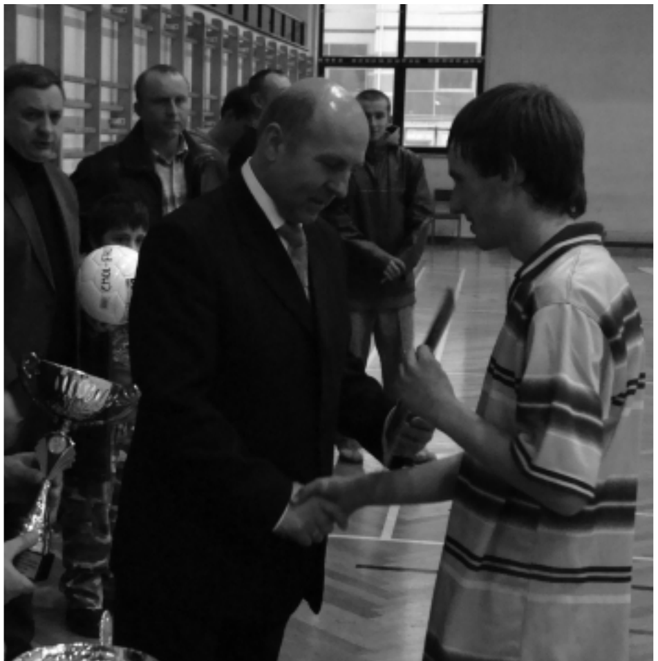
Najprzyjemniejszy moment dla uczestników turnieju, ogłoszenie wyników i wręczenie pucharów.