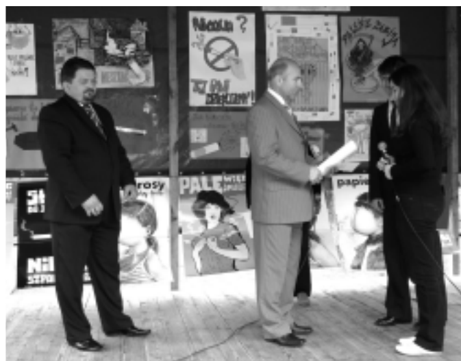
Pierwsze efekty petycji skierowanej do władz miasta już są. Na początek - ostrzeżenie i apel do sprzedawców o to, by papierosy nie dostały się w ręce nastolatków.

Burmistrz przypomina w piśmie, że istnieje bezwzględny zakaz sprzedaży papierosów osobom do lat 18. W apelu jest też ostrzeżenie przed sankcjami karnymi, jakie mogą ponieść sprzedawcy za nie stosowanie się do powyższych przepisów. Burmistrz przypomina jednocześnie, że kontrole mające na celu wyłapanie i ukaranie nieuczciwych sprzedawców są i będą systematycznie przeprowadzane na terenie gminy Kolbuszowa.