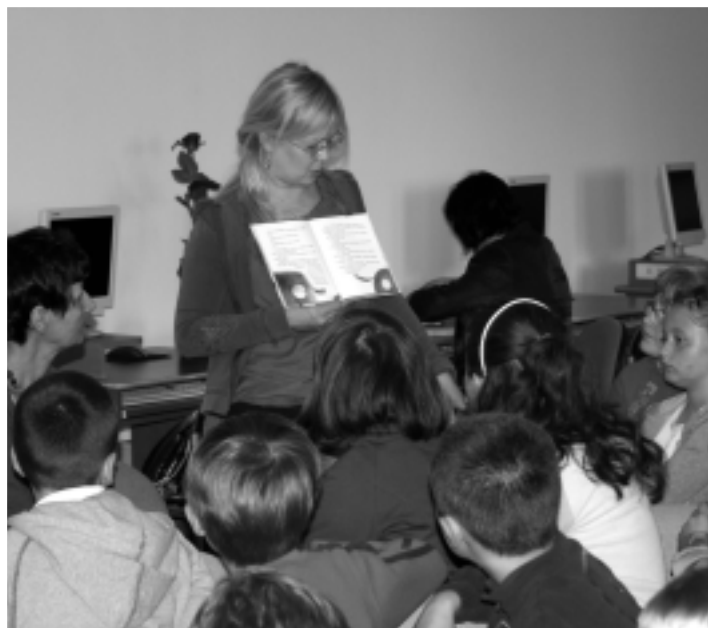
Autorka "Niezwykłych wakacji" pokazuje dzieciom swoją książkę

Pozdrowienia dla wszystkich czytelników Oddziału dla Dzieci i Młodzieży Pa-