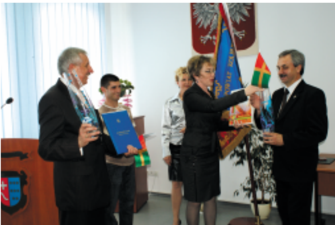
Wystąpienie i przekazanie prezentów przez gości z Powiatu Romanowskiego na Ukrainie, z którym Powiat Kolbuszowski współpracuje już od dziecięciu lat