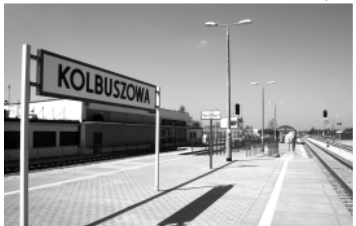
Kolbuszowa ma jeden z najpiękniejszych i najnowocześniejszych dworców na Podkarpaciu.