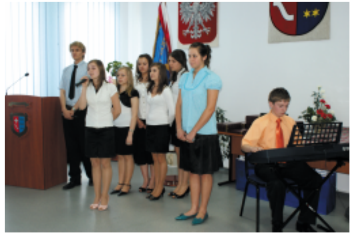
Program słowno-muzyczny w wykonaniu uczniów z Zespołu Szkół Technicznych w Kolbuszowej