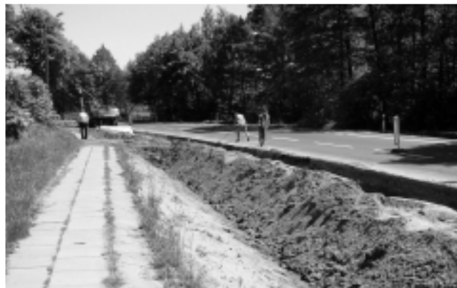
Kierownicy będą musieli jeszcze na jakiś czas uzbroić się w cierpliwość

wania, oraz roboty związane z usuwaniem usterek.