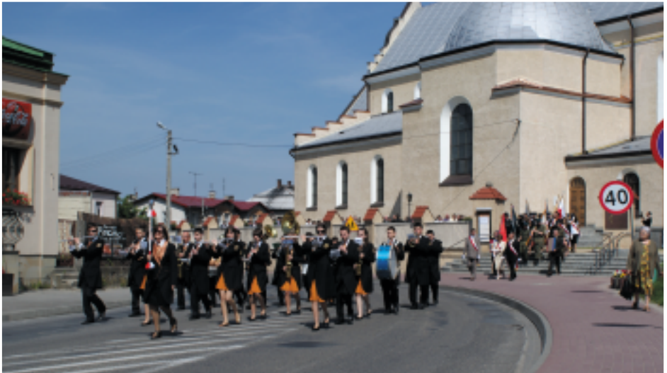
Po Mszy Św. uczestnicy obchodów przemaszerowali do budynku Starostwa, gdzie nastąpił centralny punkt uroczystości