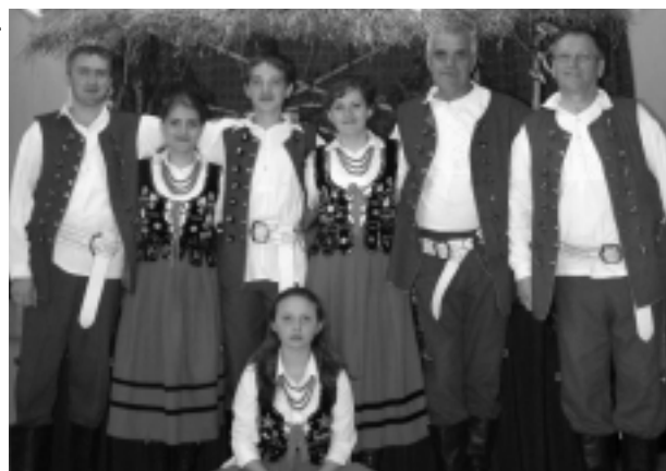
Pod koniec czerwca Widelanie wezmą udział w 43 Ogólnopolskim Festiwalu Kapeli i Śpiewaków Ludowych w Kazimierzu Dolnym.

J. S. dziękuję za rozmowę i życzę powodzenia w dalszej działalności Kapeli