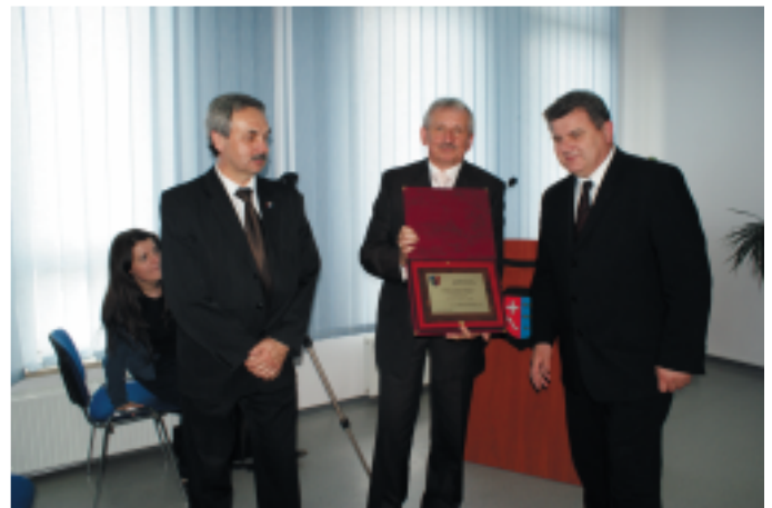
Podziękowanie i gratulacje pod adresem władz powiatu skierował Marszałek Województwa Podkarpackiego Zygmunt Cholewiński