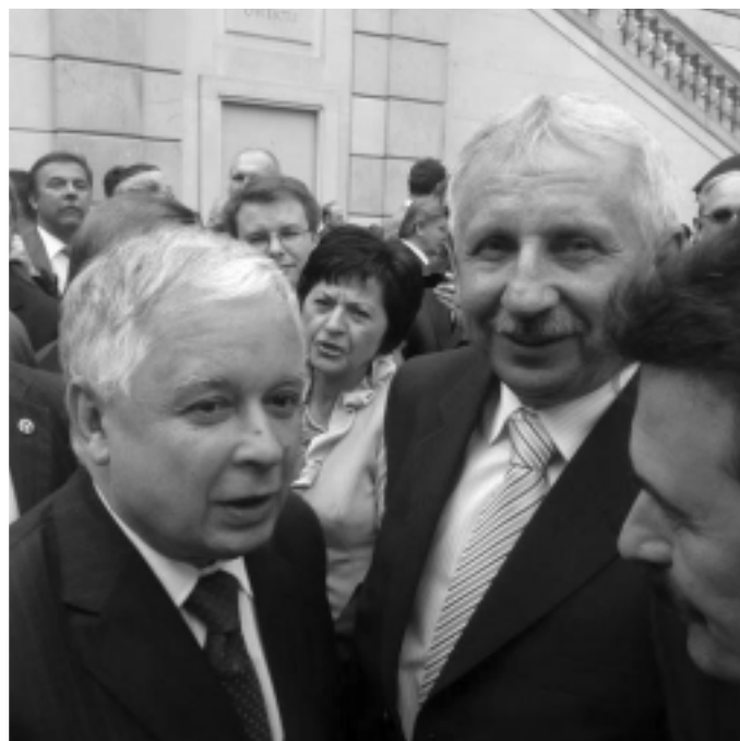
Starosta Kolbuszowski Józef Kardyś miał okazję osobiście podziękować za spotkanie Prezydentowi Lechowi Kaczyńskiemu.

- Jestem zwo- lennikiem aktywnej i odważnej walki z kryzysem. Za szczególnie ważną kwestię uważam przeciwstawienie się społecznym skut- kom recesji, aby w jak najmniejszym stopniu dotknęła ona gospodarstwa domowe i nie odbi- ła się na życiu mi- lionów Polaków. Wspominam o tych problemach przede wszystkim dlatego, by podkreślić Pań-