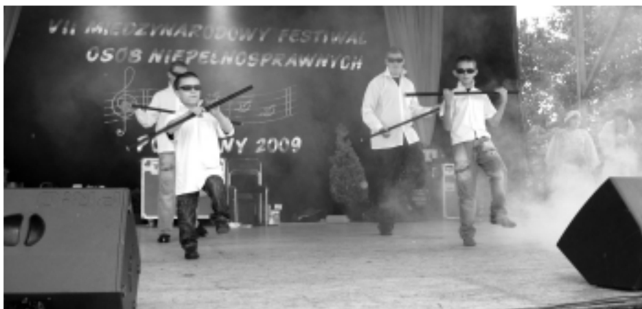
Ten występ zdobył największe brawa publiczności.