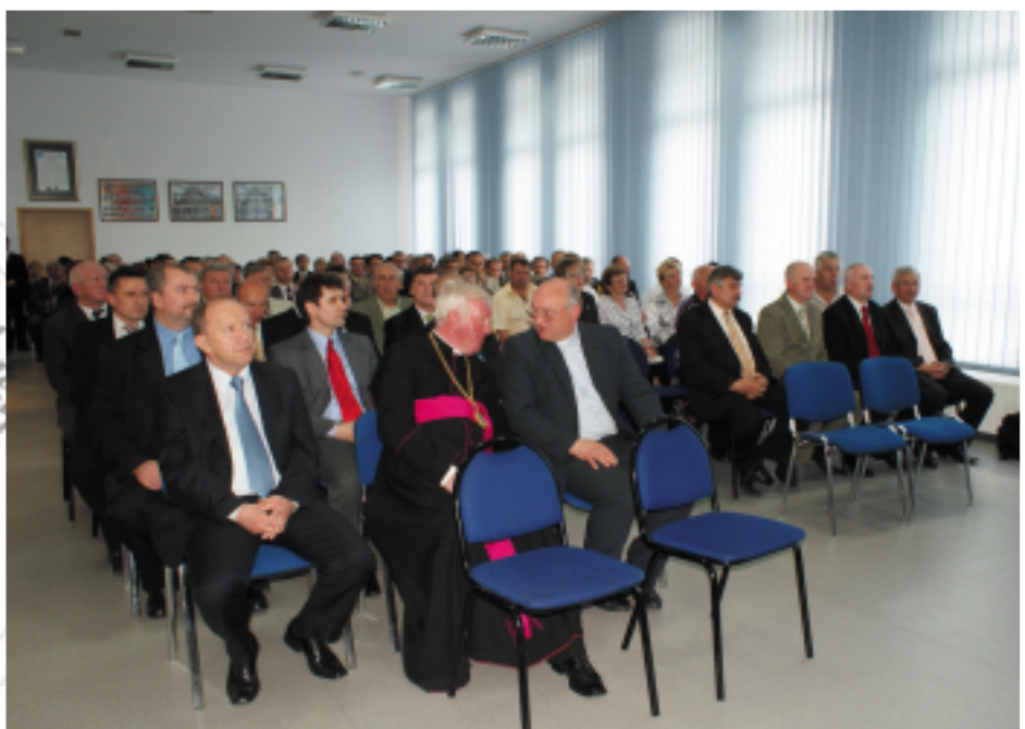
Przybyli goście na obchody uroczystości X-lecia Powiatu Kolbuszowskiego