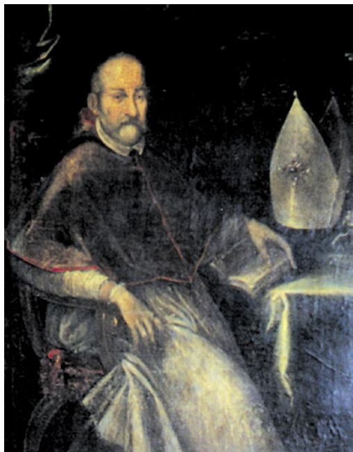
Bp Piotr Myszkowski