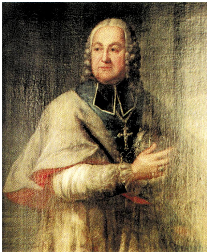
Bp Kajetan Sołtyk