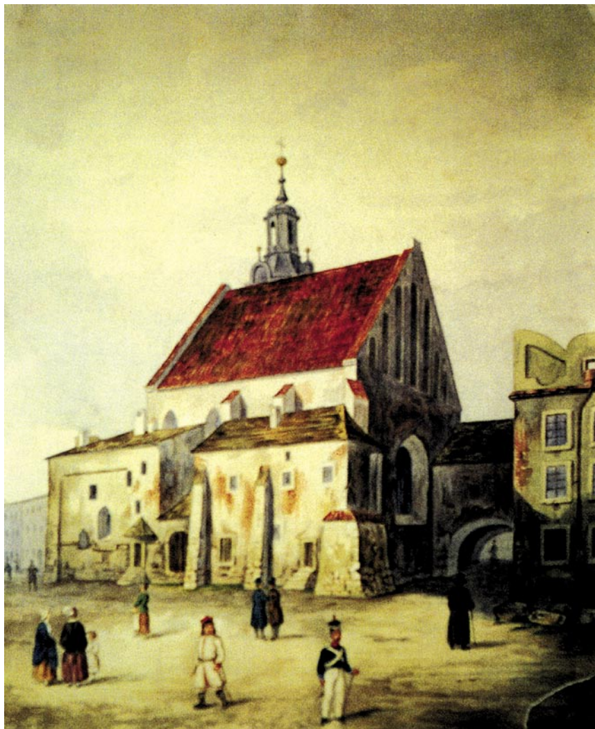
Kolegiata Wszystkich Świętych w Krakowie