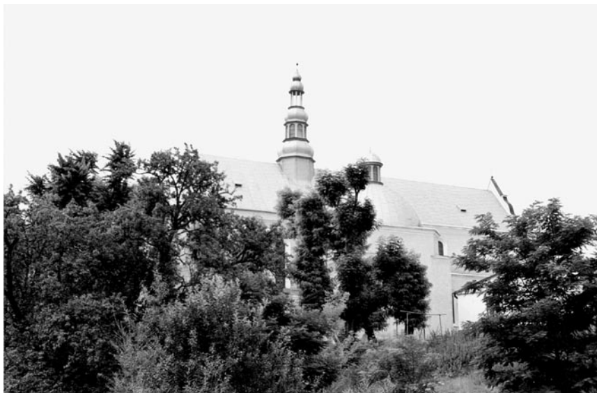
Kolbuszowska fara (stan obecny).