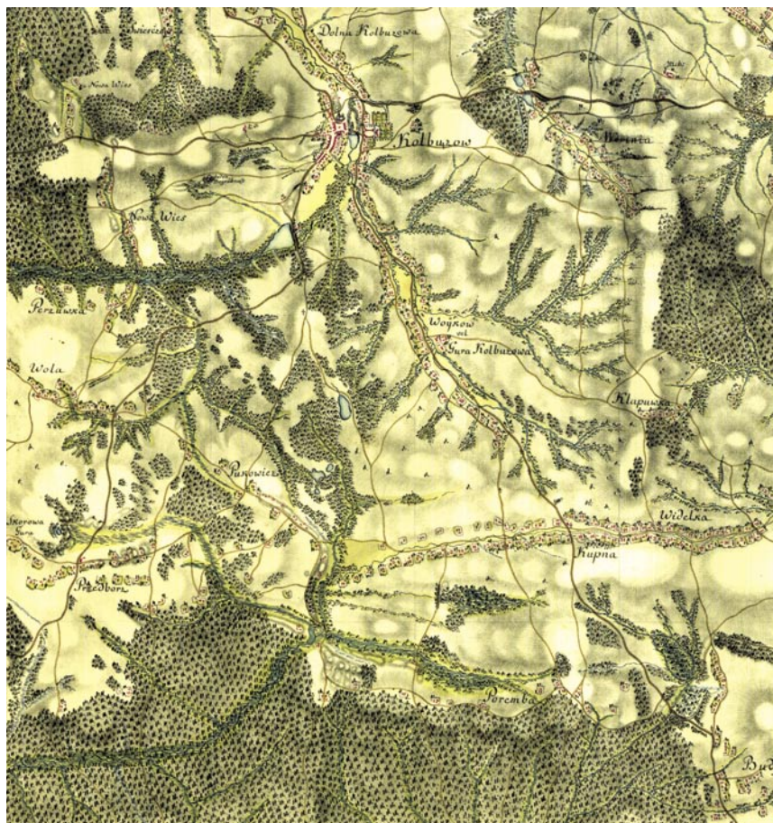
Terytorium parafii farnej w Kolbuszowej według mapy F. Miega (1779-1782).