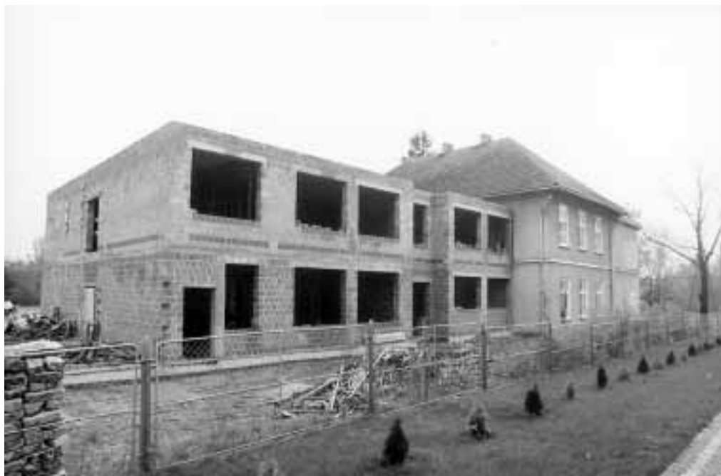
Budowa widziana od strony kościoła parafialnego w Mazurach.

- Kiedy planowane jest zakończenie pierwszego etapu?