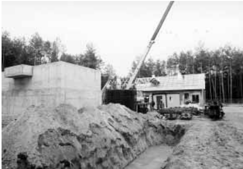
Plac budowy gminnej oczyszczalni ścieków w dniu 3.11.1999r.