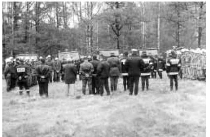
Zbiórka po zakończeniu ćwiczeń i podsumowanie.

zacy i obserwatorzy zostali gościnnie przyjęci przez druhow z jednostki OSP Poręby Wolskie.