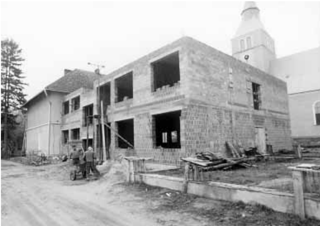
Plac budowy Szkoły Podstawowej w Mazurach.