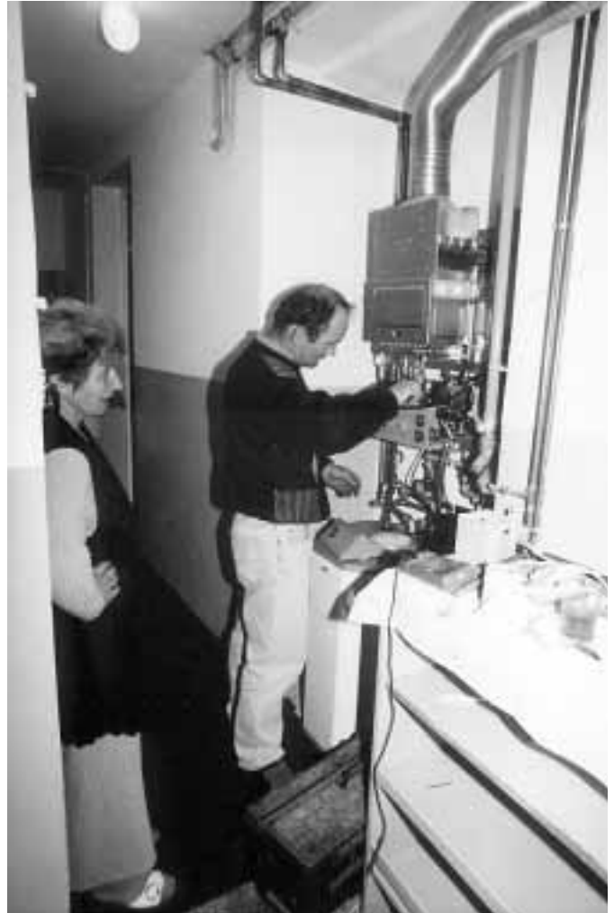
Uruchomienie pieca gazowego do c.o. i c.w.u. w Przedszkolu w Raniżowie.