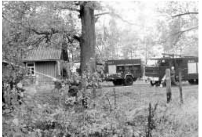
Wozy bojowe OSP Raniszów i OSP Posuchy przed leśniczówką w Porębach Wolskich.