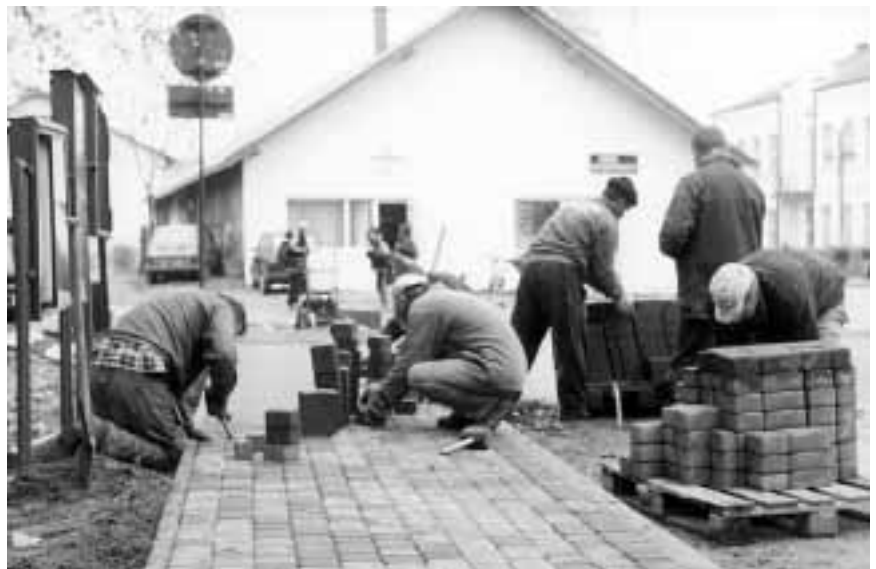
Przebudowa chodnika dla pieszych w centrum Ranizowa.

Ponadto zgodnie z harmonogramem przebiegają prace przy budowie oczyszczalni ścieków i kanalizacji sanitarnej w Ranizowie. Tym samym spełnione zostały wymogi w celu uzyskania w br. dotacji z programu INRED w wysokości 184.000 zł., z rezerwy budżetu państwa