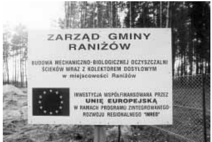
Tablica informacyjna na placu budowy gminnej oczyszczalni ścieków w Ranizowie - Borkach