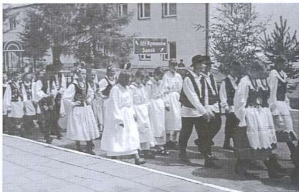
Prezentacja zespołów na ulicy Bukowskiej.

Rokrocznie przyjeżdża tutaj bardzo wielu młodych wykonawców z całej Polski, których konkursowe prezentacje są naprawdę na bardzo wysokim poziomie artystycznym. W związku z tym i atmosfera towarzysząca konkursowi była bardzo gorąca, młodzi wykonawcy bardzo przeżywali swoje występy. Mimo to wszyscy mogli liczyć na życzliwe przyjęcie i rzesiste oklaski, którymi nagradzała wykonawców wsza-