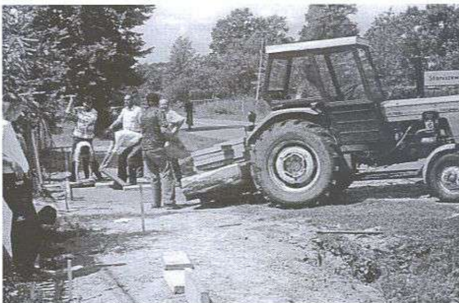
Pierwsze płytki położono na granicy Staniszewskiego i Zielonki w dniu 10 lipca br.

Ponadto w Szkole Podstawowej w Zielonce w miesiącu lipcu przywieziono 20 przyczep ziemi na szkolne boisko, rozwalono ją i zasiano trawę. W budynkach szkolnych trwa wymiana instalacji elektrycznej, wymiana stolarki okiennej (10 sztuk) i drzwiowej (5 sztuk) oraz zmiana pokrycia dachowego.