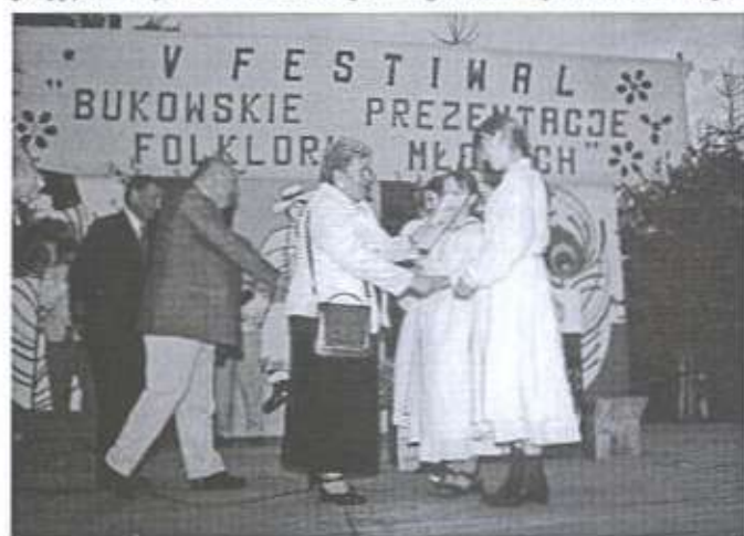
Młode Mazurkanki odbierają gratulacje i nagrodę od organizatorów.

niała bukowska publiczność. Prezentowano piękne, autentyczne ludowe pieśni i melodie z wielu regionów Polski.