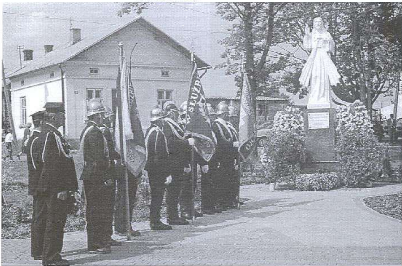
Poczty sztandarowe jednostek OSP z gminy Raniżów.