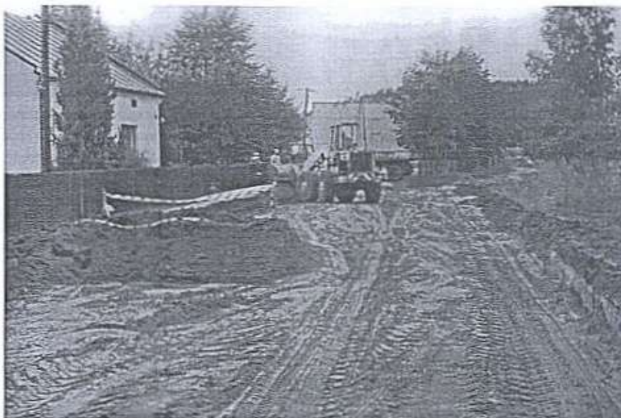
Rozpoczęła się modernizacja drogi dojazdowej do stadionu (7.08.2000r.).

Następnie, niczym bumerang, powrócił pod obrady temat lokalizacji punktów sprzedaży napojów alkoholowych. Radni długo dyskutowali nad ponadczasową formą uchwały. Spory dotyczyły przede wszystkim odległości od obiektów użyteczności publicznej oraz miejsc kultu religijnego. Niektórzy z radnych proponowali zdefiniować obiekty kultu religijnego jako te, w których odprawia się msze święte oraz cmentarze. Ostatecznie Rada Gminy podjęła uchwałę nr XXIII/161/00 w sprawie zmiany do uchwały z 1997 r. dotyczącej ustalenia szczegółowych zasad wydawania i cofania