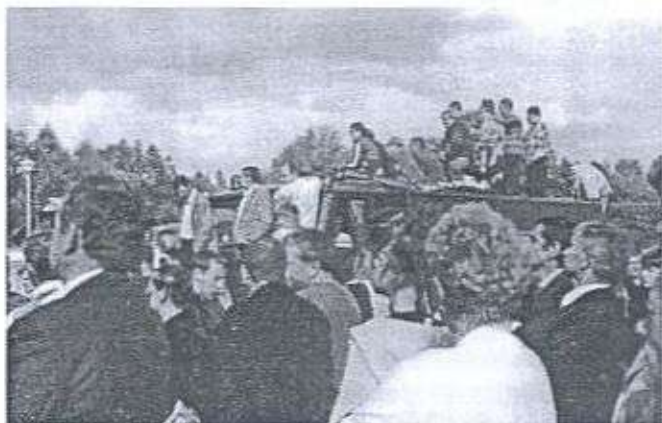
Najlepszym miejscem do oglądania missek i Rudiego był wóz strażacki.

terenie którego odbyła się cała impreza, pracowników Urzędu Gminy, Policji zabezpieczającej porządek na drodze dojazdowej oraz jednostki OSP Raniżów.