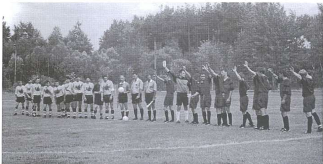
Drużyny LKS Dębiaki i KS Raniżovii przed inauguracyjnym meczem w klasie A w dniu 6 sierpnia br.

„Więści Raniżowskie” - pismo społeczno-kulturalne, Miesięcznik. Wydawca: Gminny Ośrodek Kultury, Sportu i Rekreacji w Raniżowie, tel. (017) 744 25 55. Redaguje Zespół. Teksty podpisane odzwierciedlają poglądy autorów. Przedruk dozwolony z podaniem źródła. Adres internetowy: http://www.kolbuszowa.biz.pl/abakus/html/prasa.html , e-mail: goksir@poczta.onet.pl Nakład 350 szt.