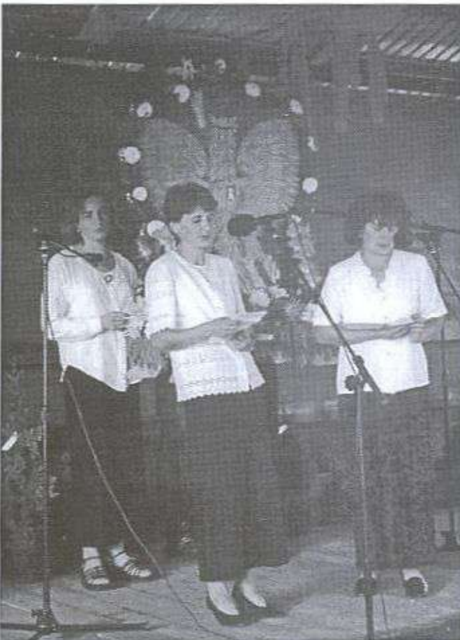
"Nasza wioska ładna, choć są dziury w płocie, w naszych Korczowiskach duże bezrobocie..."

wystąpienia wójt stwierdził, że wiele gospodarstw w naszej gminie funkcjonuje dzięki finansowaniu w nie dochodów ze źródeł pozarolniczych, a niejednokrotnie dzięki uzyskanym rentom i emeryturom rolniczym starszych członków rodzin. Kryzys w rolnictwie pogłębiają spadek cen produktów rolnych, brak rynku zbytu i niekorzystne ustawodawstwo. Pomimo tych trudności w naszej gminie dzięki zaangażowaniu mieszkańców udało się w roku ubiegłym i bieżącym wykonać kilka inwestycji poprawiających sytuację wsi: kanalizację w Ranizowie dla około 300 gospodarstw, gminną oczyszczalnię ścieków, doprowadzono sieć wodociagową do przysiółka Zmysłów w Mazurach dzięki dużemu wkła-