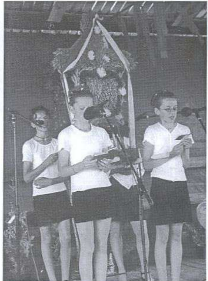
"A ta młodzież z Posuch wójtowi dziękuje, bo przy oświetleniu po nocach randkuje..."