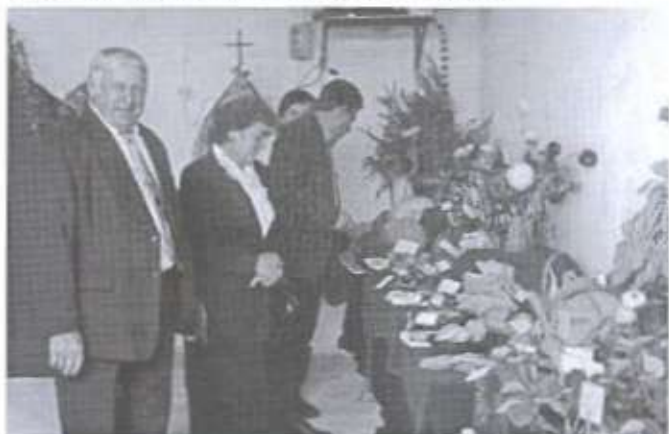
Wystawa płodów rolnych cieszyła się dużym zainteresowaniem rolników.