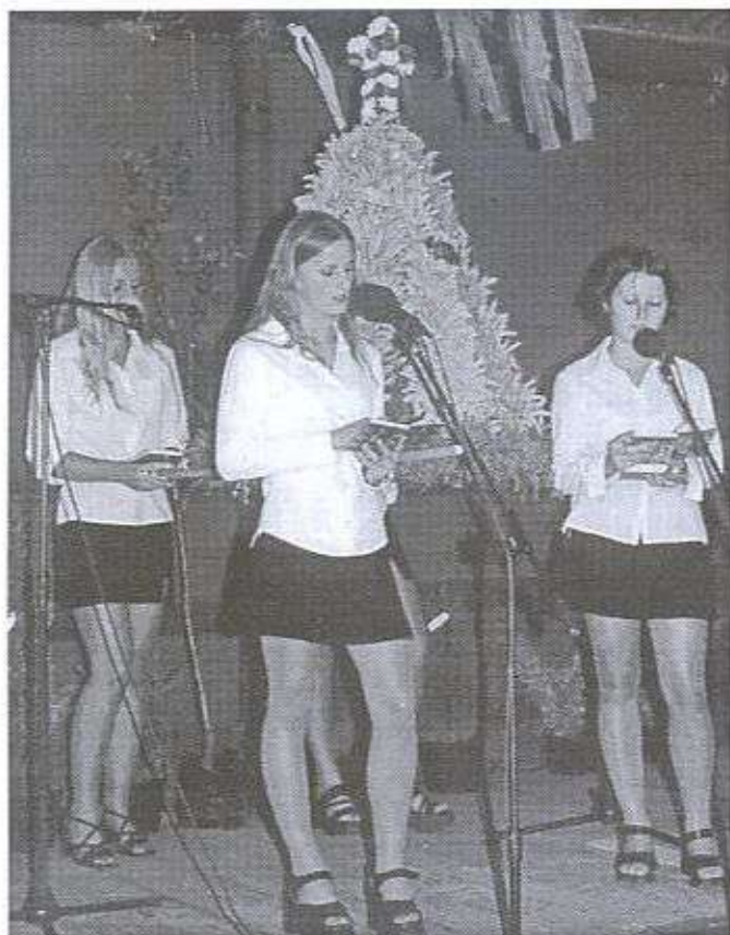
"Chłopcy z innych wiosek to nas krytykują, ale potem z Woli żony poszukują..."