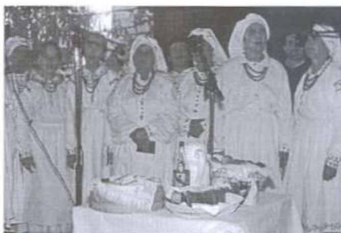
"A teraz jak każde obyczaj nasz stary do starosty pójdziem ustawieni w pary..." - Mazury