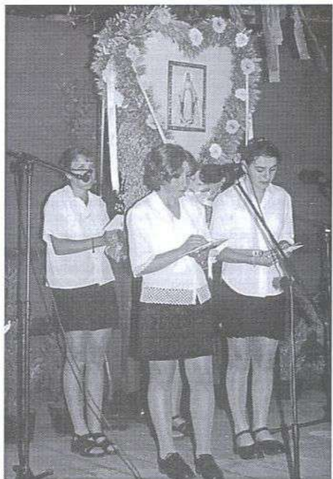
"A w naszej wiosce chodniczek już mamy, tak jak ludzie z miasta, nie jak ze wsi chamy..." - Zielonka