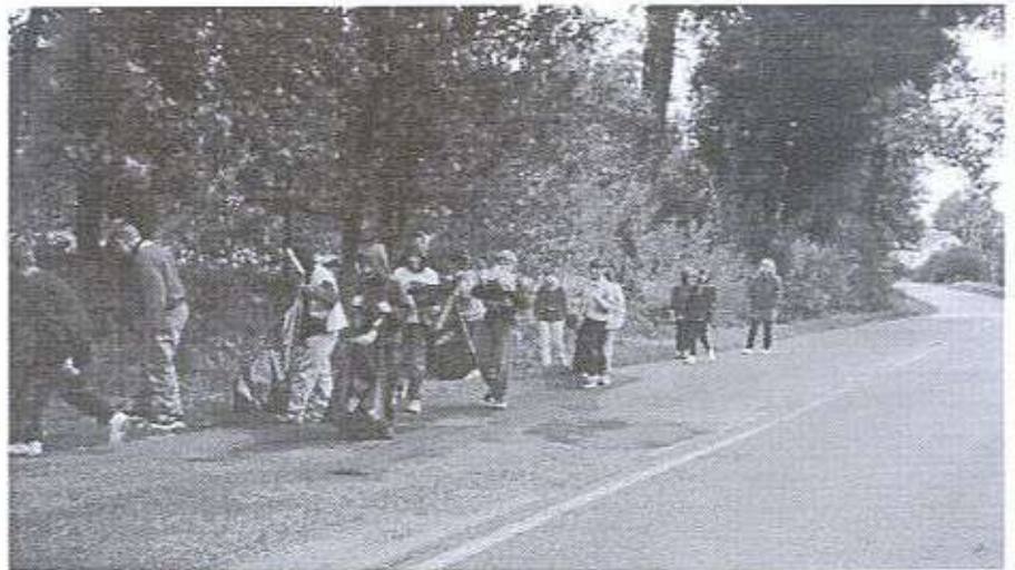
Uczniowie klasy IV i V ze SP z Zielonki, podczas zbierania śmieci.