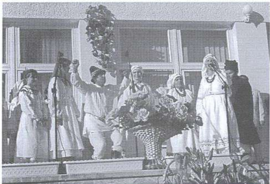
"Mazuranie" podczas swego występu.