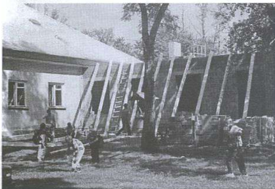
Rozbudowa zaplecza socjalnego przy Szkole Podstawowej w Staniszewskim.