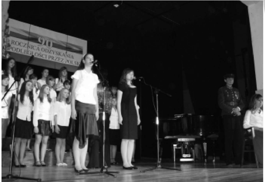
Występ uczniów z Gimnazjum nr 1 im. 11 listopada.

ległości w Kolbuszowej rozpoczęły się już w poniedziałek popołudniu. O godzinie 17.00, w Miejskim Domu Kultury, odbyła się wieczornica, przygotowana przez uczniów z Gimnazjum nr 1 im. 11 Listopada. Przedstawienie pt. „Ta, co nie zginęła” okazało się wspaniałą lekcją historii, szczególnie dla licznie zgromadzonej grupy dzieci i młodzieży kolbuszowskich szkół. Obecni na sali najstarsi mieszkańcy podkreślali, że Ojczy-