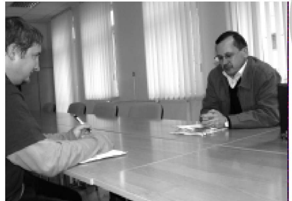
Kolejna okazja do rozmowy na temat funduszy unijnych już 22 listopada!

Dyżury będą się odbywały w budynku Urzędu Miejskiego w Kolbuszowej, pokój nr 2 (parter), w godzinach od