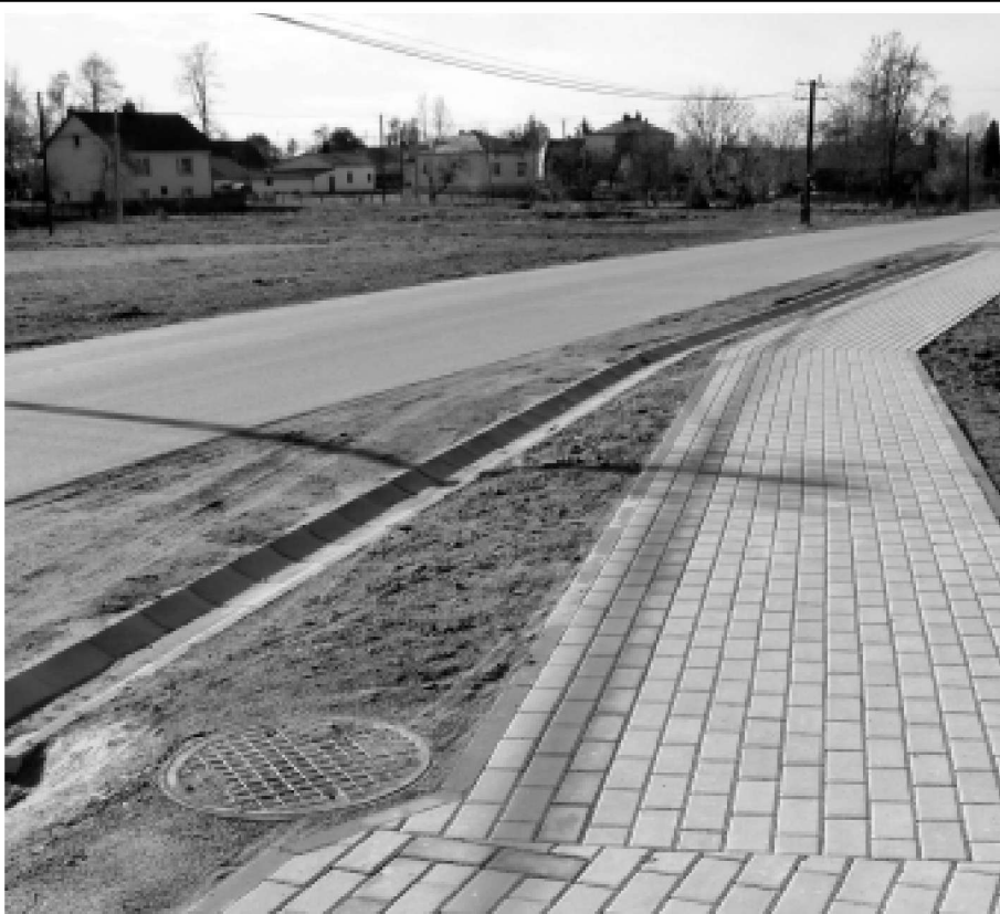
Investycja cieszy rodziców uczniów ZS w Widelce. Droga do szkoły po kostce będzie z pewnością o wiele bezpieczniejsza niż spacer poboczem. Fot. S. Tęcza