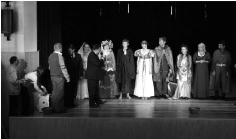
Goście otrzymali od władz miasta drobne pamiątki.

Światowy Przegląd Teatrów Polonijnych odbywa się co dwa lata. Jest to dru-