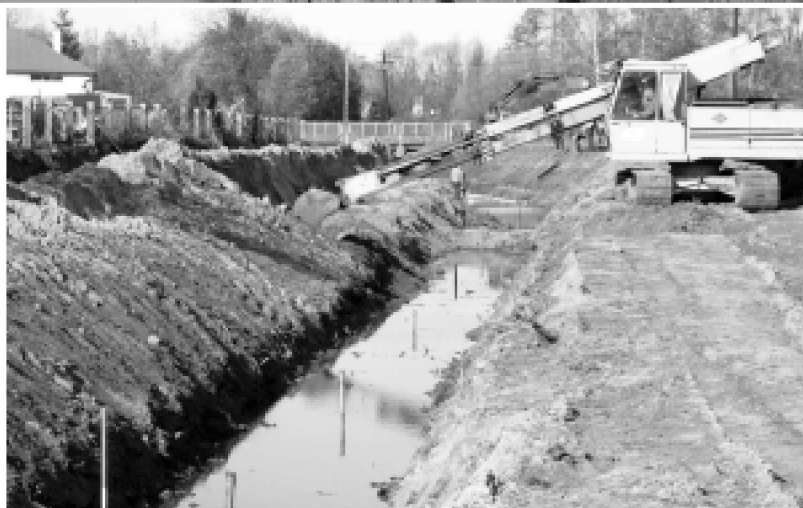
Tak wyglądają prace przy regulacji rzeki w okolicach cmentarza parafialnego w Kolbuszowej.