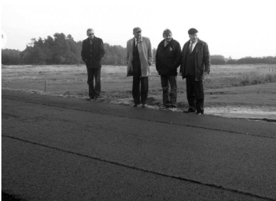
Nowa nawierzchnia asfaltowa na drodze Zielonka – Korczowiska w miejscowości Turka.

Łączny koszt przedsięwzięcia wyniósł ponad 626 tys. zł, w tym dotacja z Ministerstwa Spraw Wewnętrznych i Administracji 400 tys. zł.