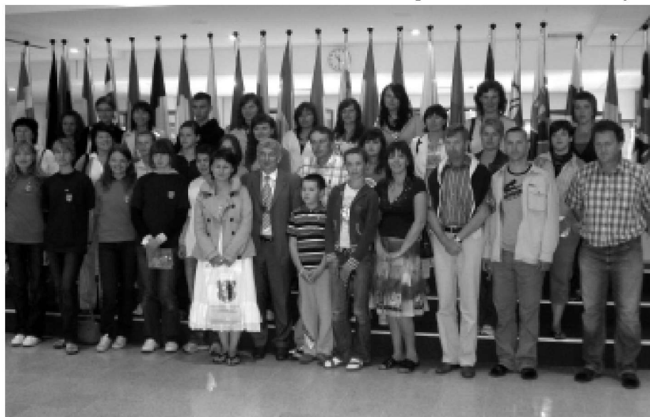
Kolbuszowianie w drodze do Ploërmel zwiedzają Parlament Unii Europejskiej w Brukseli

Wszystkie zaprzyjaźnione szkoły partnerskie znajdują się na terenie miasta Ploërmel. Dało to początek czemuś, co było bardzo ekscytujące - spotkaniu z rówieśnikami obcej narodowości, zerknięciem się z językiem obcym, w którym trzeba było się porozumieć. Nastąpiła intensywna wymiana grup uczniowskich. Bardzo interesujące i cieszące się powodzeniem były praktyki zawodowe, szczególnie z Zespołu Szkół Rolniczych w Weryni, u farmerów bretońskich. Były to, moim zdaniem, najlepsze lekcje poglądowe, umożliwiające poznanie wysokiej jakości rolnictwa francuskiego oraz wymianę opinii na ten temat. Grupy młodzieżowe, przyjeżdżające do Kolbuszowej w ramach naszej działalności, były zapoznawane z naszym krajem, regionem i miastem. Goszczeni w rodzinach poznawali życie codzienne polskiej rodziny, nawiązywały się przyjaźnie. Bardzo dużym wkładem pracy w tej dziedzinie wykazali się nauczyciele. Doszliśmy do przekonania, że ucząc języków obcych, powinniśmy również przekazywać uczniom ogólną wiedzę o kraju, którego języka się uczą. Dlatego w 1995r. zorganizowaliśmy pierwszy konkurs wiedzy o Francji, a w szczególności o Bretanii, gdzie znajduje się Ploërmel. W latach 1995-2008 do konkursu przystąpiło 657 uczniów, uczących się języka fran