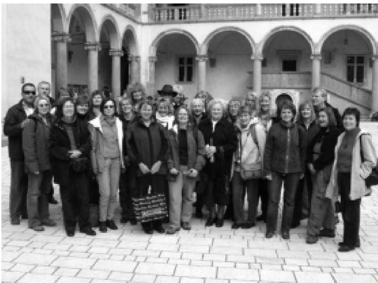
Chór Gospel z Apensen zwiedza Kraków

Bardzo ważnym wydarzeniem było zorganizowanie w 2003 roku Eurofestynu, w czasie którego odbyła się debata pomiędzy uczniami kolbuszowskich szkół średnich, a uczniami francuskimi i niemieckimi. Tematem debaty było „Być obywatelem Europy jutra”. Dużą aktywnością w tym względzie wykazali