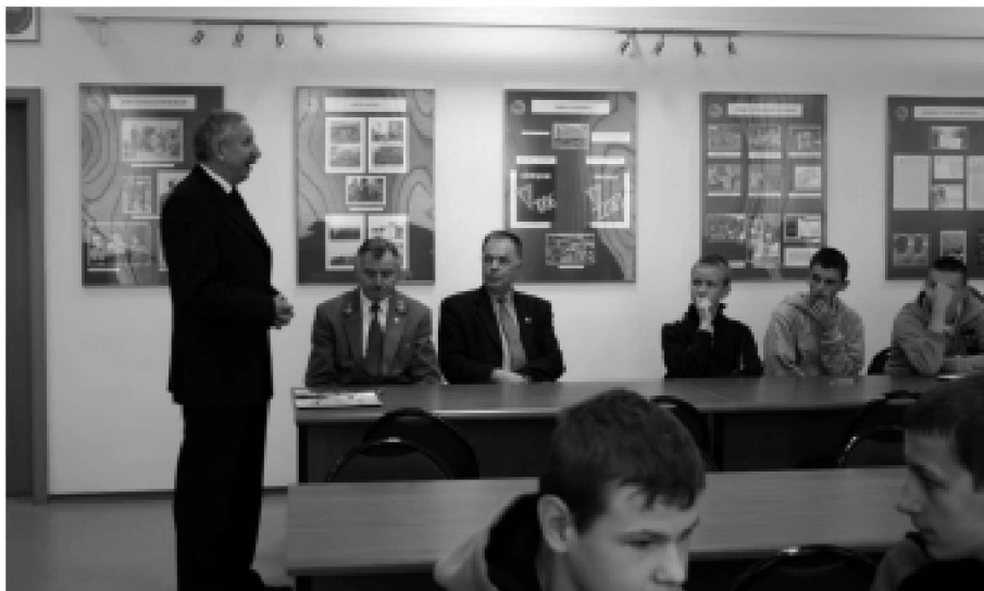
Uroczyste otwarcie III Powiatowego Konkursu Wiedzy o Ochronie Przyrody

Wszystkim uczestnikom i nagrodzonym gratuluję wiedzy, życząc dalszych sukcesów w jej pogłębianiu.