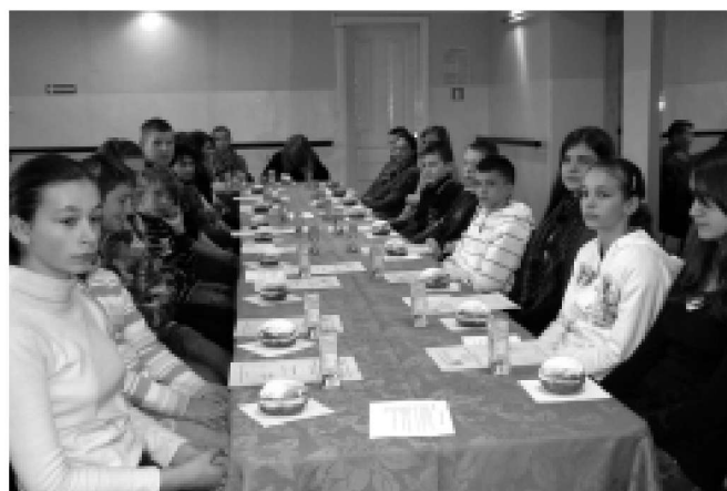
Kadencja młodzieżowej Rady trwa 2 lata. Rajcy spotykają się na obradach w ciągu roku 4 razy.