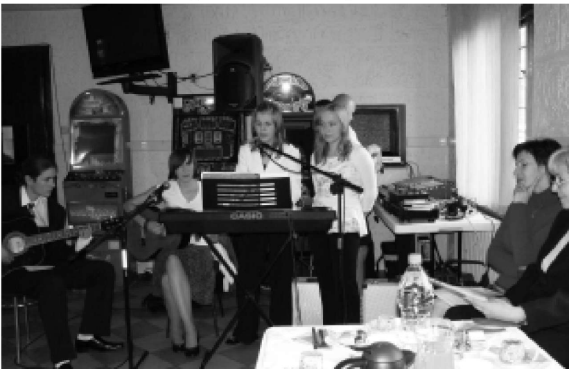
Wieczór na cześć seniorów uświetnił montaż słowno - muzyczny w wykonaniu uczniów Gimnazjum nr 1.

Kolbuszowski Związek Emerytów jest bardzo aktywny. Świadczą o tym nie tylko organizowane systematycznie spotkania i wspólne wyjazdy, ale również ciekawe inicjatywy. Do jednej z ostatnich należy uruchomienie Uniwersytetu Trzeciego Wieku przy Miejskiej i Powiatowej Bibliotece Publicznej w Kolbuszowej. Studia dla seniorów będą skupione na nauce obsługi komputera, surfowania po Internecie, a także poznawania języków obcych. Podczas wykładów na pewno nie zabraknie spotkań z ciekawymi ludźmi.