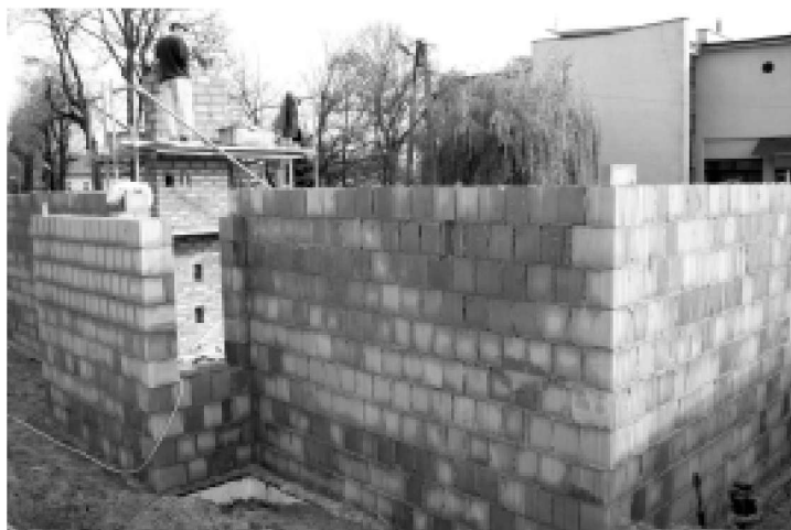
Na czas budowy nowego WC można korzystać z zastępczych toalet ustawionych na ul. Parkowej.

Przetarg na wykonanie prac wygrała jedna z kolbuszowskich firm budowlanych. Obecnie miejsce budowy jest ogrodzone. Po starych szaletach pozostały jedynie fundamenty. Kolejnym etapem prac będzie posadowienie i konstrukcja ścian nadziemna oraz konstrukcja dachu i pokrycie. Liczący 350 m 3 obiekt będzie miał ponad 74 m 2 powierzchni użytkowej. Z budżetu gminy, na budowę miejskiego WC, przeznaczone zostanie ok. 340 tysięcy złotych.