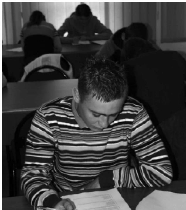
Uczestnik konkursu podczas rozwiązywania testu