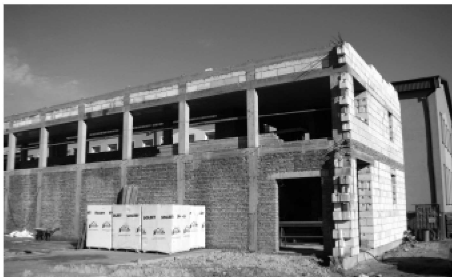
Nowy budynek sali gimnastycznej w Kolbuszowej Górnej.

Budowa obiektu rozpoczęła się w lipcu br., inwestycja ma kosztować ponad 2 mln 300 tys. Zł. Do tej pory z budżetu gminy, na realizację tej inwestycji, wydatkowano już blisko milion złotych. Gmina Kolbuszowa stara się o uzyskanie wsparcia finansowego na ten cel z Regionalnego Programu Operacyjnego Województwa Podkarpackiego. Wniosek, opiewający na kwotę około półtora miliona złotych, trafił już do Urzędu Marszałkowskiego. Czy uda się uzyskać część dofinansowania na realizację inwestycji, dowiemy się prawdopodobnie w połowie przyszłego roku. Niezależnie