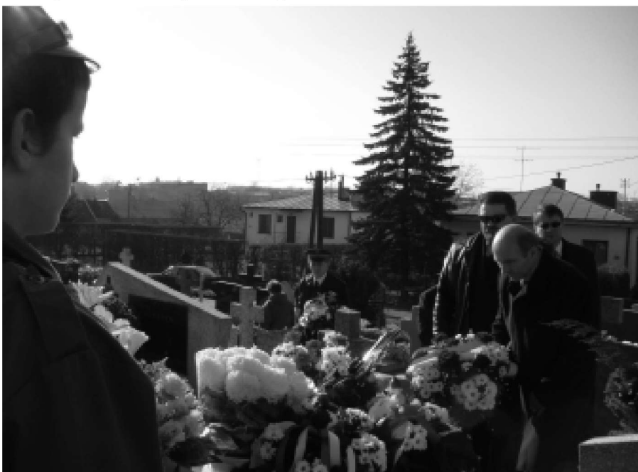
Uroczyste złożenie kwiatów.