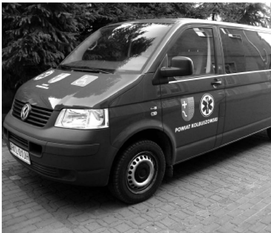
Zakupiony samochód przystosowany do przewozu osób niepełnosprawnych z Oddziału Dializoterapii i Nefrologii SP ZOZ w Kolbuszowej.