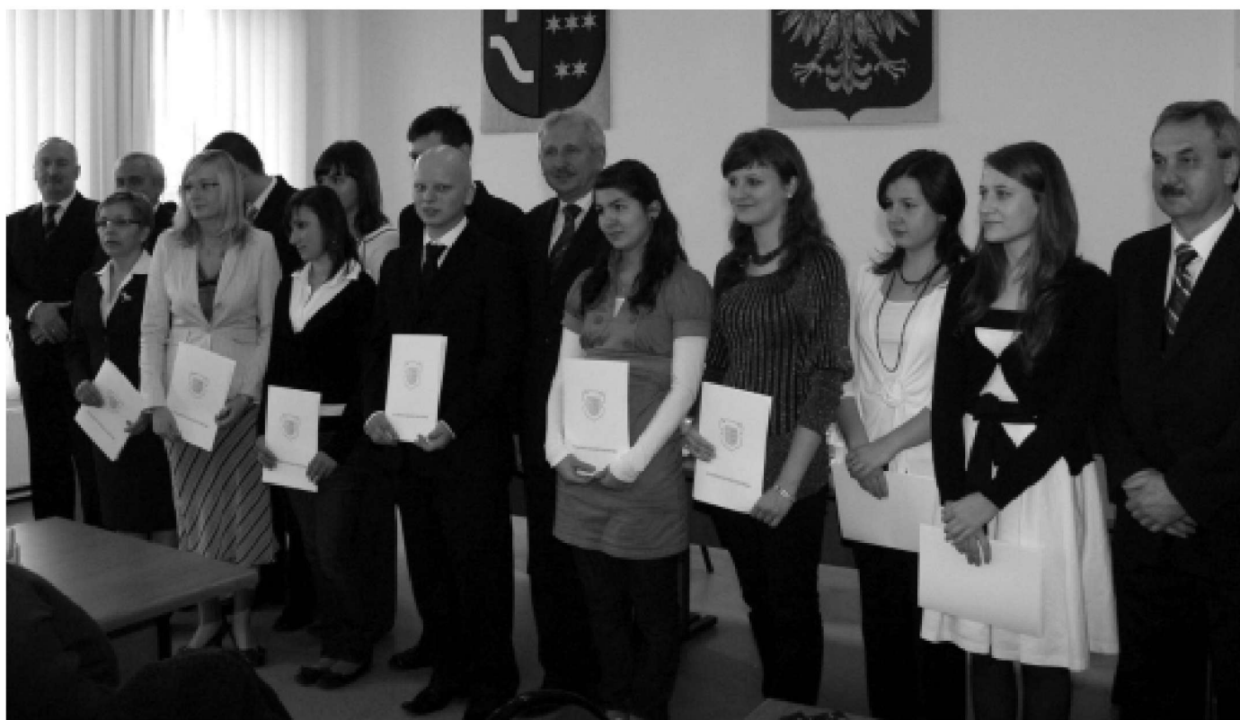
Stypendyści Starosty Kolbuszowskiego.