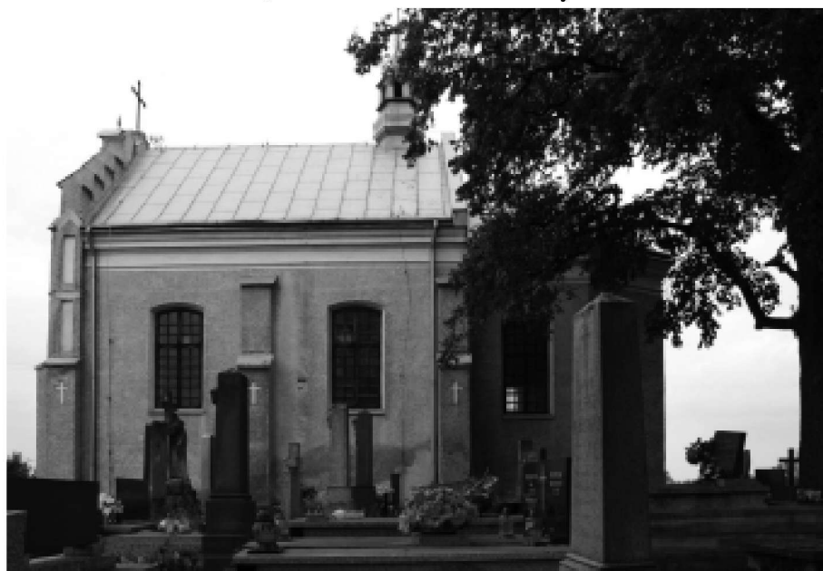
Kolbuszowski cmentarz.

Teksty, należące do klasyki literatury narodowej, pojawiają się dość często w treści inskrypcji nagrobnych. Na