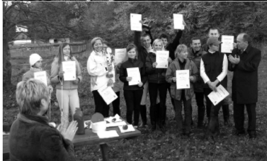
S. T. Jedne z przyjemniejszych momentów: dekoracja zwycięzców i pamiątkowe fotografie.