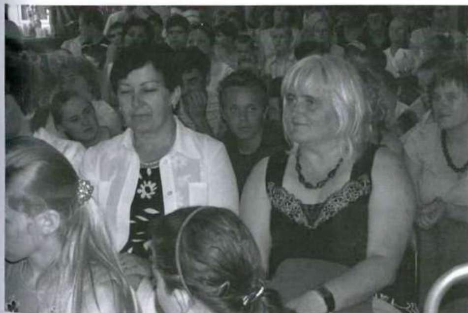
Zaproszeni goście z uwagą przyglądali się występom