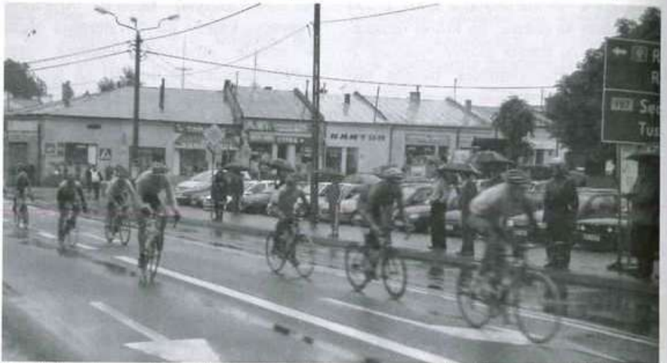
Ze względu na złe warunki atmosferyczne trasa wyścigu na 3 etapie została skrócona o prawie 9 kilometrów