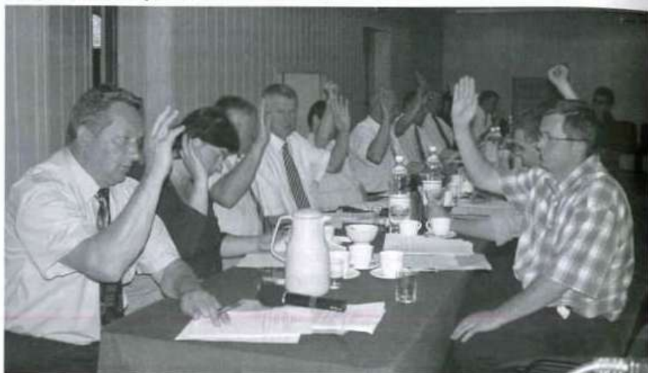
Radni jednogłośnie wyrazili zgodę na podpisanie porozumienia z powiatem kolbuszowskim w sprawie utworzenia obszaru przemysłowego