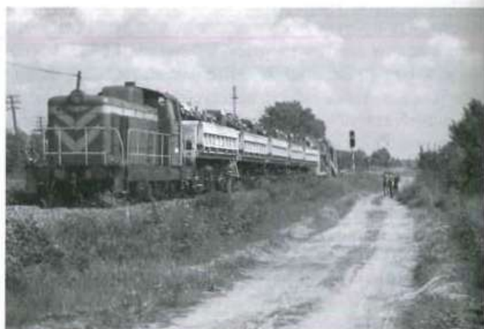
Oczyszczarka tłucznia w torze OT 400 ze składem do transportu odsiewek PTO 200 i lokomotywą SM42

W dniach 11 i 12 czerwca do Kolbuszowej dotarły pociągi gospodarcze złożone z maszyn i wagonów mieszkalnych, a 13 czerwca rozpoczęły się pierwsze roboty tuż za stacją, w kierunku Tarnobrzega, polegające na oczyszczaniu podsypki tłucz-