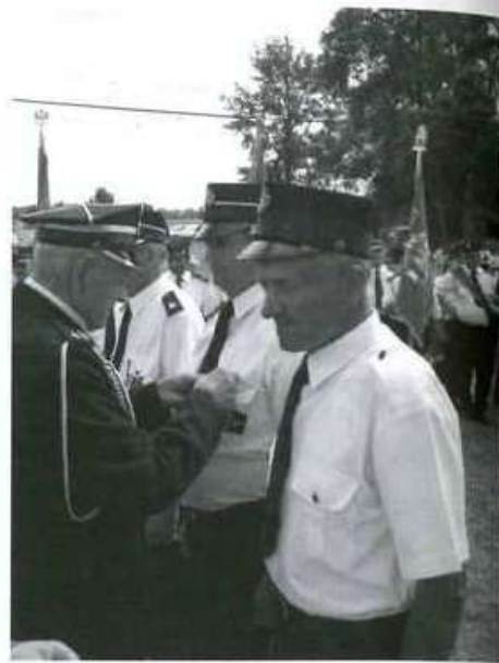
W trakcie uroczystości wręczono medale i odznaki „Za zasługi dla Pożarnictwa” oraz „Za wysługę lat”

Późnym wieczorem mieszkańcy Domatkowa rozpoczęli zabawę taneczną, która trwała do białego rana.