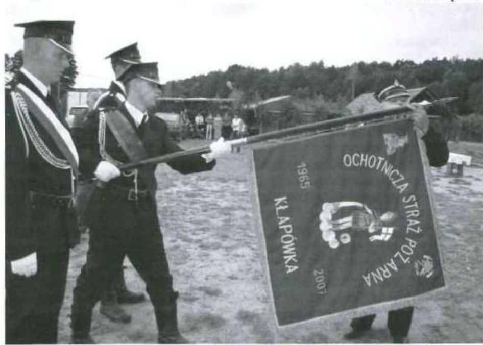
Do sztandaru przypięto brązowy medal „Za zasługi dla pożarnictwa”

W uroczystości wręczenia sztandaru udział wzięli kolbuszowscy parlamentarzyści, władze gminy oraz powiatu, a także szefowie instytucji, stowarzyszeń i przedsiębiorcy. SYLWIA TĘCZA