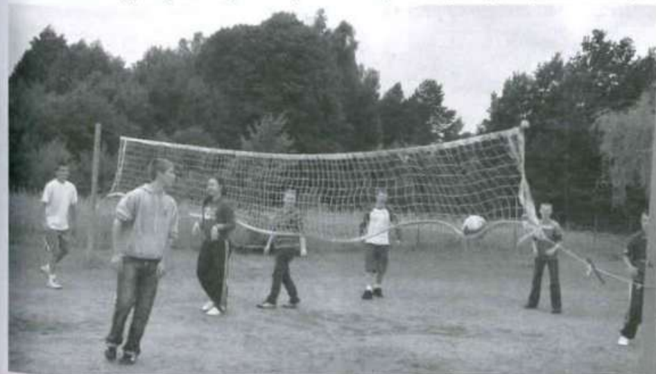
Uczestnicy biwaku (na zdjęciu wychowankowie z Gimnazjum nr 1) potwierdzają, że na biwaku nie ma nudy

Kilka dni wypoczynku kosztuje każdego z uczestników tylko 10 złotych. Do biwaku co roku dołącza się gmina Kolbuszowa. SYLWIA TĘCZA