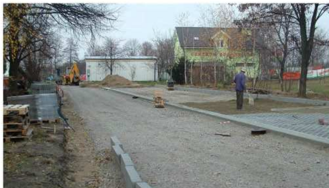
Budowa miejsc postojowych i wewnętrznej drogi dojazdowej na ul. Ruczki

Aktualnie przebudowywane jest skrzyżowanie ulic Obrońców Pokoju i Św. Brata Alberta w Kolbuszowej. Przebudowa tego skrzyżowania ułatwi dojazd do kościoła i zminimalizuje zakorkowanie samochodów w tej części miasta. Ponadto usprawni dojazd do przygotowywanych tutaj terenów inwestycyjnych, o powierzchni ponad 130 ha, z przeznaczeniem pod budownictwo jednorodzinne, cele handlowo-usługowe oraz obiekty rekreacyjno-sportowe. Realizacja inwestycji to koszt rzędu 300 tys. zł.