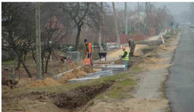
Budowa chodnika przy ul. Mieleckiej w Kolbuszowej Dolnej

Tegoroczna jesienna aura sprzyja pracom remontowym i budowlanym. W Kolbuszowej nieustannie realizowane są zadania własne gminy z zakresu inwestycji drogowych.