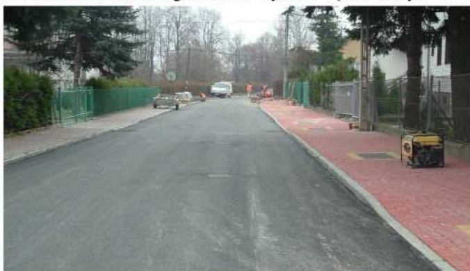
Przebudowa ul. Zielonej wraz z chodnikiem