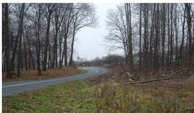
Wycinka drzew pod budowę chodnika w Weryni