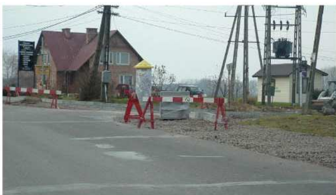
Przebudowa skrzyżowania ulicy Św. Brata Alberta i Obr. Pokoju

Jeszcze w tym miesiącu zakończone zostaną prace przy przebudowie 400 m ulicy Zielonej, wraz z chodnikiem, a także prace na drodze w Świerzowie, gdzie na długości 320 m ułożono nawierzchnię asfaltową i wykonano odwodnienie. Ponadto realizowana jest budowa 230 m chodnika przy ulicy Mieleckiej w Kolbuszowej Dolnej, jak również rozpoczęto budowę 300 m chodnika przy drodze do Weryni.