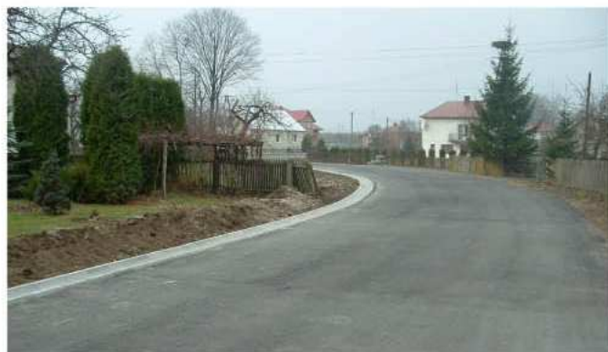
Przebudowa drogi w Świerzowie wraz z odwodnieniem

Gmina rozpoczęła także prace przy przebudowie drogi gminnej Zarebki – Dubas – Werynia. Za kwotę 580 tys. zł położone będzie 1,1 km nawierzchni asfaltowej oraz zostaną uporządkowane pobocza. Zakończono procedurę przetargową budowy drogi osiedlowej do bloków byłego POM-u. W najbliższym czasie, na długości 120 m, położona zostanie nawierzchnia asfaltowa. Koszt tego zadania wynosić będzie 66 tys. zł. W