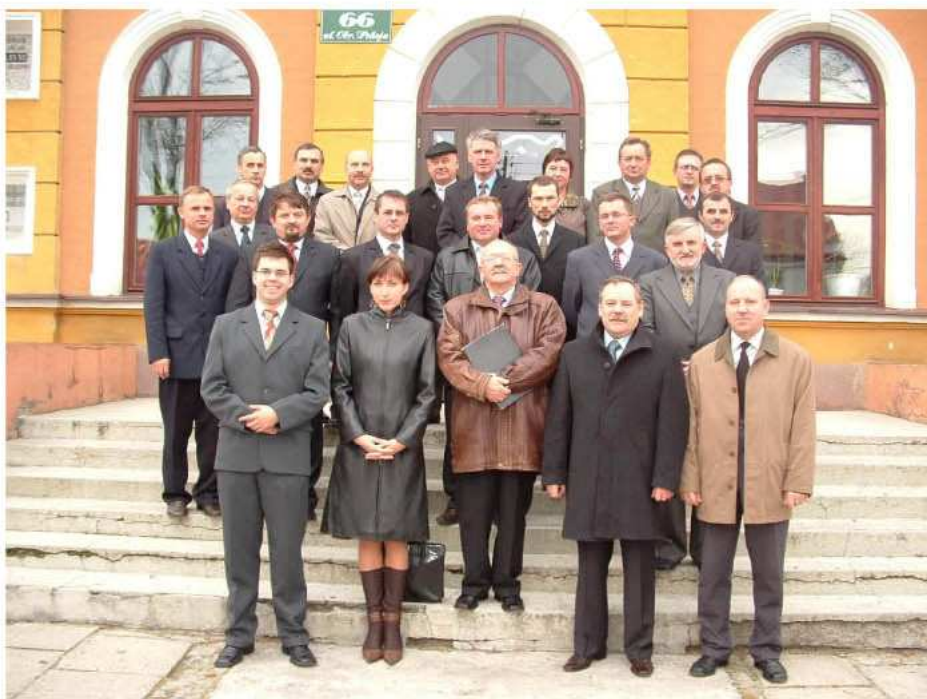
Radni V kadencji Rady Miejskiej