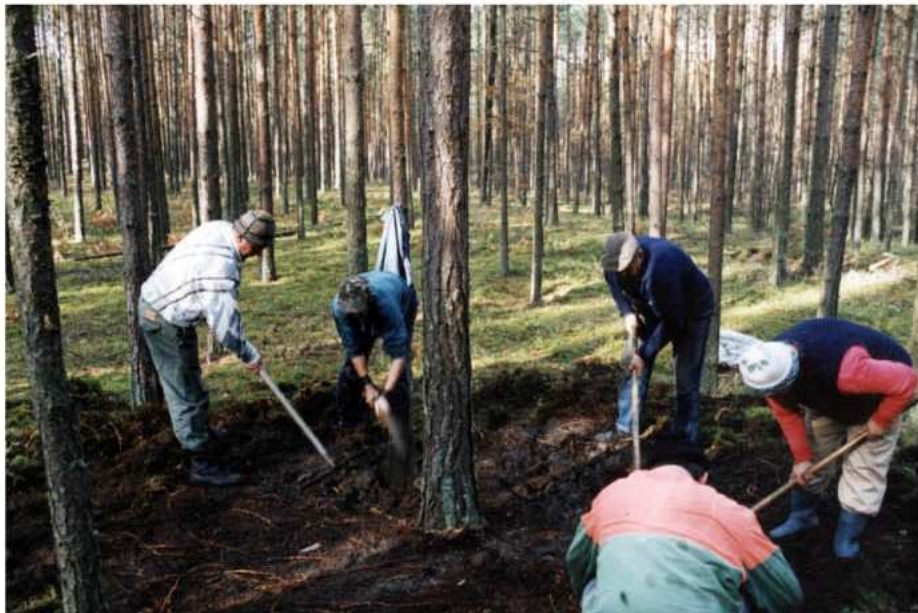
Jesienne poszukiwania szkodników sosny

Na terenie Nadleśnictwa Kolbuszowa jesienne poszukiwania szkodników sosny wykonano na ponad 250 powierzchniach kontrolnych. W małych pudełeczkach znalazły się najczęściej poczwarki i larwy wielu szkodników leśnych. Występowanie pożytecznych owadów przede wszystkim biegaczy odnotowano, a okazy ponownie wypuszczono do ściółki leśnej. Na podstawie liczebności zebranych owadów, w przyszłym roku nie przewiduje się wystąpienia zagrożenia ze strony liściożernych szkodników drzew leśnych na naszym terenie.