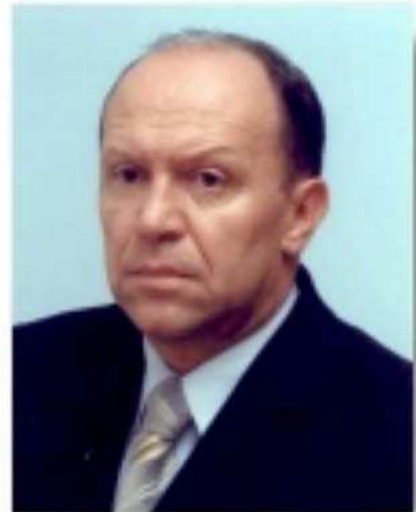
Posel na Sejm RP Zbigniew Chmielowiec

- Na zwrot podatku VAT za materiały budowlane będziemy czekać krócej. Nowela ustawy o zwrocie osobom fizycznym niektórych wydatków związanych z budownictwem mieszkaniowym, którą przyjął Sejm, ma uprościć procedury składania wniosków w urzędach skarbowych. Nowela zakłada, że osoby fizyczne budujące dom we własnym zakresie i remontujące mieszkania, mogą ubiegać się o zwrot części VAT za materiały budowlane.