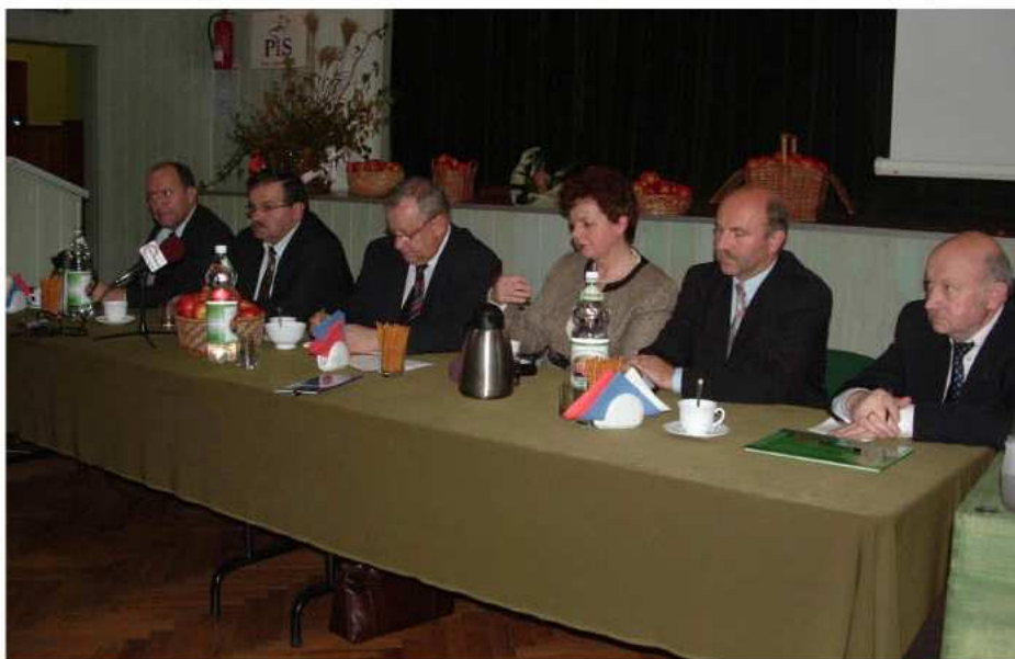
Goście spotkania od lewej: Poseł Z. Chmielowiec, Poseł S. Ożóg, Wiceminister Zdrowia Bolesław Piecha, Wojewoda Podkarpacki E. Draus, Burmistrz Kolbuszowej J. Zuba, Senator M. Maziarz

Spotkanie poprowadził poseł Zbigniew Chmielowiec, który serdecznie przywitał wszystkich zgromadzonych. Następnie głos zabrał Wiceminister Zdrowia Bolesław Piecha. Swoje wystąpienie rozpoczął od nakreślenia sytuacji w polskiej służbie zdrowia, kosztów utrzymania placówek szpitalnych i przychodni, a także współpracy z Narodowym Funduszem Zdrowia. Minister skupił się na przedstawieniu jednego z najważniejszych elementów służby zdrowia - ratownictwa medycznego. Poinformował, że środki wydatkowane na ten cel to 1.200.000.000 zł (karetki pogotowia z odpowiednią aparaturą, wyposażenie szpitali w sprzęt medyczny, system powiadamiania). Odwołując się do artykułu 67 Konstytucji, który stanowi o zabezpieczeniu społecznym w razie niezdolności do pracy, Minister Piecha przedstawił plany wprowadzenia początkiem 2007 roku tzw. koszyka świad-