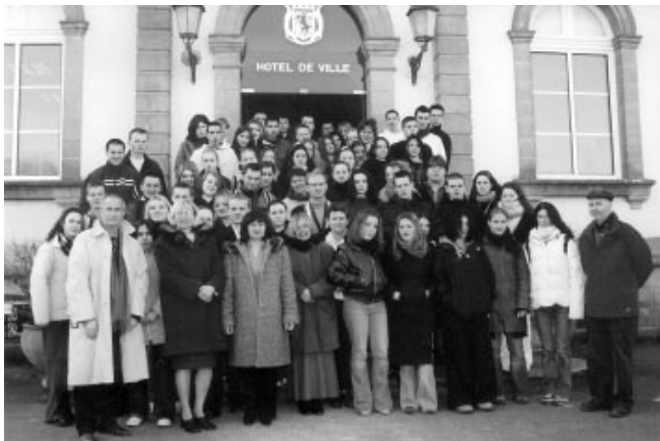
Pamiątkowe zdjęcie po wizycie u mera Ploërmel.