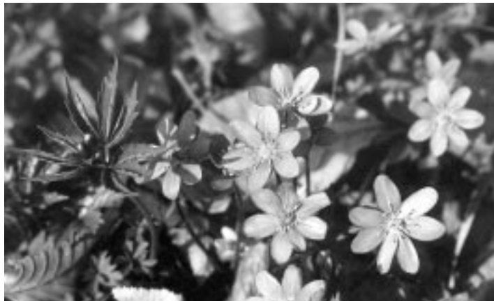
Takie piękne kwiaty są niszczone przez ogień

Proceder ten przynosi zwykle bardzo duże straty, a znikome korzyści. Najczęściej kończy się niestety pożarem położonego w sąsiedztwie lasu.