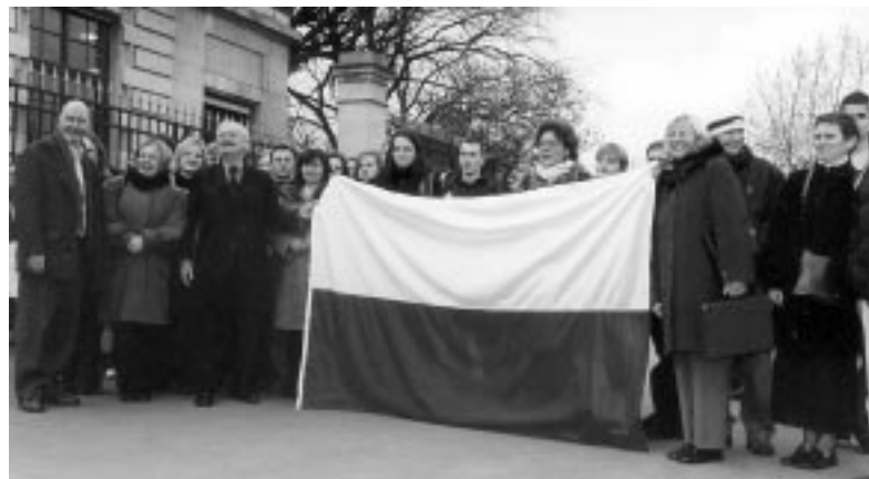
Polska flaga przed Zgromadzeniem Narodowym w Paryżu.

UCZNIOWIE ZESPOŁU SZKÓŁ TECHNICZNYCH WRAZ Z OPIEKUNAMI