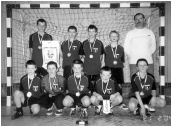
„Srebrni medaliści turnieju – UKS dwójka Kolbuszowa.