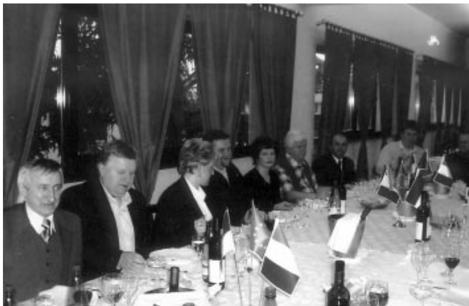
Dobrej atmosferze spotkań sprzyjała włoska gościnność i doskonała kuchnia.