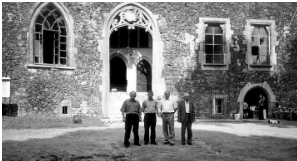
Autor - pierwszy z lewej - przed zamkiem w Grodźcu.