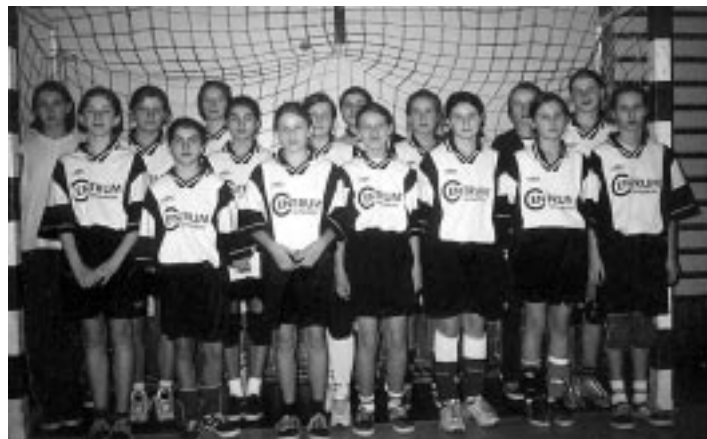
„Juniorki młodsze UKS Olszynka Dzikowiec na turnieju w Kielcach”

UKS „Olszynka” startuje w wojewódzkich rozgrywkach piłki ręcznej. Juniorki młodsze zakończyły rozgrywki zdobywając wicemistrzostwo województwa, a tym samym awans do ćwierćfinałów Polski. Młodziczki zaś po dwóch turniejach zdobyły komplet punktów.