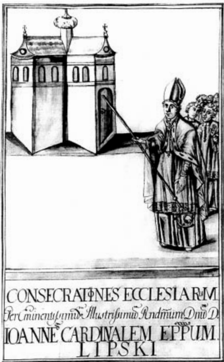
Konsekracja kościoła w rycie przedsoborowym wg ilustracji z XVIII w.