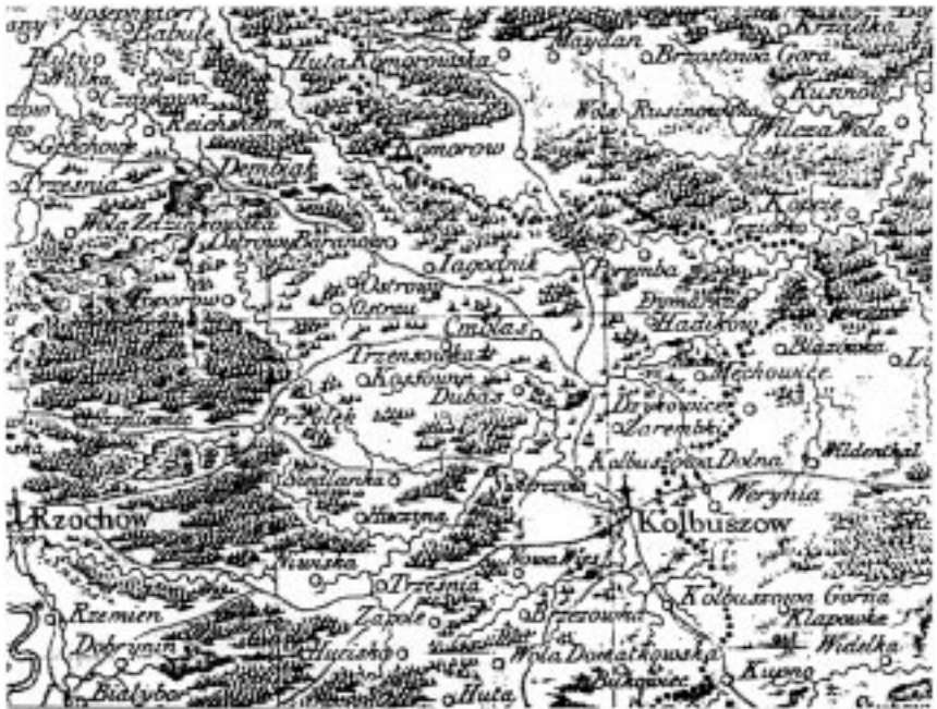
Terytorium parafii Ostrowy wg mapy J. Liesganiga "Regna Galiciae et Lodomerie" w skali 1:288 000, ark. XIV.