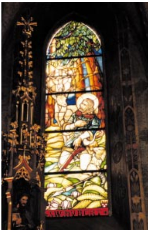
Witraże w prezbiterium