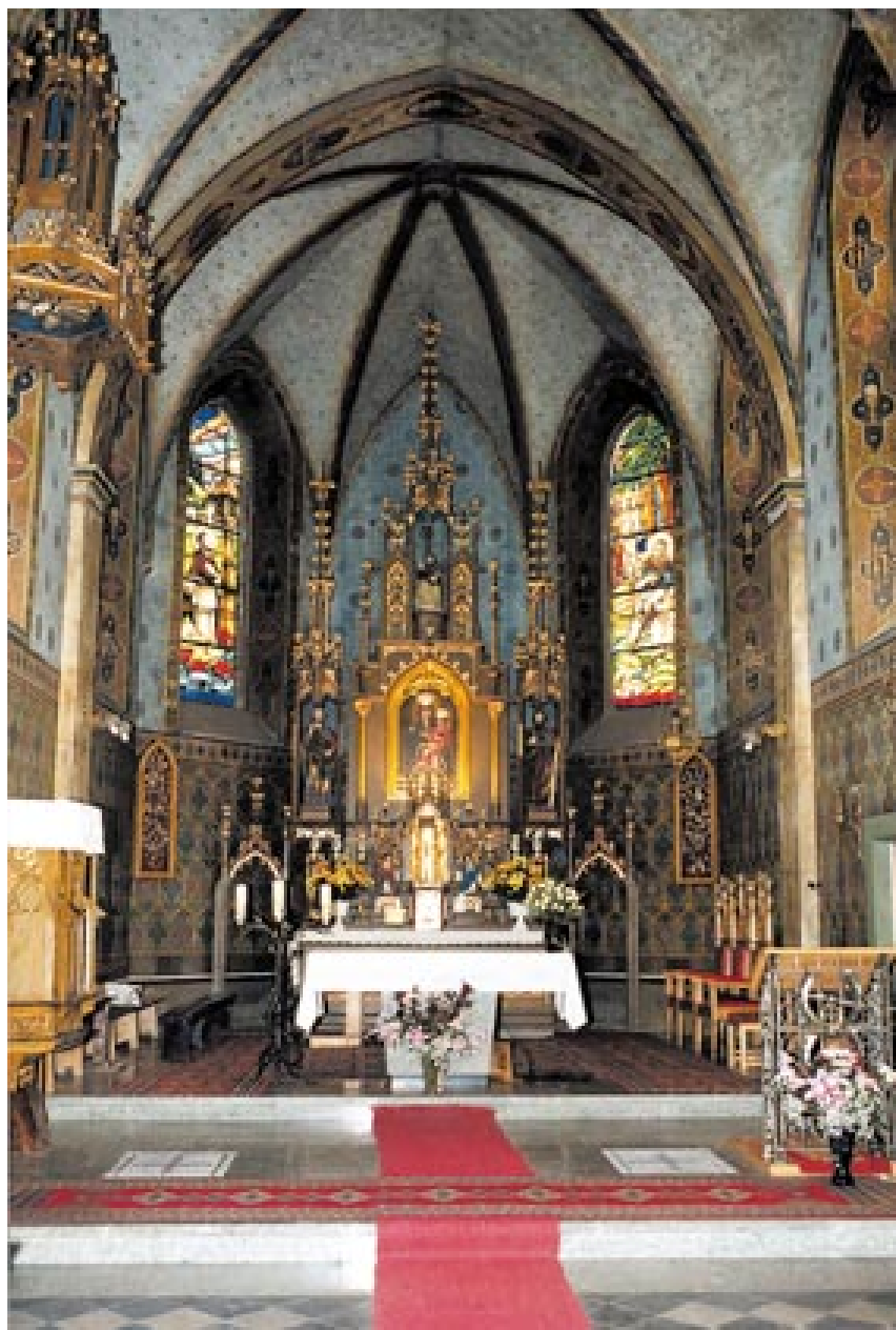
Prezbiterium z ołtarzem głównym.