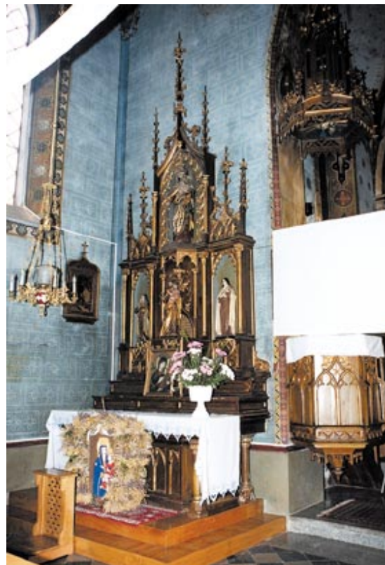
Ołtarze boczne.