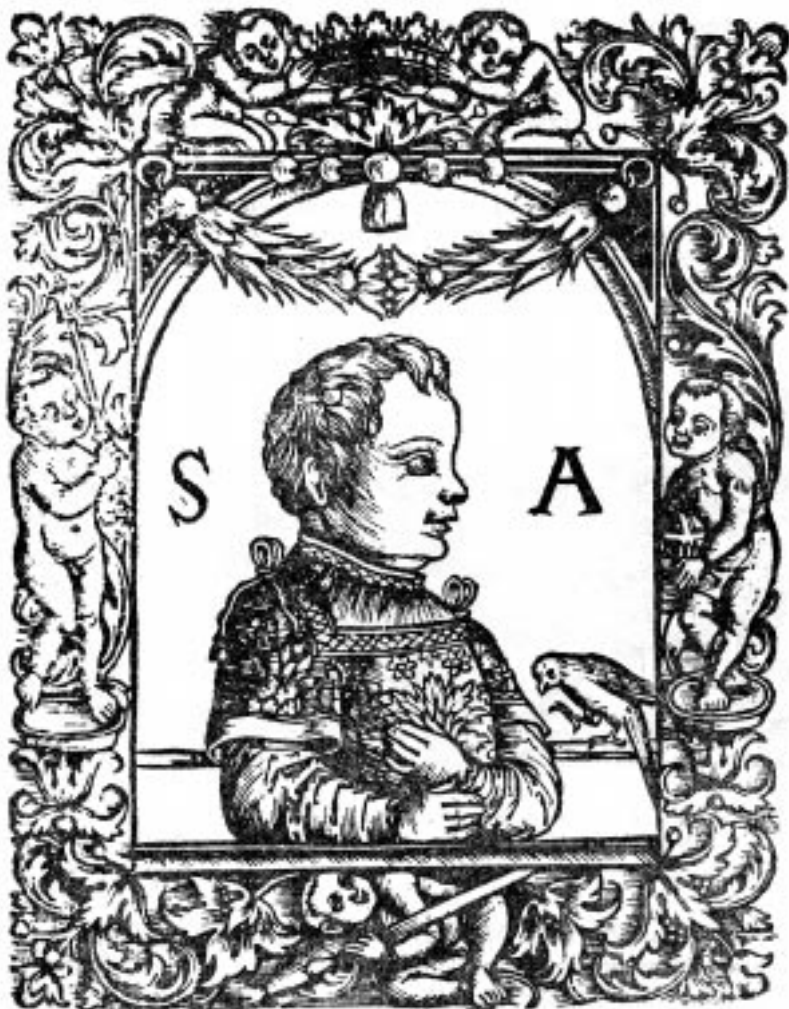
Król Zygmunt August jako dziecko. Drzeworyt z epoki.