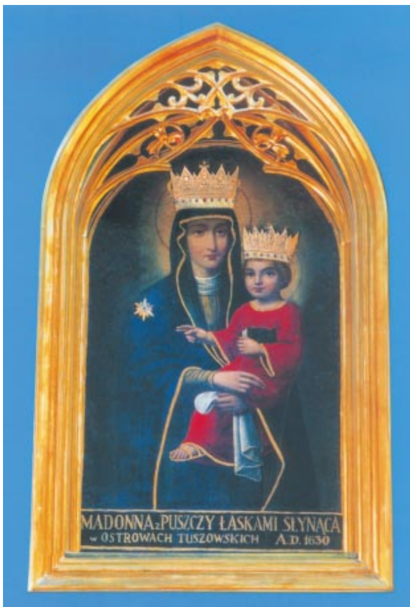
Łaskami słynący wizerunek Madonny z Puszczy.