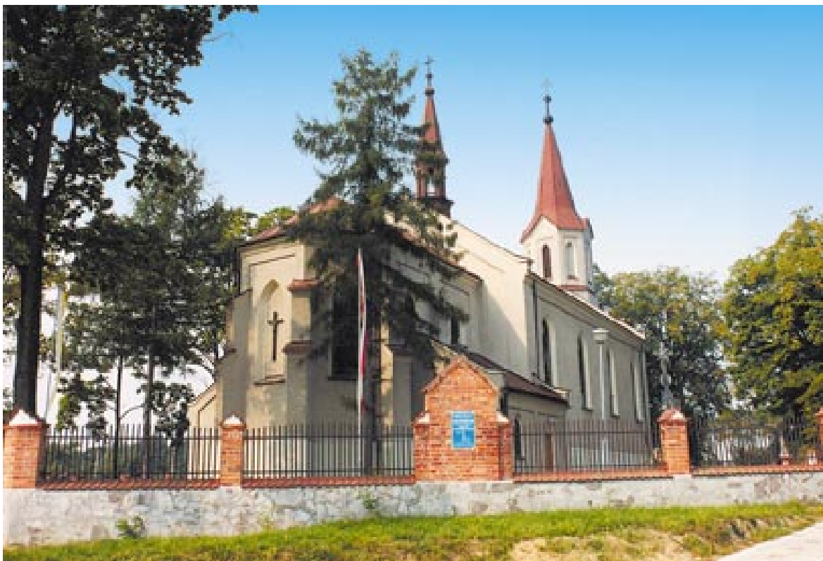
Kościół parafialny w Ostrowach Tuszowskich (stan obecny).