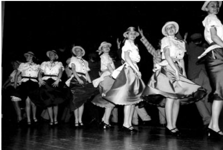
W brawurowym tańcu zespół EKROL z Łańcuta. MDK, 1 maja 2003 r.