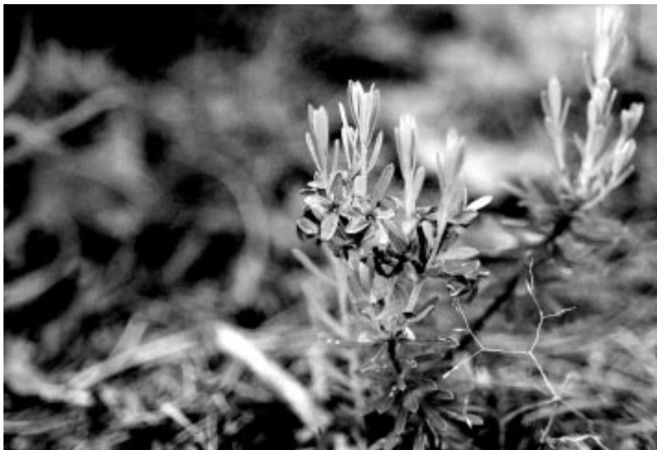
Wawrzynek główkowy w zachowawczym zbiorze genów w Sycowie

pozawczy lub zachowawczy. W pierwszym przypadku, wykorzystując urozmaicenie warunków naturalnych występujących na terenie parku etnograficznego, należałoby wprowadzić gatunki chronione, które można nabyć w ogrodach botanicznych lub placówkach naukowych. Natomiast w drugim przypadku po uzyskaniu odpowiedniej zgody pozyskać na naturalnych stanowiskach części roślin, rozmno-