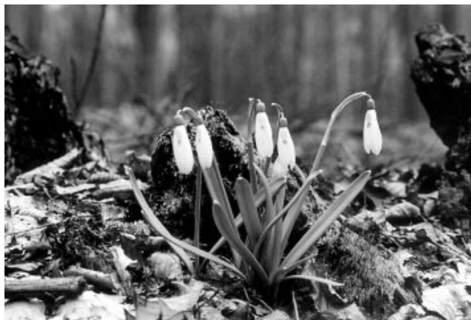
W takim zbiorze na pewno powinna znaleźć się śnieżyczka przebiśnieg.