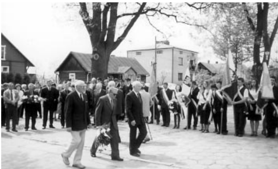
W rocznicę Konstytucji 3 Maja - kwiaty składają kombatanci AK.

Podczas tegorocznych obchodów Dni Kolbuszowej nie mogło brakować akcentów nawiązujących do idei jednoczenia się Europy. Na szczęście nie uczyniono z nich jedynie przedmiotów dysput, toczących się w wąskim kręgu najbardziej zainteresowanych. W Kolbuszowej zasady integracji w pełni wcielono w życie, zapraszając do miasta delegacje z Francji, Niemiec i Irlandii.