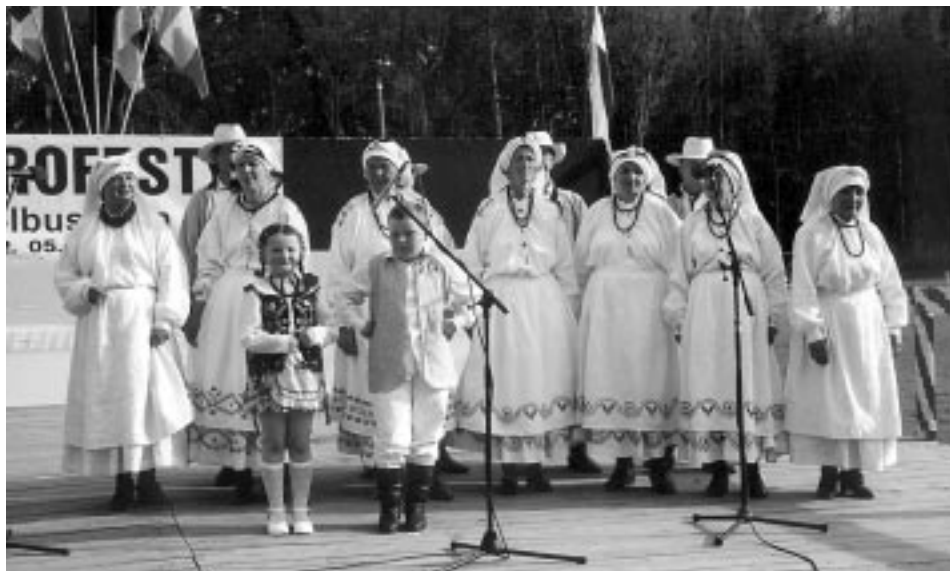
Nasza tradycja, czyli "Górnicy". Stadion, 2 maja 2003 r.

Miłośnicy sportu próbowali swoich sił w piłce nożnej, tenisie stołowym, szachach i brydżu sportowym, zaś najsilniejsi panowie stanęli do walki o tytuł „Siłacza kolbuszowszczyzny”.