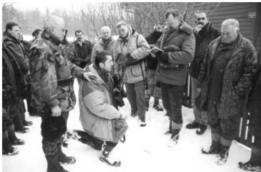
Ślubowanie młodego myśliwego

W wigilię Bożego Narodzenia myśliwi większości kół łowieckich spotkali się na tradycyjnych polowaniach.