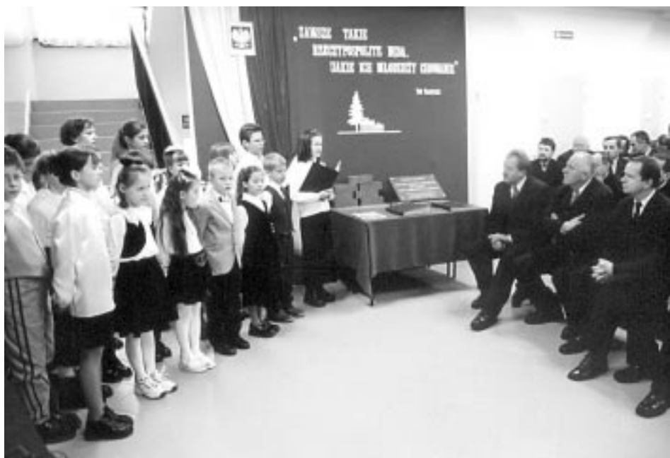
Część artystyczna w wykonaniu dzieci z mazurskiej szkoły.