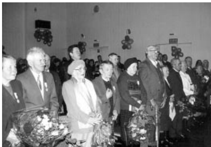
"Złote" pary małżeńskie