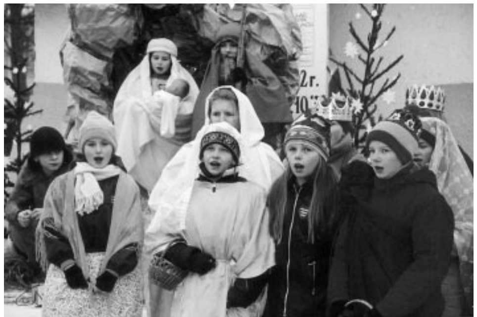
Przedstawienie "Jasełek" przez dzieci SP w Przedborzu.