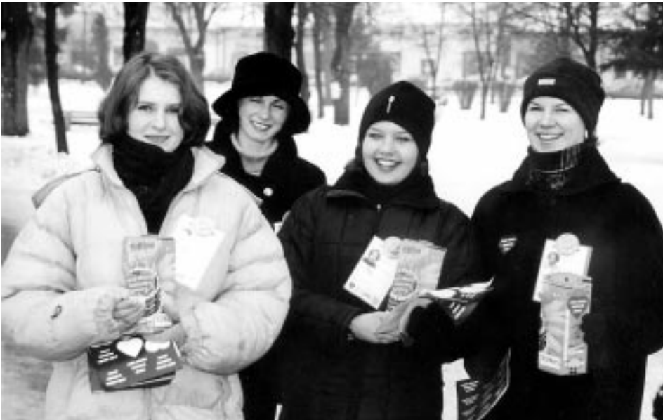
Wolontariuszki na rynku w Kolbuszowej.

W Kolbuszowej po raz pierwszy zagrała Wielka Orkiestra Świątecznej Pomocy, której sztab powstał przy Powiatowym Centrum Kultury. Pieniądze zbierało 27 wolontariuszy z Liceum Ogólnokształcącego.