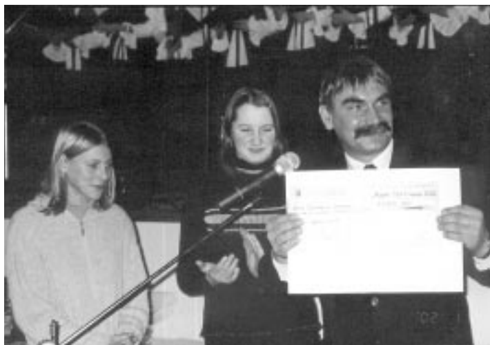
Dla dzieci ze Skopania czek na 1500 zł