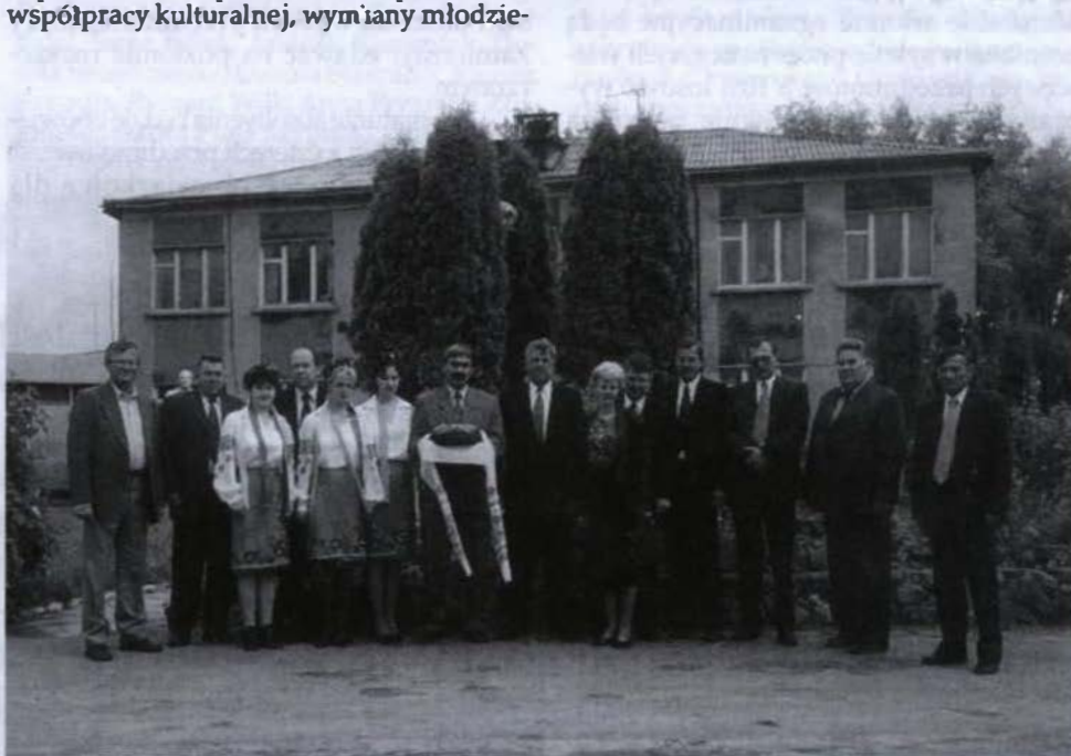
● Delegację z Kolbuszowej powitano chlebem i solą