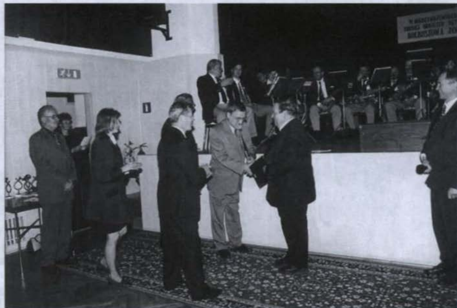
• Gratulacje od przewodniczącego jury...