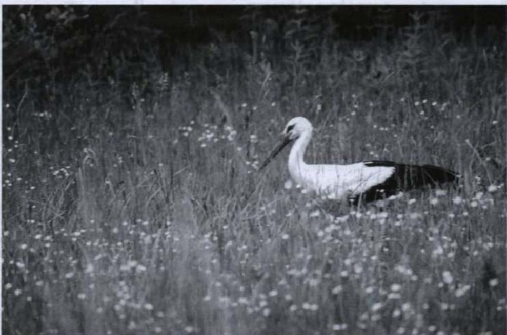
• Bocian biały na stałe wkomponował się w krajobraz polskiej wsi