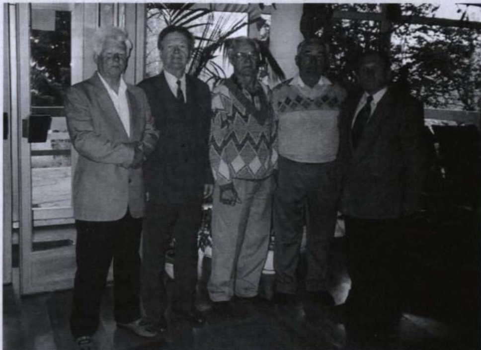
• Wisła: Działacze towarzystw kultury z województwa podkarpackiego.

W czasie zjazdu w Wiśle złożono ofertę, aby następny zjazd towarzystw regionalnych działających na wsi zorganizować w Weryni w 2003 roku. Można byłoby pokazać dorożek naszych towarzystw w dziedzinie kultury i byłaby to także promocja naszej gminy i powiatu kolbuszowskiego.