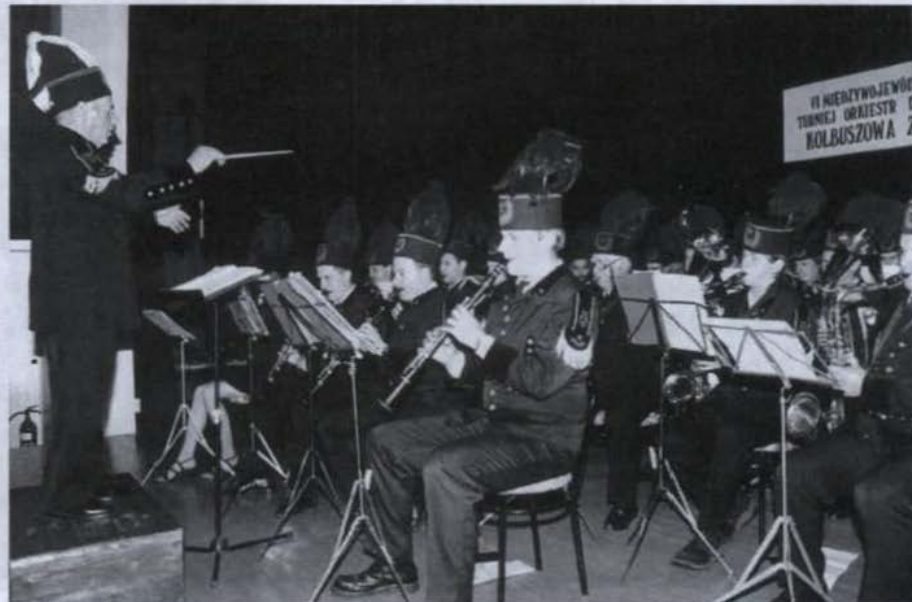
• Na scenie kolbuszowskiego Domu Kultury