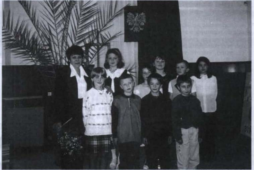
• Uczestnicy „Małej Olimpiady” z organizatorką konkursu