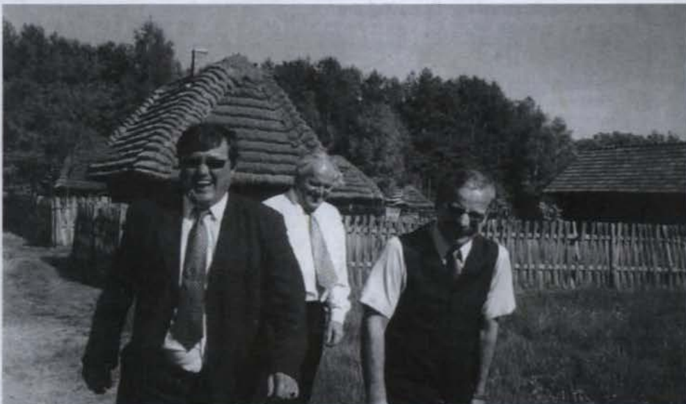
• ... i w Parku Etnograficznym