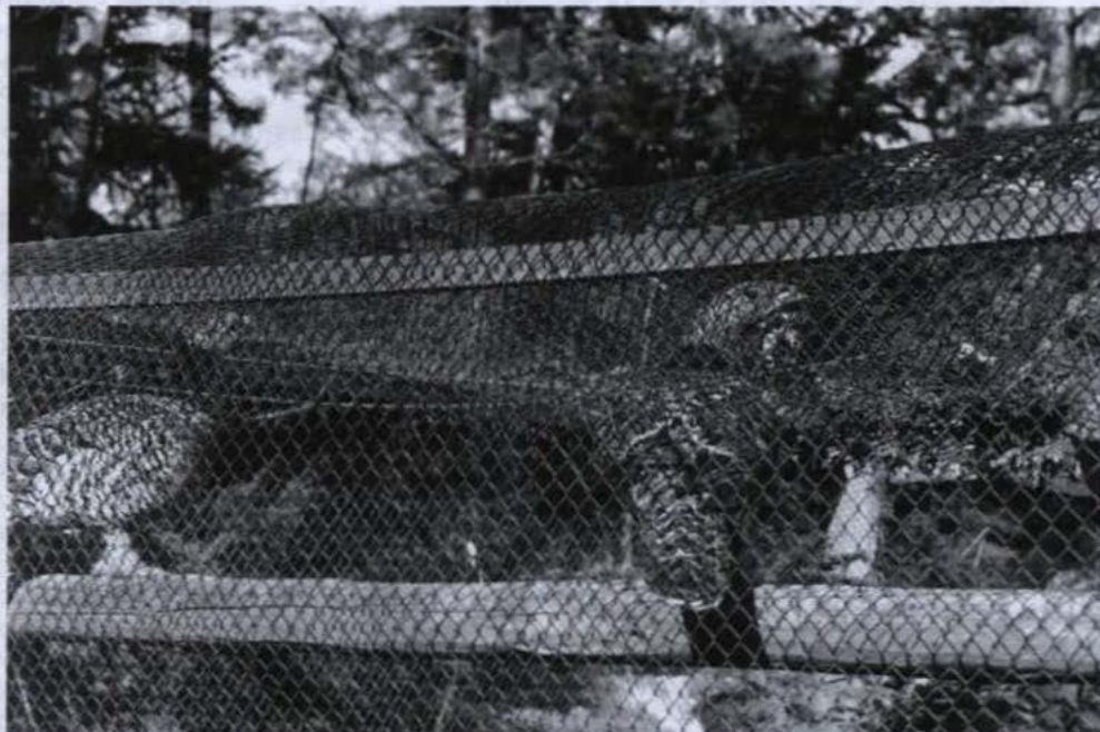
• Głuszcze w zamkniętej hodowli

Do okazałości omawianego terenu należy pięknie ubarwiony ptak - kraska. Gnieździ się najczęściej w obrębie przerzedzonych drzewostanów, w dziuplach wykutych przez dzięcioły czarne. Można je często zobaczyć przesiadujące na drutach telegraficznych. Liczba tych ptaków zamieszkujących tereny południowo-wschodniej Euro-