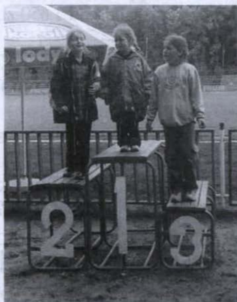
● Poziom zawodów był wyrównany nawet na podium.