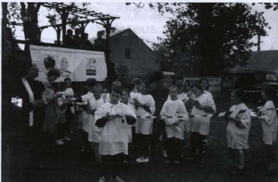
• Uczniowie Szkoły Podstawowej w Cmolasie z laurkami w rękach czekają na kierowców

Uczniowie klas II Szkoły Podstawowej w Cmolasie oraz uczniowie klas III Szkoły Podstawowej w Kolbuszowej Górnej w ciągu trzech ostatnich dni maja, wspólnie z policjantami Sekcji Prewencji i Ruchu Drogowego KPP w Kolbuszowej, uczestniczyli w kontrolach drogowych. Dzieci przygotowały się do akcji bardzo solidnie – samodzielnie wykonały laurki, nauczyły się wierszyków i życzeń dla kierowców. Przedstawiciele Towarzystwa Ubezpieczeń GENERALI zaopatrzyli uczestników w jednakowe koszulki z “logo” akcji oraz naklejki, jabłka i cytryny – przeznaczone dla kierowców.