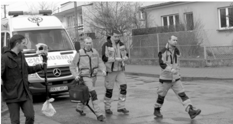
Zachowania służb ratowniczych śledziło oko kamery.