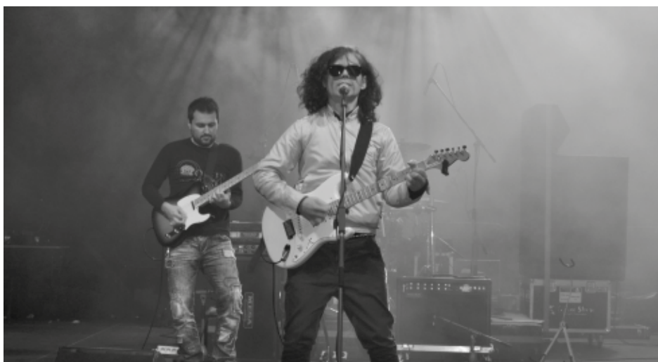
Dni Kolbuszowej zakończył koncert zespołu Chłopcy z Placu Broni