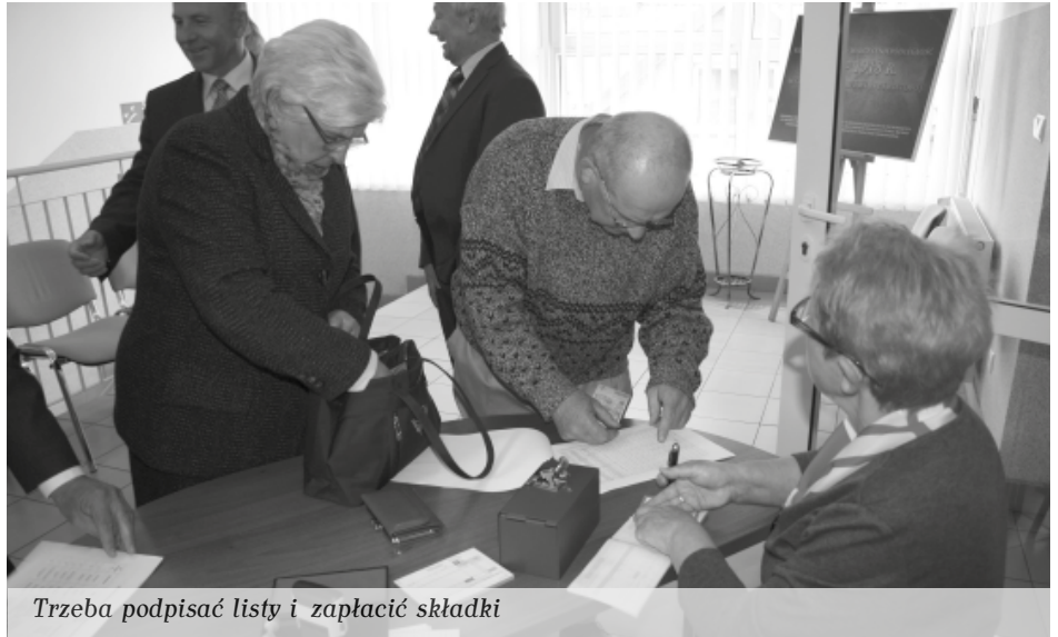
Trzeba podpisać listy i zapłacić składki

Towarzystwo wydawało dwa periodyki: Rocznik Kolbuszowski i Ziemię Kolbuszowską . Zgodnie z uchwałą zarządu Redaktorem Naczelnym Rocznika został