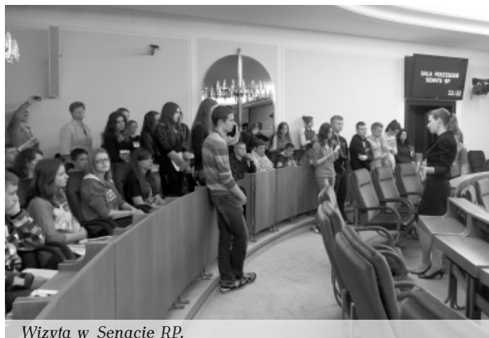
Wizyta w Senacie RP.