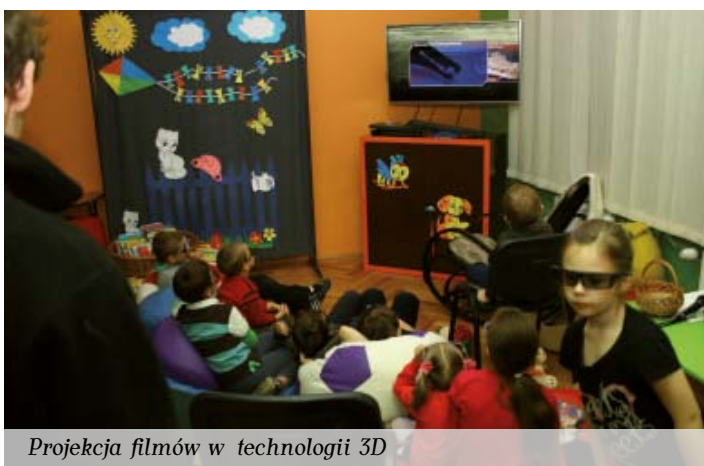
Projekcja filmów w technologii 3D