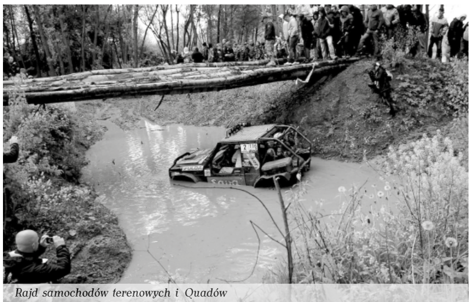
Rajd samochodów terenowych i Quadów

łu, który w trakcie ponad godzinnego koncertu rozgrzewał publiczność swoimi najlepszymi utworami.