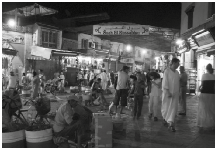
Nocny targ w centrum Marrakeszu