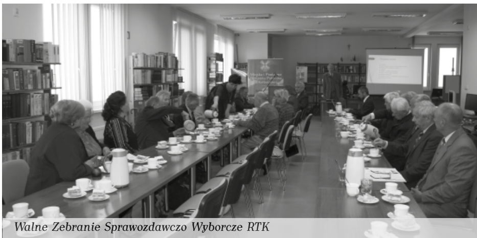
Walne Zebranie Sprawozdawczo Wyborcze RTK