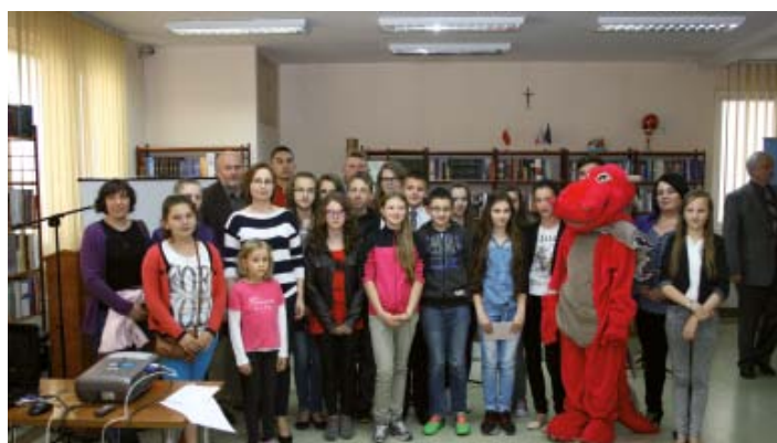
Uczniowie Gimnazjum im. św. Królowej Jadwigi z Widelki pozują do wspólnego zdjęcia z smokiem Nowusiem