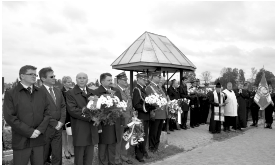
Modlitwa na Cmentarzu i złożenie kwiatów na obelisku strażaków

Gwiazdą wieczoru był zespół Pudelsi. Chłodna aura nie odstraszyła fanów zespo-