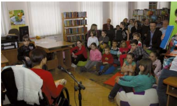
„Moda na czytanie – czytanie łączy pokolenia”