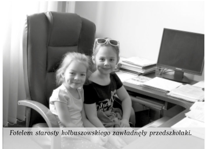
Fotelem starosty kolbuszowskiego zawiadnęły przedszkolaki.