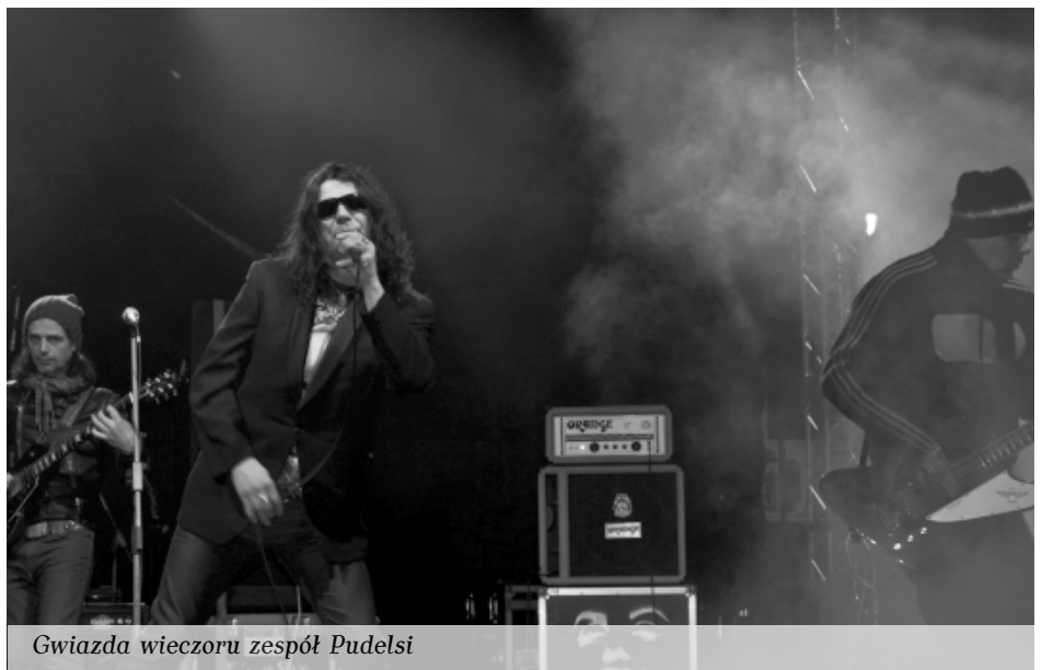
Gwiazda wieczoru zespół Pudelsi