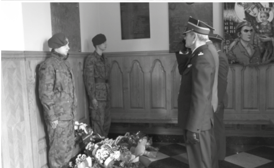
Służby mundurowe składają kwiaty przy tablicy upamiętniającej setną rocznicę uchwalenia Konstytucji 3 Maja.