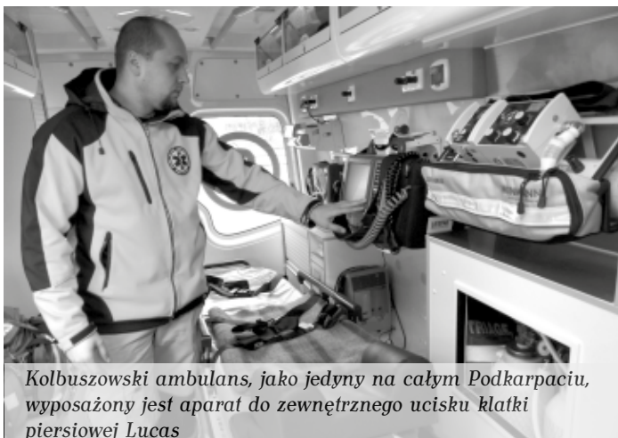
Kolbuszowski ambulans, jako jedyny na całym Podkarpaciu, wyposażony jest aparat do zewnętrznego ucisku klatki piersiowej Lucas

Aktualnie kolbuszowski Szpital Powiatowy dysponuje dwiema karetkami wyjazdowymi – podstawową i specjalistyczną. Zarówno jedna jak i druga wyposażona jest m.in. w nowoczesne defibrylatory z systemem teletransmisji informacji, które przekazują dane medyczne pacjenta do najbliższej pracowni hemodynamiki.