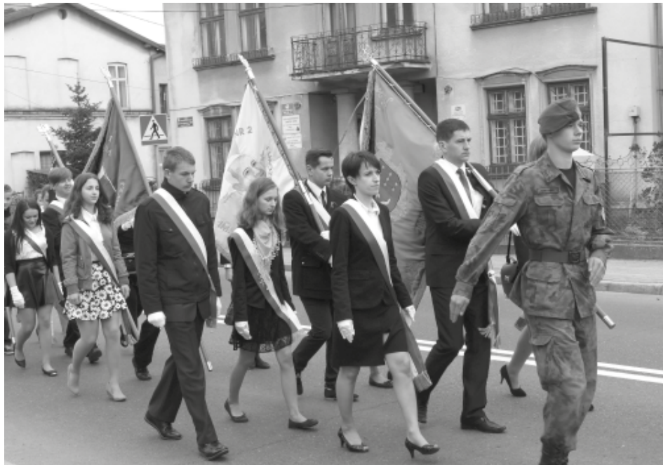
Uroczysty przemarsz z placu PSP na cmentarz parafialny.

Druga część obchodów 223. rocznicy uchwalenia Konstytucji 3 maja odbyła się na kolbuszowskim Rynku. Poprowadziła ją młodzież z Zespołu Szkół Technicznych