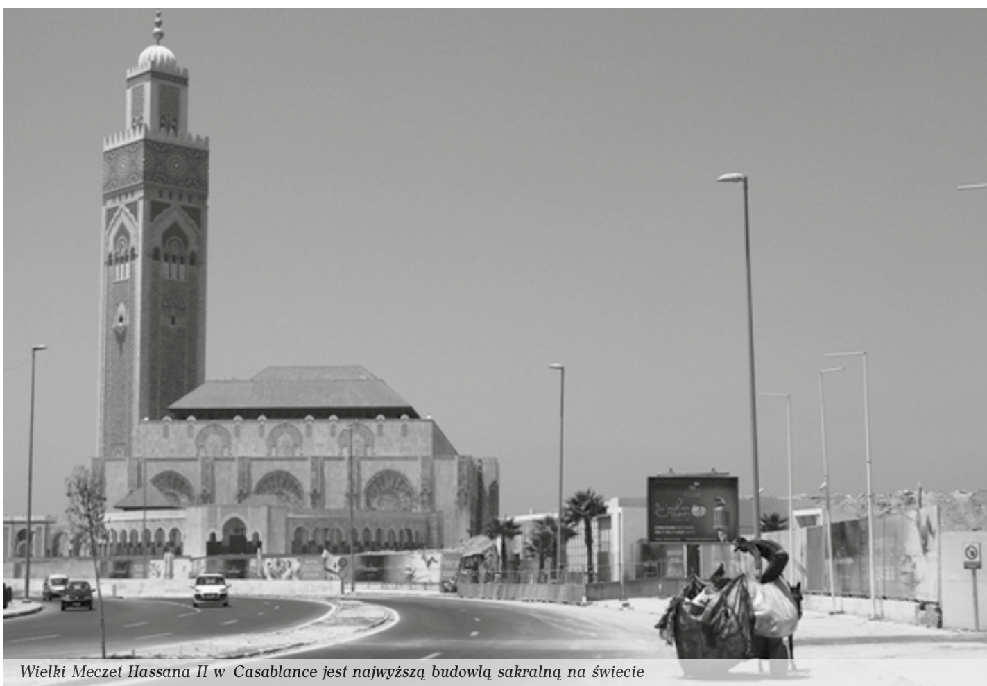
Wielki Meczet Hassana II w Casablance jest najwyższą budowlą sakralną na świecie