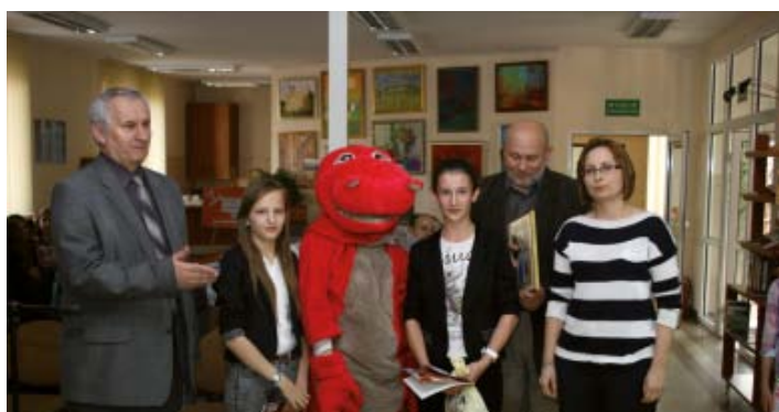
Uczennice Gimnazjum w Widelce, które przygotowały prezentację „Historia Książki. Od tabliczki glinianej do iPada”, wraz z opiekunem i dyrektorem szkoły