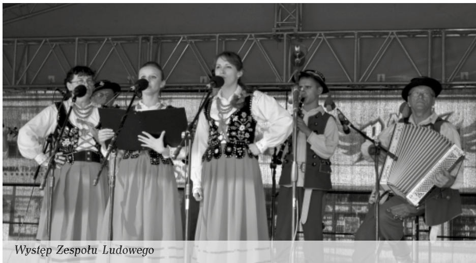
Występ Zespołu Ludowego

w Kolbuszowskiej Kolegiate wystąpili Czech i Polski w Oratorium Terra Nostra. uczniowie ze szkół muzycznych Francji,