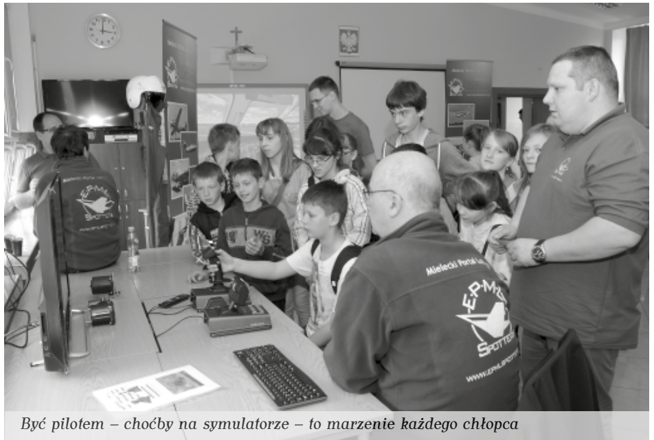
Być pilotem – choćby na symulatorze – to marzenie każdego chłopca

W ramach prezentacji szkolnych zwiedzający mogli zobaczyć: origami 3D oraz kompozycje owocowo-warzywne w wy-