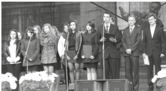
Występ artystyczny uczniów Zespołu Szkół Technicznych z Kolbuszowej.