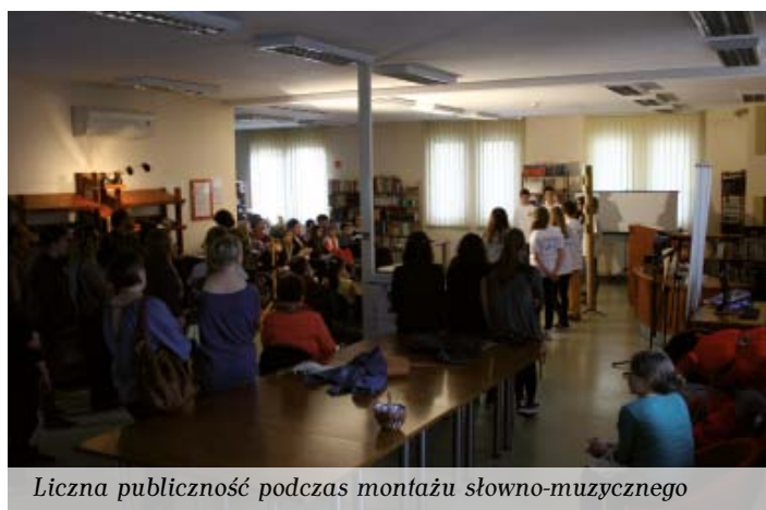
Liczna publiczność podczas montażu słowno-muzycznego