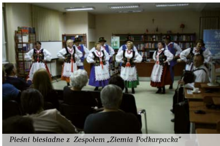
Pieśni biesiadne z Zespołem „Ziemia Podkarpacka”