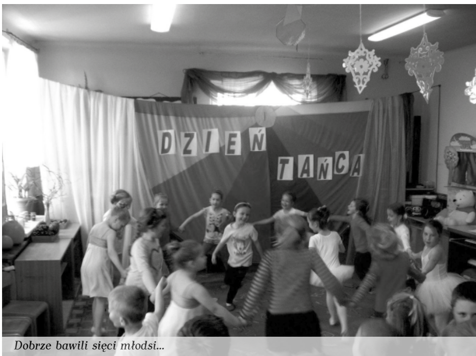
Dobrze bawili sięci młodzi...

Wszyscy uczestnicy otrzymali piątkowe upominki i dyplomy. Przegląd zakończył się wspólną dyskoteką, w której udział wzięli artyści.