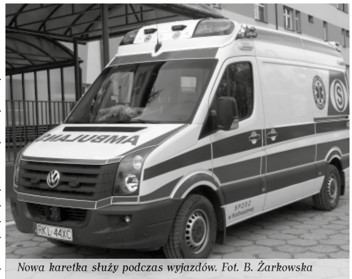
Nowa karetka służy podczas wyjazdów.

– To urządzenie jest naszą dumą i chlubą. Jest niezwykle pomocne podczas reanimacji. Daje pacjentowi dużo większą szansę na przeżycie niż masaż wykonywany przez człowieka, ponieważ pracuje bez przerwy, z równą skutecznością. Jesteśmy z niego dumni o tyle, że w tego typu sprzęt