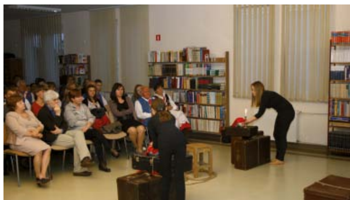
„Pod osłoną nocy” - spektakl Grupy Teatralnej Grzegorza Wójcickiego