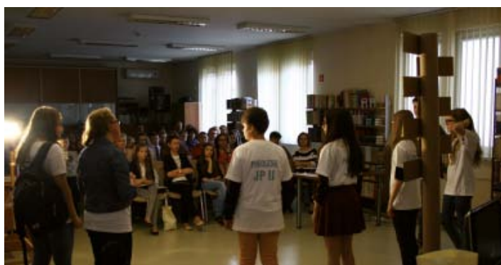
Święty żył wśród nas... - „Pokolenie JP II” – montaż słowno-muzyczny w wykonaniu uczniów Gimnazjum nr 2 im. Jana Pawła II w Kolbuszowej