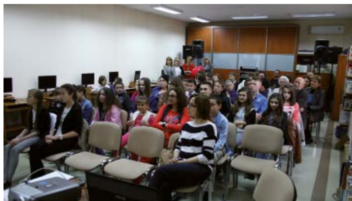
Jak co roku, Noc w Bibliotece cieszyła się dużym zainteresowaniem