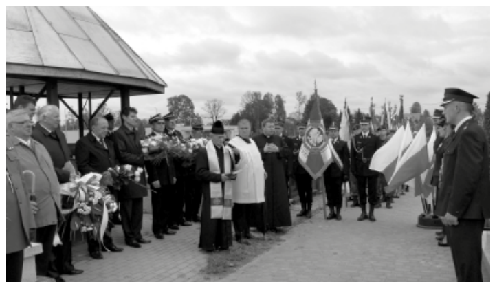
Modlitwa na cmentarzu przy Obelisku Strażaków.