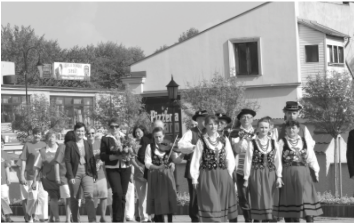
Uroczysty przemarsz.