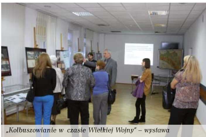
„Kolbuszowianie w czasie Wielkiej Wojny” – wystawa