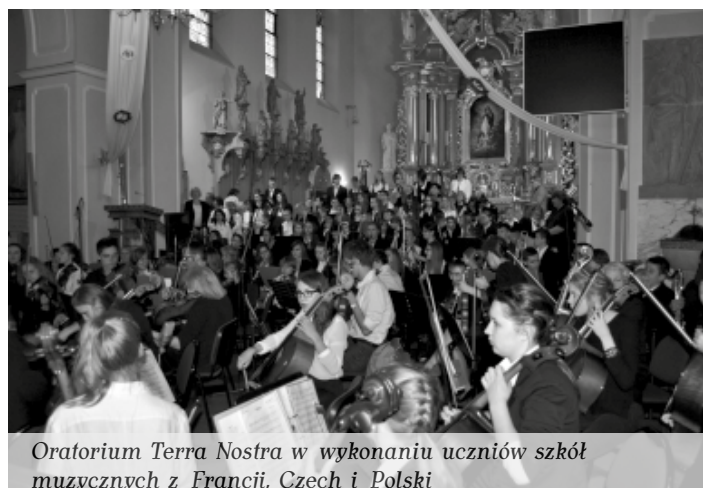
Oratorium Terra Nostra w wykonaniu uczniów szkół muzycznych z Francji, Czech i Polski