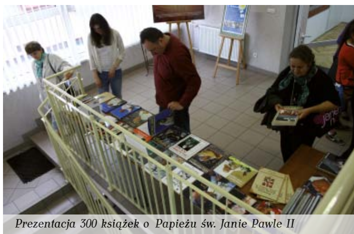
Prezentacja 300 książek o Papieżu św. Janie Pawle II