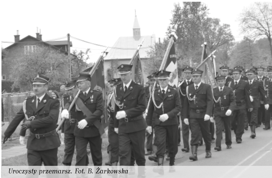
Uroczysty przemarsz.

Sto dwudziesta rocznica utworzenia jednostki OSP w Zielonce była doskonałą okazją do uhonorowania najbardziej zasłużonych strażaków. Złotym medalem Za Zasługi dla Pożarnictwa odznaczeni zostali druhowie Władysław Kobylarz oraz