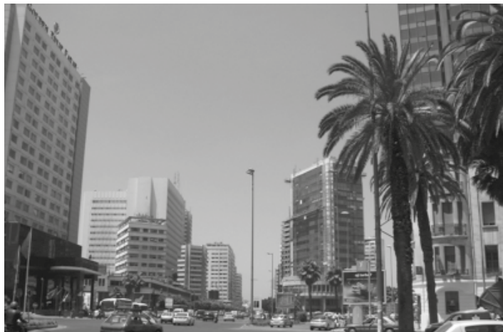
Nowoczesne centrum Casablanki. Obecnie miasto liczy ponad 4 miliony ludzi i jest drugim co do wielkości miastem Afryki