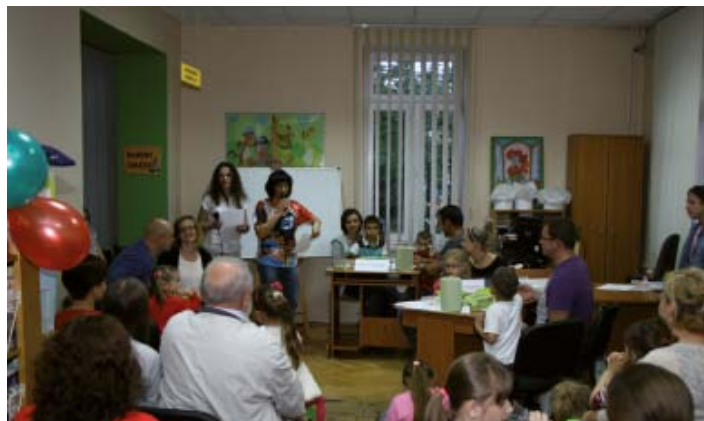
„Mali i duzi z uśmiechem na buzi” - potyczki rodzinne