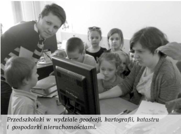
Przedszkolaki w wydziale geodezji, kartografii, katastru i gospodarki nieruchomości.