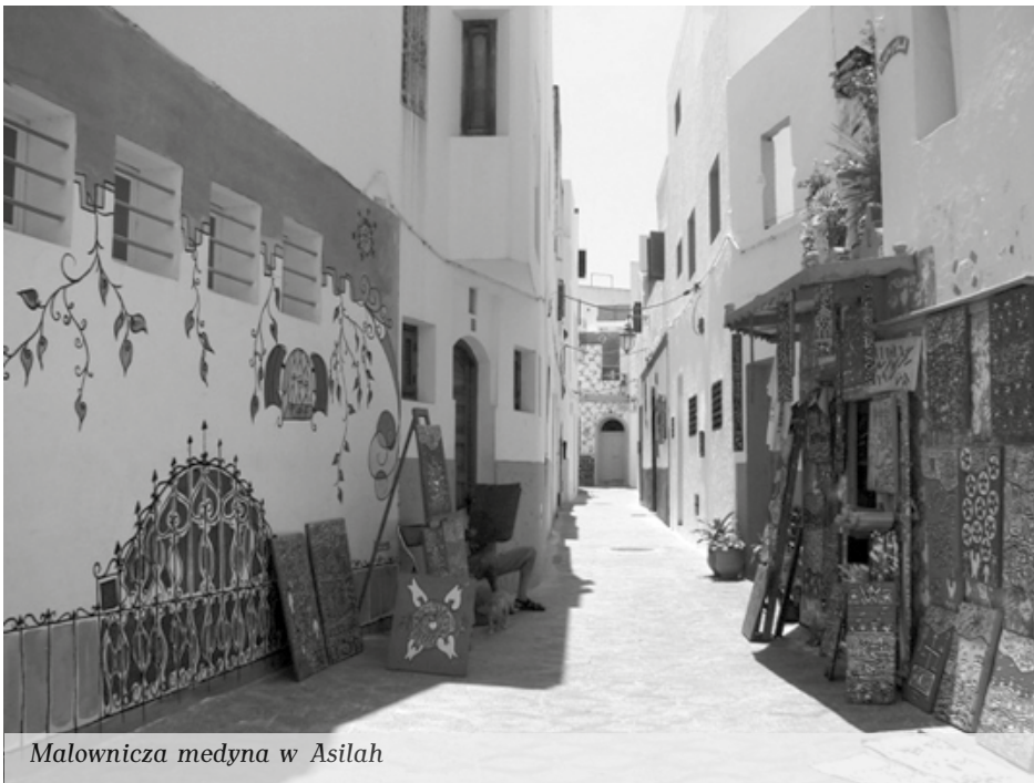
Malownicza medyna w Asilah