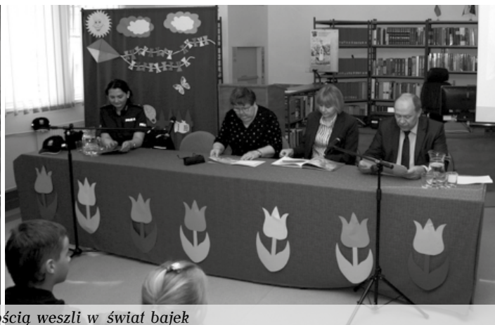
Zaproszeni goście z radością weszli w świat bajek