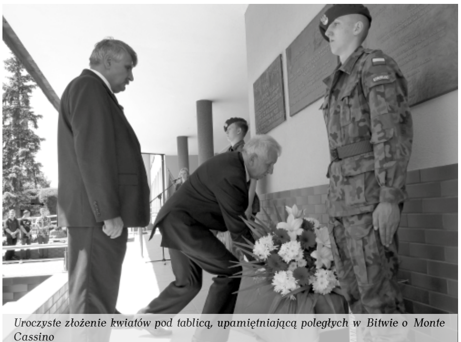
Uroczyste złożenie kwiatów pod tablicą, upamiętniającą poległych w Bitwie o Monte Cassino