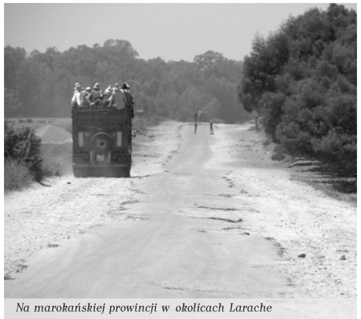
Na marokańskiej prowincji w okolicach Larache