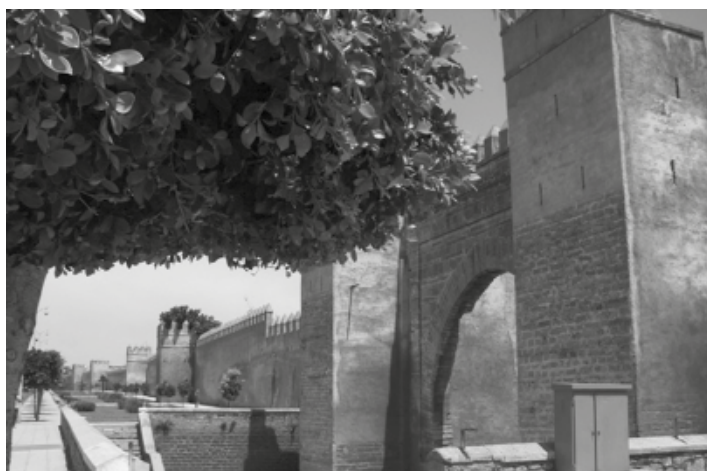
Rabat jest stolicą państwa i najstarszą twierdzą obronną Maroka. Fragment murów obronnych z XII wieku