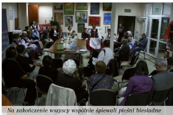
Na zakończenie wszyscy wspólnie śpiewali pieśni biesiadne