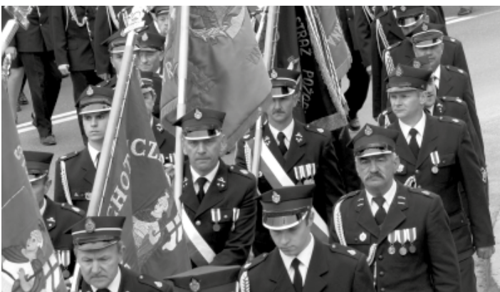
W trzeciomajowych obchodach udział wzięli strażacy OSP z gminy Kolbuszowa.