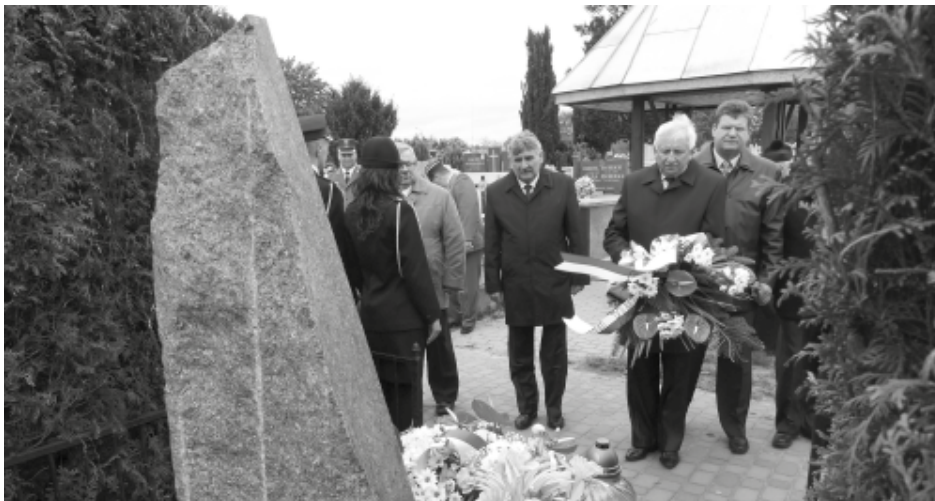
Uroczyste złożenie kwiatów przez Zarząd Powiatu Kolbuszowskiego.