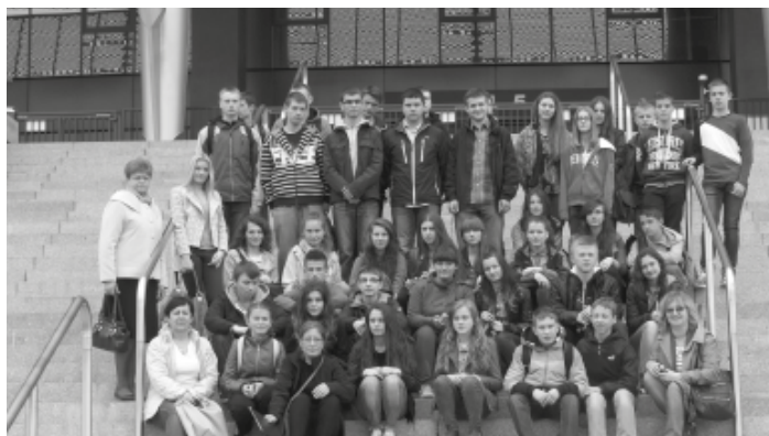
Młodzież ze szkół gimnazjalnych i ponadgimnazjalnych z powiatu kolbuszowskiego na wycieczce w Sejmie i Senacie RP.