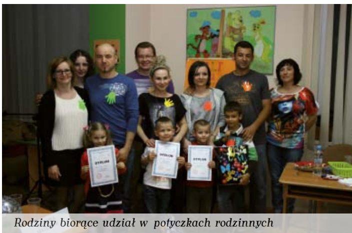
Rodziny biorące udział w potyczkach rodzinnych