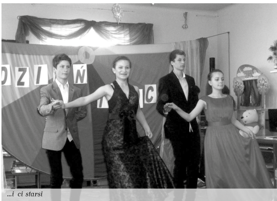
...i ci starsi