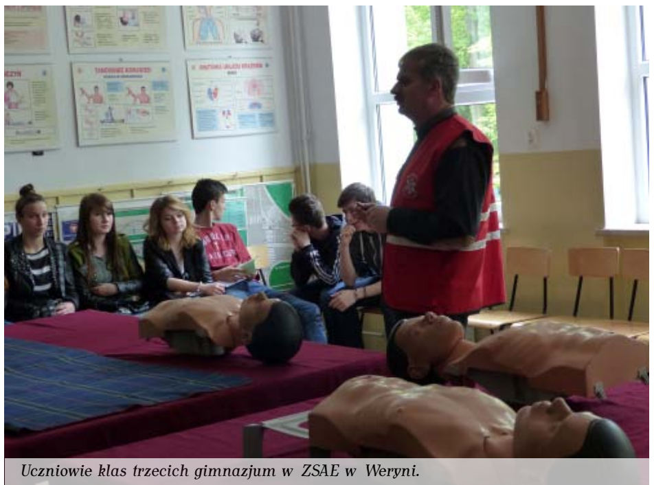
Uczniowie klas trzecich gimnazjum w ZSAE w Weryni.