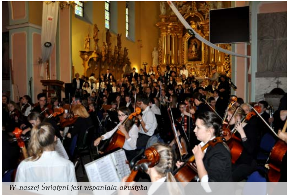
W naszej Świątyni jest wspaniała akustyka