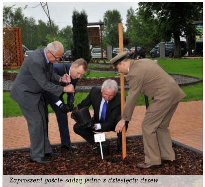
Zaproszeni goście sadzą jedno z dziesięciu drzew