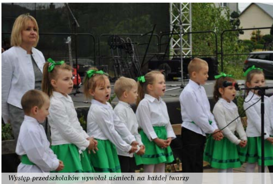
Występ przedszkolaków wywołał uśmiech na każdej twarzy