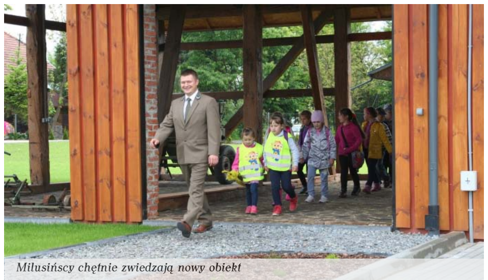
Milusińscy chętnie zwiedzają nowy obiekt

Pierwsi goście zawitali do nowo otwartego ogrodu botanicznego w Nadleśnictwie Kolbuszowa. Już w dniu 03.06.2014 r. Nadleśnictwo Kolbuszowa zostało odwiedzone po raz pierwszy po uroczystym otwarciu. Goście odwiedzili Centrum Edukacji Ekologicznej, gdzie leśniczy zapoznał ich z zasadami zachowania się w lesie. Następnie udali się do pomieszczenia z dioramą, dzięki której widok i odgłosy zwierząt leśnych nie są im obce. Kolejnym etapem zwiedzania był nowo powstały ogród botaniczny znajdujący się przy siedzibie Nadleśnictwa Kolbuszowa. Właśnie tam, podążając alejkami wraz z leśniczym, dzieci zetknęły się z gatunkami roślin, krzewów i drzew charakterystycznych dla Puszczy Sandomierskiej. Wiata edukacyjna, w której znajdują się przekroje podłużne i poprzeczne drzew, a także urządzenia służące dawniej do pracy na szkółce nie zostały ominięte przez