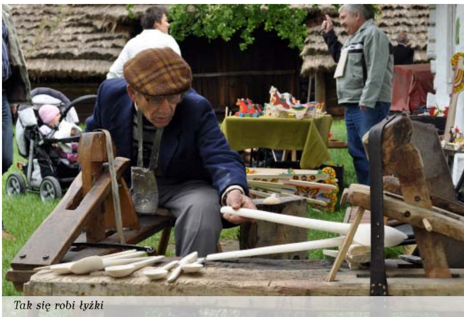
Tak się robi łyżki