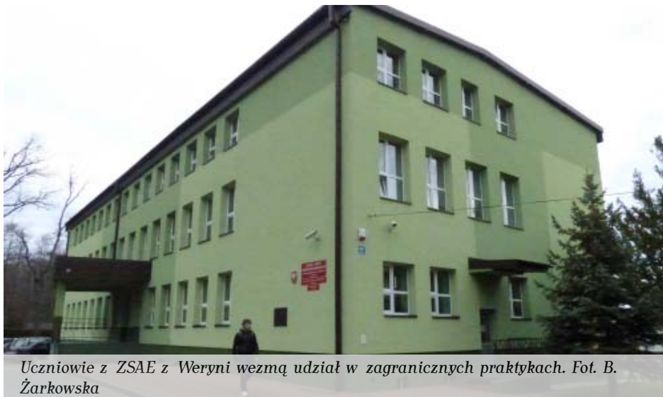
Uczniowie z ZSAE z Weryni wezmą udział w zagranicznych praktykach.

Zagraniczne staże mają pomóc uczniom ZSAE uzyskać większą mobilność i doświadczenie zawodowe na ryn-