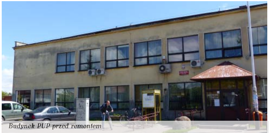
Budynek PUP przed remontem

Generalny remont budynku Powiatowego Urzędu Pracy możliwy będzie dzięki dotacji unijnej, o jaką postarały się władze Powiatu Kolbuszowskiego. – Z budżetu Unii Europejskiej otrzymaliśmy dofinansowanie w wysokości 709 648 zł – wyjaśnia Józef Kardyś, starosta kolbuszowski. Pieniądze pochodzą z Europejskiego Funduszu Rozwoju Regionalnego realizowanego w ramach Osi Priorytetowej nr 2 „Infrastruktura techniczna” RPO dla WP na lata 2007 – 2013.