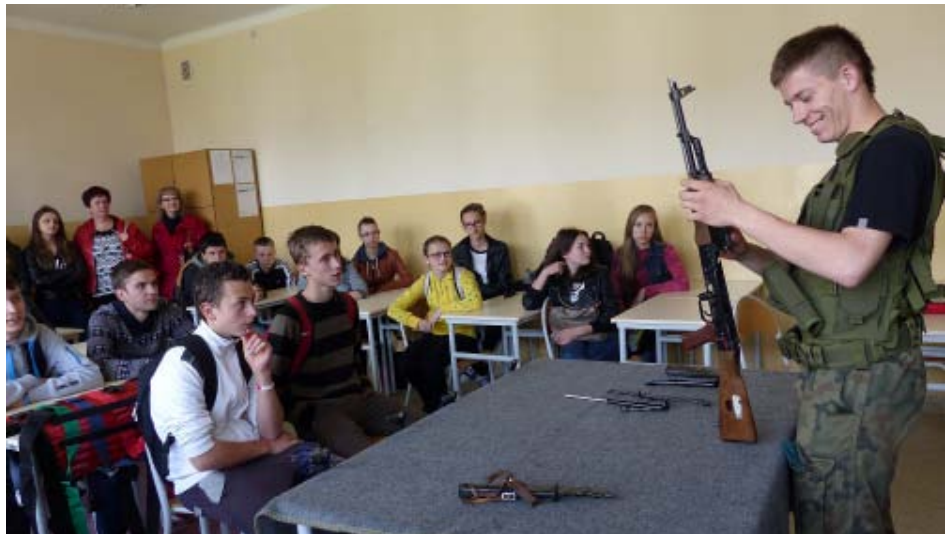
Wizyta w ZST w Kolbuszowej – klasa mundurowa.

W Zespole Szkół Technicznych gimnazjalistom o kierunkach kształcenia opowiadali sami uczniowie. Mówili o zaletach szkoły, do której uczęszczają, oraz kwalifikacjach jakie można w niej zdobyć. Z kolei kolbuszowskie LO kusiło stypendiami, przyznawanymi najzdolniejszym uczniom oraz dostępnymi profilami, spośród których każdy może znaleźć najbardziej odpowiadający jego zainteresowaniom. Nauczyciele z Zespołu Szkół Agrotechniczno – Ekonomicznych z Weryni natomiast zachęcali młodzież gimnazjalną nie tylko swoimi kierunkami, ale również kursami doszkalającymi. Ich posiadanie bowiem, jak wskazywali nauczyciele, znacznie zwiększają szansę na znalezienie zatrudnienia na obecnym rynku pracy. W Centrum Kształcenia Praktycznego z kolei gimnazjaliści mogli zobaczyć nowoczesne laboratoria, wyposażone w najnowsze urządzenia stosowane w najlepszych firmach na Podkarpaciu.