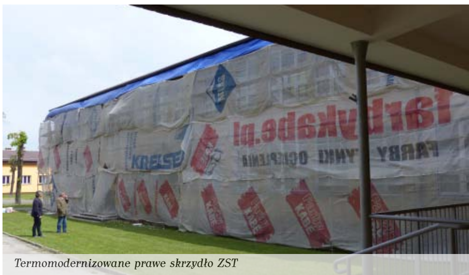
Termomodernizowane prawe skrzydło ZST

Dzięki unijnej pomocy możliwa jest także termomodernizacja budynku Cen-