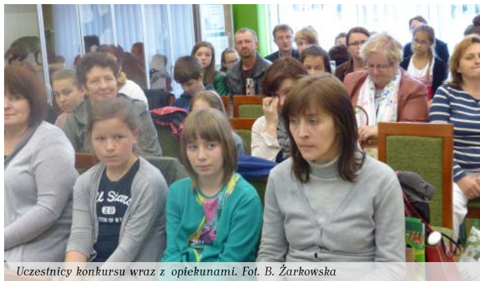
Uczestnicy konkursu wraz z opiekunami.