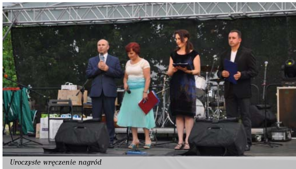
Uroczyste wręczenie nagród