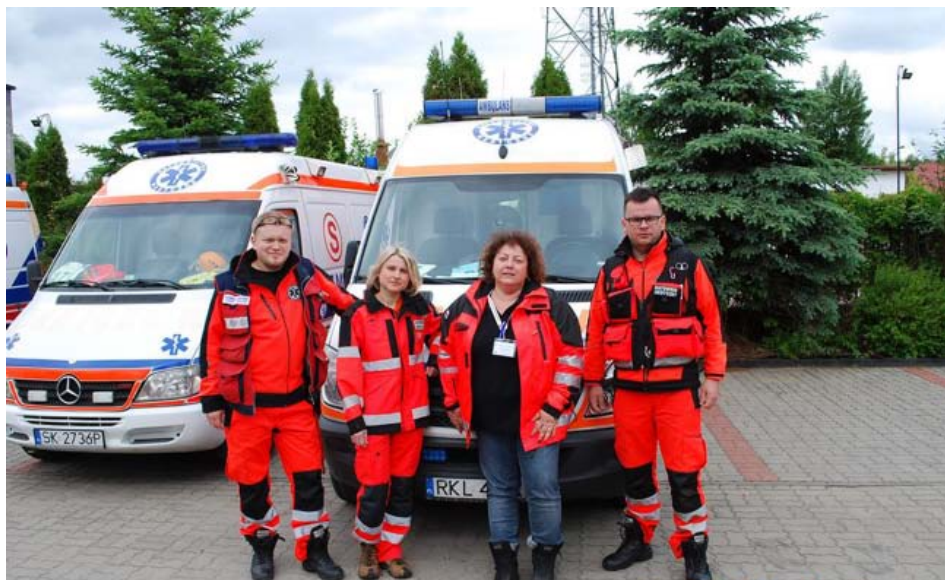
Zwycięska załoga pogotowia ratunkowego z Kolbuszowej 30.05.2014 15:19