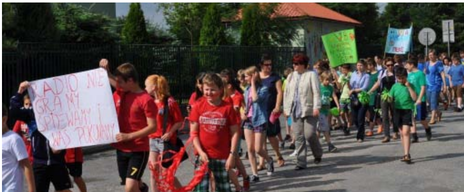
Poranny przemarsz ulicami miasta z orkiestrą dętą