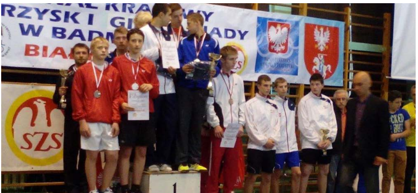
Wspólne zdjęcie sportowców biorących udział w finałach krajowych Gimnazjady dziewcząt i chłopców w badmintonie