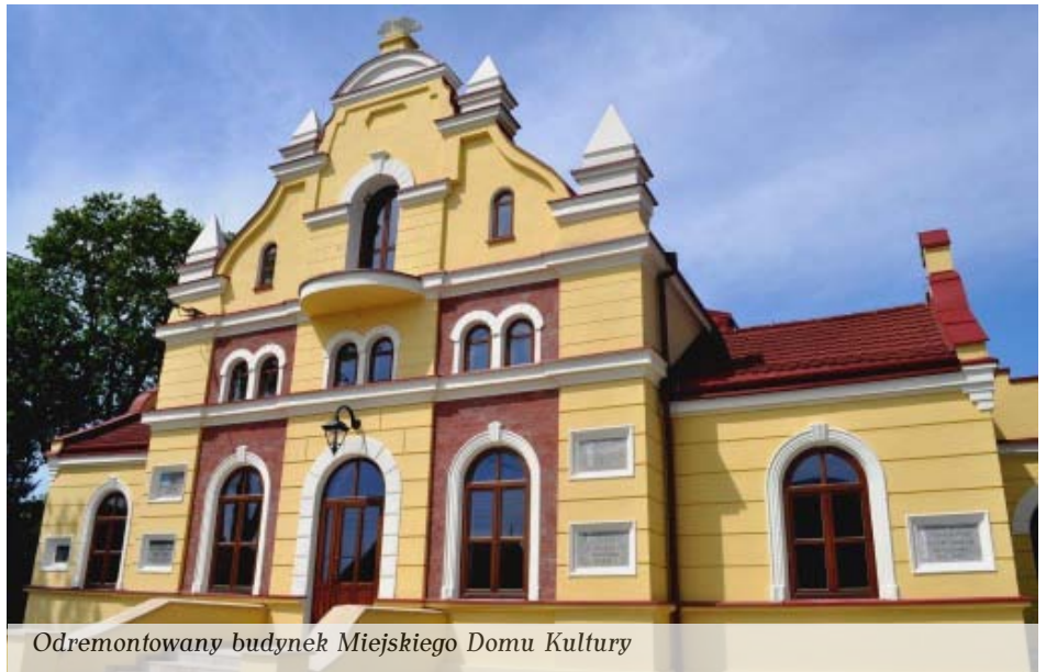
Odremonowany budynek Miejskiego Domu Kultury

Na potrzeby MDK zakupiono także rozwijany ekran (o wymiarach 512 x 397