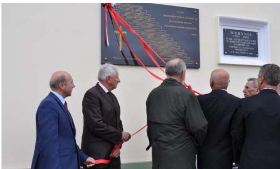
Odświeżenie tablicy „Ku czci Mieszkańców Weryni – Żołnierzy AK w 70 rocznicę zesłania do łagrów Związku Sowieckiego”