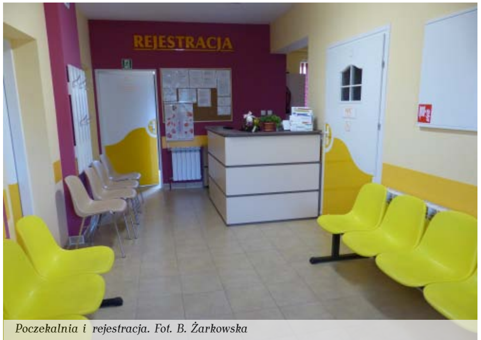
Poczekalnia i rejestracja.

– Przeprowadziliśmy generalny remont wszystkich pomieszczeń, zaadaptowanych pod potrzeby ośrodka – mówi Zbigniew Strzelczyk. – Kupiliśmy nowy piec do centralnego ogrzewania, w ośrodku po-