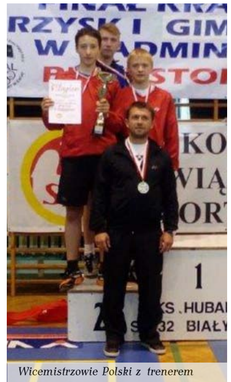
Wicemistrzowie Polski z trenerem