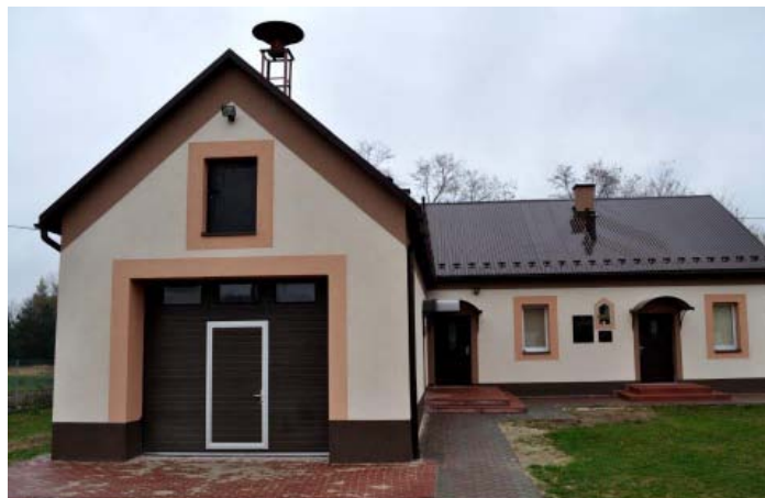
OSP w Porębach Kupieńskich po termomodernizacji