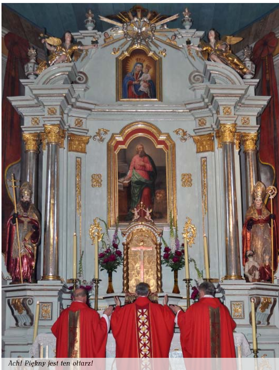
Ach! Piękny jest ten ołtarz!