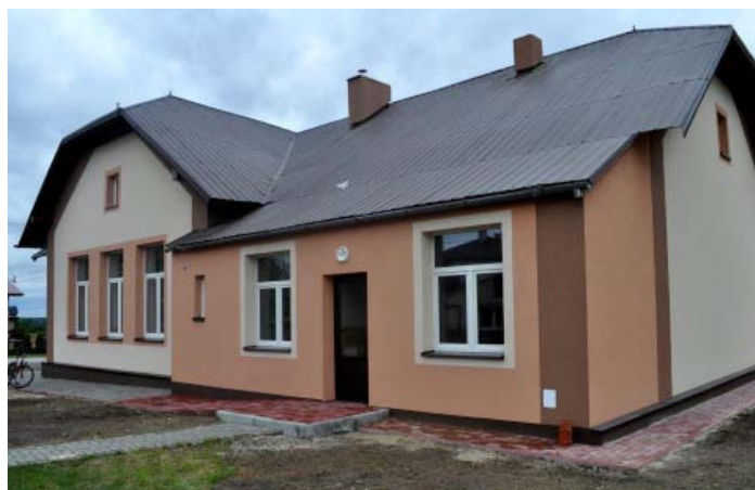
Szkoła podstawowa w Zarębkach po termomodernizacji