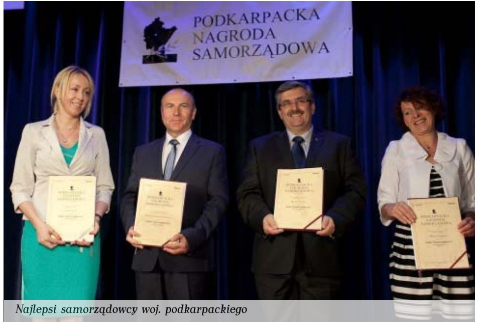
Najlepsi samorządowcy woj. podkarpackiego