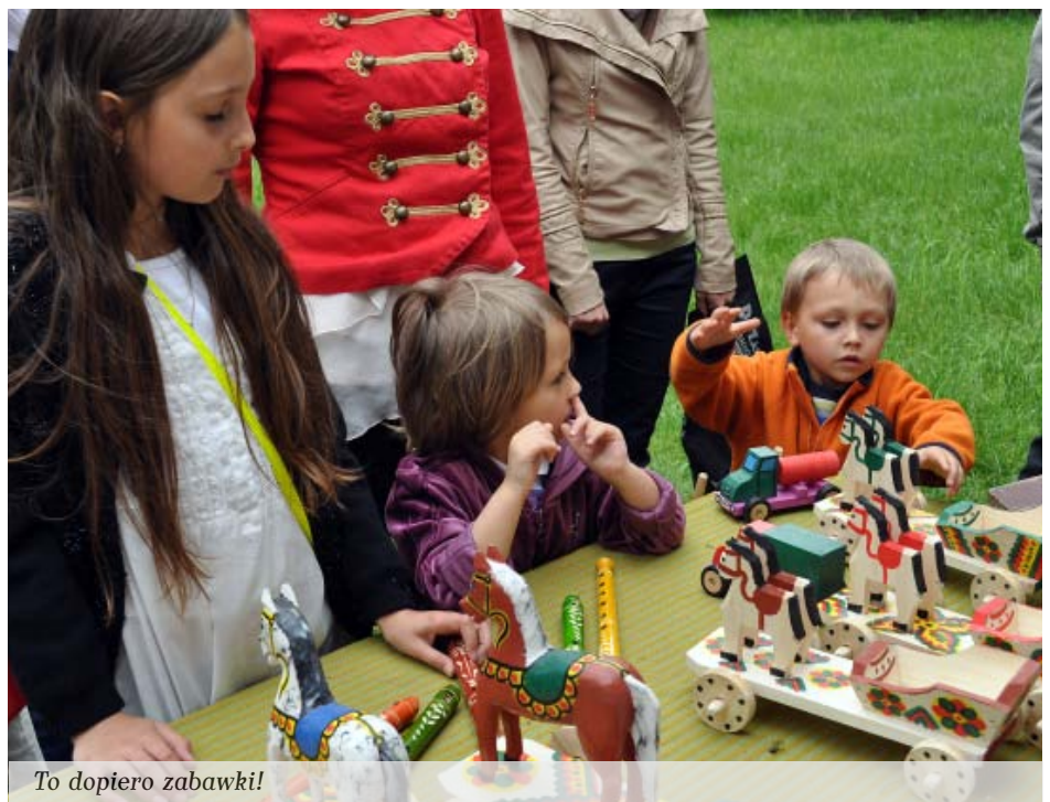
To dopiero zabawki!

z Kół Gospodyń Wiejskich z Mazurów i Kolbuszowej Górnej przygotowywały pyszności. Zapach pieczonego chleba