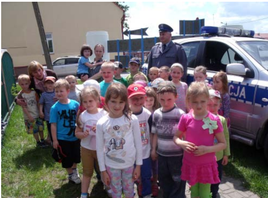
Włączyć policyjną syrenę - to dopiero frajda

Dzięki takim spotkaniom na pewno żaden z przedszkolaków nie będzie obawiał się spotkania z funkcjonariuszem. Policjant będzie kojarzył się przedszkolakom jako osoba, której nie należy się bać, i do której zawsze i w każdej sytuacji można zwrócić się o pomoc.