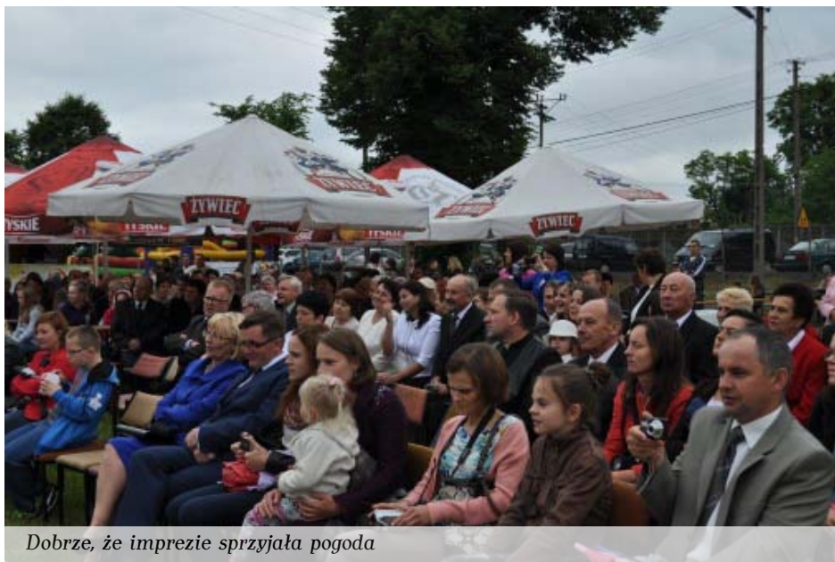
Dobrze, że imprezie sprzyjała pogoda