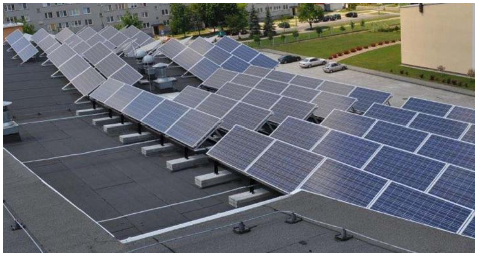
Ale będzie ciepło na basenie!

na dalsze oszczędności zarówno finansowe, jak i chroniące środowisko naturalne.