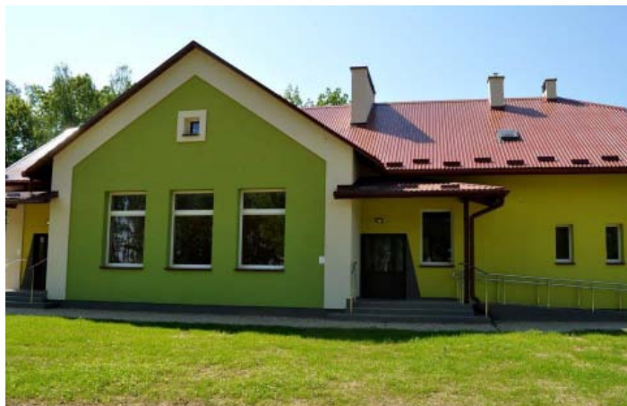
Dawna szkoła w Nowej Wsi po termomodernizacji