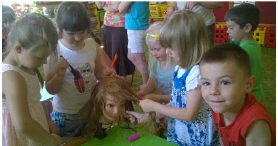
Dzieci z pasją tworzyły nowe fryzury

Serdecznie zapraszamy od września do naszej szkolnej pracowni fryzjerskiej, gdzie nasze uczennice w ramach zajęć praktycznych wykonują różne zabiegi fryzjerskie.