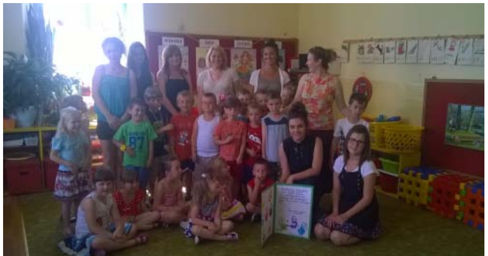
Może któryś młody człowiek już wybrał zawód?