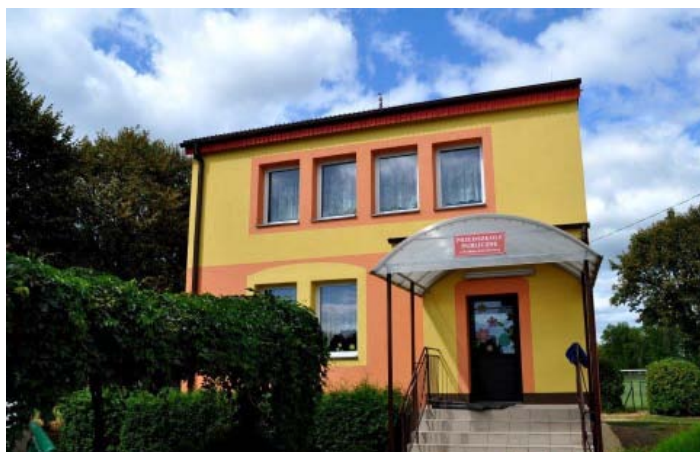
Przedszkole w Kolbuszowej Dolnej po termomodernizacji