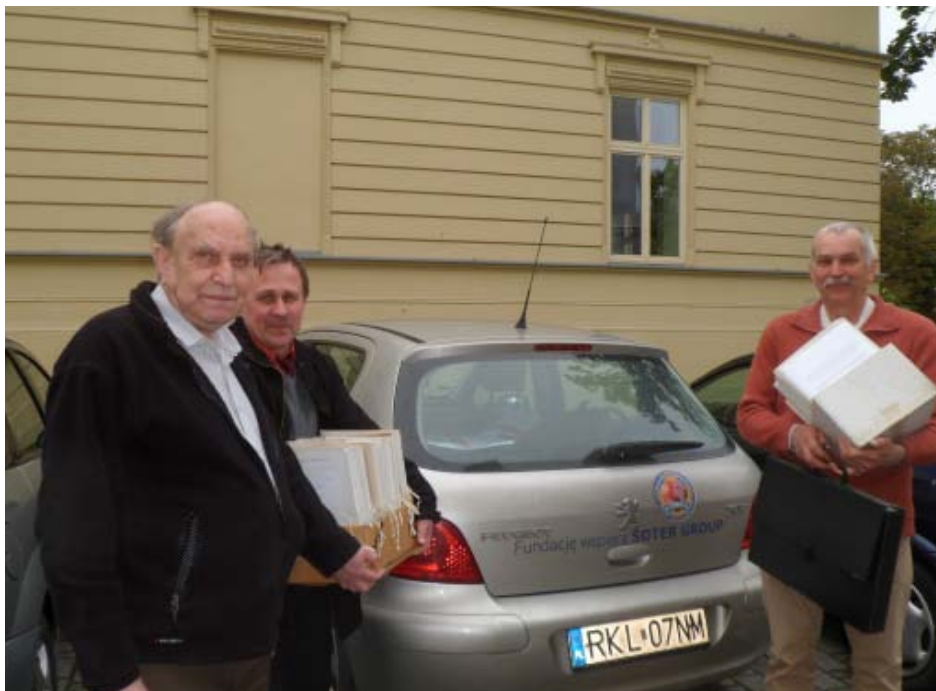
Dokumentów było sporo

skiego w Poznaniu, w sprawie Fundacji im. Kozłowieckich, rok założenia 1935, tom IV.