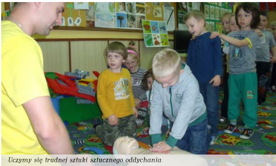
Uczymy się trudnej sztuki sztucznego oddychania