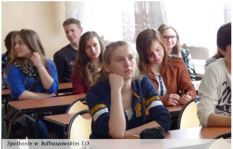
Spotkanie w kolbuszowskim LO