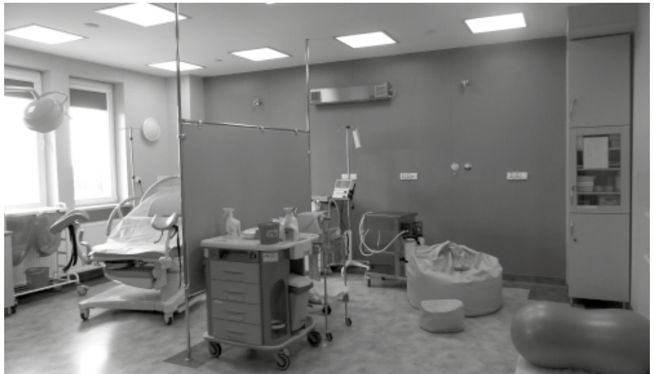
Nowoczesna sala porodowa, jaka znajduje się w kolbuszowskim Szpitalu Powiatowym.

W przestronnych, kolorowych i odnowionych salach porodowych mogą odbywać się porody rodzinne. Jak zaznacza Elżbieta Wilk, położna oddziałowa na oddziale ginekologiczno – położniczym, pacjentki bardzo często decydują się na tego typu porody. Do ich dyspozycji pozostaje łóżko porodowe z funkcją masażu, którego uruchomienie zmniejsza ból porodowy u rodzącej. Podobną funkcję pełni gaz rozszerzający. Ponadto każda z sal porodowych wyposażona jest w klimatyzację oraz ze-