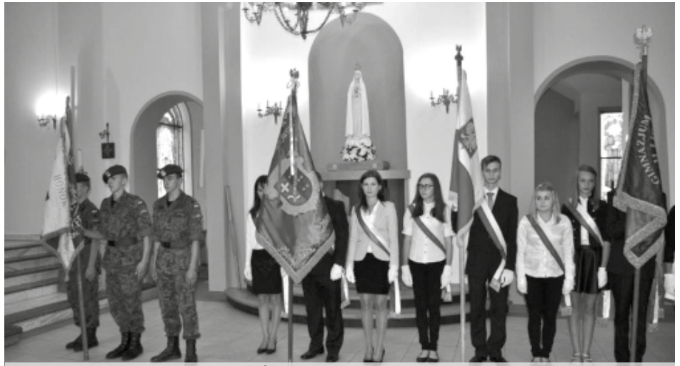
Poczty sztandarowe w kościele Św. Brata Alberta