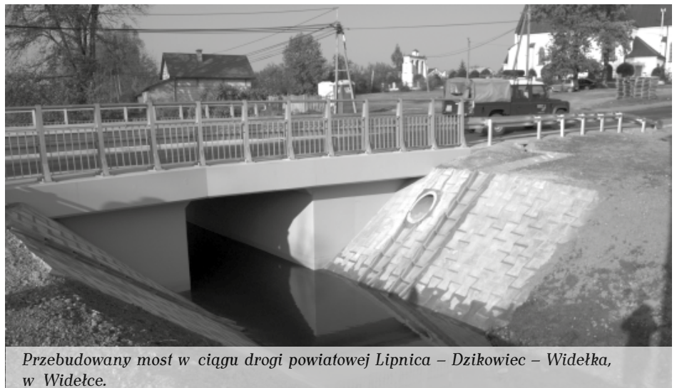
Przebudowany most w ciągu drogi powiatowej Lipnica – Dzikowiec – Widelka, w Widelce.

Ponad 24,4 mln zł – tyle Powiat Kolbuszowski pozyskał pieniędzy ze źródeł zewnętrznych w IV kadencji.