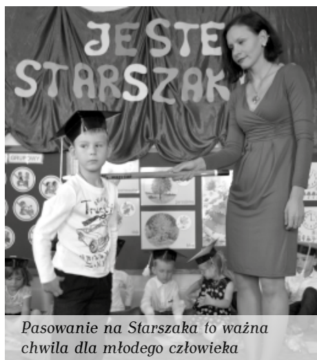
Pasowanie na Starszaka to ważna chwila dla młodego człowieka