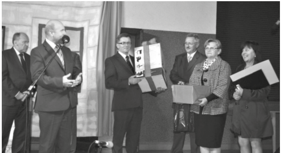
Wręczenie nagród w konkursie na najpopularniejsze KGW