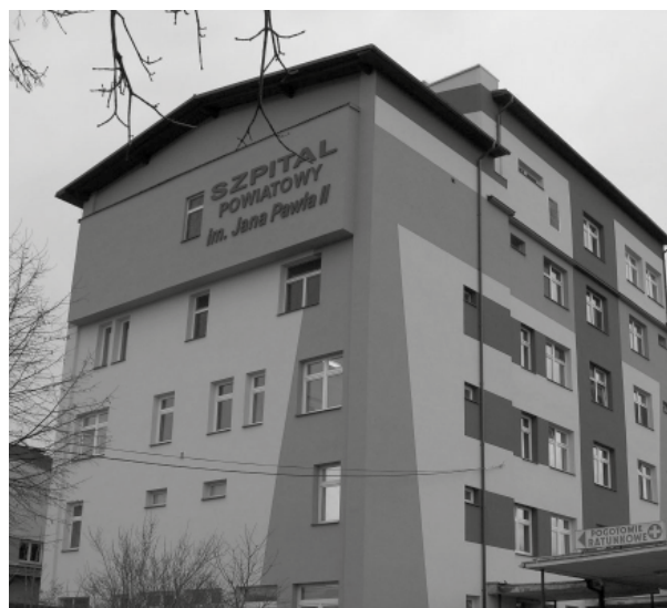
Szpital Powiatowy po termomodernizacji. 29 kwietnia 2005 roku Rada Powiatu Kolbuszowskiego podjęła uchwałę o nadaniu szpitalowi imienia Jana Pawła II.

8,5 mln zł – tyle Powiat Kolbuszowski pozyskał pieniędzy ze źródeł zewnętrznych podczas II kadencji.