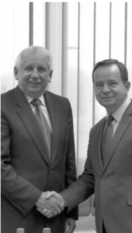
Wizyta Marszałka Władysława Ortyla w powiecie kolbuszowskim.