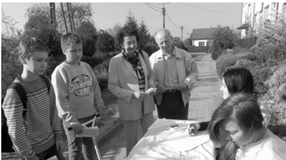
„Stacja” przy budynku LO na ulicy Jana Pawła II

Pierwszym punktem był kościół pw. Św. Brata Alberta, przy którym wszyscy uczestnicy otrzymali Karty Pielgrzyma. Tutaj ich zadaniem była modlitwa za Światowe Dni Młodzieży, których dzieło zapoczątkował Jan Paweł II w czasie swojego pontyfikatu. Następnym punktem była kaplica Szpitala Powiatowego, który od 2005 r. nosi imię Papieża Polaka. Kolejnym przystankiem na szlaku było Gimnazjum nr 2. Tam, obok tablicy pamiątkowej, która została odsłonięta w dniu kanonizacji, uczestnicy odmówili modlitwę w intencji uczniów i wychowawców. Papież mawiał, że „Młodzież jest przyszłością świata i kościoła”, dlatego kolejną stacją znajdowała się w budynku Liceum Ogólnokształcącego przy ulicy Jana Pawła II, za którą odpowiedzialni byli uczniowie tej szkoły. Na każdego pielgrzyma czekała tam myśl zaczerpnięta z nauczania Świętego. Można było również zobaczyć tablicę pamiątkową poświęconą Słudze Bożemu Janowi Pawłowi II, która znajduje się na głównym korytarzu szkoły i przypomina o ideałach, jakimi uczniowie powinni się w życiu kierować. W związku z tym, że Karol Wojtyła już jako mały chłopiec doświadczył utraty bliskich, kolejna sta-