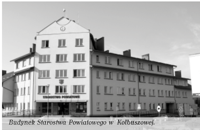
Budynek Starostwa Powiatowego w Kolbuszowej.

1,7 mln zł – taka kwota w I kadencji trafiła na oświatę.