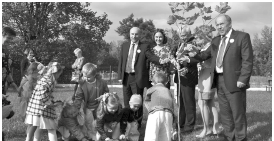
Sadzimy pamiątkowe drzewo