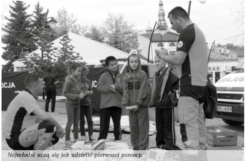
Najmłodszy uczą się jak udzielić pierwszej pomocy.

Podczas obchodów Państwowego Dnia Ratownictwa Medycznego, maluchy mogły dowiedzieć się jak należy udzielić pierwszej pomocy poszkodowanemu, jak wezwać pomoc medyczną oraz obejrzeć karetkę pogotowia ratunkowego od środka. Z kolei strażacy z PSP w Kolbuszowej pokazali najmłodszym sprzęt ratowniczy jakim dysponują na co dzień oraz wyposażenie wozu strażackiego. Natomiast policjanci opowiadali o sposobie zabezpieczania śladów na miejscu przestępstw. Chętni mogli zostawić odciski swoich palców na specjalnie przygotowanych kartkach oraz przymierzyć elementy policyjnego umundurowania. Dorośli mieszkańcy Powiatu z kolei mogli sprawdzić poziom cukru we krwi oraz wartość ciśnienia tętniczego.