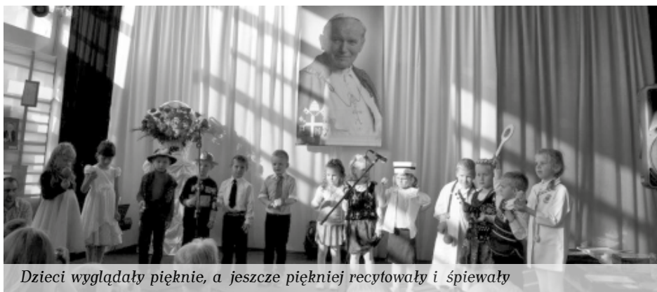
Dzieci wyglądały pięknie, a jeszcze piękniej recytowały i śpiewały

Zwycięzcami w poszczególnych kategoriach zostali: