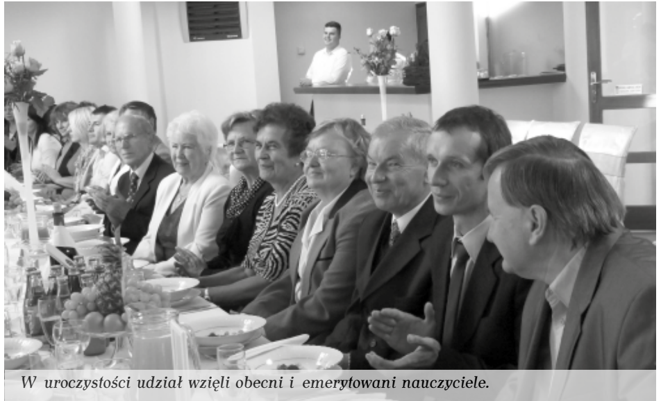
W uroczystości udział wzięli obecni i emerytowani nauczyciele.