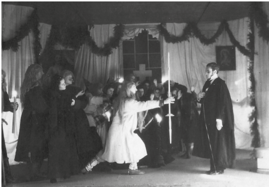
„Gdzie my z nią, on za nią wszędzie. Co to będzie, co to będzie.” Dziadów cz. II na scenie Gimnazjum w Kolbuszowej, 4. listopada 1945 r.