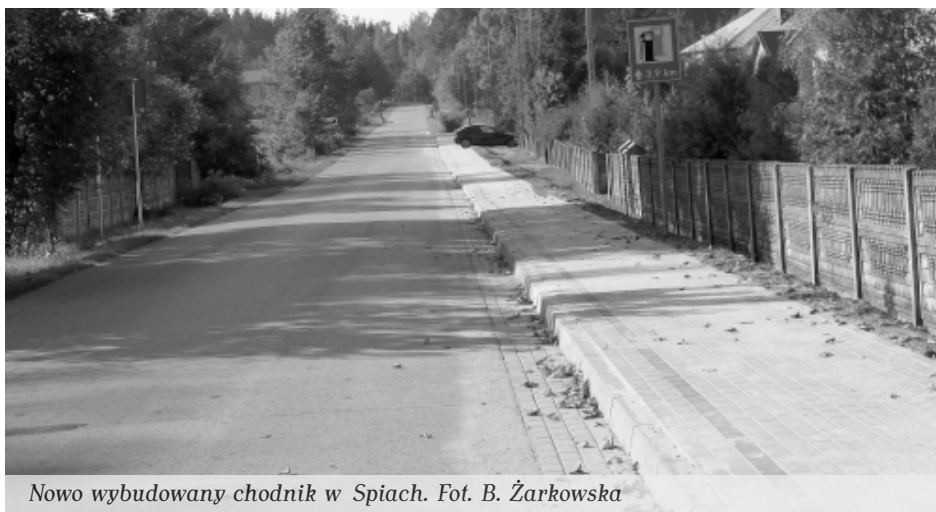
Nowo wybudowany chodnik w Spiach.