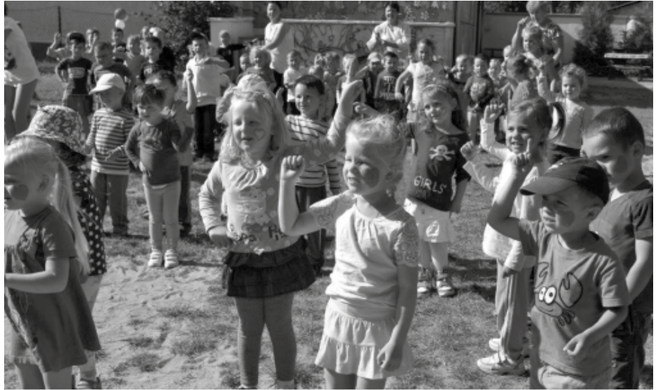
Dzieciaki bawiły się wspaniale

Cały personel zaangażował się w organizację tego dnia. Zadbano o odpowiedni wystrój przedszkola i ogrodu. To był naprawdę piękny dzień dla całej społeczności Przedszkola nr 1.