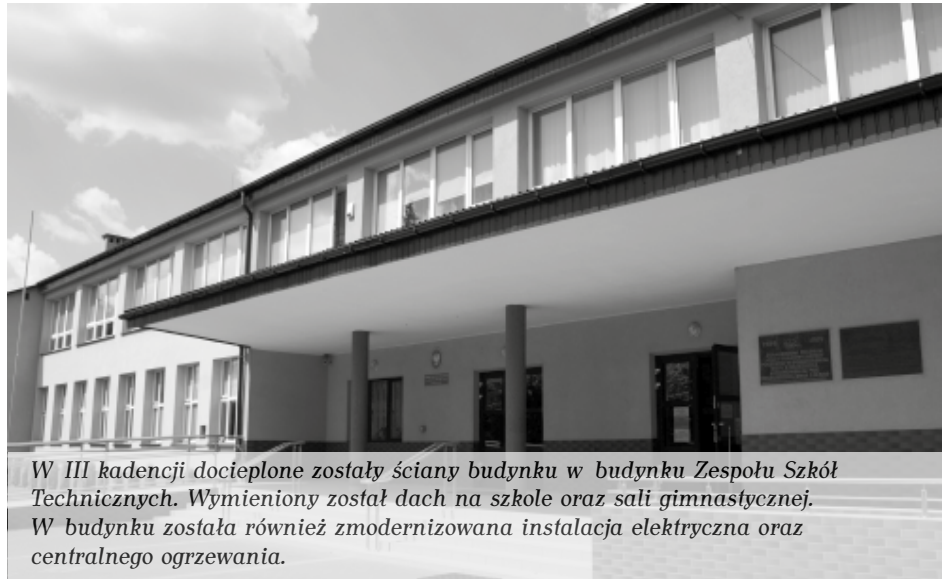
W III kadencji docieplone zostały ściany budynku w budynku Zespołu Szkół Technicznych. Wymieniony został dach na szkole oraz sali gimnastycznej. W budynku została również zmodernizowana instalacja elektryczna oraz centralnego ogrzewania.

Czwarta kadencja to przede wszystkim inwestowanie w oświatę oraz infrastrukturę drogową. Poprawa bazy dydaktycznej szkół ponadgimnazjalnych, prowadzonych przez Powiat Kolbuszowski, oraz ich doposażenie pochłonęło prawie 15 milionów złotych. W tej kwocie mieści się m.in.: uruchomienie Regionalnego Centrum Nowoczesnych Technologii Wytwarzania, w którym znajdują się nowoczesne laboratoria oraz urządzenia spełniające najwyższe standardy oraz Kolbuszowskiego Inkubatora Przedsiębiorczości. W ramach tych funduszy powstał również kompleks sportowy Orlik przy Zespole Szkół Technicznych w Kolbuszowej. Oprócz tego prowadzone były prace termomodernizacyjne i remontowe w Liceum Ogólnokształcącym, Centrum Kształcenia Praktycznego oraz Zespole Szkół Agrotechniczno – Ekonomicznych w Weryni. Z kolei na remonty dróg powiatowych, budowę chodników oraz przebudowę mostów wydano ponad 27 mln zł. W tym czasie nowa