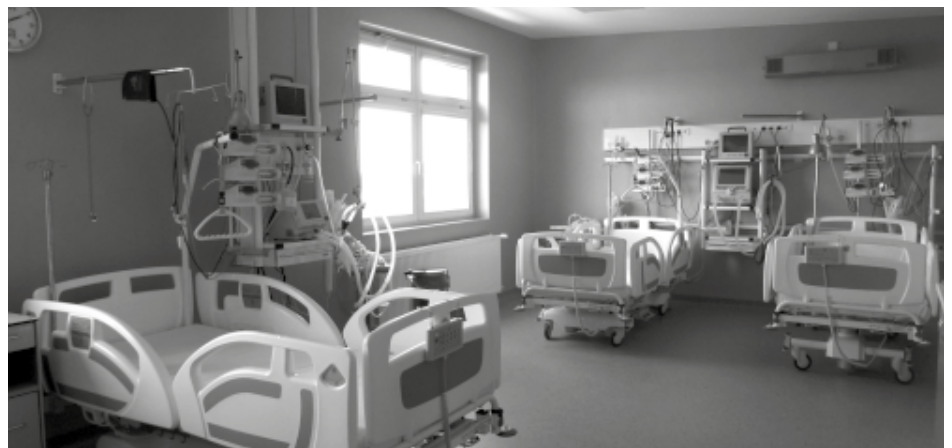
Na zakup nowoczesnej aparatury medycznej oraz wyposażenia Oddziału Anestezjologii i Intensywnej Terapii Powiat Kolbuszowski przekazał 350 tys. zł.