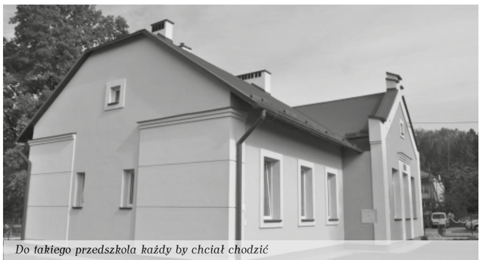
Do takiego przedszkola każdy by chciał chodzić