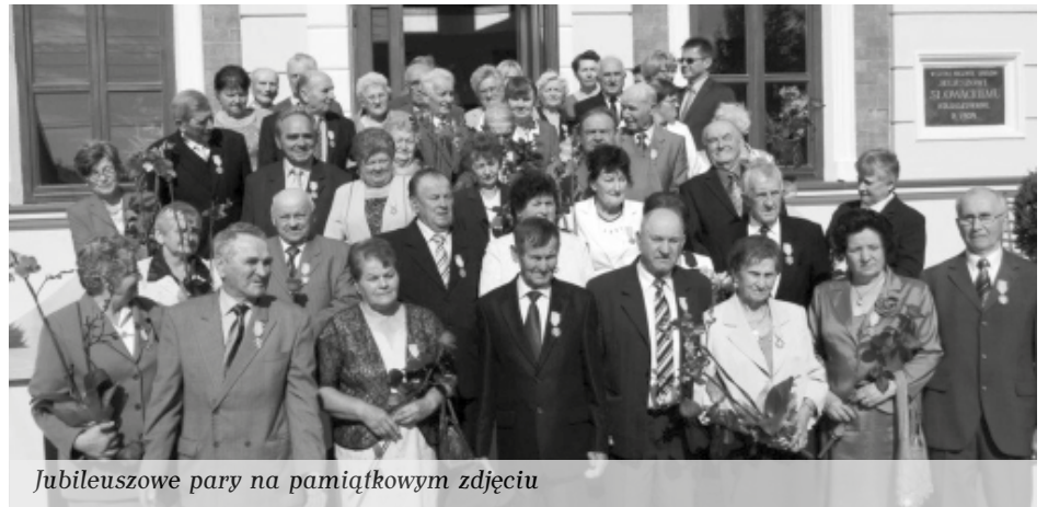
Jubileuszowe pary na pamiątkowym zdjęciu