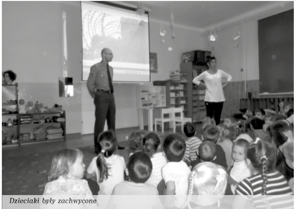
Dzieciaki były zachwycone

Spotkanie było wspaniałą okazją do wytłumaczenia dzieciom jak ważne jest przestrzeganie prawa, a także zaprezentowania niecodziennego zawodu.