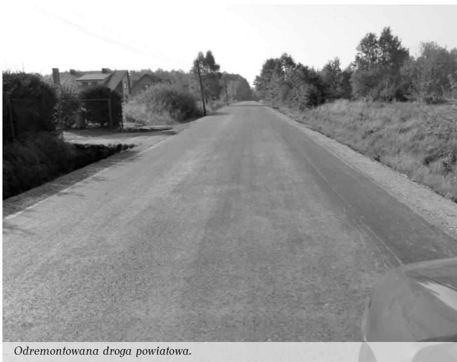
Odremontowana droga powiatowa.