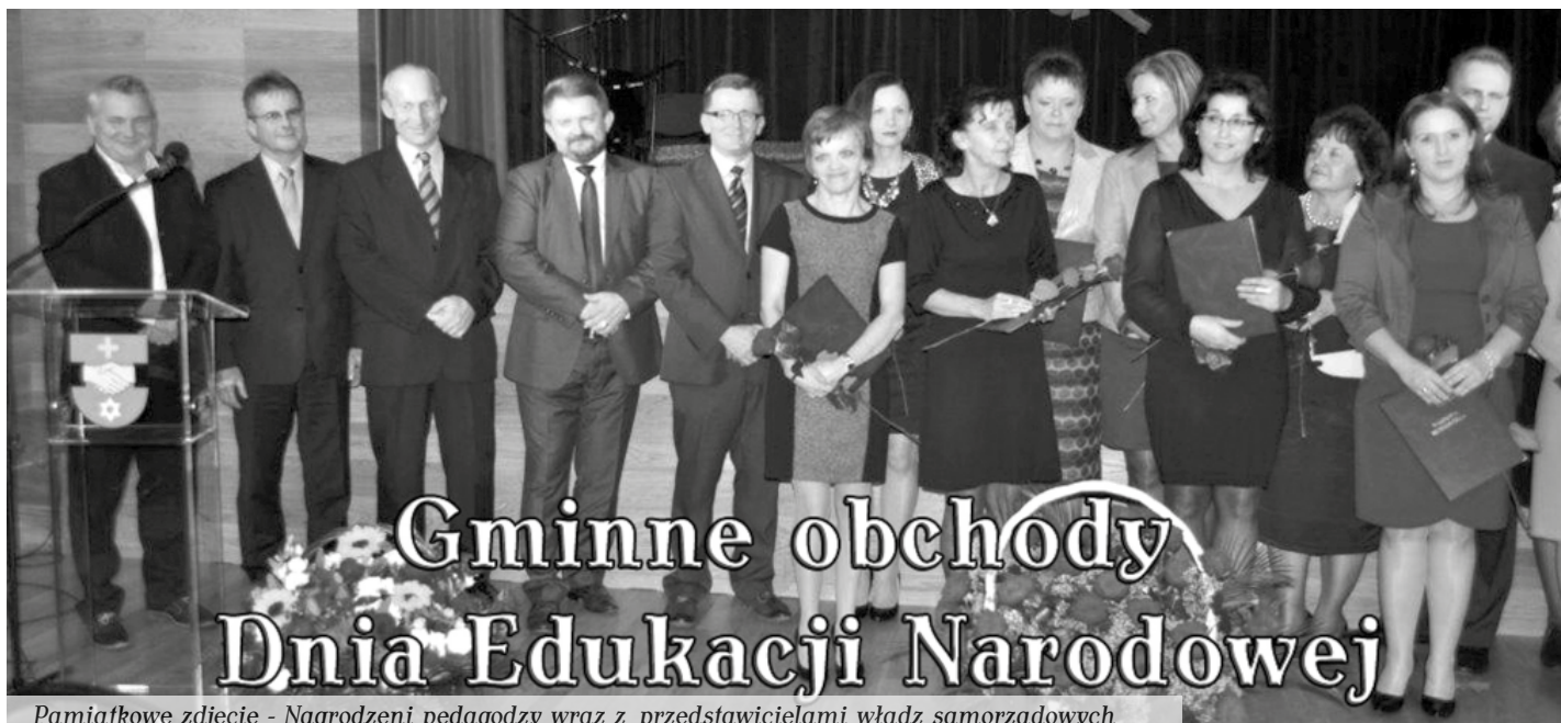
Pamiątkowe zdjęcie - Nagrodzeni pedagodzy wraz z przedstawicielami władz samorządowych

23 pedagogów kolbuszowskich szkół, podczas nauczycielskiego święta, otrzymało Nagrody Burmistrza Kolbuszowej. W poniedziałek, 13 października, odbyło się spotkanie kolbuszowskich władz samorządowych z nauczycielami oraz pracownikami gminnej oświaty.