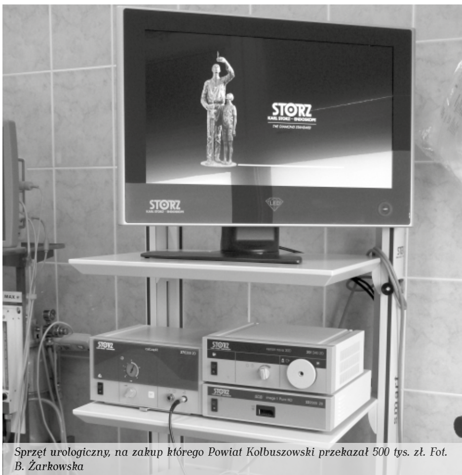
Sprzęt urologiczny, na zakup którego Powiat Kolbuszowski przekazał 500 tys. zł.