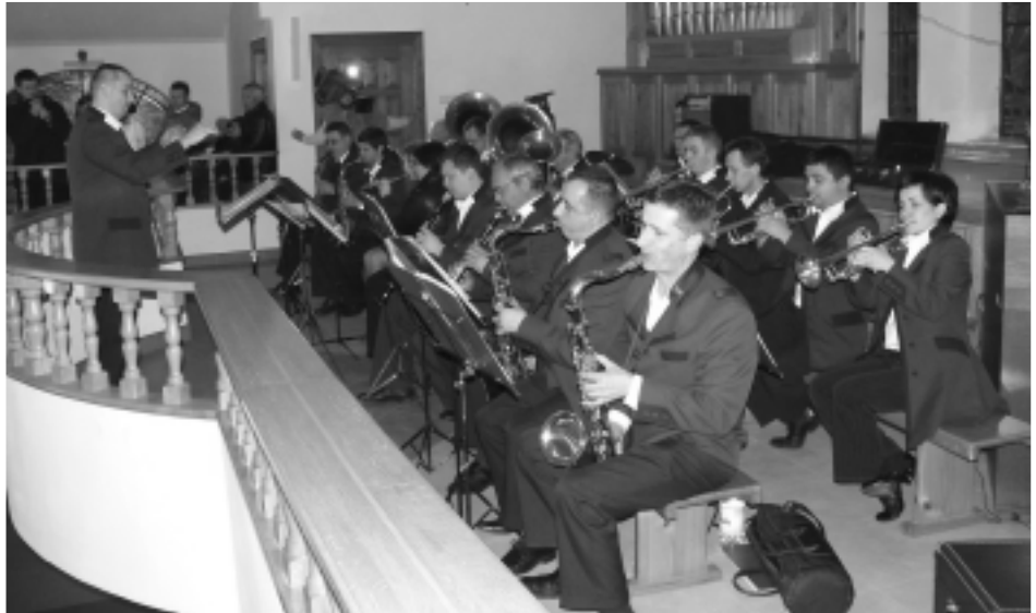
Orkiestra dęta MDK w Kolbuszowej

Wykonywane na najwyższym poziomie utwory muzyczne i teksty recytatorskie wzruszyły publiczność. Uroczysta