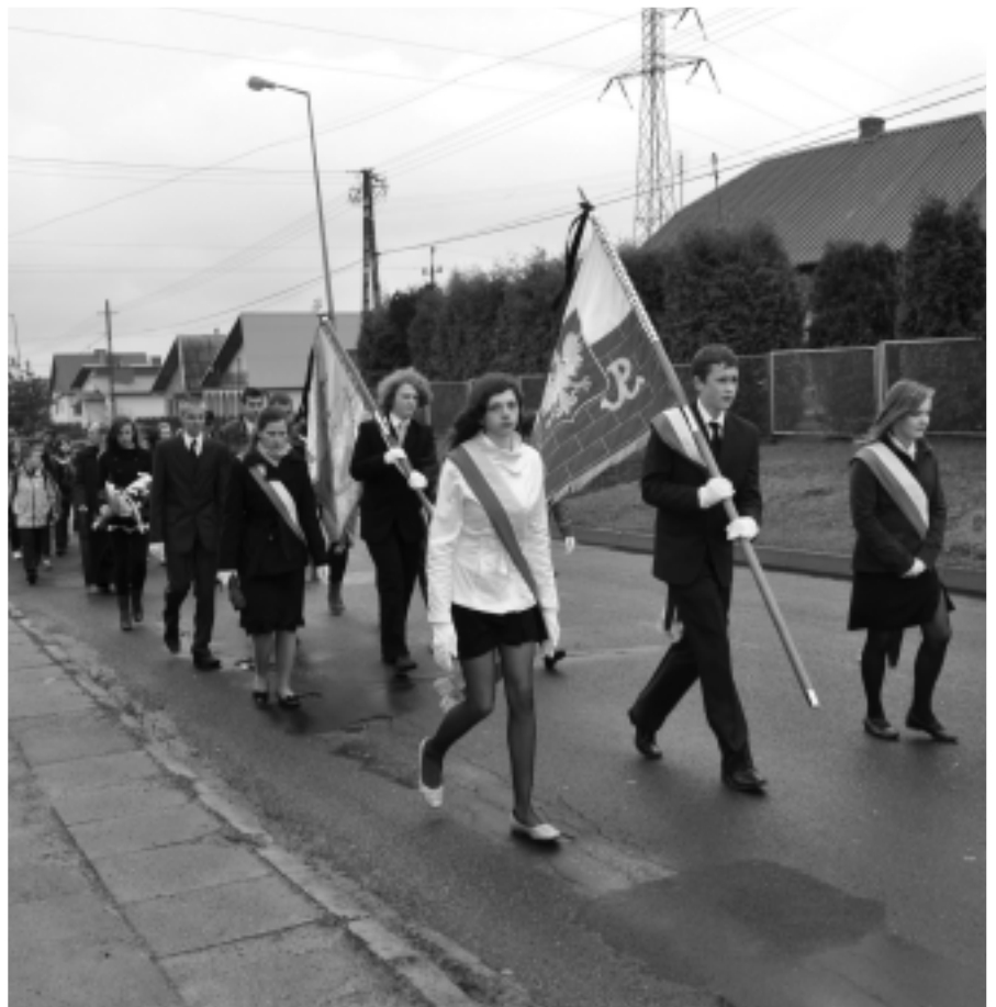
Maszerując w milczeniu kilkaset osób oddało hołd ofiarom katastrofy pod Smoleńskiem