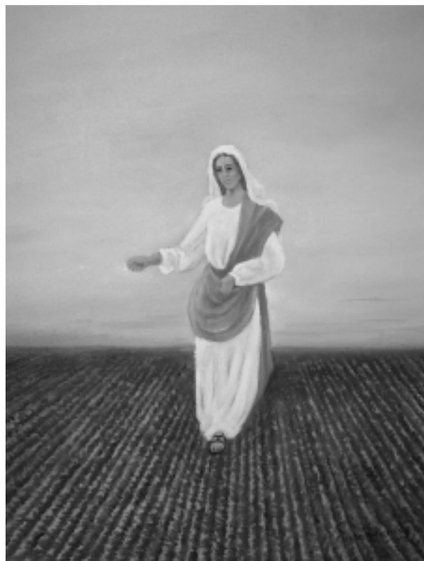
Fot. Matka Boska, mal. St. Pudełkiewicz (Krzeszów)

Najczęściej uprawianymi zbożami były: żyto, pszenica, proso, gryka (tatarka) oraz owies, a przy samym ich sianiu istniało wiele przesądów. Pszenicy i gryki nie można było siać „we dwa wiatła” tzn. w okresie nowiu, gdy słońce i księżyc widać równocześnie. Zboża siano „pod pełnią”, by ziarno było pełne jak księżyc. Siew gryki określano dzie-