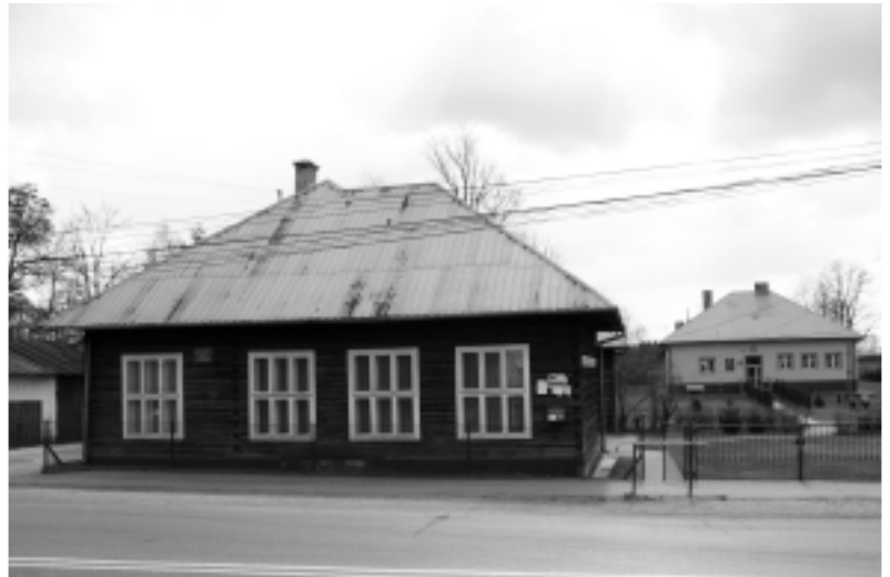
Po lewej "nowa" szkoła, w której znajduje się muzeum. Po prawej szkoła "stara", działająca nadal.