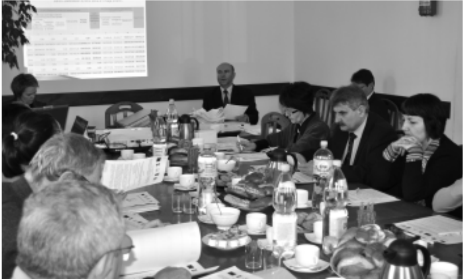
Pierwsze posiedzenie Rady Stowarzyszenia LGD Siedlisko

Do biura Stowarzyszenia Lokalna Grupa Działania „Siedlisko” wpłynęło piętnaście wniosków z Gmin członkowskich, instytucji kultury, stowarzyszeń.