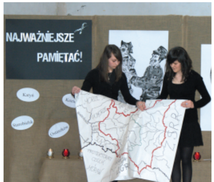
Uroczysta akademia w Zespole Szkół Technicznych