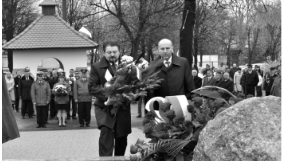
Składanie kwiatów pod pomnikiem na kolbuszowskim rynku