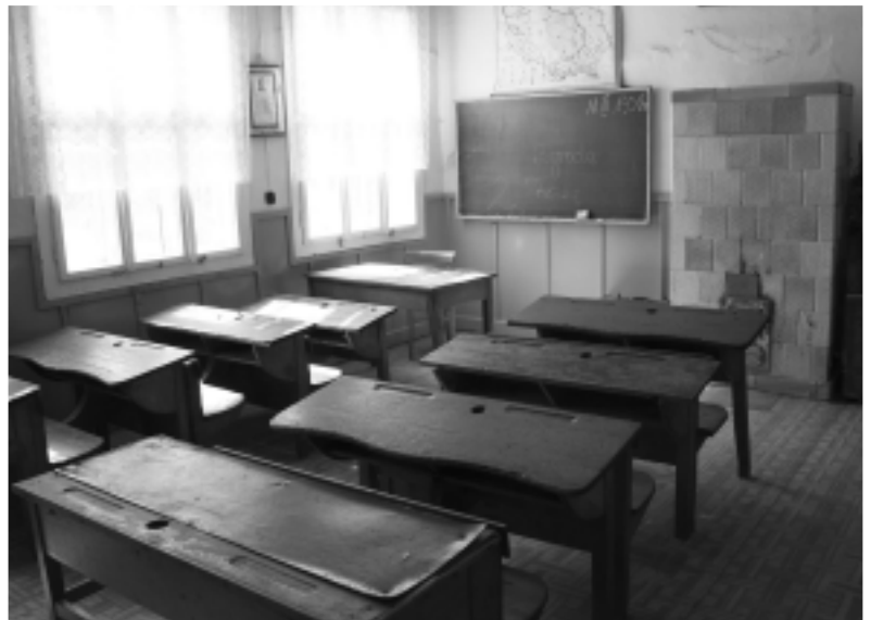
Klasy lekcyjne wyglądają jakby dopiero co były opuszczone przez dzieci