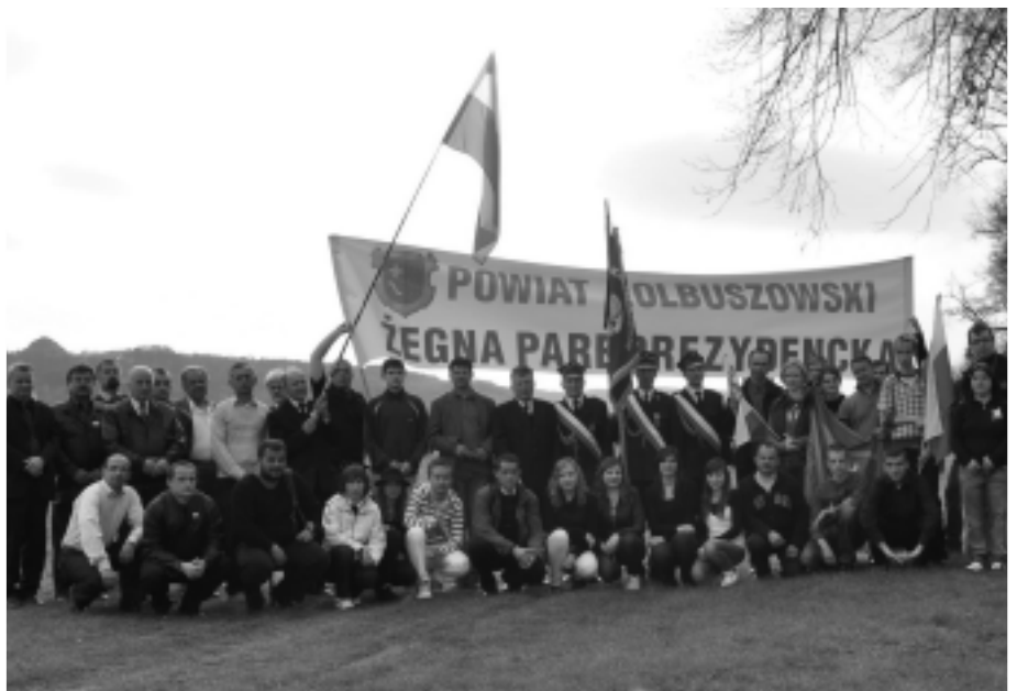
Delegacja z terenu powiatu kolbuszowskiego na Błoniach.