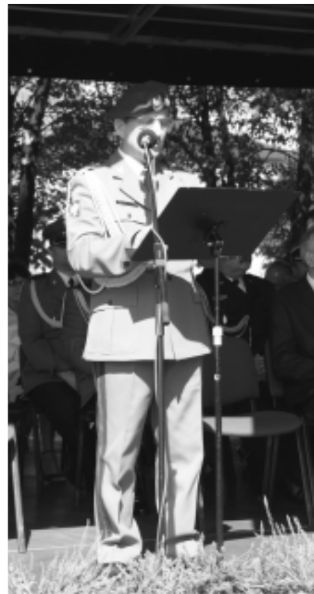
Generał Broni uczestniczył w poświęceniu pomnika Żołnierzy i Bohaterów walczących i poległych za wolność, niepodległość i suwerenność Ojczyzny na kolbuszowskim rynku we wrześniu 2009r.