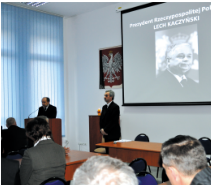
Nadzwyczajna sesja Rady Powiatu z udziałem przedstawicieli wszystkich samorządów w dniu tragedii pod Smoleńskiem