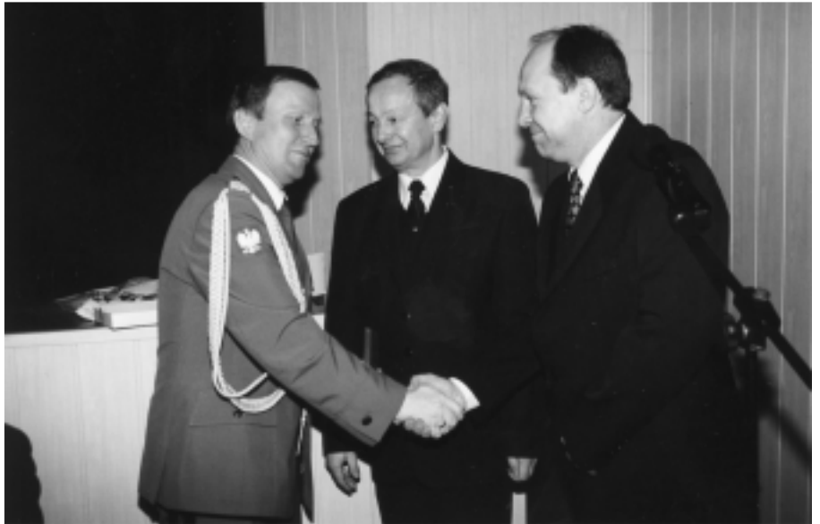
Rok 2000. Spotkanie z okazji zakończenia obchodów 300-lecia miasta Kolbuszowa