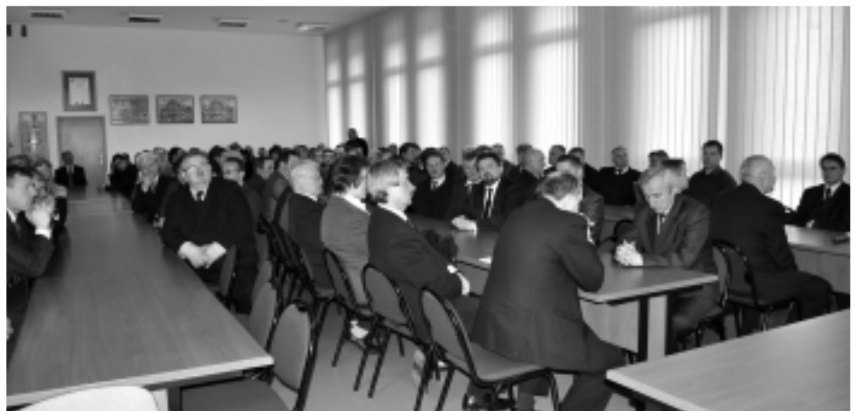
Aula „220” Starostwa Powiatowego w Kolbuszowej na XLII Nadzwyczajnej Sesji Rady Powiatu była wypełniona po brzegi przedstawicielami wszystkich samorządów gmin z terenu powiatu kolbuszowskiego.

O godz. 18:00 w Kolegiacie Kolbuszowskiej pw. Wszystkich wiary w Kolbuszowej celebrowali w asztwo kapłani podkreślali wagę oddania się Bożej opiece. W homilii znalazło się szczególnie ważne zdanie, i losami ludzkimi nie kieruje przypadek, ale zawsze - Opatrzność.