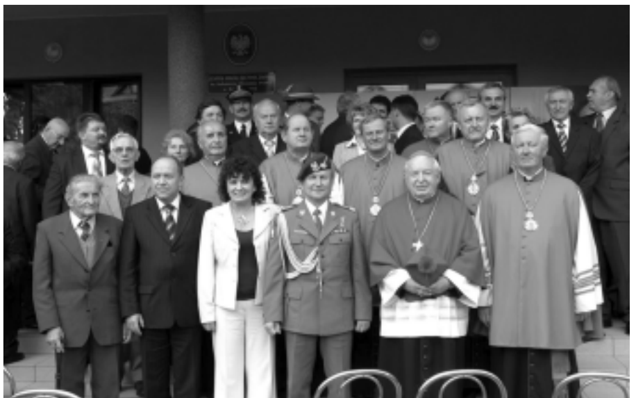
Rok 2007. Uroczystość w Zespole Szkół Technicznych