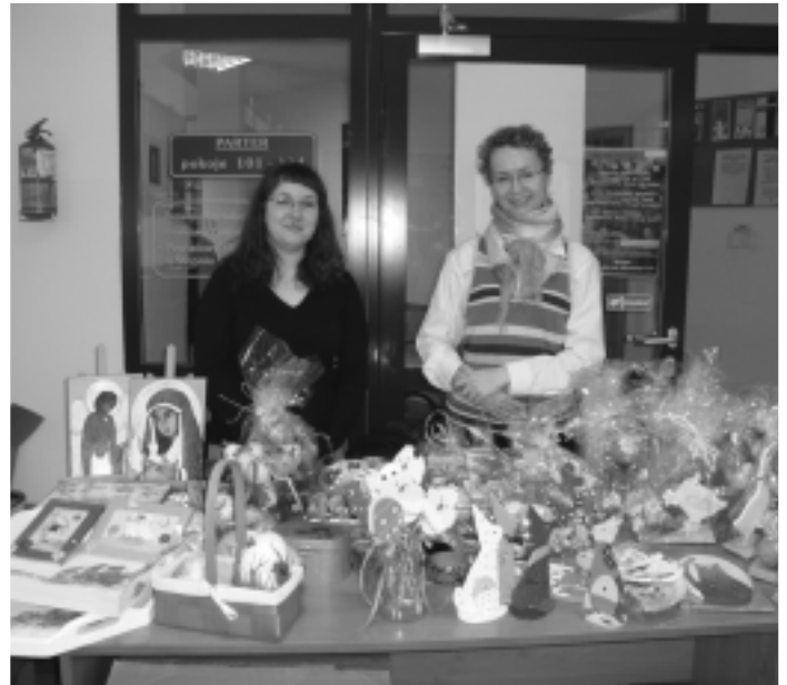
Pracownicy Caritasu sprzedają prace swoich podopiecznych