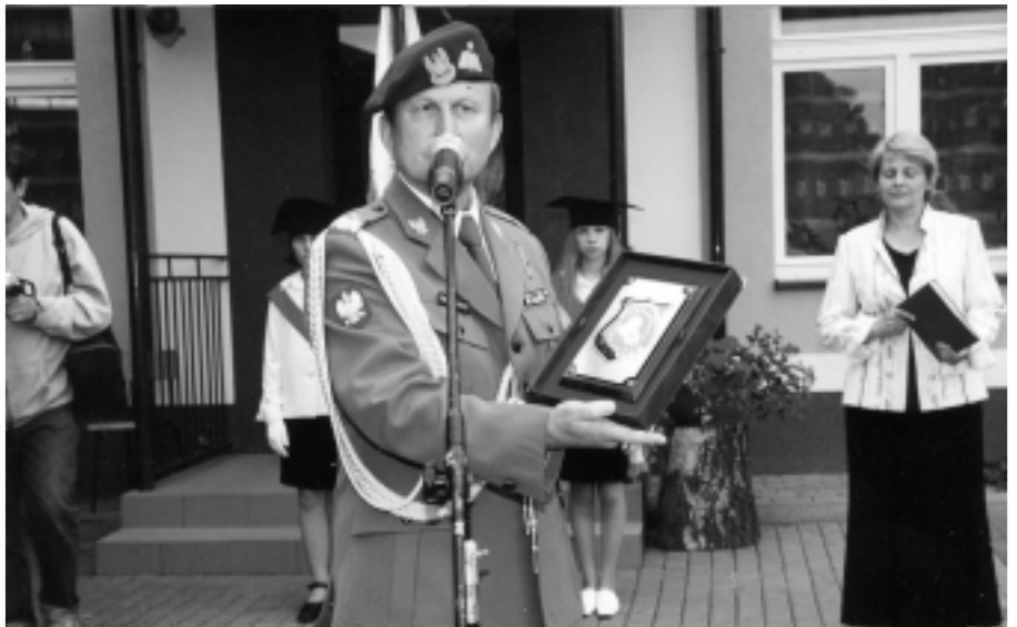
Rok 2004. Uroczystości Jubileuszowe 500-lecia wsi Werynia