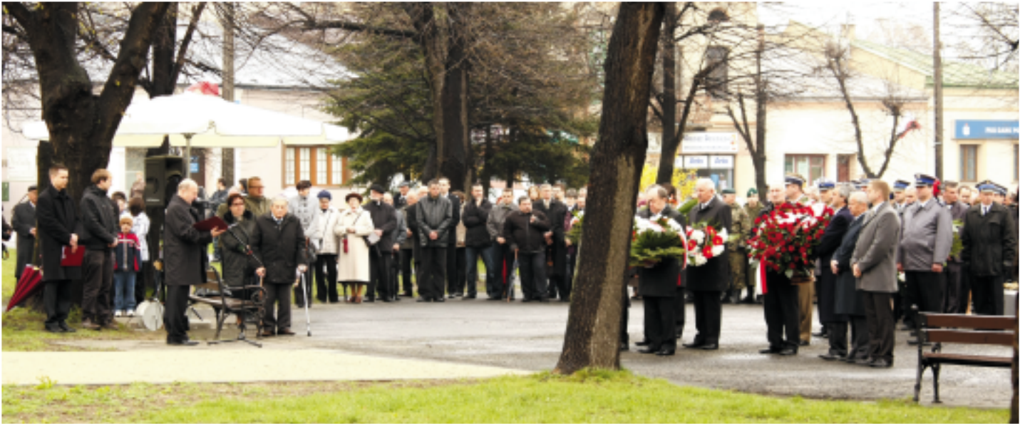
11 kwietnia - Uroczystości Katyńskie na rynku kolbuszowskim