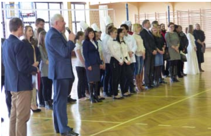
Uroczyste otwarcie.