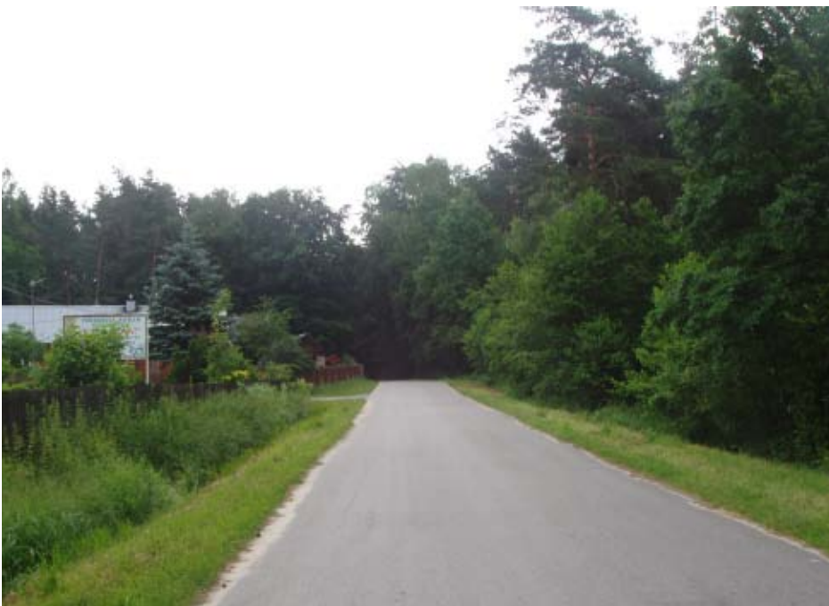
Droga Poręby Kupieńskie-Bratkowice, przy której, w lesie, znajduje się bezimienna mogiła trzech „własowców”

„W ciągu mojego długiego życia zastanawiałem się nieraz, czy warunki wojenne w Głogowie i związane z nimi przeżycia należały do trudnych. W Głogowie, tak jak i w wielu miejscach na terenie powiatu kolbuszowskiego (Przyłęk, Kosowy, Huta Komorowska itp.), stacjonowały oddziały wojskowe okupanta. Widziałem na własne oczy wiele zbudowanych bunkrów w Rynku Głogowa i jego otoczeniu, przechodząc prawie codziennie, ocierałem się o nich. Takim schowkiem do przechowywania amunicji dla armii niemieckiej był Las Głogowski. Niemal codziennie widziałem samochody przejeżdżające przez