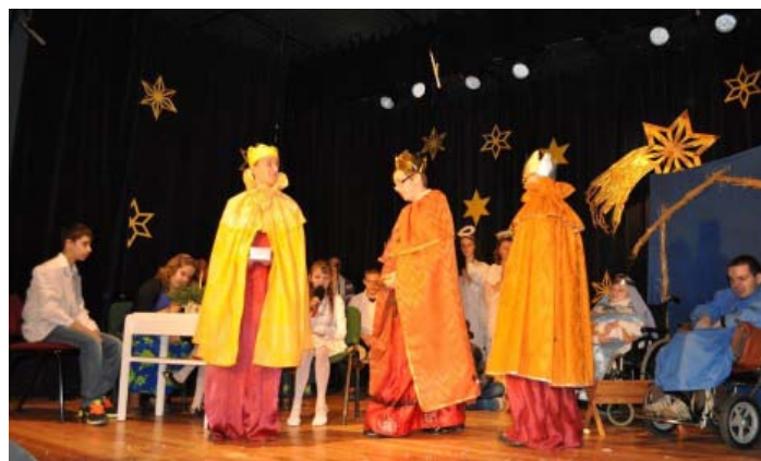
Występy uczestników konkursu