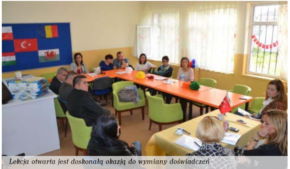
Lekcja otwarta jest doskonałą okazją do wymiany doświadczeń

Jednym z ostatnich wydarzeń, które odbyło się w ramach projektu, był wyjazd grupy nauczycieli na wizytę studyjną do Turcji. Podczas wyjazdu mieliśmy okazję poznać historię, architekturę, kulturę i język tego kraju, jednak najważniejszym dla nas było poznanie systemu edukacyjnego, szczególnie szkolnictwa specjalnego, form i metod pracy, które stosują nauczy-