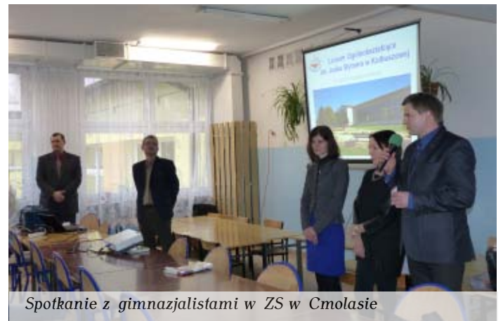
Spotkanie z gimnazjalistami w ZS w Cmolasie

Młodzież na slajdach mogła zobaczyć urządzenia, na jakich pracują ich starsi koledzy w RCNTW