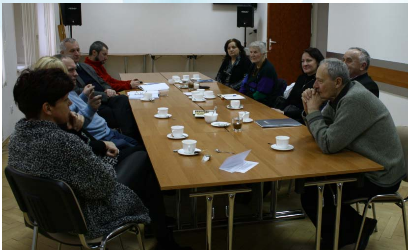
Posiedzenie Zarządu Regionalnego Towarzystwa Kultury im. JM Gosłara. Na którym omówiono plan pracy na rok 2015.