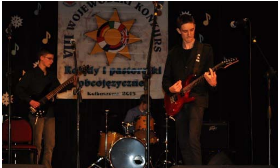
Występ zespołu ubiegającego się o zwycięstwo