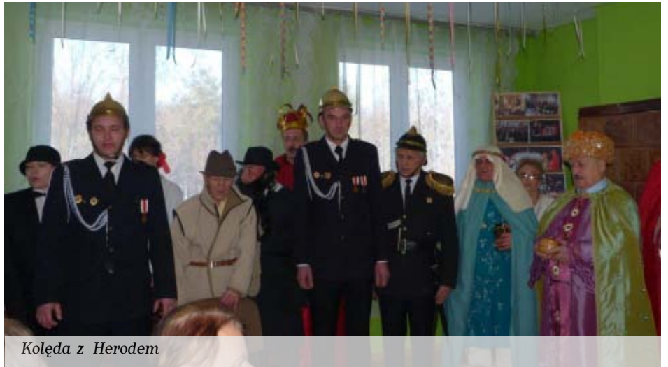
Kolęda z Herodem

Wszystkim, którzy brali udział w przygotowaniu powyższej uroczystości,