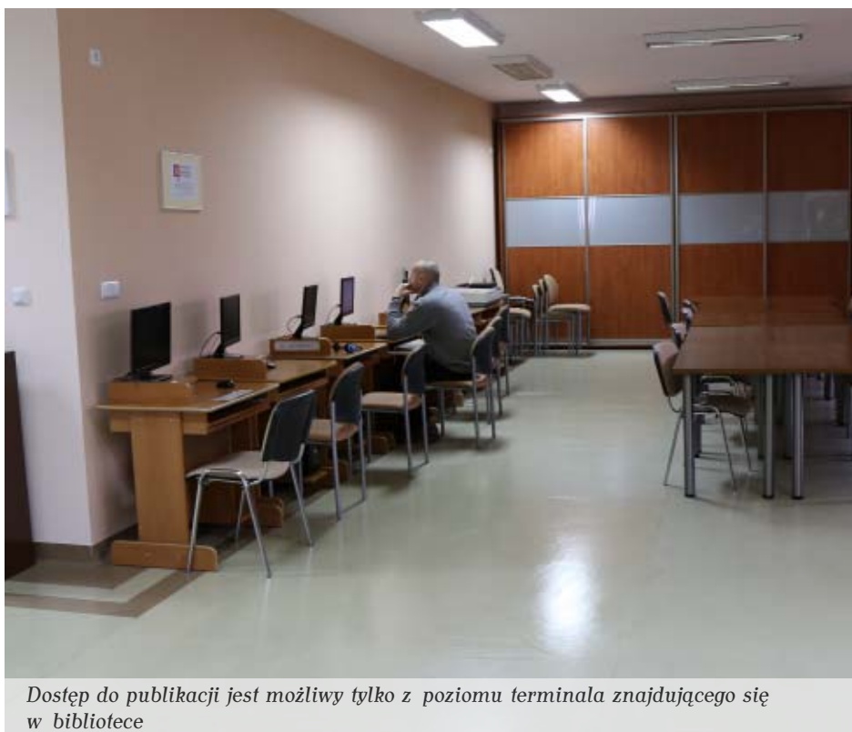
Dostęp do publikacji jest możliwy tylko z poziomu terminala znajdującego się w bibliotece

W ACADEMICE znajdziemy przede wszystkim publikacje z lat 1990-2012: podręczniki akademickie, prace naukowe, wybrane czasopisma naukowe z wszystkich dziedzin wiedzy. Twórcy systemu chcą w ten sposób umożliwić szerszy dostęp do książek i czasopism naukowych. Wyszukiwarka publikacji znajduje się pod adresem academica.edu.pl ,