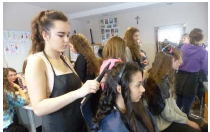
Warsztaty fryzjerskie w ZST w Kolbuszowej