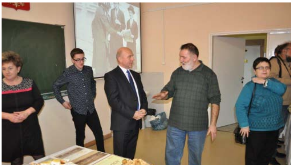
Degustacja potraw żydowskich przygotowała restauracja CK Galicja