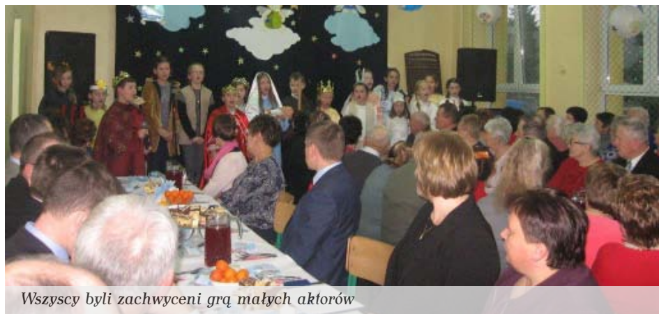
Wszyscy byli zachwyceni grą małych aktorów

W świąteczny nastrój wprowadzili zebranych rozśpiewani uczniowie ze Szkoły Podstawowej w Bukowcu inscenizacją, wyróżnioną podczas Podkarpackiego Przeglądu Teatralnego „Jasełka 2015” w Jarosławiu, pt. „Tak, to On jest Królem”. Przedstawiając historię narodzenia Jezusa, widzianą oczami współczesnego czło-