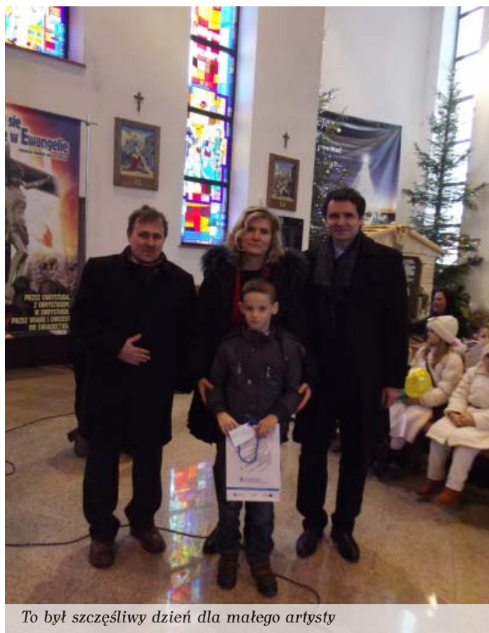
To był szczęśliwy dzień dla małego artysty