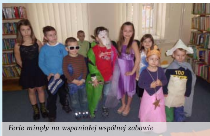
Ferie minęły na wspólniej zabawie