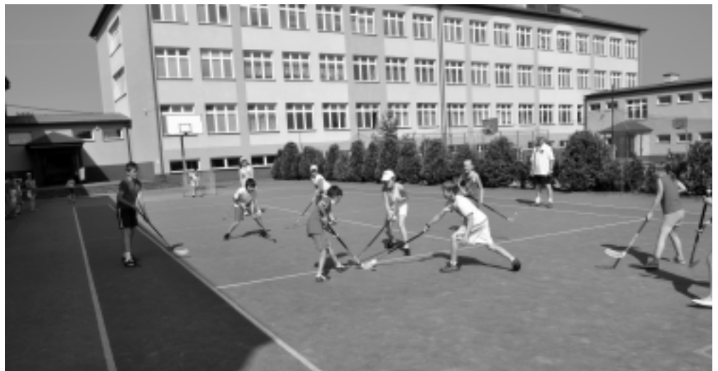
Rozgrywki w ramach obchodów Patrona Szkoły