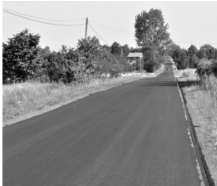
Zakończono remont drogi powiatowej nr 1 225 R Kosowice – Niwiska na długości odcinka 1605 mb. A. Jarosz