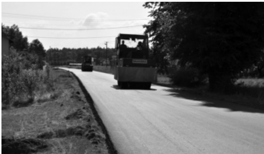
W trakcie remontu jest droga powiatowa nr 1 206 R Wola Raniowska przez wieś. Długość zmodernizowanego odcinka 603 mb.

W trakcie realizacji budowy jest parking wraz z kanalizacją. Po zakończeniu budowy zmodernizowana zostanie droga powiatowa nr 1 220 R Wielkie Pole – Mechowiec na odcinku 1344 mb. Wartość zadania: 375 523,32 zł.