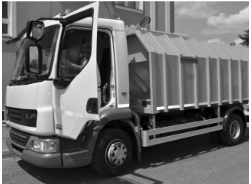
Nowy samochód zajęchał pod Urz d Miejski w Kolbuszowej

Poziom współfinansowania projektu „Zakup mieciarki obsługuj ce obszary wiejskie na terenie gminy Kolbuszowa” wynosi 75% kosztów kwalifikowanych. Całkowita warto przedsi wzi cia to 323 300 tys. zł. Dofinansowanie z EFRROW wynosi 198 750 ty . zł. rodki własne gminy to 123 ty .zł, czyli 25%.