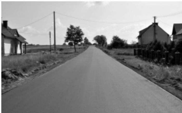
Zakończono remont odcinka nr 1 208 R Porby Wolskie – Posuchy na długości odcinka 1168 mb.