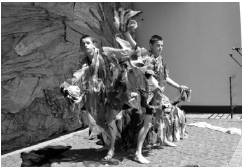
Przedstawienie taneczne w wykonaniu uczniów Szkoły Specjalnej w Kolbuszowej

Ide przegl du jest promowanie twórczo ci osób niepełnosprawnych. Jednak