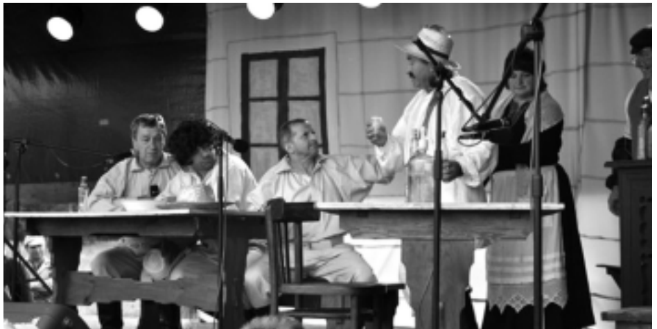
Wyst p artystów podczas Sobótek 2010

grał zespół Two Ways, przy muzyce którego mieszkacy próbowali swoich sił na parkiecie.