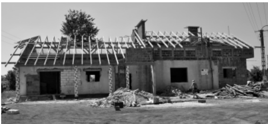
Prace remontowe, pomimo upałów, postępują zgodnie z planem

W drodze przetargu wyłoniono wykonawcę - firmę PDEM Sp. z o.o. z Niebyleca. Do chwili obecnej: wykonano roboty rozbiórkowe, rozebrano stropy i dach, w ich miejscu powstały nowe stropy oraz postawiono mury poddasza. Ponadto w końcowym etapie jest budowa konstrukcji dachowej. Roboty, które pozostały do zrealizowania to: wykonanie pokrycia dachu, roboty instalacyjno-wykończeniowe, montaż instalacji sanitarnych i elektrycznych, wymiana stolarki okiennej i drzwi-