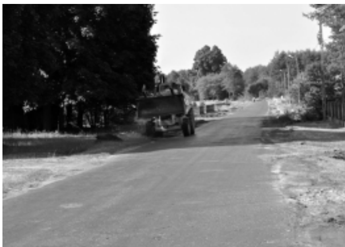
W trakcie remontu jest droga powiatowa nr 1 162 R Rzechów – Przyłęk na długości odcinka 1150 mb. A. Jarosz