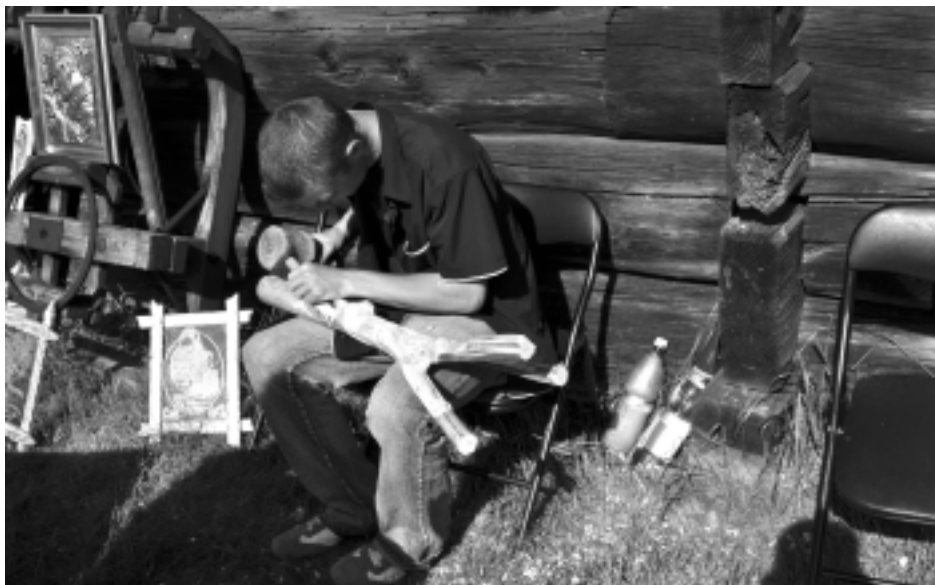
Artysta rzeźbiarz podczas pracy