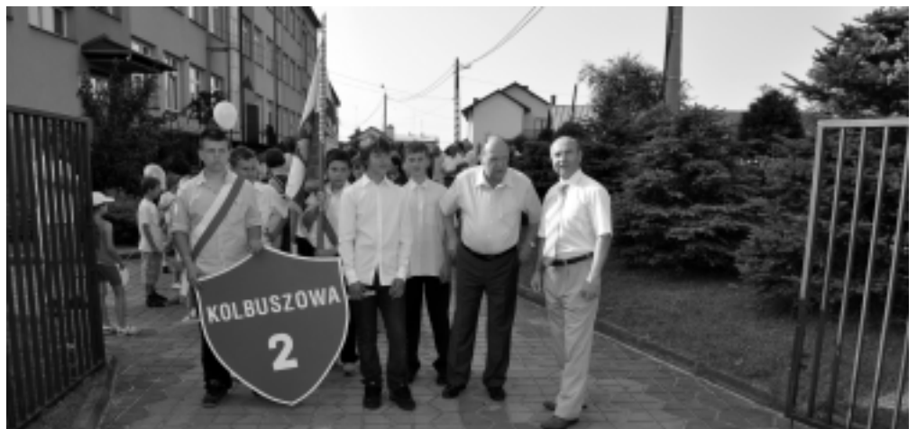
Korowód rozpoczął obchody Patrona Szkoły