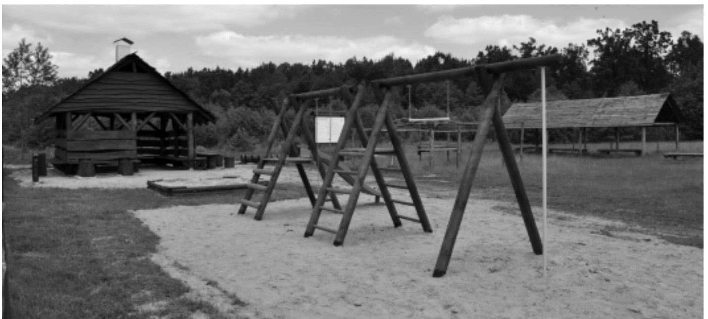
Na przystankach rowerowych można spotkać różnorodne atrakcje