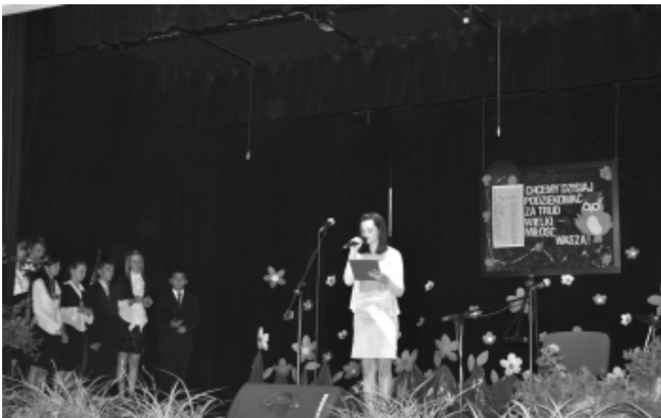
Ostatni występ dla nauczycieli i uczniów tej szkoły

Dziękowali za wszystko: codzienny wysiłek, wspólne nerwy przed klasówką, a przede wszystkim za sprawienie, że każdy z tych minionych dni był wyjątkowy, niezwykły, magiczny. Sami odebrali mądre wskazówki i życzenia na kolejny etap swojej edukacji. Były kwiaty, życze-