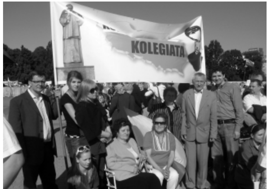
Kolbuszowianie na Mszy wi tej Beatyfikacyjnej w Warszawie