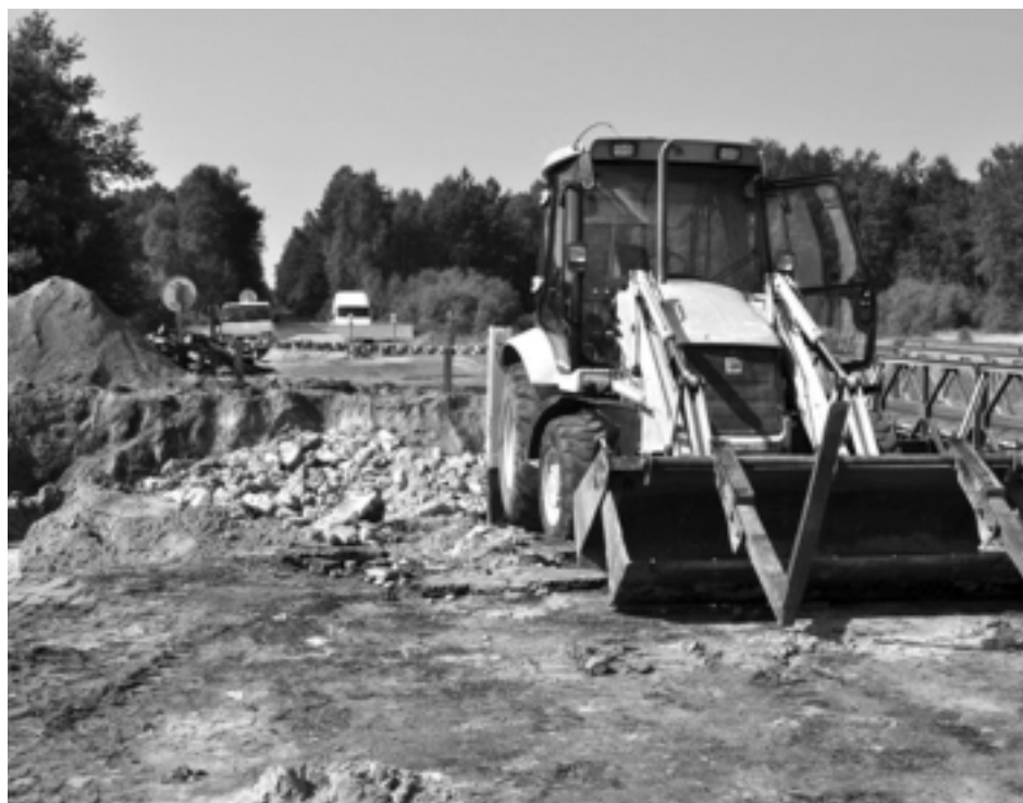
Trwa przebudowa mostu w ciągu drogi powiatowej nr 1 226 R Cmolasa – wierzów.

Powiat Kolbuszowski wystąpił z wnioskiem do Ministerstwa Infrastruktury o dofinansowanie inwestycji drogowych z rezerwy subwencji ogólnej na przebudowę mostu w ciągu drogi powiatowej nr 1 226 R Cmolasa – wierzów.