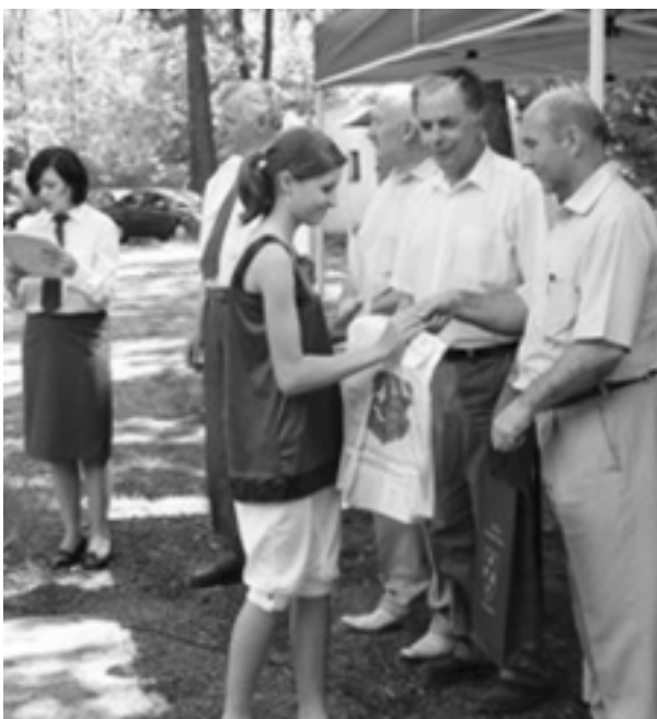
Wr czenie nagród