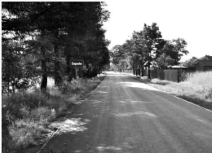
Zakończono remont drogi powiatowej nr 1 227 R Trzebież – Zapole – Domatków na długości odcinka 2128 mb. A. Jarosz