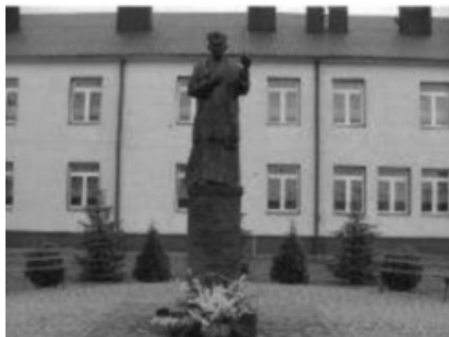
W tej szkole uczyli się laureaci konkursu

O wielu miejscowościach powstały liczne monografie, a w Internecie da się na ich temat odnaleźć niemal wszystko. Jednak w „Atlasie” można napisać o swojej wsi zupełnie inaczej: o grzybobraniu, placach zabaw, ujemnym bądź dodatnim przyrodzie naturalnym, wyjeżdżaniu za chlebem, bądź napływem nowych miesz-