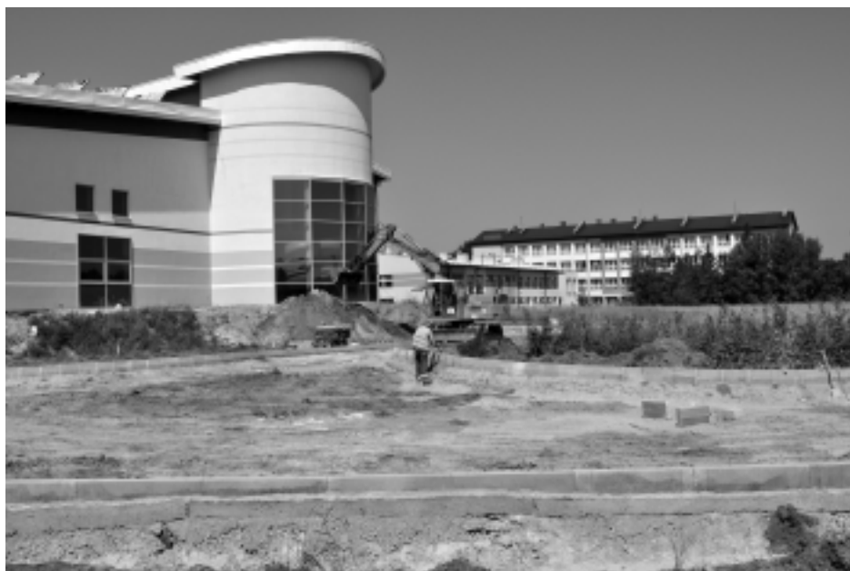
Droga dojazdowa, obszerny parking, kort tenisowy, boisko do gry w piłkę siatkową są w trakcie budowy

W piwnicach, gdzie zainstalowano już główne urządzenia obsługujące baseny, znajdują się również inne pomieszczenia dla pracowników technicznych,