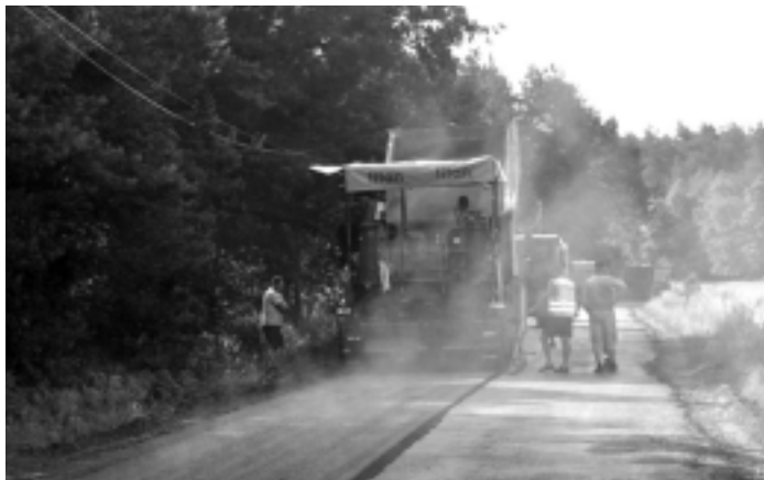
W trakcie remontu jest droga powiatowa nr 1 223 R Ostrowy Tuszowskie – Trzósówka – Siedlanka na długości 1120 mb.