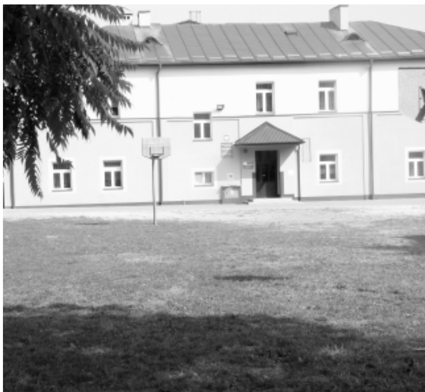
W odpowiednio wyposażonej szkole każde dziecko chciało się uczyć

Ich zadaniem jest zapewnienie możliwości organizacji zabaw ruchowych, zgodnie z naturalnymi potrzebami rozwojowymi dzieci, związanymi z dużą aktywnością fizyczną. Miejsca zabaw będą wyposażone w przyrządy pozwalające na zaspokojenie przez dziecko potrzeby ruchu i obejmować będą w szczególności: duże, miękkie klocki, miękkie piłki w różnych kolorach i wielkościach, materace do zabaw, tory przeszkód, elementy lub zestawy umożliwiający pokonywanie wysokości, a zarazem usprawniające koordynację wzrokowo – ruchową. Powinny też być wyposażone w sprzęt spełniający funkcje edukacyjne i usprawniający małą motorykę (układanki czy klocki tematyczne, zachęcające dzieci do zabaw i zajęć z rówieśnikami). Natomiast po intensywnym ruchu i zabawie każde dziecko powinno mieć możliwość wyciszenia, relaksu czy indywidualnej pracy. Służąc temu powinien obszar sali, w którym znajdują się urządzenia pozwalające na rozwijanie uzdolnień i zainteresowań (np. plastycznych, konstrukcyjnych), ale jednocześnie umożliwiać odpoczynek i wyciszenie w dogodnej pozycji (materace, pufy).