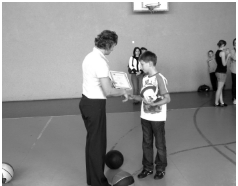
Wręczenie dyplomów i nagród