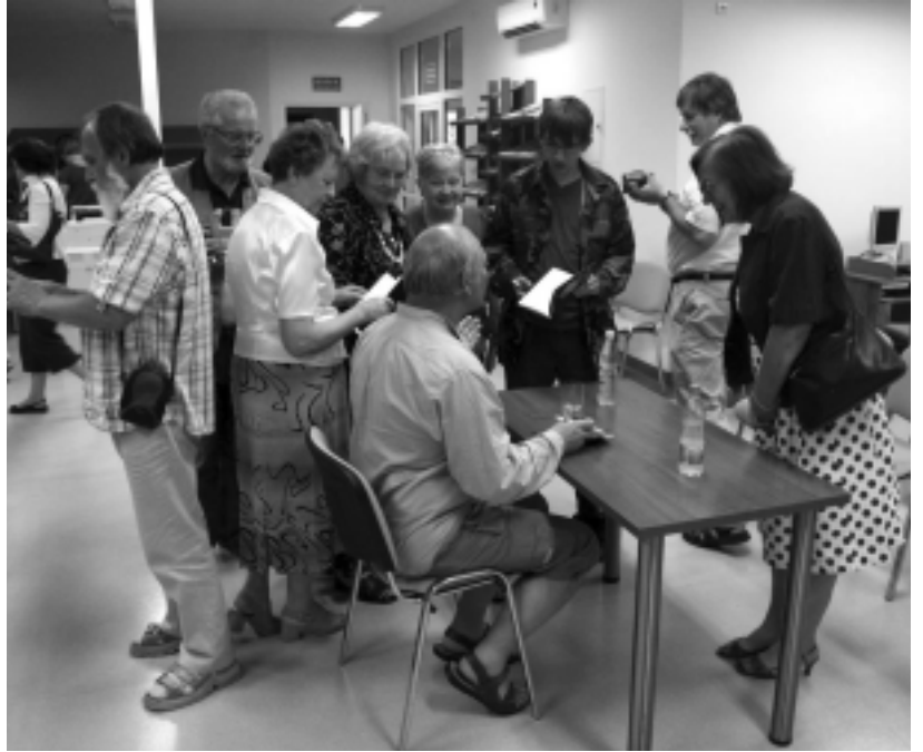
Pisarz chętnie rozmawiał z Kolbuszowianami