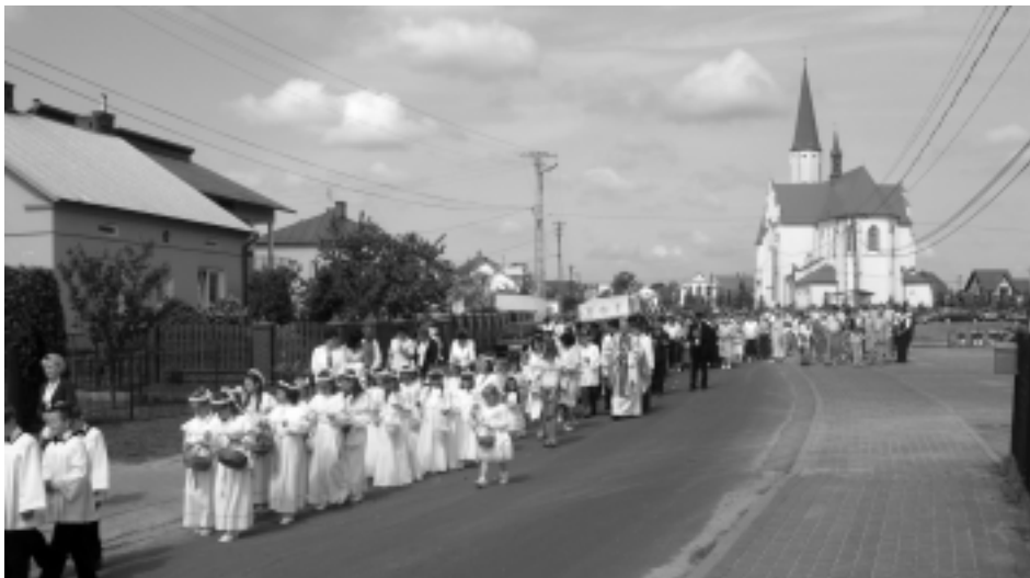
Doroczne procesja w Woli Rani owskiej

W Polsce Bo e Ciało obchodzi si w czwartek po oktawie Zesłania Ducha wi tego, a wi c jest to wi to ruchome wypadaj ce zawsze 60 dni po Wielkanocy. Uroczysto ta jest okaz do dzi czczenia i radosnego manifestowania swojej wiary. Nieodł czynnym elementem tej uroczysto ci jest procesja eucharystyczna ulicami naszych miast i wiosek. Jezus Chrystus idzie w ten dzie do nas, aby zobaczy jak yjemy, aby zagl dn do naszych mieszka , do naszych miejsc pracy, do szkół, wsz dzie tam, gdzie przezywamy na co dzie . Chrystus chce dzisiaj zobaczy , jakimi w rzeczywiście ci jeste my.