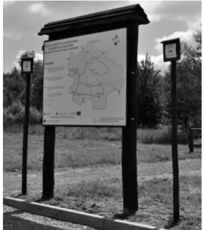
Mapka, na której zamieszczono przyrodniczy szlak

Szlaki biegną głównie drogami asfaltowymi o małym natężeniu ruchu drogowego.