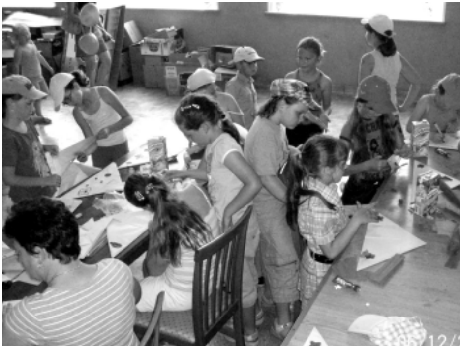
Dzieci bawiły si wspaniale