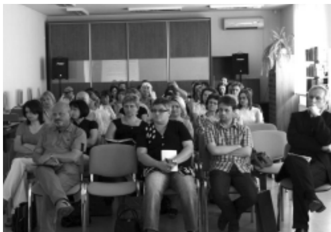
Go cie z uwag słuchali prelegentów