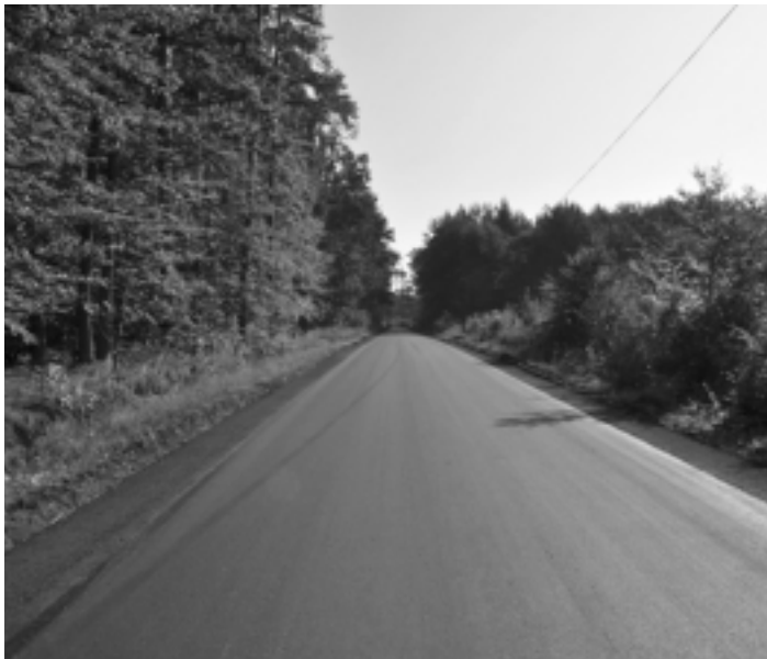
Zakończono remont drogi powiatowej nr 1 230 R Nowa Wieś – Zapole – Hucisko w gminie Kolbuszowa. Długość zmodernizowanego odcinka 330 mb.

Zakończono remont drogi powiatowej nr 1 230 R Nowa Wieś – Zapole – Hucisko w gminie Kolbuszowa. Długość zmodernizowanego odcinka 330 mb. Wartość zadania 70 154,88 zł.