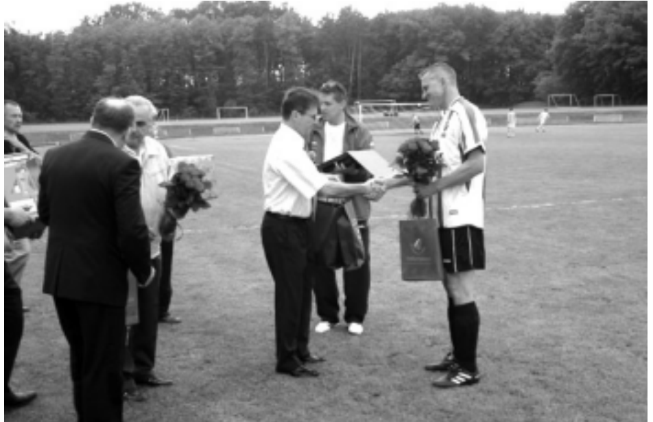
Gorące słowa podziękowania za wieloletni gr