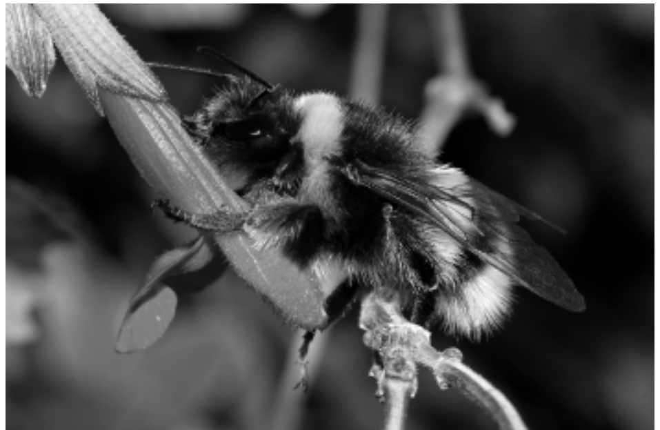
Trzmieł Ziemy - przedstawiciel owadów błonkoskrzydłych