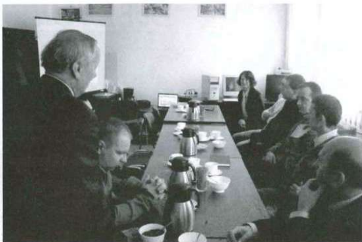
W konferencji podsumowującej działanie sieci WiMAX na terenie Kolbuszowej udział wzięli przedstawiciele gmin powiatu kolbuszowskiego. (fot. S. Tęcza).