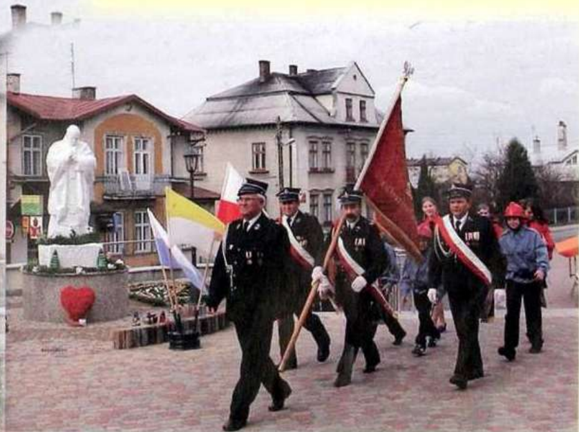
Pomnik Jana Pawła II na placu przykościelnym Parafii Wszystkich Świętych w Kolbuszowej