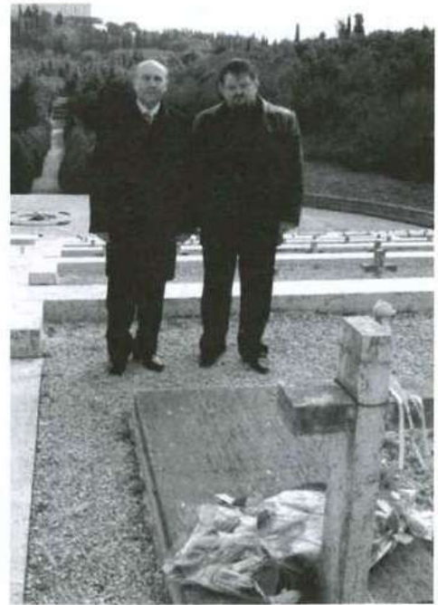
Samorządowcy oddali hold żołnierzom spoczywającym na polskim cmentarzu. Na grobach trzech żołnierzy z powiatu kolbuszowskiego złożyli kwiaty.

Głównym punktem programu przedstawiceli Kolbuszowej we Włoszech było uczestnictwo w uroczystościach 65 – lecia zbombardowania miasteczka. W ramach obchodów tej bolesnej dla społeczności Cassino rocznicy odbyło się symboliczne