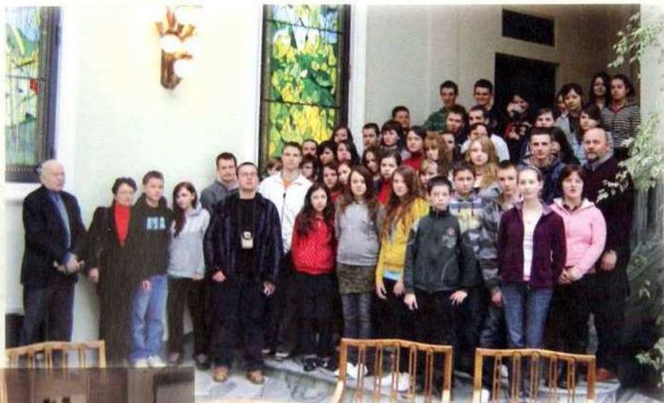
W prezydenckiej oranżerii.

W Pałacu Prezydenckim uczestnicy wycieczki zwiedzili najciekawsze pomieszczenia, związane przede wszystkim z najnowszą historią Polski – salę, w której przed dwudziestoma laty obradował okrągły stół, w której 10 lat temu, w marcu 1999 roku, podpisano przystąpienie Polski do NATO, a później do Unii Europejskiej. W sali tej w XIX wieku jako niespełna 9-letni chłopiec koncertował Fryderyk Chopin. Uczniowie zwiedzili również salę, w której Prezydent Polski przyjmuje głowy państw, salę, w której podejmuje gości obiadem oraz salę, w której Pierwsza Dama spotyka się z gośćmi w celach charytatywnych oraz kaplicę.