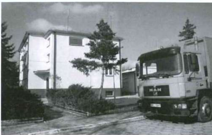
Po remoncie poprawiła się nie tylko estetyka obiektu ale i jego funkcjonalność.