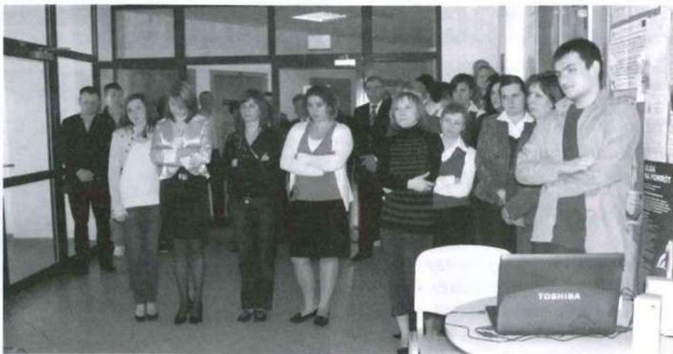
Pracownicy kolbuszowskiego starostwa oddali hold i uczcili pamięć Wielkiego Człowieka przed pamiątkową tablicą poświęconą przez Jana Pawła II w Sandomierzu w 1999 roku usytuowaną w budynku starostwa.

Starosta, Zarząd Powiatu, Przewodniczący Rady, Radni Powiatu Kolbuszowskiego oraz Pracownicy Starostwa Powiatowego w Kolbuszowej