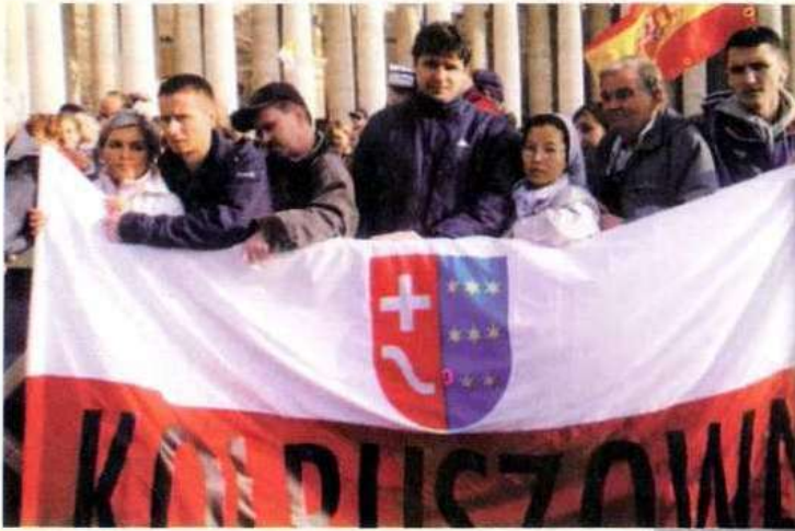
Starosta Kolbuszowski pożegnał Papieża