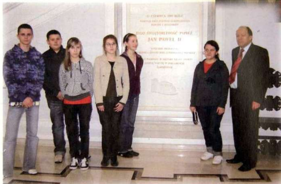
Przed pamiątkową tablicą.

W Sejmie RP odbywały się tego dnia obrady. W związku z tym panowały w budynku Sejmu wzmoczone środki bezpieczeństwa; zabroniono zwiedzającym posiadania przy sobie aparatów fotograficznych i telefonów komórkowych. Przewodnik zapoznał zebranych z historią Sejmu RP.