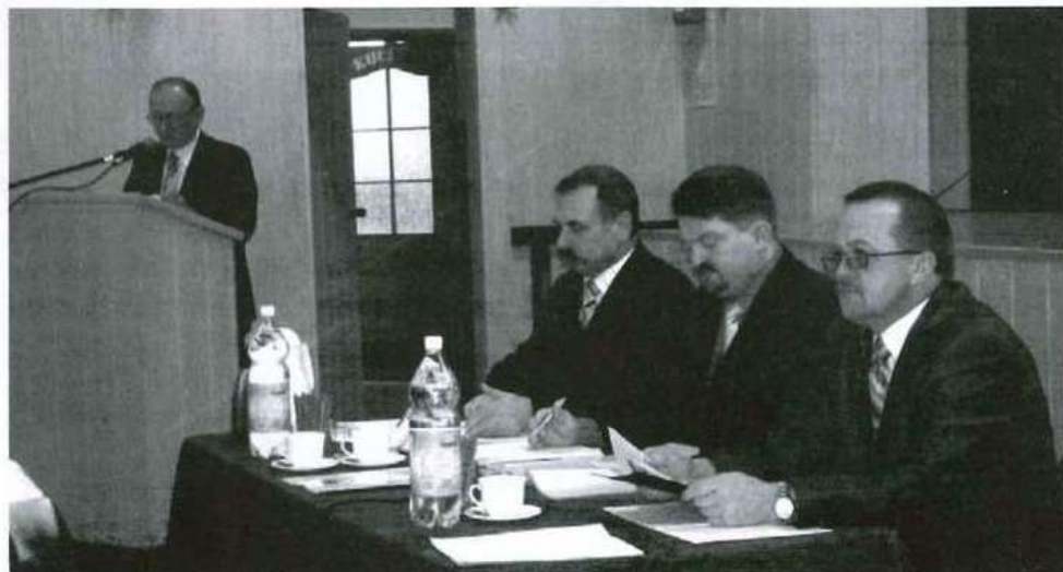
Kolejna sesja już w kwietniu. Wówczas radni będą głosować nad udzieleniem absolutorium z wykonania budżetu burmistrzowi Kolbuszowej.