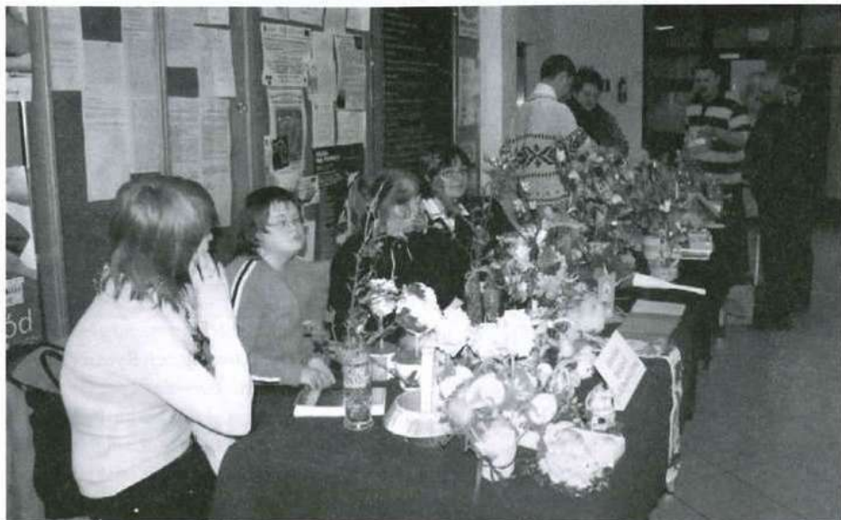
Kiermasz Wielkanocny w starostwie był znakomitą okazją, aby przed niedzielą palmową sprawić sobie wykonane ręcznie ozdoby świąteczne, a przy okazji wesprzeć uzdolnionych plastycznie wychowanków.

Polacy uchodzą za naród lubiący świętować, przywiązany do tradycji, podtrzymujący dawne obyczaje. Związek z tradycją odczuwa się najmocniej w czasie obchodów jednego z największych świąt kościelnych, czyli Wielkanocy.