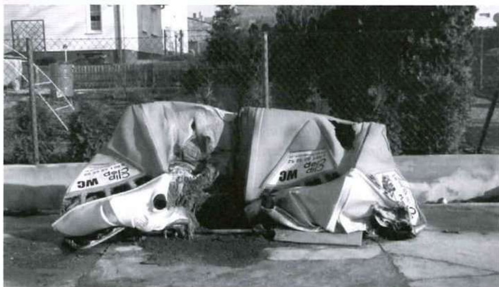
Toalety zostały zupełnie zniszczone.

Mundurowi zajmą się ustalaniem czy spalanie mogło być aktem wandalizmu czy był przypadek.