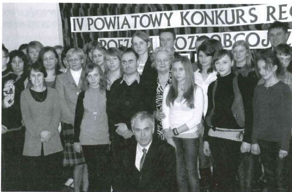
Pamiątkowe zdjęcie uczestników, laureatów, organizatorów, jury IV Powiatowego Konkursu Poezji i Prozy Obcojęzycznej.

Jury oceniało interpretację utworów, umiejętności językowe wykonawców oraz ogólny wyraz artystyczny, a w zakresie kategorii plastycznej: stopień trudności wykonanej pracy, adekwatność treści pracy do treści utworu literackiego, estetykę wykonania pracy.