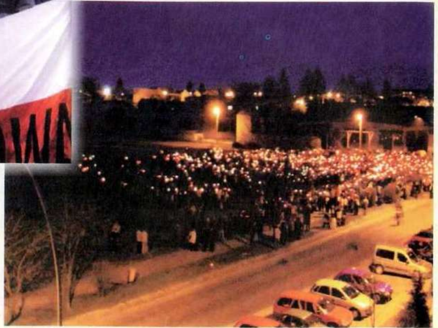
Ulica Jana Pawła II - 7 kwietnia 2005 r.