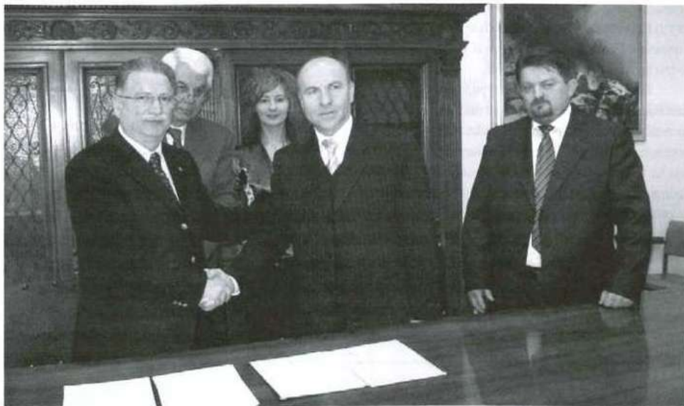
W Cassino podpisano protokół rozpoczynający proces zawarcia umowy partnerskiej.

przekazanie znicza. Przywieziony ze Stuttgartu płomień św. Benedykta – patrona Europy powędrował do Klasztoru św. Benedykta na wzgórzu Monte Cassino. Uroczystość odbyła się w pięknej oprawie artystycznej i muzycznej przygotowanej przez mieszkańców.