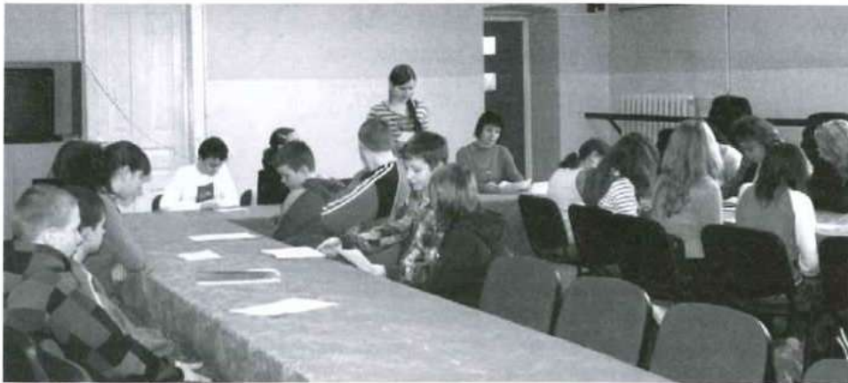
Młodzi rajcy zastanawiają się jak uczcić Światowy Dzień Ziemi