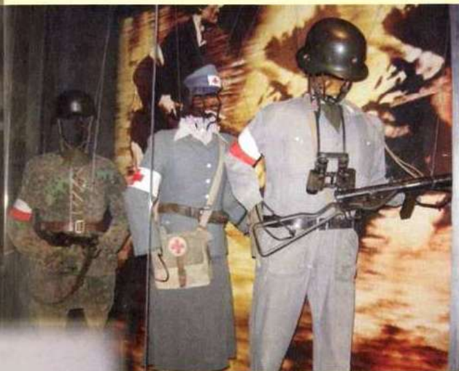
Muzeum Powstania Warszawskiego.