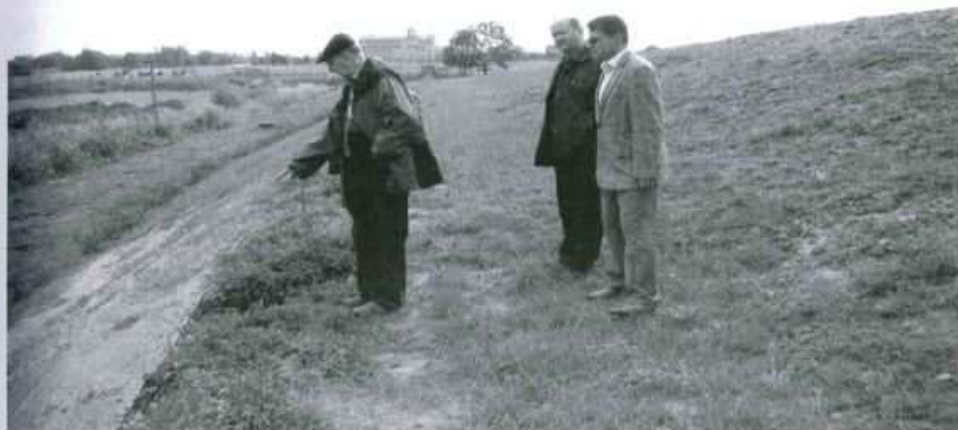
Proces utylizacji odpadów przebiega prawidłowo.