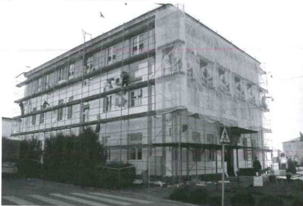
Termomodernizacja Urzędu to część dużego projektu w ramach którego prace prowadzone są łącznie w 12 budynkach użyteczności publicznej. (S. Tęcza)