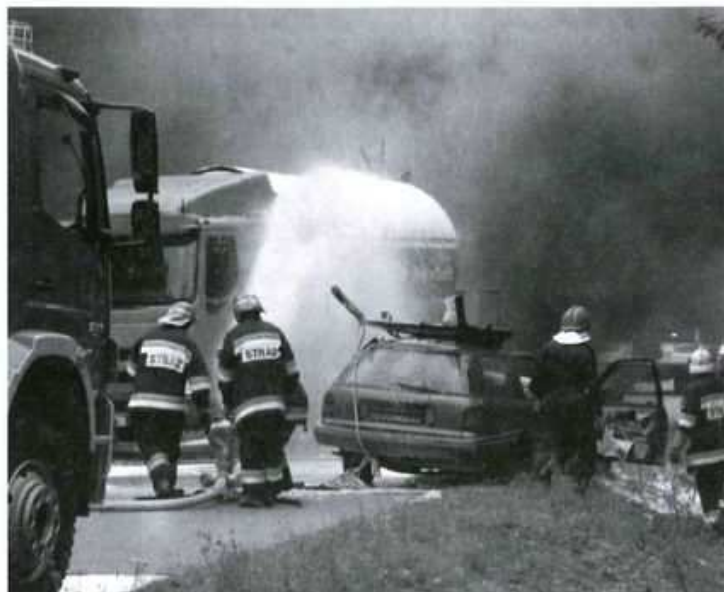
Pozoracja katastrofy komunikacyjnej z cysterną przewożącą gaz propan-butan.

Celem szkolenia było doskonalenie członków zespołu do realizacji zadań określonych w powiatowym planie, sprawdzenie realności przyjętych rozwiązań oraz zdolności powiatowego i gminnych zespołów zarządzania kryzysowego do kierowania realizacją zadań w sytuacji wystąpienia zagrożenia, doskonalenie wykonawstwa dokumentów z zakresu realizacji zadań kryzysowych, sprawdzenie współdziałania PCZK i GCZK w obiegu informacji o zdarzeniach oraz praktyczne sprawdzenie opracowanych standardowych procedur operacyjnych jednostek PSP, Policji i Pogotowia Ratunkowego w przypadku zagrożenia pożarowego i katastrofy komunikacyjnej na bazie Zakładu „Drebud” w Hucie Komorowskiej.