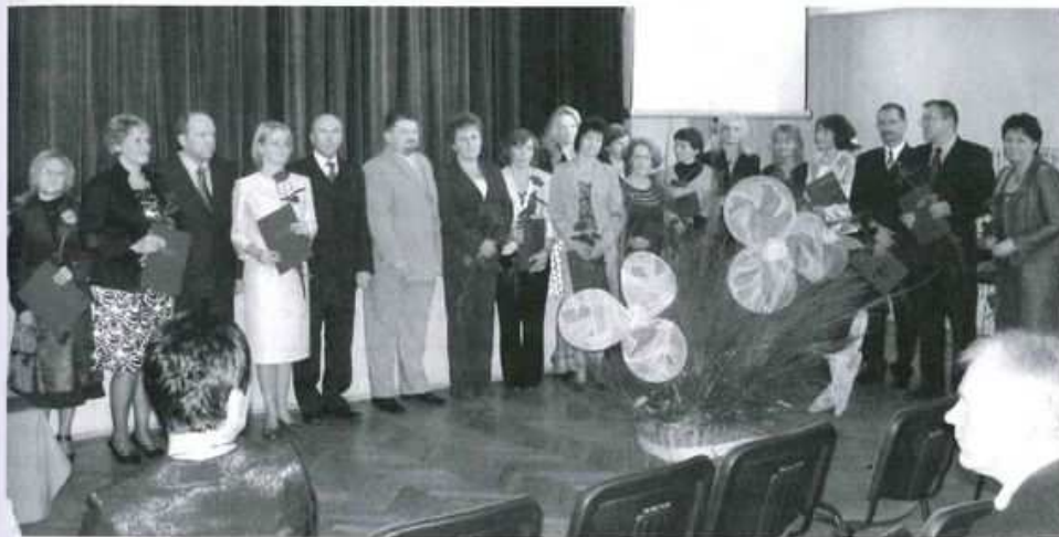
W roku 2007/08 na szczególne wyróżnienie zasłużyło 22 nauczycieli. Za osiągnięcia dydaktyczno-wychowawcze Burmistrz Kolbuszowej wręczył im nagrody.