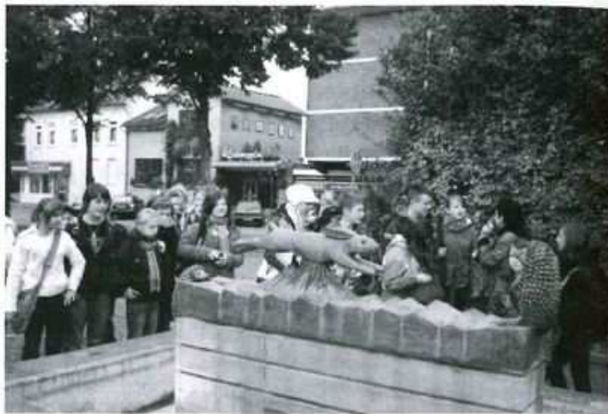
W Buxtehude słuchamy bajki przy pomniku zająca i jeża.

spotykaliśmy się z wielką gościnnością, wyrazami sympatii i troski o samopoczucie i zdrowie naszych uczniów. Bardzo miłym jest również fakt, że osoby, z którymi zetknęliśmy się w czasie poprzednich wizyt w Apensen, w Kolbuszowej oraz świeżo poznani członkowie chóru kościelnego Gospel z Apensen, odwiedzały nas, wspominały ostatnie wizyty. Każdy chciał wiedzieć, co u nas słychać.