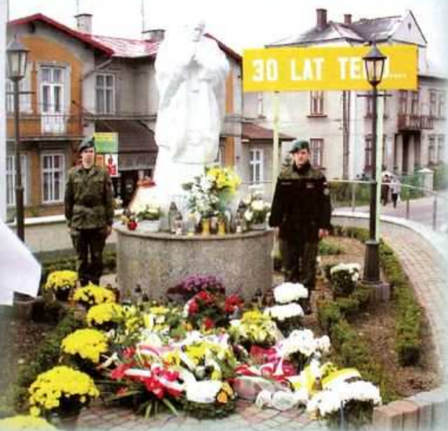
Pomnik Jana Pawła II obok Kolbuszowskiej Kolegiaty