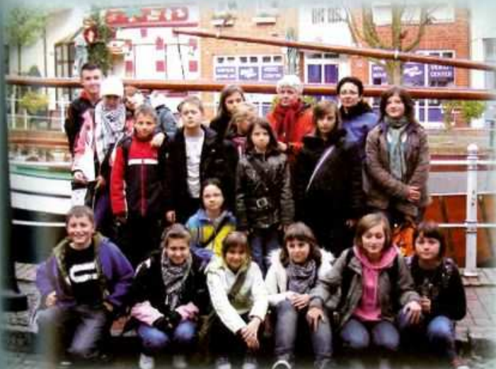
Wycieczka do Buxtehude.