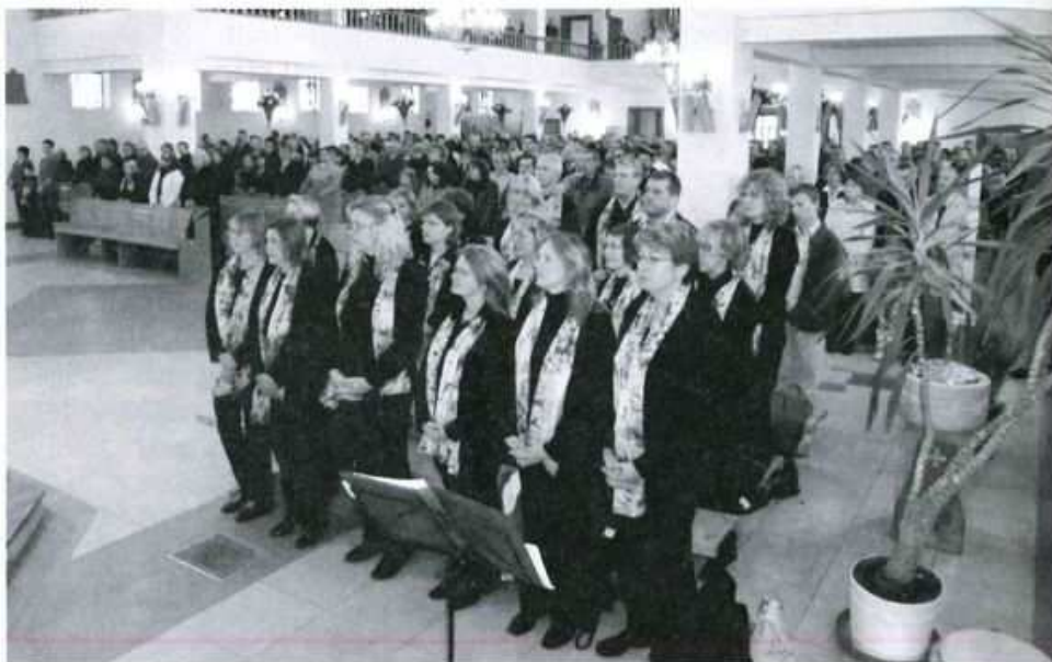
Zdecydowana większość mieszkańców Apensen przyjechała do Polski po raz pierwszy.