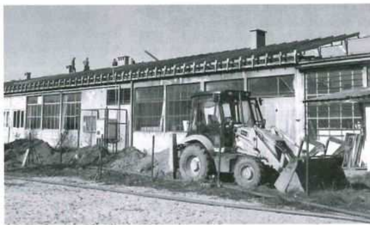
Centrum Kształcenia Praktycznego w Kolbuszowej prowadzi przebudowę dachów w ramach zadania p. n. „Regionalnego Centrum Transferów Nowoczesnych Technologii Wytwarzania”.