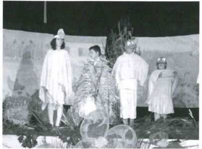
Część artystyczna w wykonaniu uczniów Zespołu Szkół Specjalnych nie tylko rozbawiła ale wzruszyła wielu pedagogów.