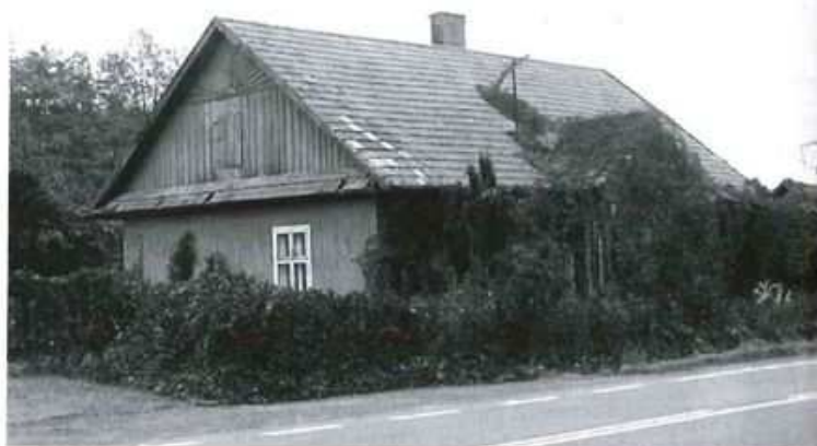
Dom Rychłów w Kolbuszowej Dolnej, gdzie mieszkał „Sawa” i z którego uciekł w ostatnich chwilach swojego życia.

zajmuje pozycje w kolbuszowskim magistracie. 27 lipca atakuje Niemców uciekających samochodami w stronę Mielca. W tej akcji ginie „Wojan” Jan Wojda z Kolbuszowej Górnej. 30 lipca walczy z Niemcami pod kolbuszowskimi stawami. 31 lipca do 2 sierpnia 1944r. to czas niemiecko-radzieckiej bitwy o Kolbuszowę. Po tej bitwie „Boryna” zakończył akcję „Burza”. „Sawa” wraca do Rychłów w Kolbuszowej Dolnej. Tam mieszka