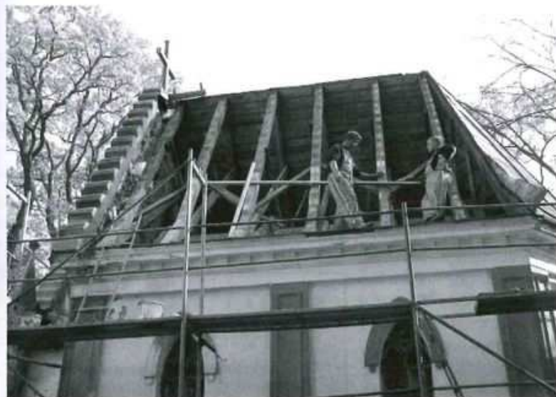
Rozpoczął się pierwszy etap remontu zabytkowej kaplicy z 1873 roku.

Świątynia usytuowana jest w parku, na zachód od pałacu Tyszkiewiczów.