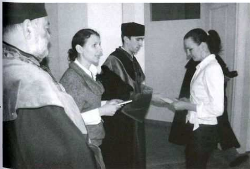
Podczas oficjalnej inauguracji 46 studentów odebrało indeksy.