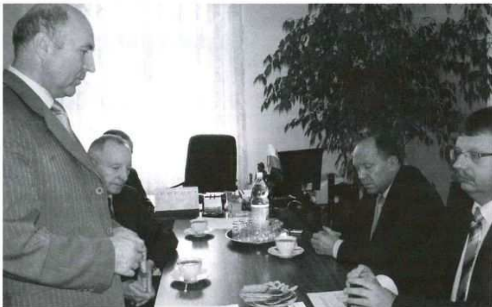
Rozmowy na temat WiMAX-u w Kolbuszowej z liderem projektu w naszym regionie – przedstawicielami UM w Dębicy.