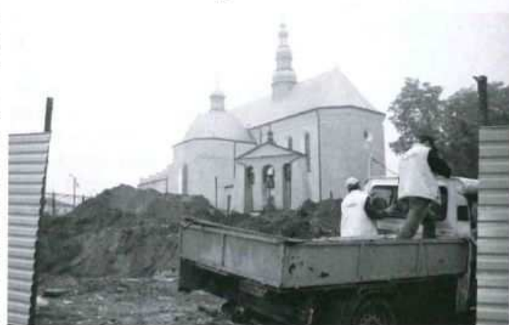
W tym miejscu powstanie nowoczesny budynek dostosowany dla potrzeb osób niepełnosprawnych. (S. Tęcza)

Przetarg na wykonanie prac wygrała jedna z kolbuszowskich firm budowlanych. Obecnie miejsce budowy jest ogrodzone. Po starych szaletach pozostały jedynie fundamenty. Kolejnym etapem prac będzie posadowienie i konstrukcja ścian nadziemna oraz konstrukcja dachu i pokrycie. Liczący 350m 3 obiekt będzie miał ponad 74 m 2 powierzchni użytkowej.