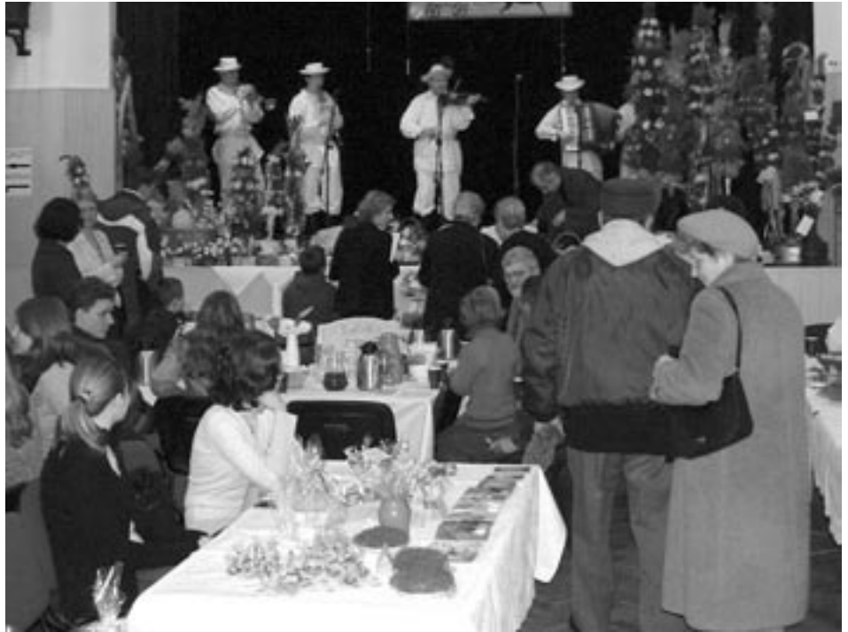
Jarmark - Tłumy Kolbuszowian przybyły do miejscowego MDK na wielkanocne jarmarki.

Wśród licznych handlujących, można było zauważyć stoiska m.in. z Baranowa Sandomierskiego, Rzeszowa, Grodziska Dolnego, Dobrynina a także przedstawiciele wielu kolbuszowskich instytucji. - Właścowne przygotowywanie świątecznych