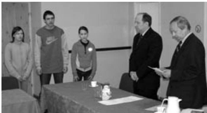
Przewodniczący Rady Miejskiej odbiera ślubowanie od młodych radnych.

i obawy” oraz opracowanie projektu wspierającego utalentowaną muzycznie młodzież z terenu Gminy, warto tu nadmienić że środki na to przedsięwzięcie pozyskano z Polsko-Amerykańskiej Fundacji Wolności w ramach Programu „Działaj Lokalnie”, wspierającego lokalne inicjatywy społeczne. W ubiegłym roku Młodzieżowa Rada Miejska w Kolbuszowej nawiązała stałą współpracę z Ogólnopolską Federacją Młodzieżowych Samorządów Lokalnych w Koszalinie uczestnicząc w ogólnopolskim konkursie SUPER RADA 2004 gdzie zajęła 6 miejsce (na 17 rad uczestniczących w konkursie). Z perspektywy czasu wydaje się że pomysł powołania takiej instytucji jak rada młodzieżowa był pomysłem dobrym, bo w dużej mierze przyczynił się do wzrostu zainteresowania sprawami społecznymi młodzieży i dorosłych. Pokazanie młodym ludziom że sami mogą przyczynić się do tworzenia rzeczywistości ich otaczającej, wyzwala energię i chęć działania które można wykorzystać dla rozwoju Gminy i tej inicjatywy nie można zaniedbać lub zaprzepaścić. Zaangażowanie młodych ludzi w sprawy społeczne jest bardzo dobrym znakiem na porządek, biorąc pod uwagę obecny kryzys zaufania dorosłych do władzy, wyrażający się choćby frekwencją wyborczą.