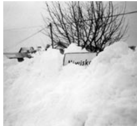
Takich zasp w Niwiskach jeszcze nie było.

Dziękuję za rozmowę i życzę jak najszybszego nadejścia wiosny.