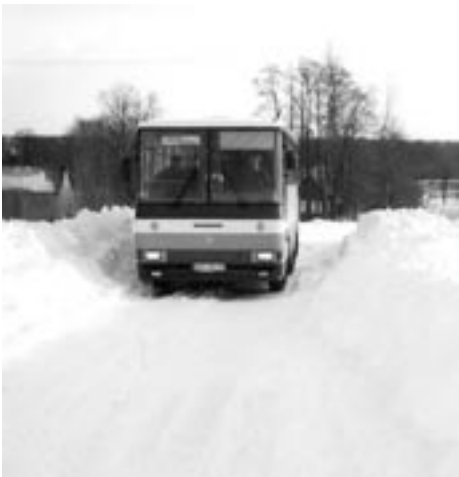
Taką drogą kursują autobusy do Korczowisk.

we, duże koparki. Dokładnie to było siedem jednostek. Wspomnę tylko, że w gminie Niwiska były tak duże zasy, że cztery pługi na jednej drodze utknęło na okres prawie sześciu, czy siedmiu godzin. Dwa pługi też utknęły na drodze z Kolbuszowej Dolnej do Mechowca. Ale jakoś żeśmy sobie poradzili.