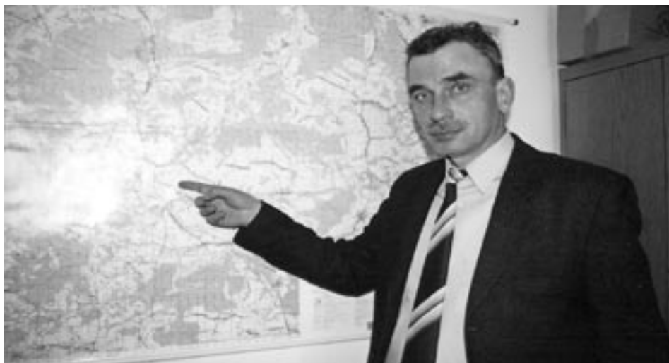
- Zaspy były na wszystkich drogach powiatu, jednak największe były w Niwiskach - mówi dyrektor Szczebiwilk. Fot. B. Popek.

- Na okres zimowy mamy podpisane umowy z ośmioma pługami, ale oprócz tego mamy zamiary na wszystkich usługodawców, którzy chcieliby nam świadczyć usługi w terenie, posiadających sprzęt typu – duże koparki, spycharki gąsienicowe, równiarki. W poniedziałek rano, gdy nasze pługi nie dawały sobie rady wszyscy oni zostali powiadomieni telefonicznie. Ustaliliśmy stawki i oni tym swoim sprzętem ciężkim świadczyli nam usługi przez cały poniedziałek i wtorek. We środę 9 marca skończyliśmy roboty