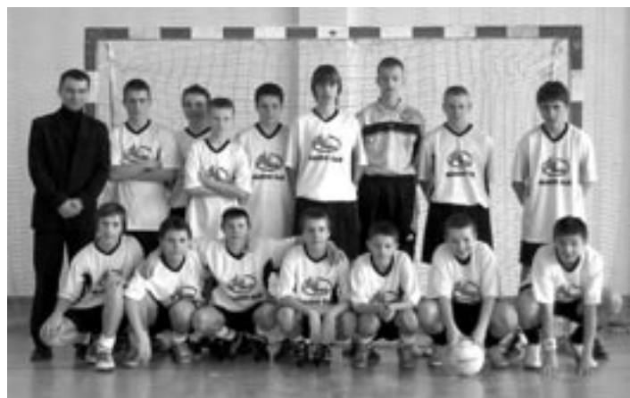
Drużyna UKS „Jedynka”.