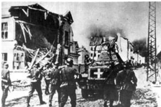
Niemcy posuwają się naprzód.

przegląd POWIATOWY • ZIMNOSTRÓ • BAGA • ROKNA • ZIMNOSTRÓ • BAGA • ROKNA • ZIMNOSTRÓ • BAGA •