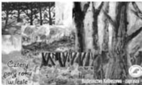
Pamiątkowa widokówka wydana przez Nadleśnictwo na okoliczność konkursu prezentująca cztery nagrodzone prace.

Pod takim tytułem kolejny już raz Nadleśnictwo Kolbuszowa ogłosiło konkurs plastyczny dla uczniów starszych klas szkół podstawowych z terenu zasięgu działalności Nadleśnictwa. Celem jego była popularyzacja wiedzy przyrodniczej wśród młodzieży szkolnej. Do drugiego etapu konkursu zaklasyfikowano 283 prace z 27 szkół. Ostatecznie Główna Komisja Konkursowa wybrała do nagrodzenia aż 56 prac.