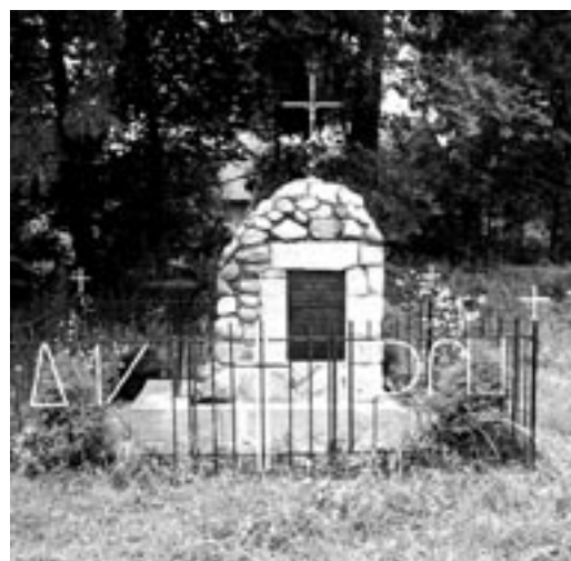
Pomnik w Porębach Kępieńskich upamiętniający partyzantów AK i BCH poległych w bitwie.

Akcja „Burza” trwała do czasu wejścia głównych sił sowieckiej Armii Czerwonej. W dniu 5 sierpnia 1944 r. NKWD dokonało rozbrojenia oddziałów „Kefiru”. Rozproszeni żołnierze udali się do miejsc zamieszkania. Niedługo potem ujawnieni akowcy i bechowcy zostali masowo aresztowani przez NKWD, UB i MO, wcielani siłą do LWP, wywożeni do łagrów w ZSRR, lub zamykani w krajowych więzieniach. Wielu z nich nie przeżyło. Tym którzy przeżyli władze partyjne do końca życia nie pozwoliły