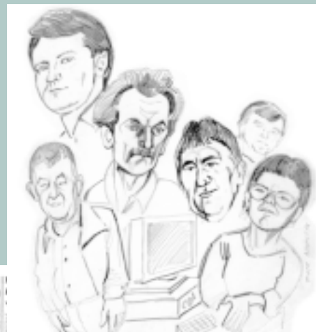
Zespół redakcyjny "PK" w karykaturze...