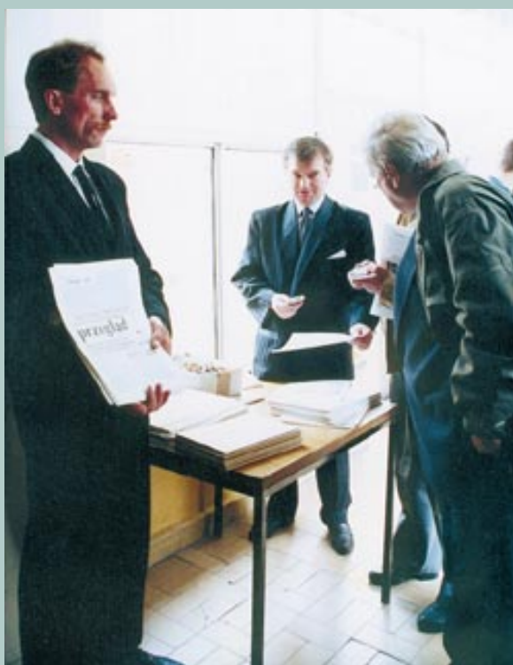
Kolportaż Przeglądu Kolbuszowskiego (rok 1992) - 80-lecie Gimnazjum i Liceum w Kolbuszowej.