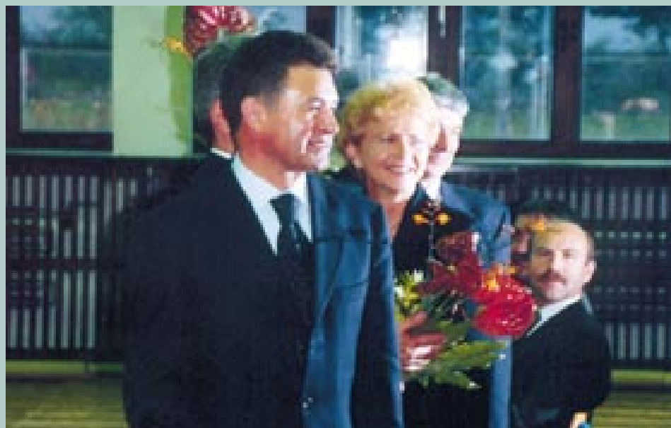
Na zdjęciu: Marian Krzaklewski w czasie spotkania z wyborcami.