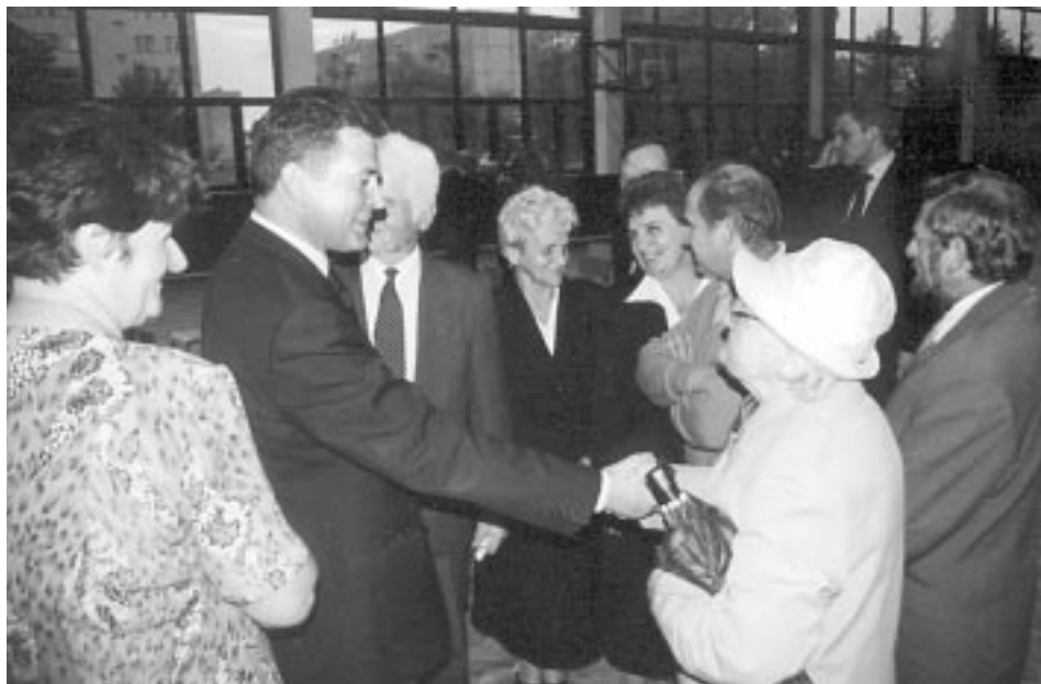
Marian Krzaklewski podczas spotkania z mieszkankami Kolbuszowej...