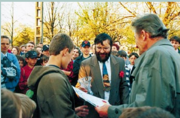
I Kolbuszowski Bieg Uliczny o Puchar Burmistrza Miasta i Gminy Kolbuszowa (3 maj 1995 rok) - wręczenie nagród.