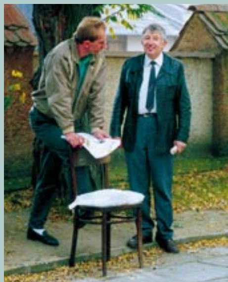
Kolportaż Przeglądu Kolbuszowskiego obok kościoła farnego w Kolbuszowej (rok 1994).