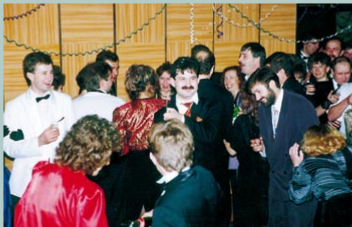
Bał Sylwestrowy (rok 1993 - Dom Kultury w Kolbuszowej) zorganizowany przez członków redakcji, z którego dochód przeznaczony został na dofinansowanie "PK".