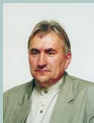
Redaktor naczelny "Przeglądu Kolbuszowskiego"