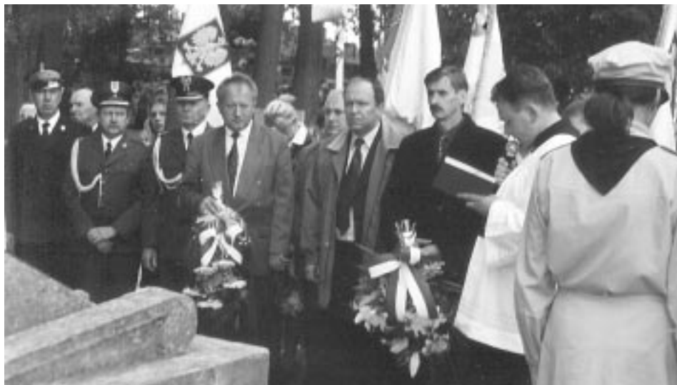
Władze Kolbuszowej oraz zastąpieni kombatanci podczas uroczystości wrześniowych przy Zespole Szkół Zawodowych w Kolbuszowej.