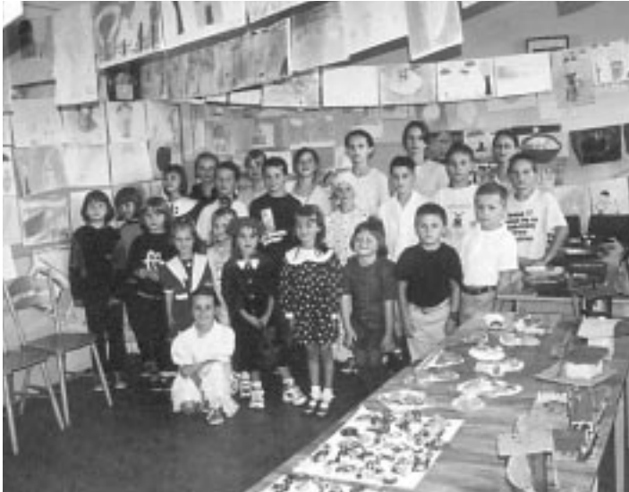
Uczestnicy spotkań "Wakacje - lato 2001"

W dniu 30 sierpnia br. w Miejskim Domu Kultury Filii w Kolbuszowej Górnej odbyło się uroczyste zakończenie tegorocznych wakacji.