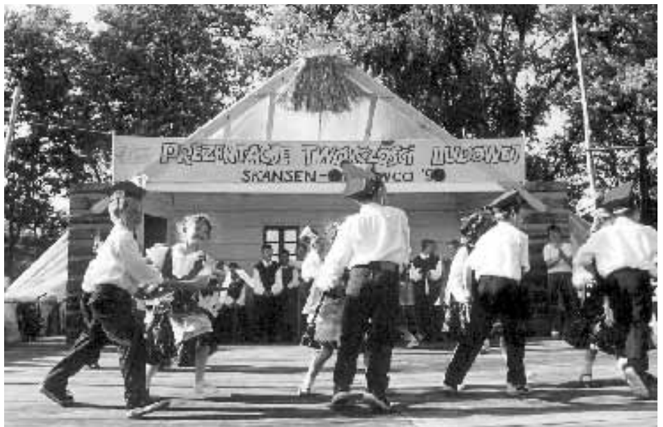
Występ dzieci z okazji Prezentacji Twórczości Ludowej na Skansenie w Kolbuszowej.