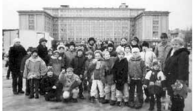
Przed Urzędem Wojewódzkim w Rzeszowie.