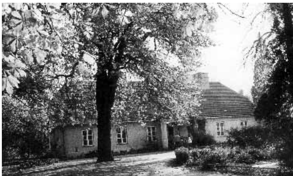
Dworek w Żelazowej Woli - miejsce urodzenia i początki twórczości Fryderyka Chopina.