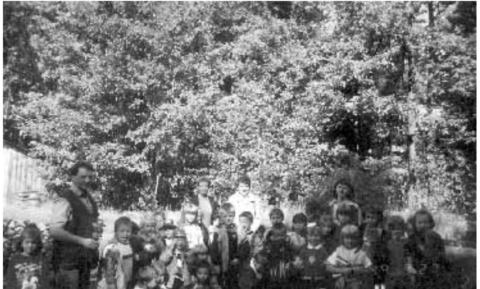
Zwiedzanie Szkołki Leśnej w Nadleśnictwie Świerczów przez Przedszkolaków.

P. S. 28 lutego 2000r., Rada Miejska w Kolbuszowej uchwaliła wyżej przedstawiony herb i flagę Kolbuszowej.