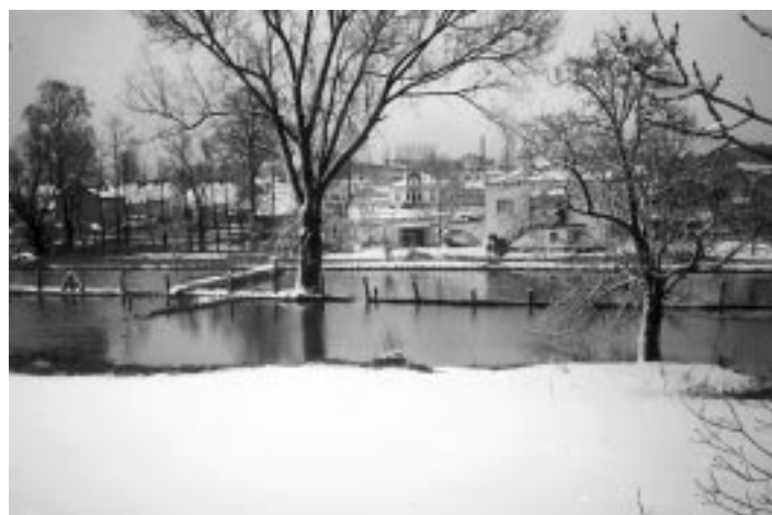
Fot. Jan Skowroński