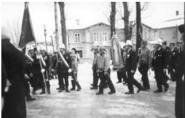
6.04.2000r., Przywitanie Obrazu Miłosierdzia Bożego w Parafii Kolbuszowa p.w. Wszystkich Świętych.