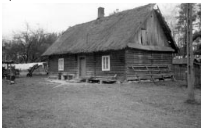
Budynek w Osiej Górze w którym przez wiele lat uczyły się dzieci

gnaj Osia Góra. Po krótkim czasie jeszcze raz spotkałem się z miłym akcentem dotyczącym Osiej Góry. Na konferencji nauczycieli w Kolbuszowej podeszła do mnie kierowniczka szkoły, którą zastępował podczas jej urlopu i wręczy-