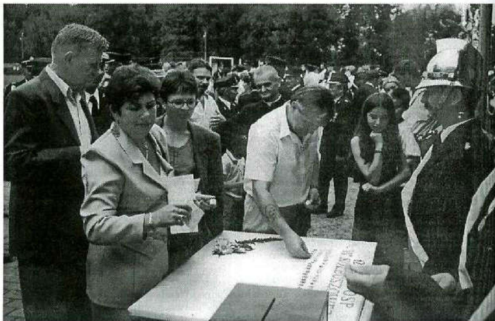
Przedstawiciele "Przeglądu Kolbuszowskiego" w czasie wbijania pamiątkowego "Gwoźdźnia".