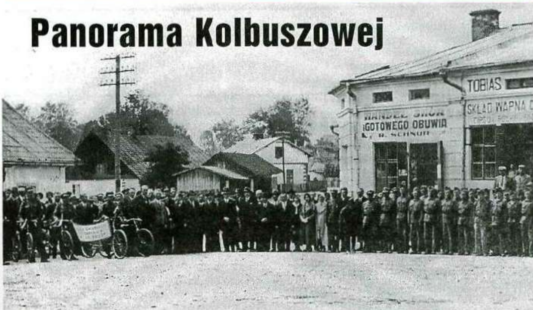
Fragment kolbuszowskiego rynku sprzed 1939r.