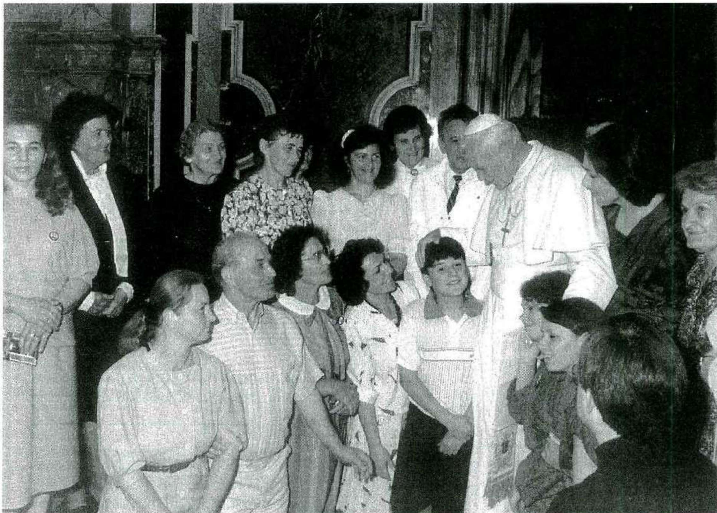
Kolbuszowianie u Papieża...