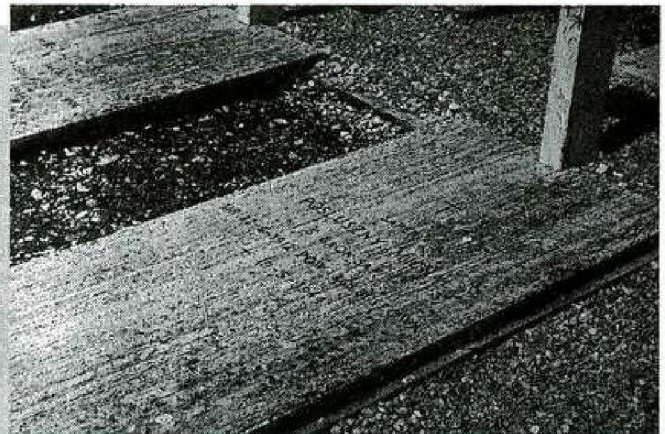
Grób Kobuszowianina na Monte Cassino