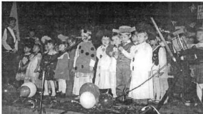
Scena zbiorowa w czasie występu.