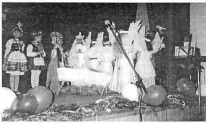
Fragment "Jasełek" pokazanych przez dzieci z Przedszkola nr 2

Dom Kultury w Kolbuszowej zaprasza kolekcjonerów na III Kolbuszowską Giełdę Kolekcjonerów, która odbędzie się 31 marca br. w godz. 9 00 - 12 00