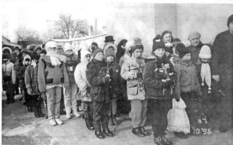
Uczniowie z poświęconymi krzyżami dla nowych klas przed budynkiem szkolnym