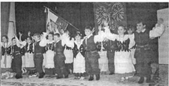
Uroczystość uświetniły dzieci z zespołu tanecznego ze Szkoły Podstawowej nr 2