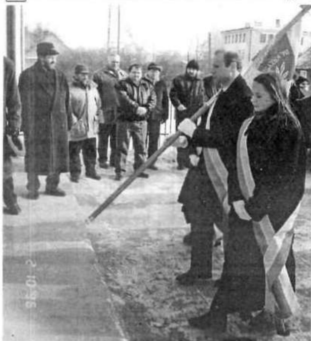
Poświęcony w kościele sztandar zostaje uroczystie wprowadzony do budynku szkolnego