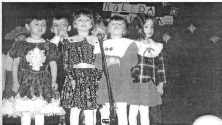
Dzieci w czasie wieczoru "Kolędy i pastorałki" Fot. arch.

Przygotowało Kierownictwo Przedszkola Nr 2 w Kolbuszowej