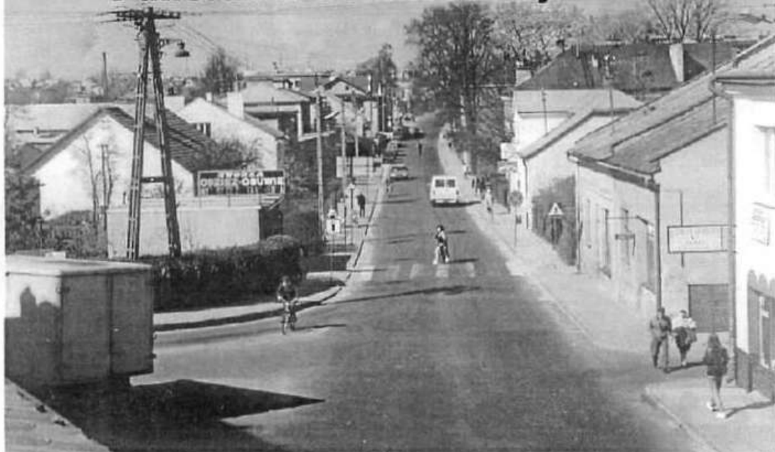
Ulica Obrońców Pokoju