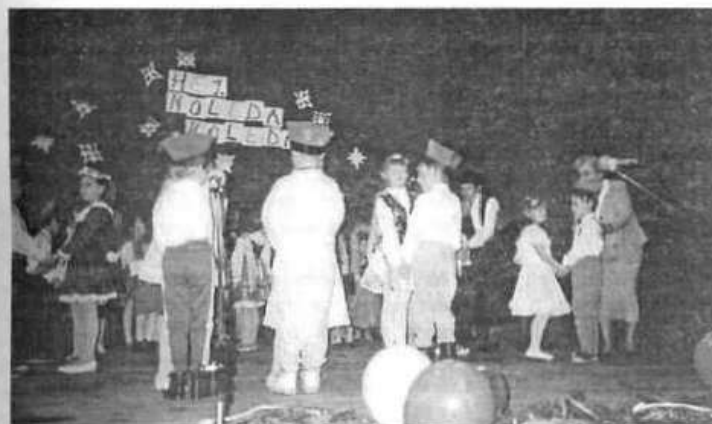
"Krakowiak" w wykonaniu małych tancerzy