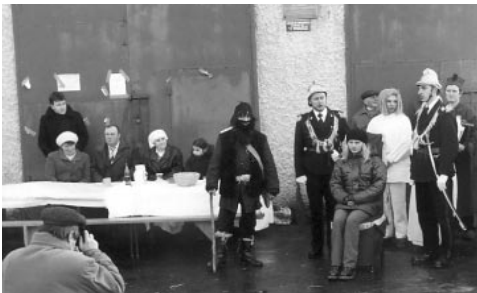
Ośpiewanie przez kołędników córki gospodarza.