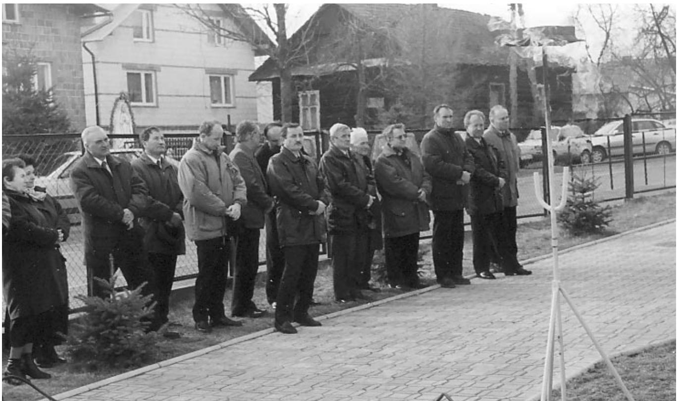
Uczestnicy procesu gazyfikacji gminy na ostatnim jego etapie - odpaleniu i poświęceniu inwestycji.