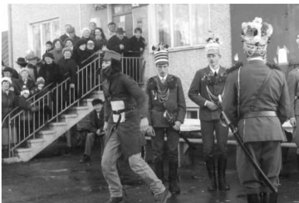
Zespół kołędniczy "Herody" z Godziszowa - laureat II miejsca.