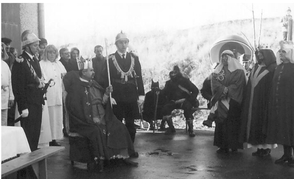
Król Herod przyjmuje Trzech Króli.

Drugą grupą kolędniczą, która występowała również dla tego samego gospodarza były "Herody" z Godziszowa w województwie lubelskim. Starodawnym obyczajem po zakończeniu kolędowania gospodarz zaprosił wszyst-