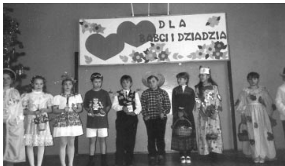
... oraz klasa IIIb.