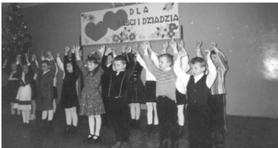
Występuje klasa Ia dla swoich Babć i Dziadków...