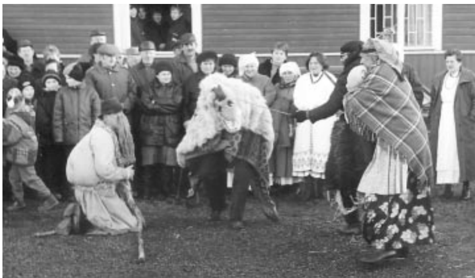
Występ kołędników z Kolbuszowej Górnej przed remizą OSP w Wólce Batorskiej.