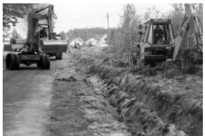
15 października 2002r. W Raniżowie - Ługach powstanie zatoka dla autobusów. W tym celu w rowie zostaje położony kolektor z kręgów betonowych. Inwestycja finansowana ze środków budżetu gminy.