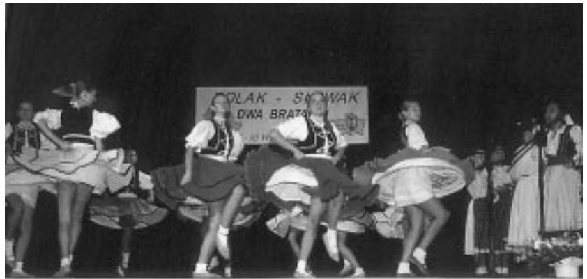
Zespół folklorystyczny "Levočan" w dynamicznym układzie tanecznym.