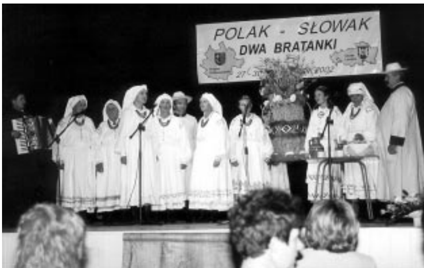
Zespół obrzędowy "Mazuranie" przedstawił gościom ze Słowacji oraz kolbuszowskiej publiczności widowisko pn. "Okrężne w Mazurach".

Spotkanie to miało miejsce w dniach 27-30 września 2002r. W trakcie projektu odbyło się otwarcie wystawy prezentującej dzieła Majstra Pawła z Levoči (artysty porównywal-