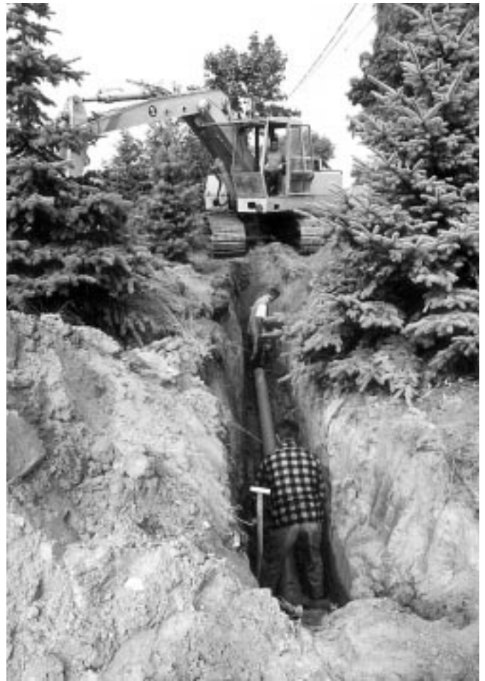
Trwa budowa drugiego etapu kanalizacji sanitarnej w Raniżowie. W jego zakresie dokończono kanalizowanie Piasków i Ługów i rozpoczęto podłączanie budynków do sieci.