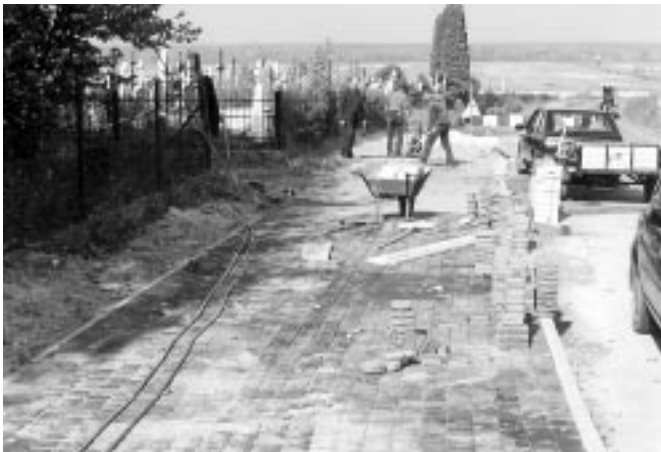
4 października 2002 r. Prace przy końcówce chodnika z kostki brukowej na odcinku od kościoła do cmentarza w Woli Raniżowskiej. Wcześniej w rowie przydrożnym ułożono kolektor z betonów i przykryto ziemią. Dzięki temu obecnie jest praktyczny i szeroki chodnik.