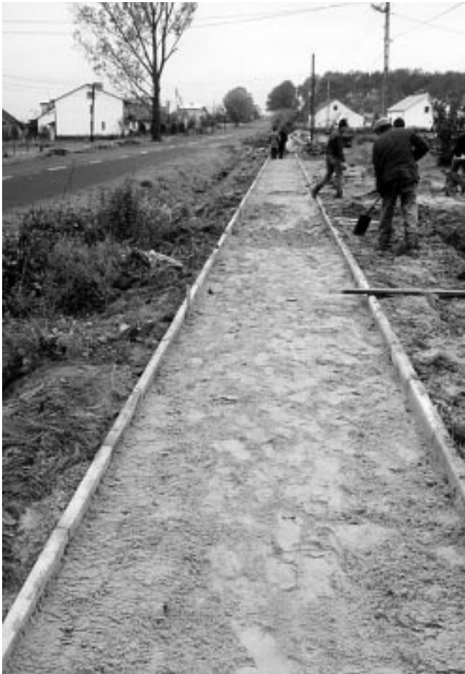
15 października 2002 r. Trwa budowa chodnika w Raniżowie - Ługach wzdłuż drogi wojewódzkiej. Inwestycja o długości 470m finansowana jest przez Podkarpacki Zarząd Dróg Wojewódzkich.