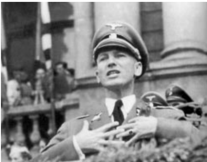
Gubernator Galicji Otto Wächter.

Nazwy wielu miast czy też miejscowości zostały zmienione, np. Kraków na Krakau; Rzeszów na Reischow; Ranizów na Ranischau. Urzędy i ich pracownicy stosownie do stopnia miały realizować założenia polityki okupanta. Urzędy gubernatorskie, starostwa i urzędy miejskie obsadzone były Niemcami i folksdeuczami. Urzędy gmin wiejskich w zakresie działania uznano za wystarczające i odpowiadające potrzebom. W oparciu o dotychczasowy lub częściowo zmieniony personel miały wykonywać zarządzenia okupacyjne władz zwierzchnich, a przede wszystkim nakładać kontyngenty, realizować różne obowiązki służebne wg zarządzeń. Z urzędów usunięto Żydów, a wszyscy pracownicy zatrudnieni musieli składać dekla-