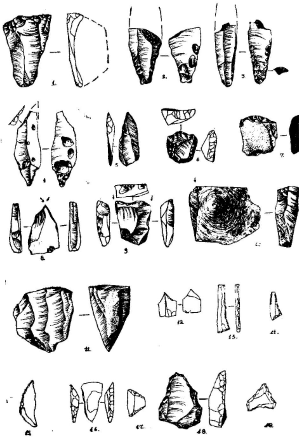
Tablica III. Wzrosty paleolityczne i mezolityczne z Majdanu przysiółek Ciołek, pow. Kolbuszowa Rpn. S. R. Kozłowski