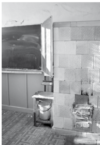
Odpadające tynki i kopcący piec kaflowy w dawnej sali lekcyjnej przyszedł już do historii.