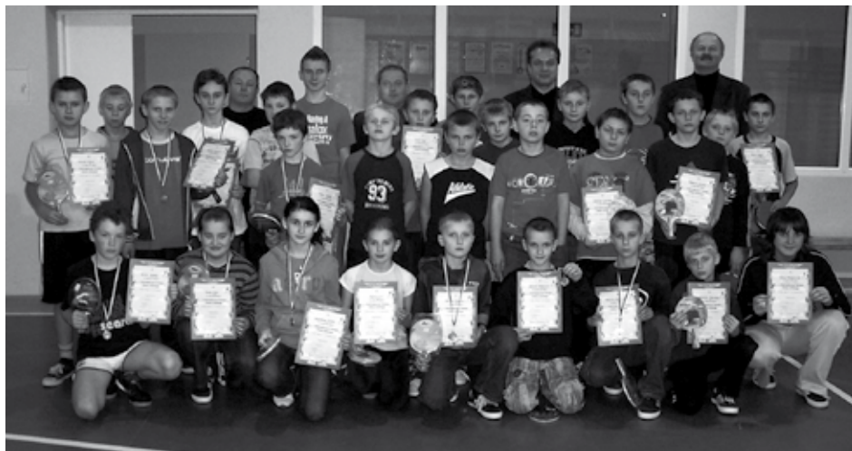
Część uczestników turnieju oraz organizatorzy (stojący z tyłu).