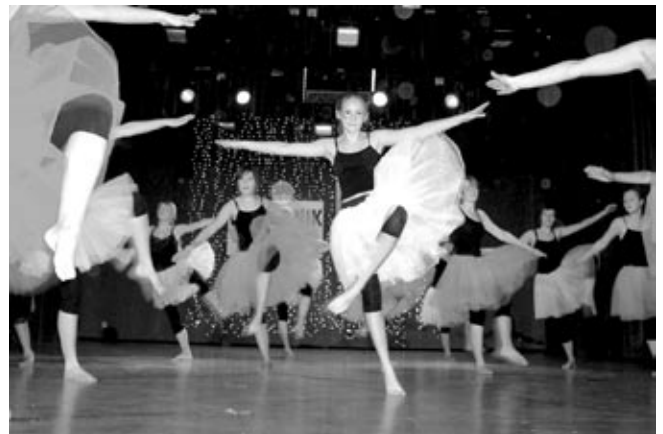
Zespół „Flamingi” z SCK w Mielcu.

Przegląd pozwolił młodym tancerkom skonfrontować swoje umiejętności z innymi rówieśniczkami działającymi w tym samym kierunku, podpatrzeć ciekawe układy taneczne, wymienić się doświadczeniami z innymi