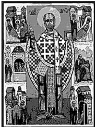
Ikona przedstawiająca świętego Mikołaja, biskupa Miry, pierwowzór postaci świętego Mikołaja.

Święty Mikołaj, biskup Miry, ze względu na przypisywane mu legendą uczynki (m.in. cały majątek rozdał biednym), został pierwowzorem postaci rozdającej prezenty dzieciom. Przedstawiany jako starzec z okazałą brodą, często w infule i pastora-