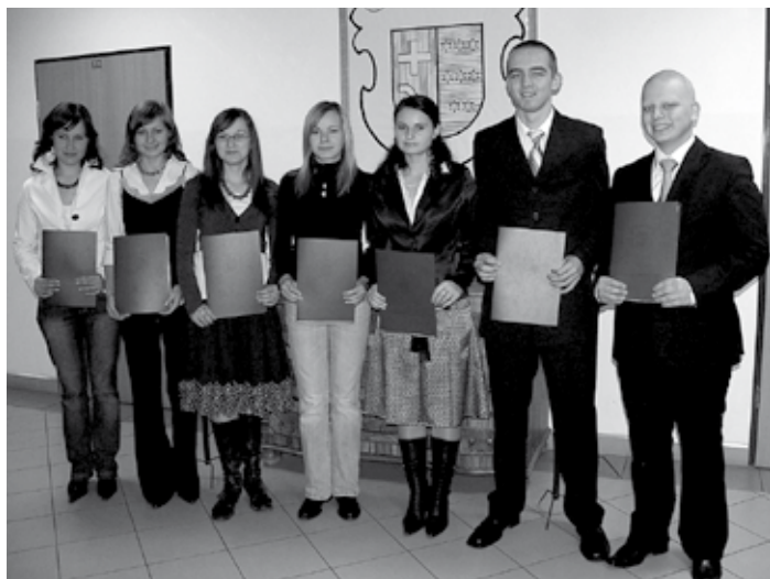
Stypendyści Starosty Kolbuszowskiego.