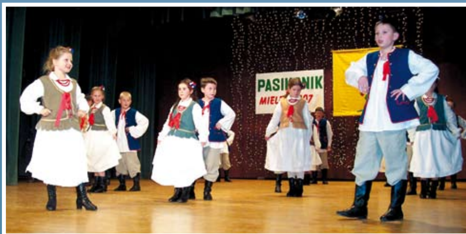
Zespół Pieśni i Tańca „Mazurek” podczas występu na scenie SCK w Mielcu.