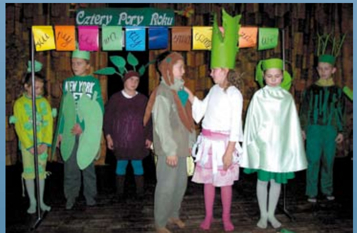
Teatrzyk „Gwiazdeczka” z Woli Raniżowskiej.