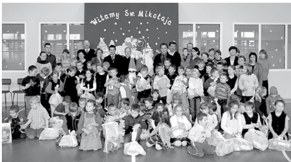
Wspólne zdjęcie części uczestników imprezy.