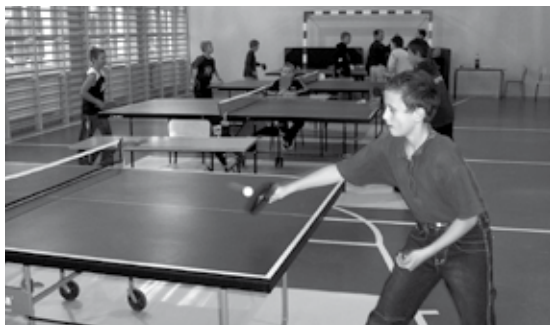
Rozgrywki przy stołach tenisowych.