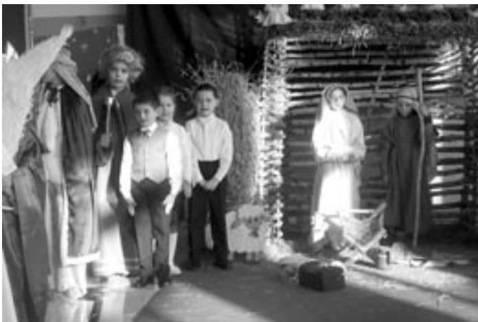
Grupa jasełkowa z SP Posuchy.

Powołana komisja była bardzo wymagająca, a jednocześnie rzetelna i obiektywna. Zdaniem jurorów grupy prezentowały się na bardzo wysokim poziomie.