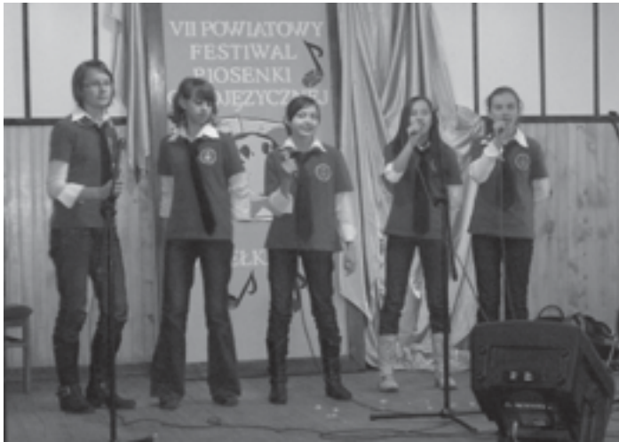
Zespół „THE FLOATING NOTES”.