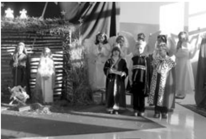
Jasełka z klasy I SP Raniżów.