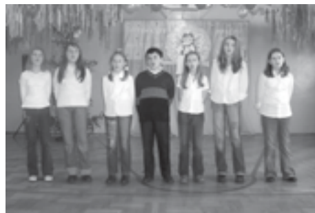
Zespół „Septet” z SP Mazury.