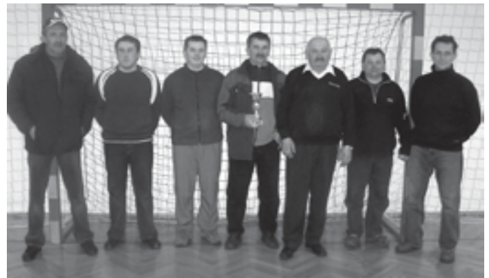
Drużyna z Pogwizdowa Starego.