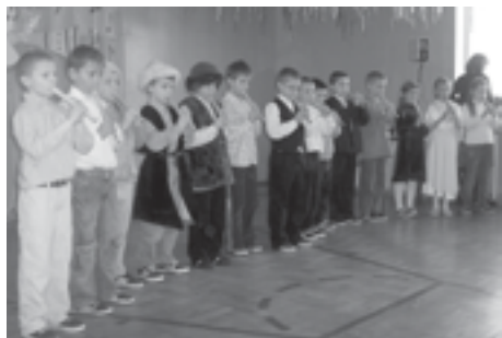
„Fleciki” z klasy IIb SP Raniżów.