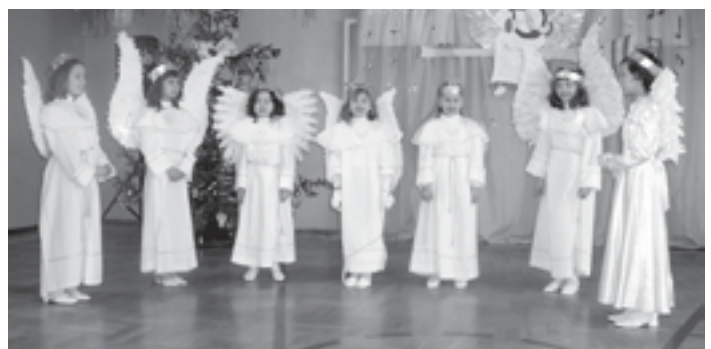
„Aniołki” z Woli Raniżowskiej.