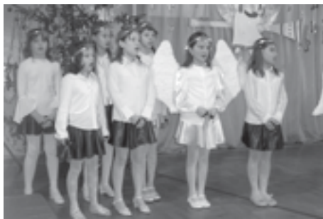
Klasa III z SP Raniżów.