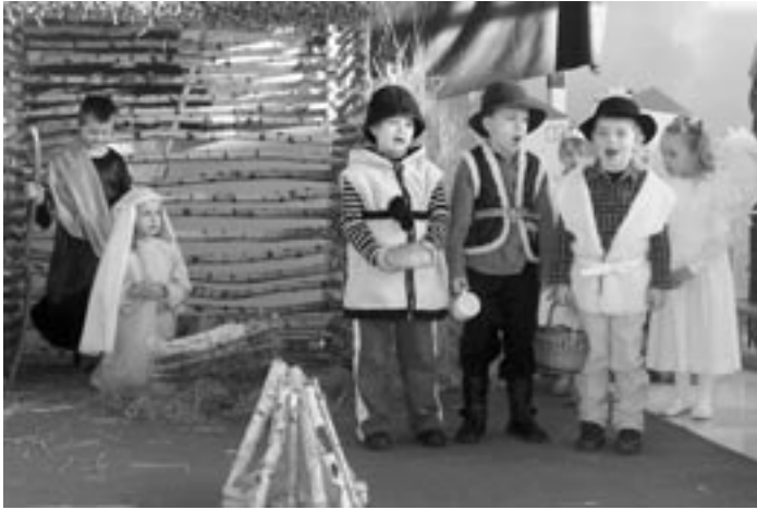
Grupa jasełkowa z Przedszkola w Raniżowie.