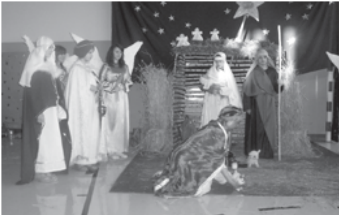
Jasełka w wykonaniu uczniów z Gimnazjum w Woli Raniżowskiej.

Organizatorzy za pomoc w przygotowaniu tej wspaniałej uroczystości pragną podziękować sponsorom, którzy okazali nam swoją pomoc życzliwość, dobre serce, zrozumienie i ofiarność.