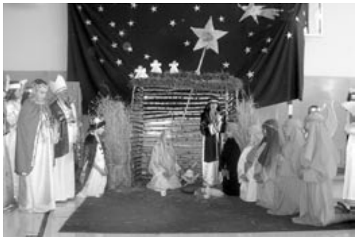
Szkolny Teatrzyk „Gwiazdeczka” (grupa starsza) z SP Wola Raniżowska.