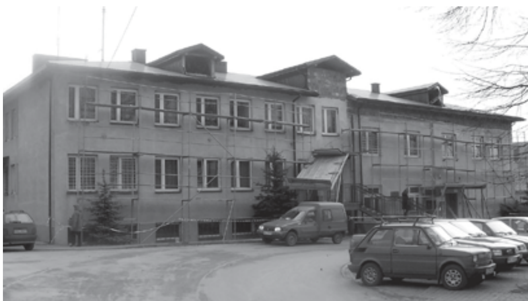
Budynek Urzędu Gminy w Raniżowie powoli zmienia swe oblicze. Na zdjęciu stan na 24.01.2008 r.