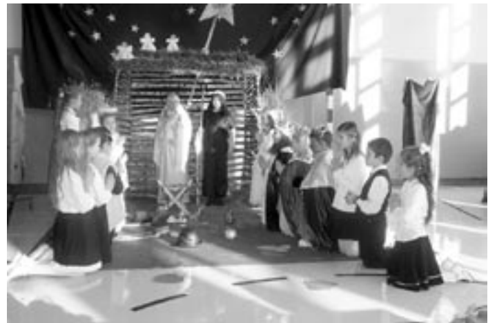
Jasełka w wykonaniu uczniów z SP Poręby Wolskie.