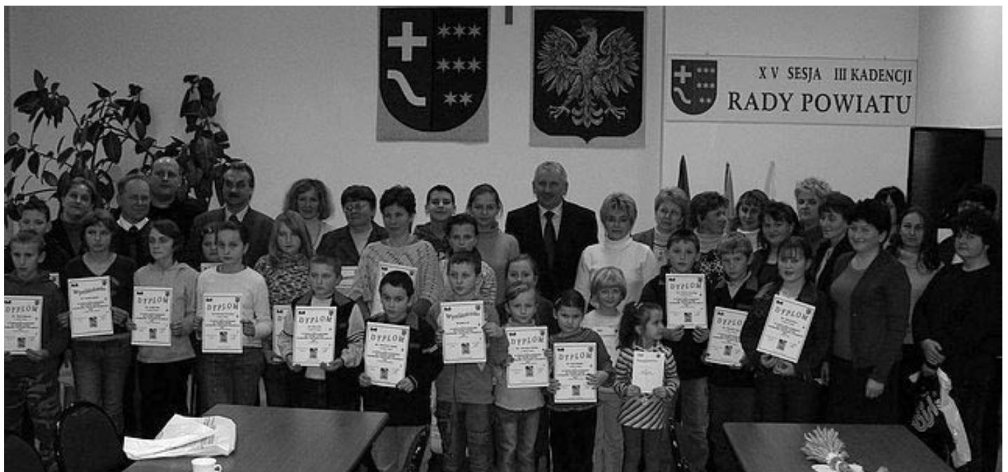
Laureaci konkursu wraz z opiekunami w pamiątkowym zdjęciu z władzami powiatu kolbuszowskiego.