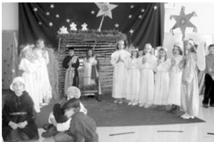
Jasełka w wykonaniu uczniów klasy IV z SP Raniżów.