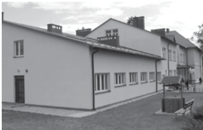
Budynek Zespołu Placówek Oświatowych w Mazurach. Na pierwszym planie nowo dobudowana sala gimnastyczna z jej zapleczem.

Przedstawione inwestycje świadczą o tym, że rok 2007 nie