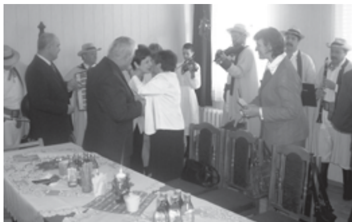
Życzenia przy kolędach kapeli „Ranizowianie”.