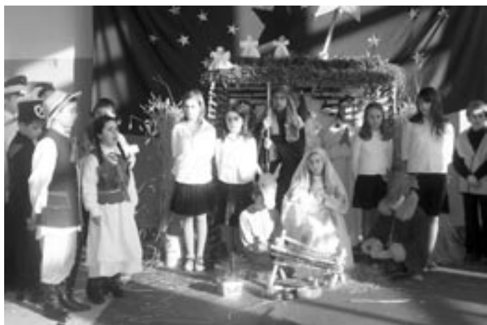
Grupa jasełkowa z ZPO Mazury.