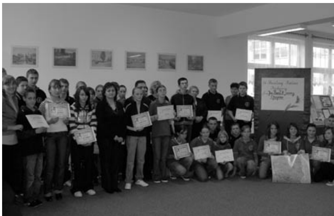
Uczestnicy i organizatorzy konkursu.