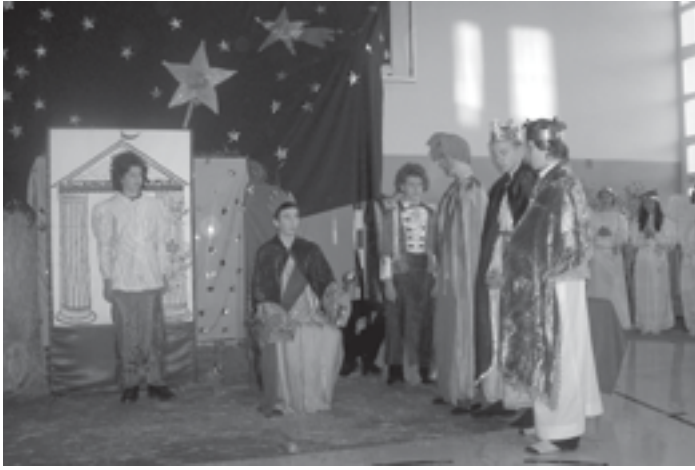
Grupa jasełkowa „Kurtyna” z Gminnego Gimnazjum w Raniżowie.