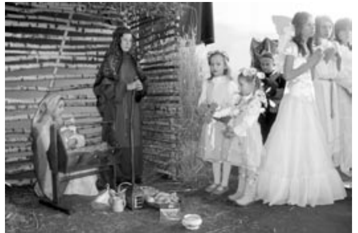
Teatrzyk jasełkowy z SP Staniszewskie.

- I miejsce dla grupy jasełkowej „Gwiazdeczka” z Woli Raniżowskiej,