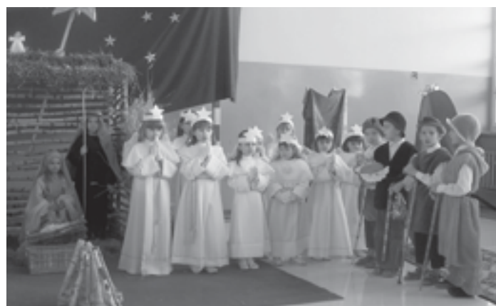
Grupa jasełkowa „Misiaczek” z Przedszkola w Woli Raniżowskiej.