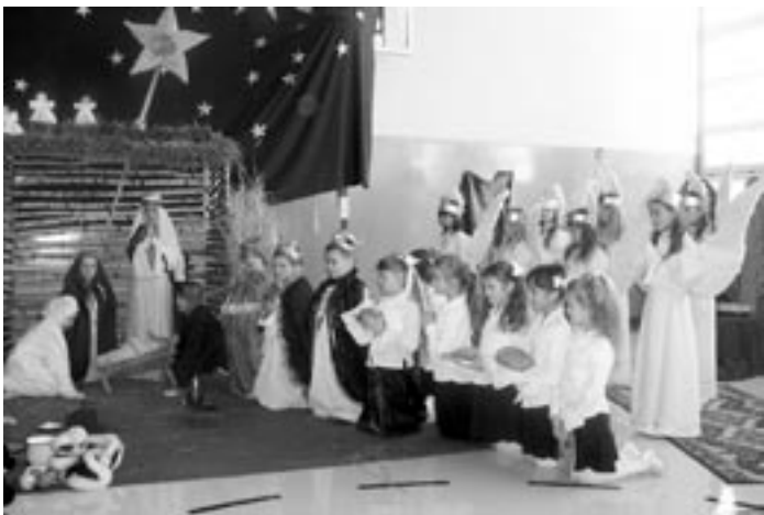
Szkolny Teatrzyk „Gwiazdeczka” z SP Wola Raniżowska.