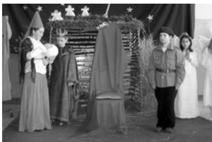
Teatrzyk jasełkowy z SP Zielonka.