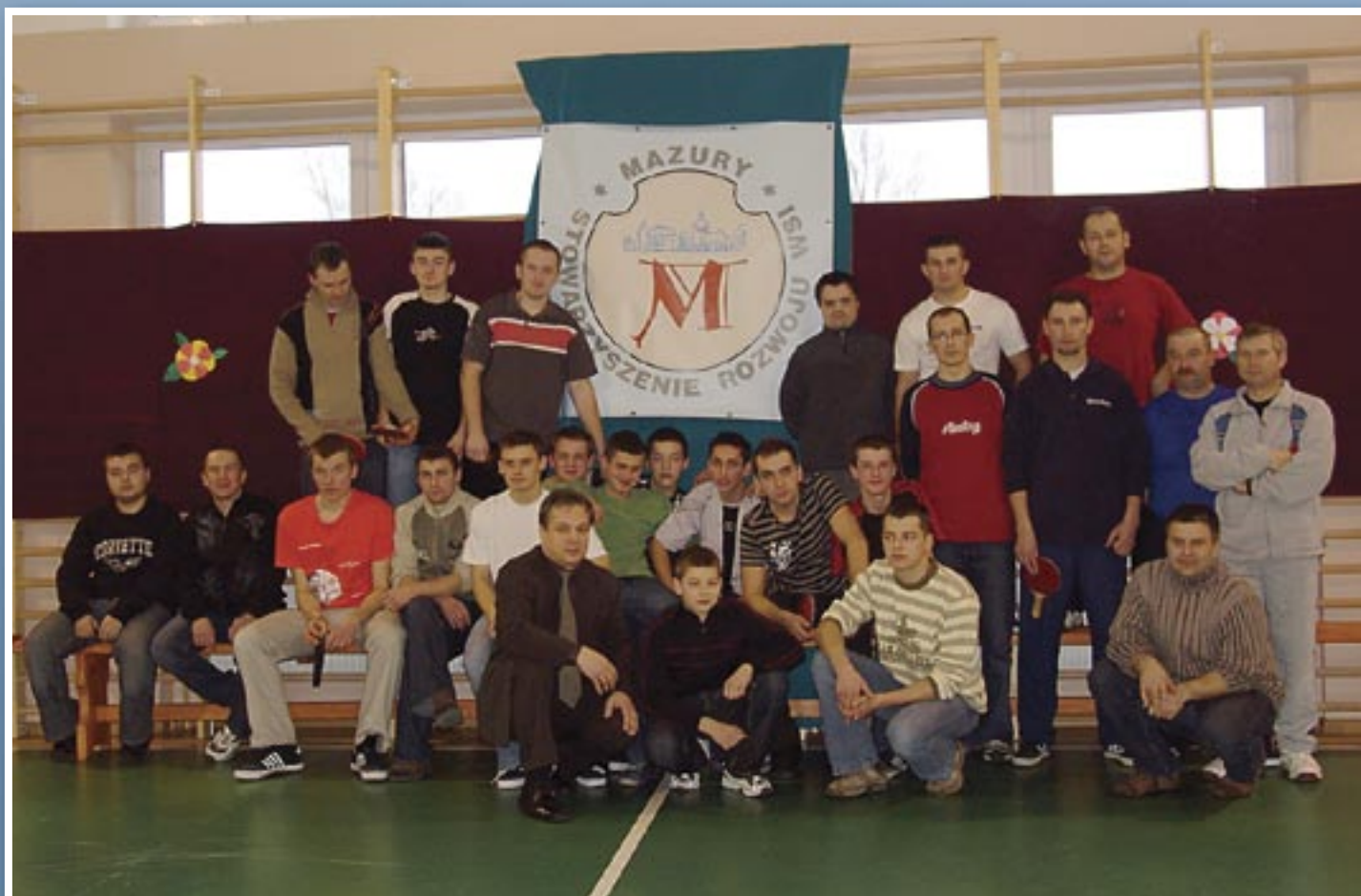
Zawodnicy i organizatorzy Turnieju Tenisa Stołowego o Puchar Stowarzyszenia Rozwoju Wsi Mazury