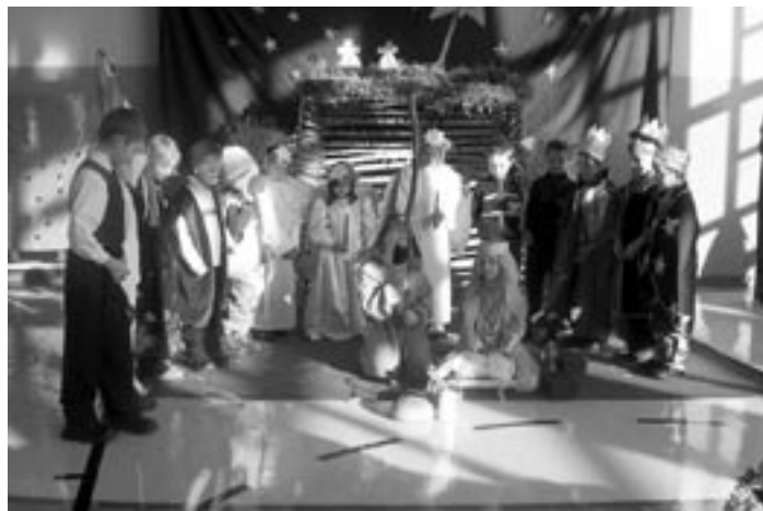
Grupa jasełkowa z SP Korczowiska.