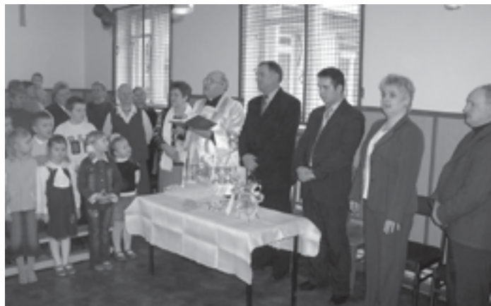
Modlitwa w intencji uczniów i pracowników szkoły.

w czasie pacyfikacji w 1943 roku. Później w latach powojennych nigdy żaden ksiądz nie miał takiej możliwości, by miejsca kaźni poświęcić i uwolnić dusze potrzebujące pomocy. Odmówił też na tę okoliczność modlitwę w intencji pomordowanych mieszkańców wioski i poświęcił pomieszczenia, w których 65 lat temu w ciężkich męczarniach odchodzili z tego świata... Potem przeszedł do nowo wybudowanych sal lekcyjnych i po kolei pokropił wodą święconą każdą z nich z osobna.