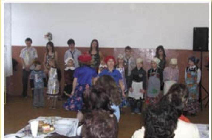
Występy dzieci ze Szkoły Podstawowej.