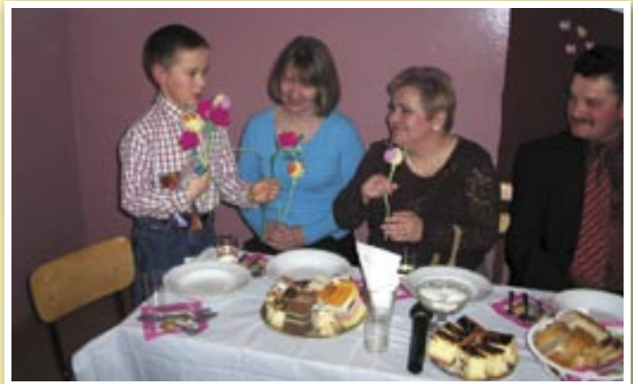
Misternie wykonane kwiaty od szkolnej społeczności otrzymały wszystkie panie. damsko-męskich, w których dialogi oparte były na powiedzeniach i przysłowiaach ludowych.

Również miejscowy sześciuosobowy zespół tańca nowoczesnego dał wspaniałą pokaz tanecznych umiejętności, za co zebrał gromkie brawa.