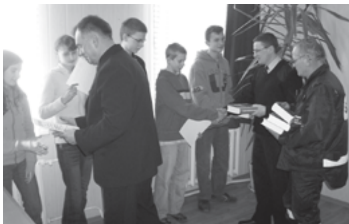
Odbiór zasłużonych nagród.