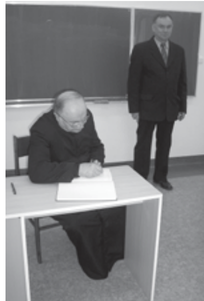
Wpis do kroniki szkolnej.