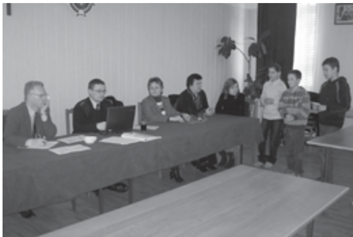
Najlepsza trójka z podstawówki zdaje część ustną.

A tego typu pytań było w teście 25. Część z zawodników zapewne „strzelała”, gdyż np. 10 zdobytych punktów na 25, nie jest wynikiem zadowalającym. Ale najlepsi wykazali się wiedzą teoretyczną, którą niejeden dorosły się nie pochwali. I ci zostali zakwalifikowani do finału ustnego.