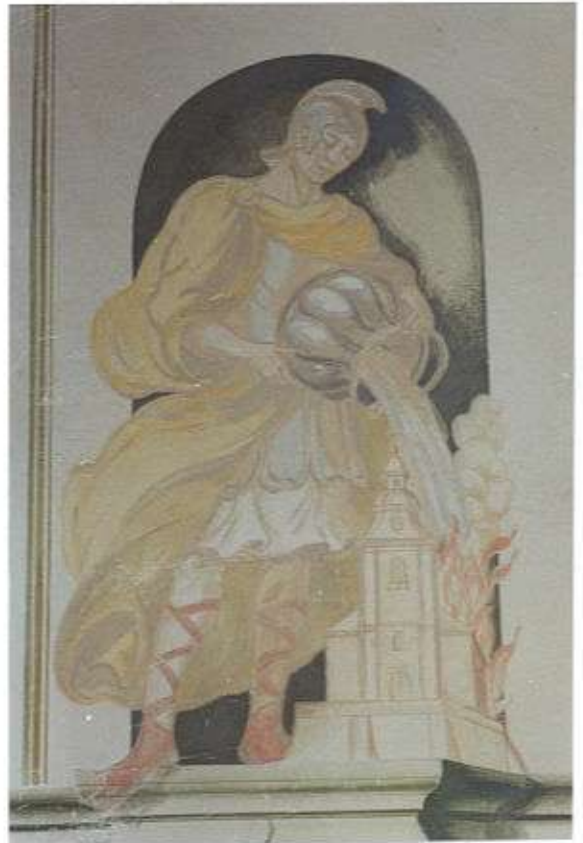
Malowidło ścienne w przedsionku kościoła parafialnego w Raniżowie przedstawiające św. Floriana.