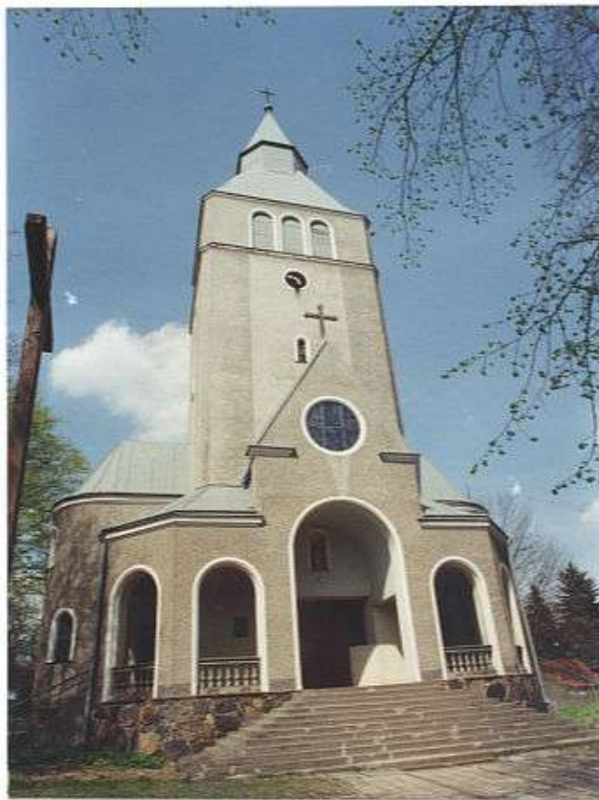
Kościół parafialny w Mazurach