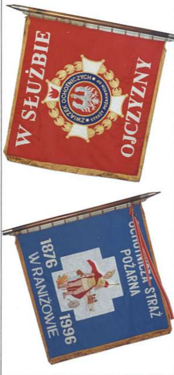
Dwie strony sztandaru jednostki OSP w Raniżowie