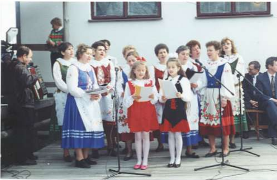
Kobięcy zespół śpiewaczy z Koła Gospodyń Wiejskich podczas swego premierowego występu.