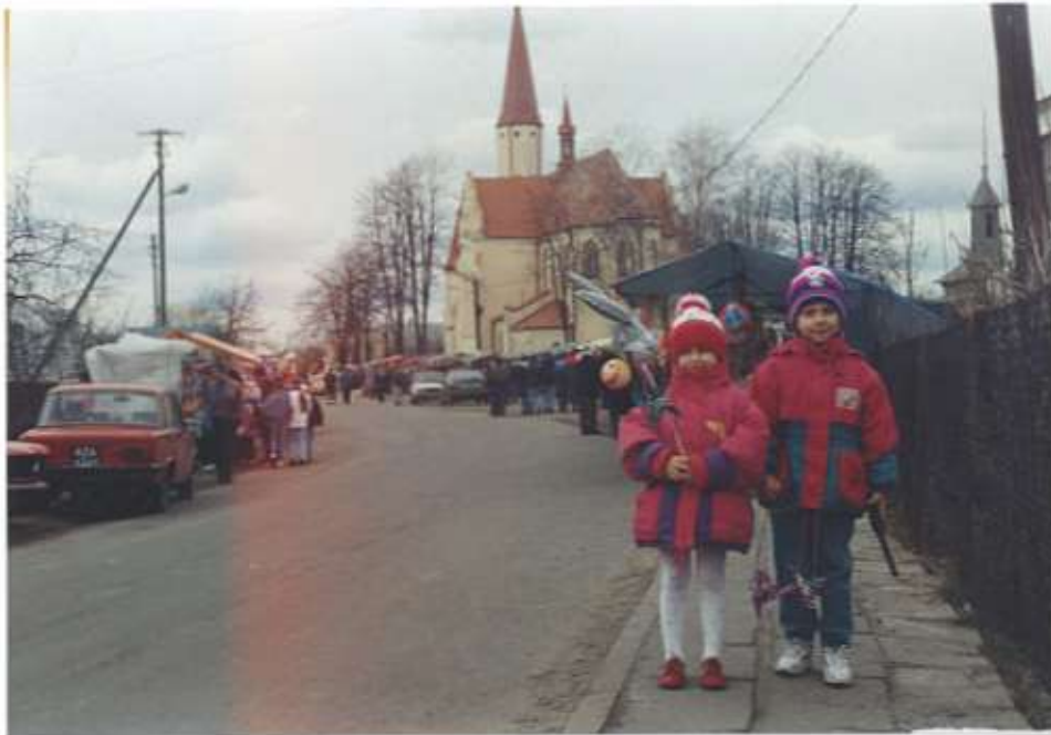
Stragany uliczne przy okazji odpustu w Woli Ranizowskiej. Okazja do zrobienia pamiątkowego zdjęcia