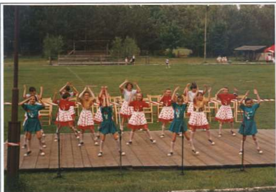
Zespół taneczny „BIEDRONKI”

programu imprezy był tradycyjnie festyn ludowy, na którym młodzież miała okazję potańczyć i poznać nowe twarze, a być może po tym święcie będzie jakiś trwały związek? Jeżeli by tak się stało - czekamy na informację