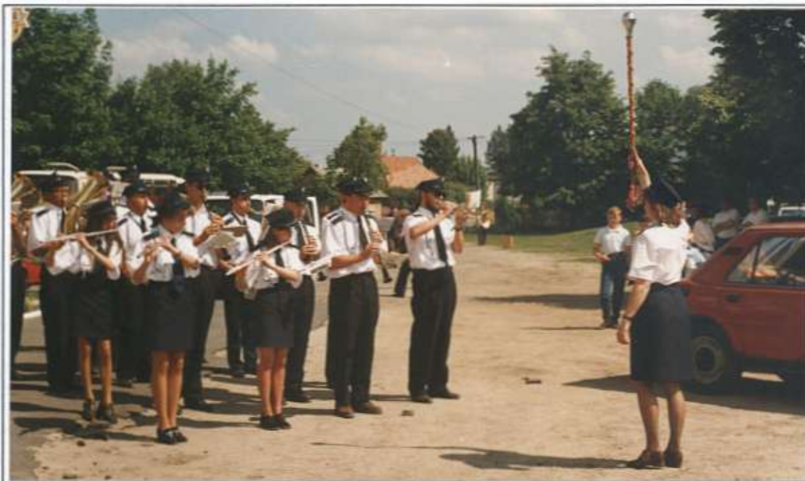
Orkiestra dęta z Kolbuszowej