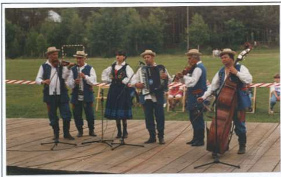
Kapela ludowa z Głogowa Młp.