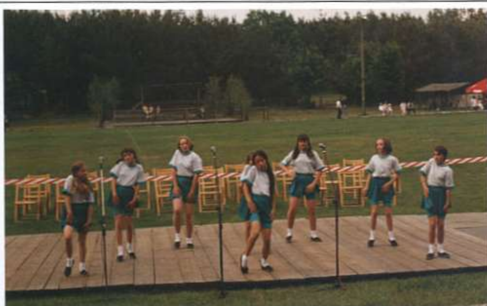
Zespół taneczny „BEST GIRLS”