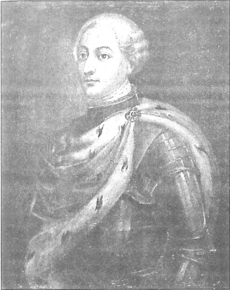
Jerzy Ignacy Lubomirski