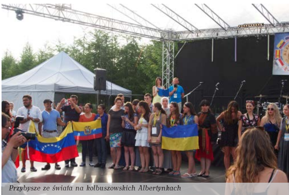
Przybyłszy ze świata na kolbuszowskich Albertynkach