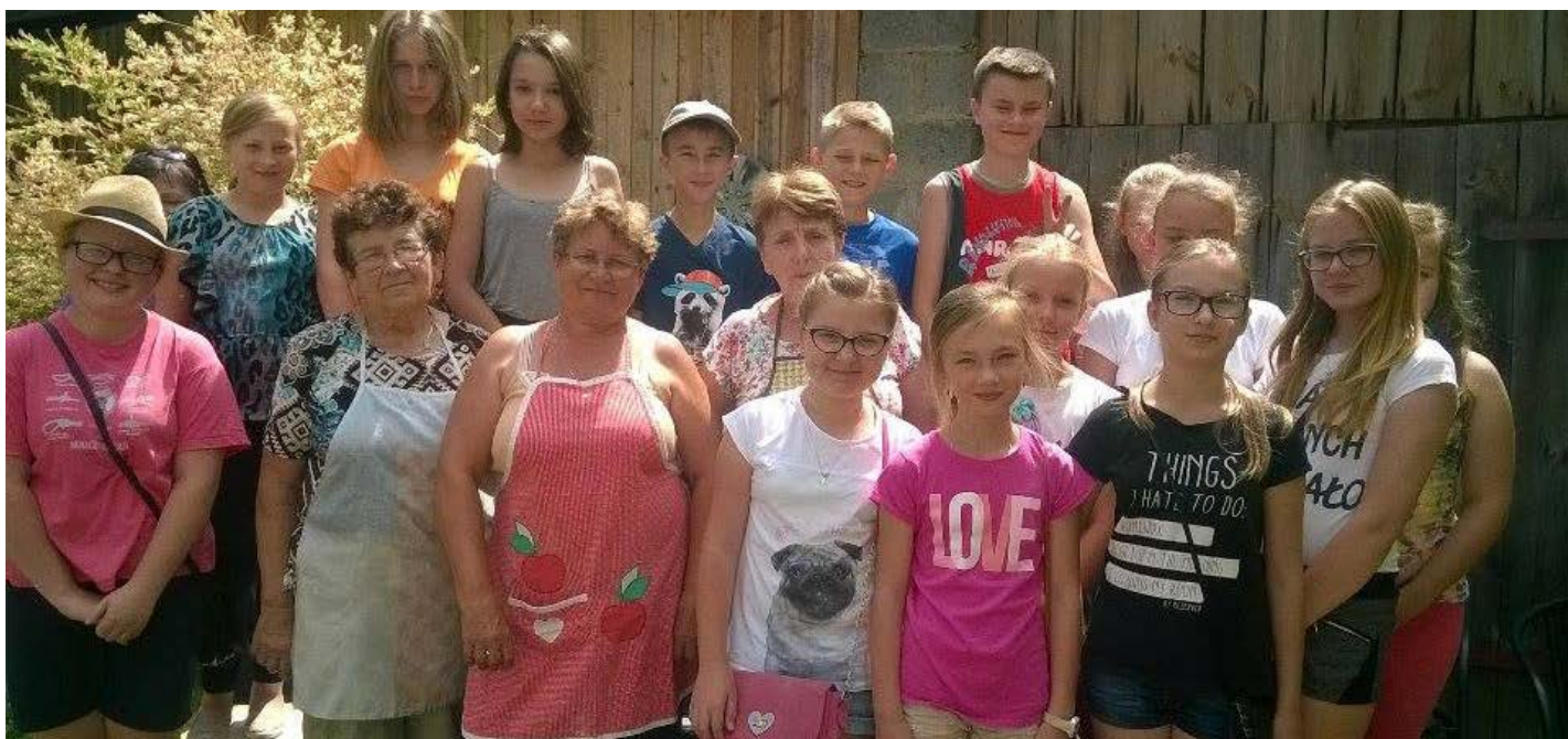
Od takich kucharek warto się uczyć

Dziękujemy KGW w Hucie Przedborskiej za tą pyszną przysgodę!