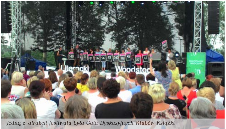
Jedną z atrakcji festiwalu była Gala Dyskusyjnych Klubów Książki