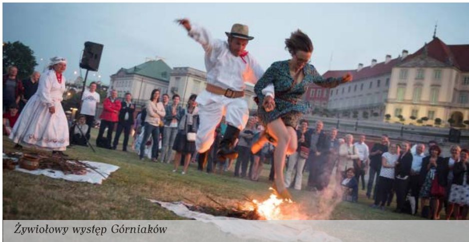
Żywiolowy występ Górniaków

Najbardziej prestiżową nagrodą dla zespołu czy ludowego twórcy w Polsce jest Nagroda im. Oskara Kolberga, i właśnie na rozdaniu kilkunastu laureatom tej nagrody w różnych kategoriach byli Górniacy. Niestety, na razie jedynie w formie atrakcji kulturalnej. Przedstawiali Lasowiackie sobótki, obrzęd prezentowany całkowicie inaczej (po puszczańsku), z ogniem i dymem w roli głównej. Wyszło pięknie, było prawdziwe ognisko w ogrodach Zamku Królewskiego w Warszawie.