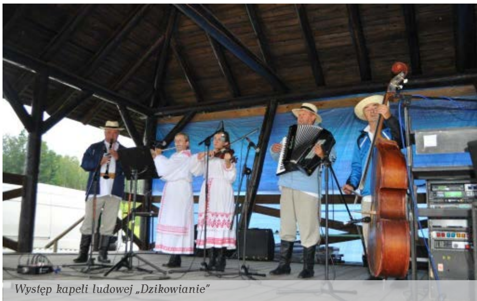
Występ kapeli ludowej „Dzikowianie”

Festyn zakończyła zabawa taneczna z zespołem Pro Dance.