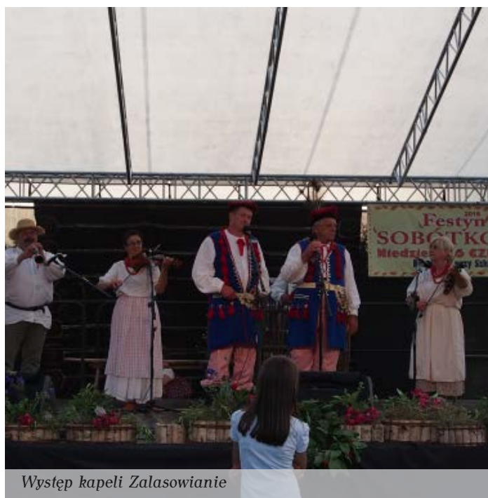
Występ kapeli Zalasowianie