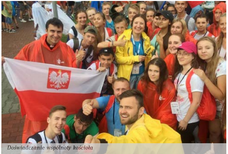
Doświadczanie wspólnoty kościoła

W piątek, 29 lipca, odbyła się Droga Krzyżowa, w czasie której młodzi, łącząc się z cierpiącym Jezusem, starali się dostrzec Go w otaczających ich wokół cier-