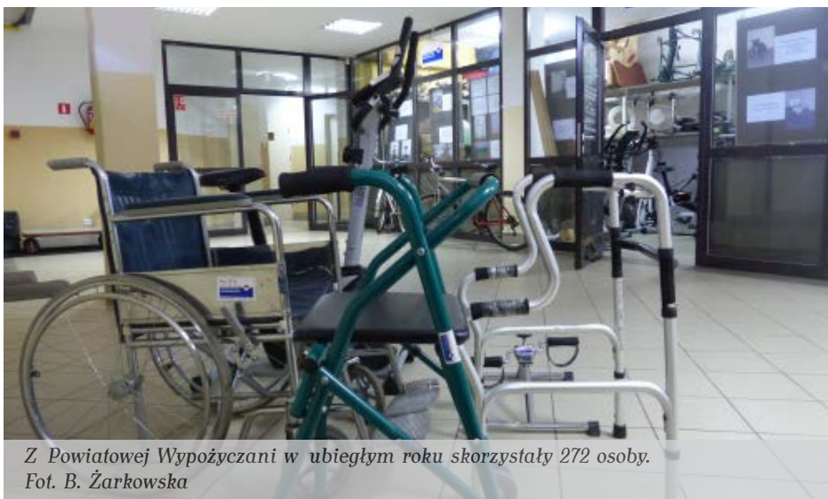
Z Powiatowej Wypożyczalni w ubiegłym roku skorzystały 272 osoby.