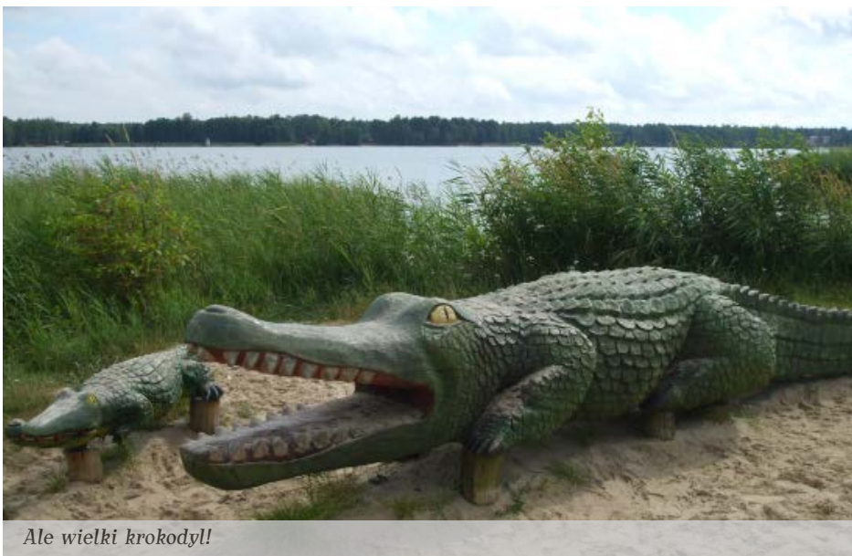
Ala wielki krokodyl!

Pięknych miejsc było co niemiara, nadbużańska przyroda niesamowita, efekty prac malarskich i fotograficznych obejrzeć będzie można w Galerii MDK w Kolbuszowej. Bębny już biją, trąby grają, zapraszamy w sobotę, 27 sierpnia br., początek o godzinie osiemnastej.