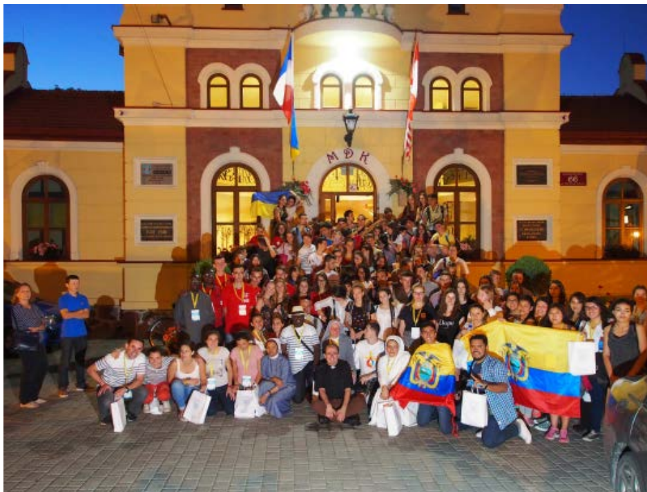
Będziemy pamiętać Waszą życzliwość - mówili Goście