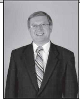
Dr n. med. Jarosław Ragan

Obowiązkowe dla wszystkich ubezpieczenie zdrowotne pokrywa 85% kosztów opieki zdrowotnej, wydatki OOP wynoszą 13,7% - najwięcej na leki, opiekę szpitalną, pielęgniarską i konsultacje lekarskie (opłaty za nie wprowadzono w 2004 r.); stanowią one 1/7 całości prywatnych kosztów pacjentów. Są odpisywane od podatku. Pozostałe to głównie bezpośrednie opłaty za usługi nierefundowane. Opłaty pacjentów: ryczałt 5-10 € za wszystkie leki - niezależnie od kosztów różnicy między poziomem refundacji a ceną ustawową; 10 € za dzień pobytu w szpitalu i sanatorium (do 28 dni w roku) i 5-10 € za usługi i produkty w opiece ambulatoryjnej, takie jak stomatologia, transport, porada pielęgniarska, rehabilitacja, wypisanie recepty. Od 2012 r. istnieje opłata 10 € na kwartał za pierwszą wizytę u lekarza (niekoniecznie GP) lub dentysty. Zwalniamy z współpłacenia: wiek (dzieci i młodzież), ciąża, szczególne potrzeby zdrowotne (choroby przewlekłe); dotyczy to ok. 30% populacji. Ok. 50% recept jest zwolnionych z opłat - zwolnienie przysługuje, jeśli roczne wydatki rodziny na ochronę zdrowia przekraczają 2% dochodów (przy poważnej chorobie przewlekłej 1%). Ubezpieczenie prywatne pokrywa wydatki na protezy dentystyczne, pobyt szpitalny, sprzęt medyczny. Wydatki OOP na zdrowie są w Niemczech dość niskie - 1,8% całkowitej konsumpcji rodziny. W 2011 r. rodzina ze średnimi dochodami