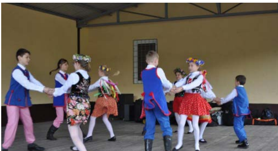
Tradycyjny Krakowiak w wykonaniu przedszkolaków