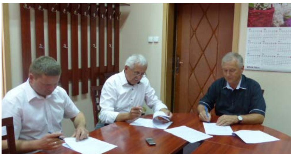
Podpisanie umowy na przebudowę dwóch odcinków dróg powiatowych.

Podpisanie umowy oznacza, że wykonawca, który wygrał przetarg, już wkrótce przystąpi do przebudowy dwóch odcinków dróg powiatowych. Jeden z nich obejmie odcinek drogi relacji Komorów – Huta Komorowska – Koniecpól. W ramach tego zadania położony zostanie nowy dywanik asfaltowy na długości ok. 5 km, wykonane zostanie również odwodnienie, pobocza oraz zjazdy. Inwestycja ta realizowana będzie w ramach funduszy, pozyskanych przez Powiat Kolbuszowski z Programu Rozwoju Obszarów Wiejskich na lata 2014-2020. W sumie wartość tego zadania wynosić będzie 1,7 mln zł.