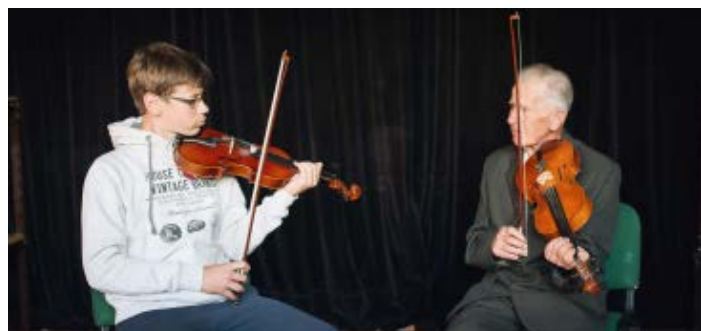
Ćwiczenia pod czujnym okiem mistrza