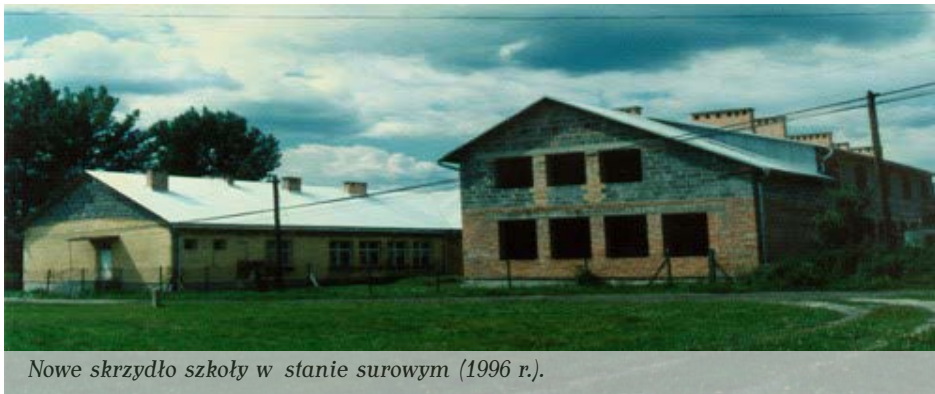
Nowe skrzydło szkoły w stanie surowym (1996 r.).