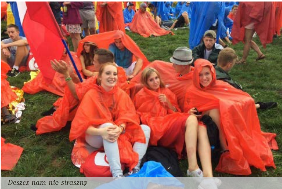
Deszcz nam nie straszny