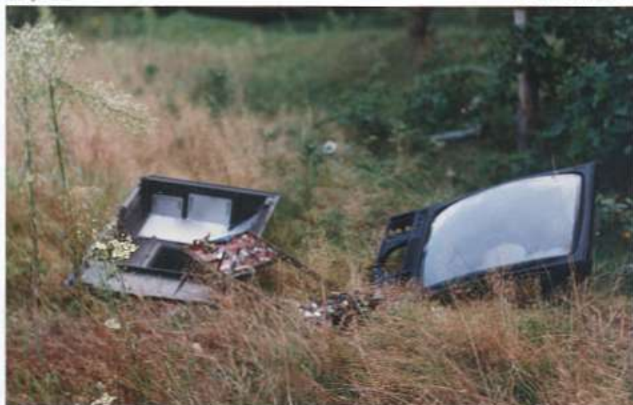
Wolał wyrzucić telewizor niż płacić?!

Odbiorniki radiowe i telewizyjne podlegają, dla celów pobierania opłat abonamentowych za ich używanie, zarejestrowaniu w państwowym przedsiębiorstwie użyteczności publicznej Poczta Polska w urzędach właściwych ze względu na obszar swego działania. Rejestracji należy dokonać w ciągu 14 dni od dnia ich nabycia.