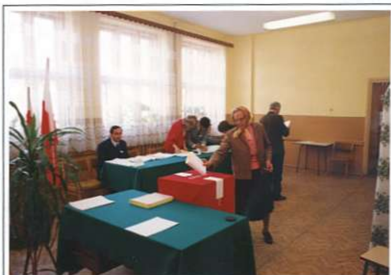
W lokalu wyborczym w Raniszewie