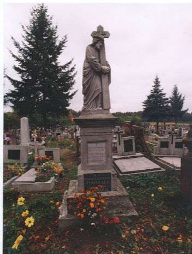
Grób rodziny Pomykałów