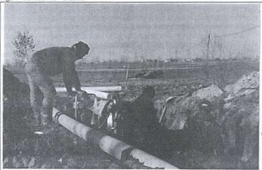
Prace przy budowie gazociągu średnioprężnego do Woli Ranizowskiej

11. Nie udało się doprowadzić do dokończenia budowy stanu surowego oraz pokrycia budynku Domu