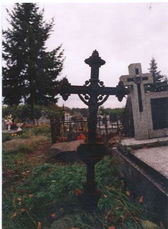
Krzyż nagrobny wykonany w XIX w. w Wiedniu