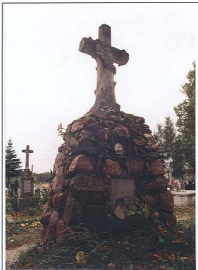
Zabytkowy nagrobek z roku 1899 na cmentarzu w Ranizowie

i by wyznać ci jękiem najcichszym że jesteś szczęśliwszy ode mnie pod ziemią głęboką choć mnie za oknem pachną owsy i dzikie wiśnie a tobie tylko twój własny popiół