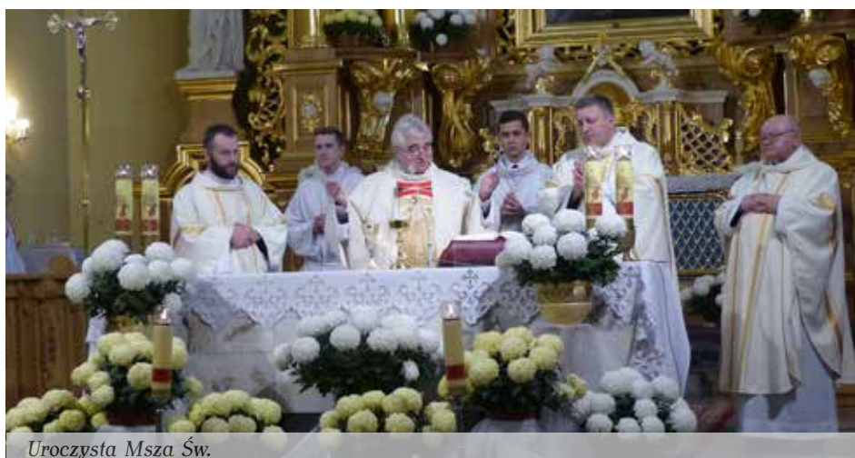
Uroczysta Msza Św.