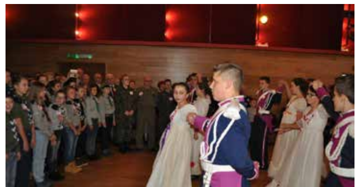
Uroczysty polonez, wspólne śpiewanie pieśni patriotycznych i zabawa taneczna po raz kolejny w kolbuszowskim MDK