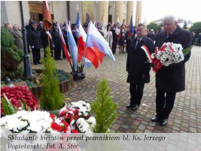
Składanie kwiatów przed pomnikiem bł. Ks. Jerzego Popiełuszki.