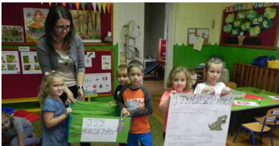
I Ty możesz pomóc - głosili plakaty umieszczone w przedszkolu