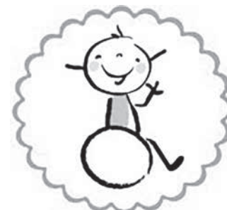
Zespół Szkół Specjalnych w Kolbuszowej Dolnej

Projekt pozwoli uczniom i nauczycielom poznać kulturę, historię i język krajów, z których pochodzą szkoły partnerskie. Kadra pedagogiczna będzie miała okazję rozwinąć swoje umiejętności językowe poprzez systematyczne komunikowanie się z partnerami w języku angielskim. Rezultatami projektu będą wypracowane przez wszystkie szkoły materiały dydaktyczne, dotyczące sportu i rekreacji osób niepełnosprawnych na świeżym powietrzu, które będą służyły rozwijaniu kompetencji nauczycieli, podnoszeniu efektywności i atrakcyjności zajęć, jak również ukazaniu możliwości i potrzeb dzieci i młodzieży niepełnosprawnej. Projekt ma także dać możliwość nawiązania kontaktów z zagranicznymi partnerami wśród uczniów i nauczycieli, mające wpływ na kolejne, wspólne przedsięwzięcia.