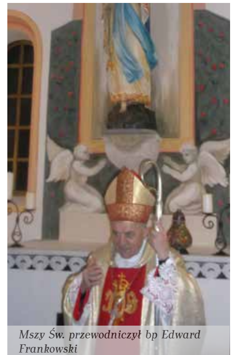
Mszy Św. przewodniczył bp Edward Frankowski

Odrestartowana kaplica Grobowa Rodu Kozłowieckich została wybudowana w II połowie XIX wieku w stylu klasycystycznym, na planie prostokąta, jedno-przestrzenna, zwrócona frontem na północ. Kaplica została wymurowana z cegły, obustronnie wytynkowana, nakryta spłaszczonym, dwuspadowym dachem. Wewnątrz kaplicy, na ścianie głównej, nad ołtarzem, umieszczona jest odnowiona gipsowa figura Matki Bożej Niepokalanej w przedstawieniu Lourdzkim. Figura Maki Bożej, datowana na rok 1879, została ufundowana przez ks. Józefa Tałasiewicza, probosz-