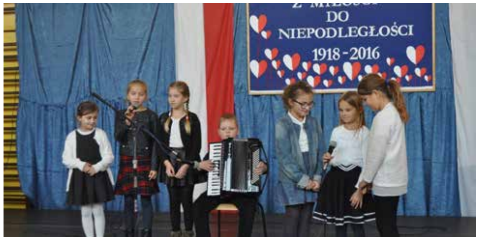
Piosenki patriotyczne rozbrzmiewały gromko ze sceny w Zespole Szkół nr 1

13 listopada, w hali sportowej Liceum Ogólnokształcącego, najmłodszy mieszkańcy gminy Kolbuszowa bawili się na kolejnym Balu Niepodległościowym Przedszkolaka. Organizatorem imprezy był Zarząd Osiedla nr 1, 2, 3, Fundacja na Rzecz Kultury Fizycznej i Sportu, a odbył się on pod patronatem Burmistrza Kolbuszowej.