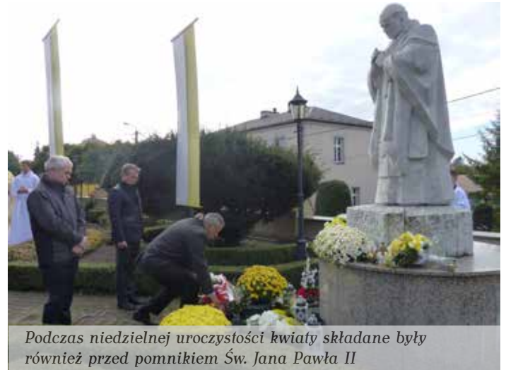
Podczas niedzielnej uroczystości kwiaty składane były również przed pomnikiem Św. Jana Pawła II