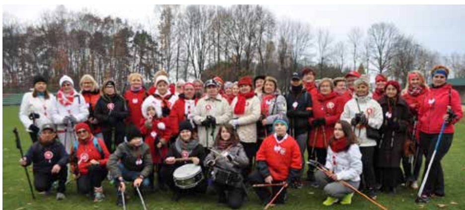
Kolbuszowscy klubowicze, jak co roku, włączyli się w obchody Święta Niepodległości

Już po raz czwarty Kolbuszowski Klub Nordic Walking włączył się w obchody Święta Niepodległości w naszym mieście. Zapaleni chodździarze spotkali się na parkingu przy budynku Starostwa, skąd, przy uderzeniach werbli, różnym krokiem przemierzono ulicami miasta kierując się na Stadion. Uczestnicy marszu ubrani byli jedni w białe, drudzy w czerwone stroje, tak, aby idąc tworzyć flagę. Każdy z uczestników otrzymał pamiątkowy kotylion w barwach narodowych. Jesienna pogoda nie zraziła tych, którzy chcieli uczcić święto. Na miejscu zbiórki stawiło się około 40 osób. Byli to nie tylko członkowie Klubu, ale także inni mieszkańcy. Ważnym akcentem był udział uczniów szkoły podstawowej. Biało - czerwona kolumna szła ulicą 11 listopada, Parkową, następnie wokół Rynku, tak aby ulicą Piłsudskiego dojść na stadion. Tu tradycyjnie już zrobiono sobie wspólne pamiątkowe zdjęcie. Po wspólnym zdjęciu uczestnicy zasiedli do ciepłego posiłku i herbatki.