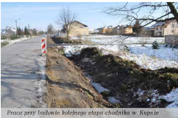
Prace przy budowie kolejnego etapu chodnika w Kupnie

Końcem września zakończono prace przy przebudowie ul. 22 Lipca w Kolbuszowej. Zakres robót na odcinku 700 metrów obejmował: frezowanie istniejącej nawierzchni, ułożenie warstwy profilowanej, krawężników, warstwy wiążącej i ściernalnej z betonu asfaltowego, regulację studni. Koszt inwestycji to blisko 267 tys. zł.