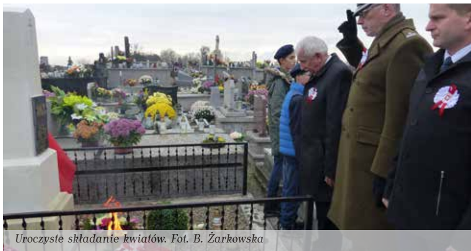
Uroczyste składanie kwiatów.