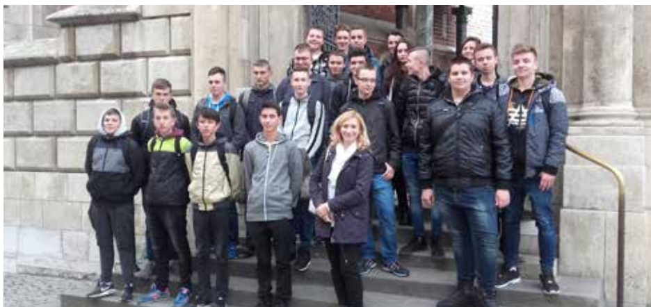
Młodzież Zespołu Szkół Technicznych zachwycona perłą światowego renesansu