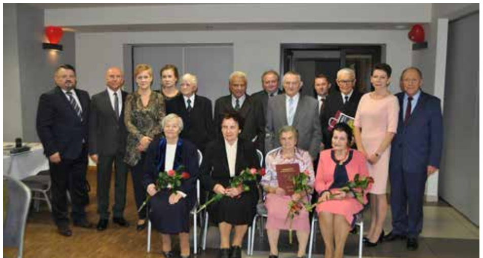
Pamiątkowe zdjęcie szacownych Jubilatów

Prosimy zainteresowane pary małżeńskie, które osiągnęły wymagany staż (co najmniej 50 lat) i są zainteresowane otrzymaniem medalu od Prezydenta RP o kontakt z USC w Kolbuszowej (tel. 17 2271 513). W szczególności prosimy o informacje od tych par, które brały ślub poza Kolbuszową, a obecnie zamieszkują na jej terenie.