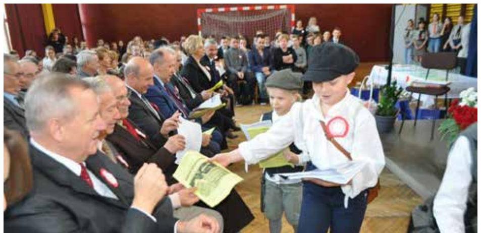
Uczniowie zaprezentowali program „Z miłości do niepodległości”