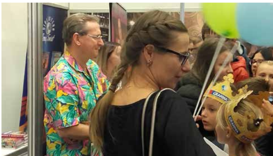
Spotkanie z Wojciechem Cejrowskim było nie lada atrakcją dla wszystkich wielbicieli książki