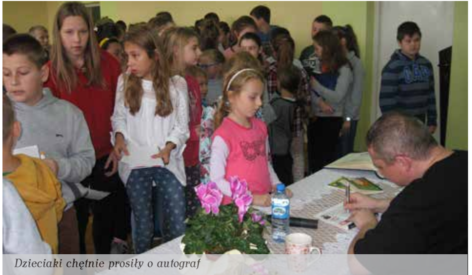
Dzieciaki chętnie prosiły o autograf