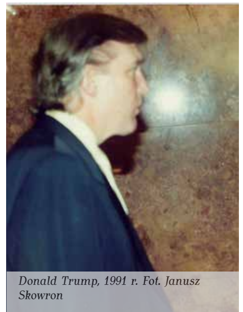
Donald Trump, 1991 r.