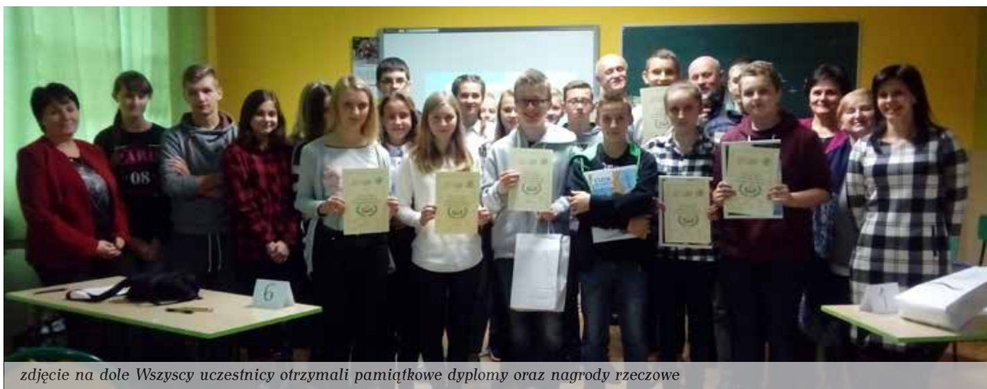
zdjęcie na dole Wszyscy uczestnicy otrzymali pamiątkowe dyplomy oraz nagrody rzeczowe