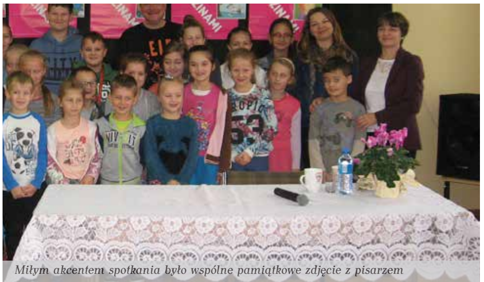
Miłym akcentem spotkania było wspólne pamiątkowe zdjęcie z pisarzem