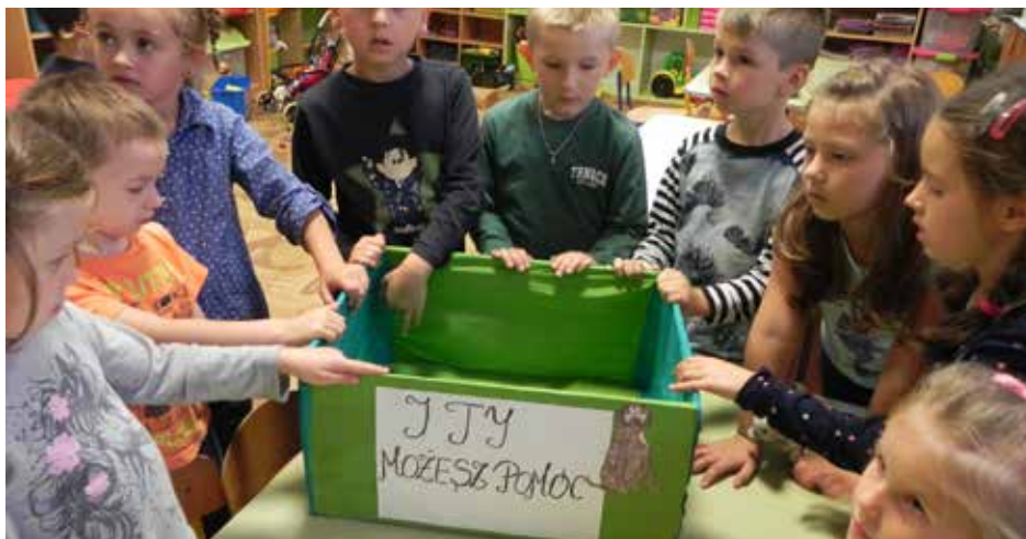
Los zwierzaków jest szczególnie bliski małym dzieciom

Akcja „I Ty możesz pomóc” odbyła się w przedszkolu po raz pierwszy, lecz z pewnością nie ostatni.