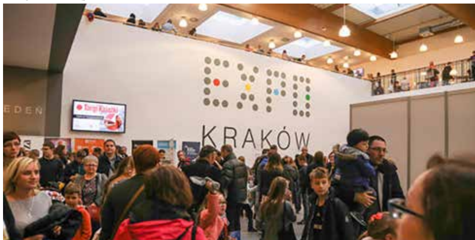
Hasłem tegorocznych krakowskich Targów Książki były słowa wybitnego pisarza Etgara Kereta „Żeby czytać, trzeba być otwartym”

Kolbuszowscy bibliotekarze, wraz z klubowiczami DKK z biblioteki miejskiej i filii w Bukowcu, oraz nasi wolontariusze, w sobotę, 29 października, wzięli udział w Targach Książki w Krakowie.