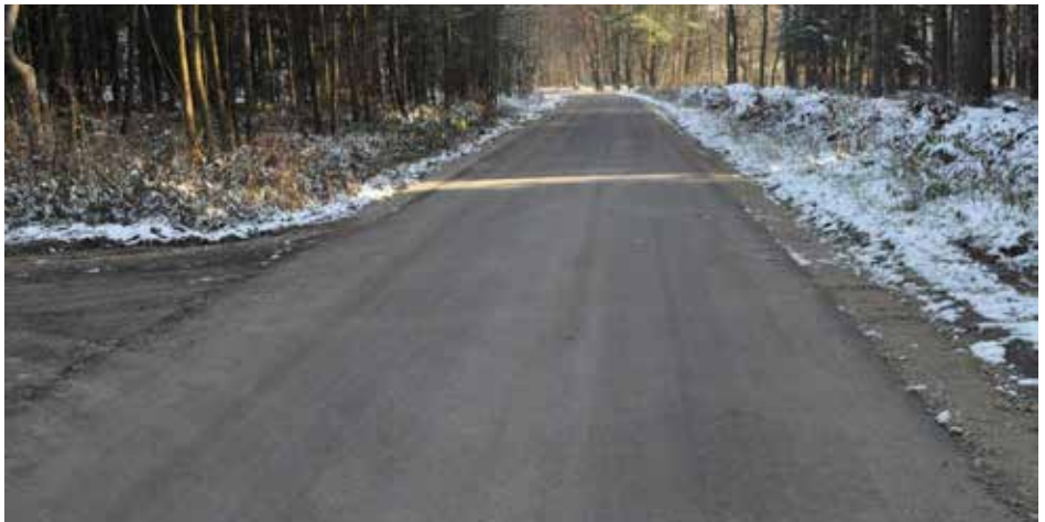
Droga Poręby Kupieńskie - Budy Głogowskie

Wykonano odcinki kanalizacji sanitarnej w rejonie ulicy i kanalizację sanitarną z przyłączami w rejonie Parku Etnograficznego za kwotę 140 tys. zł.