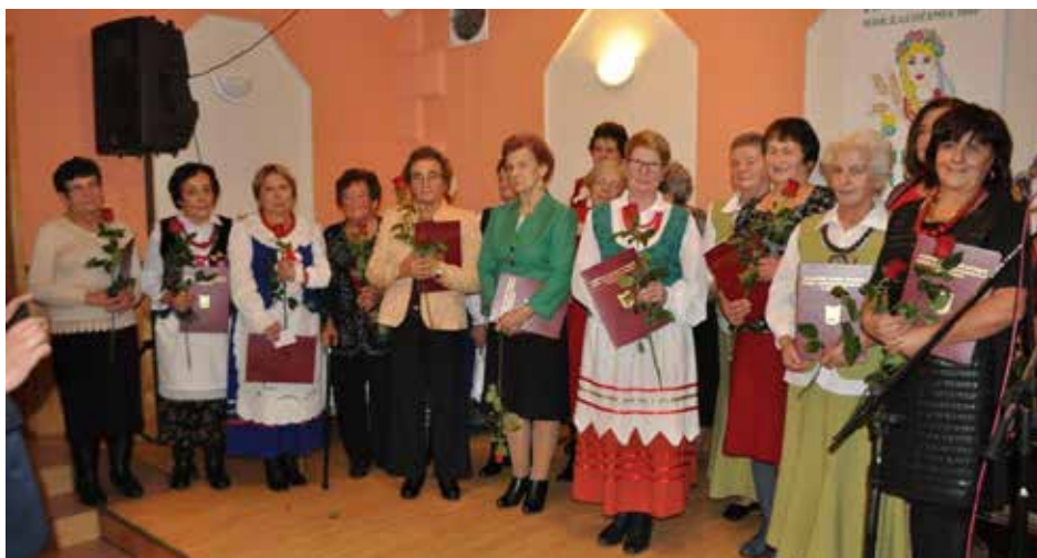
Podczas uroczystego spotkania zostały wręczone odznaczenia i dyplomy okolicznościowe dla wspianiałych kobiet