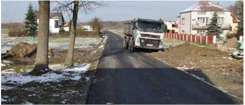
Droga Widelka - Majdan

Na ukończeniu są prace przy modernizacji ponad 3 km odcinka ul. Wolskiej.