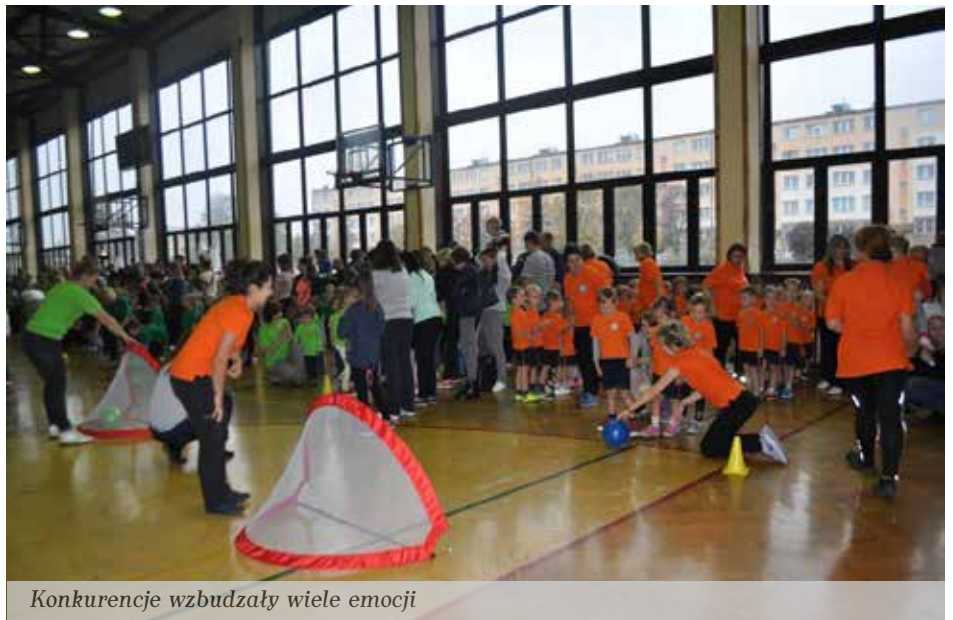
Konkurencje wzbudzały wiele emocji