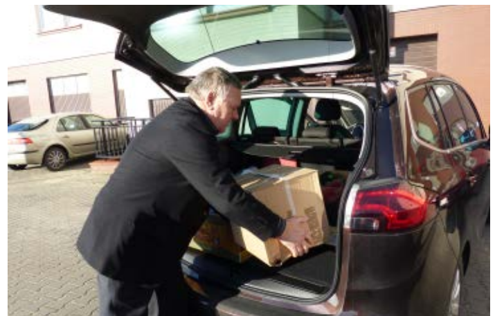
Wszystkim pracownikom Starostwa Powiatowego oraz jednostek dziękujemy za włączenie się w przygotowanie Świątecznych Paczek dla potrzebujących rodzin z powiatu kolbuszowskiego.