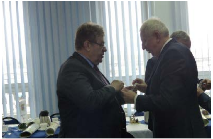
Wspólne łamanie opłatkiem.