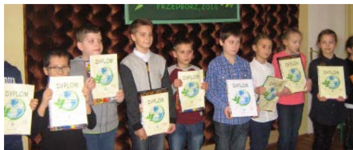
Laureaci IV edycji wojewódzkiego konkursu „ABC Ekologii”

Tradycyjnie uczestników odwiedził i obdarował słodyczami św. Mikołaj.