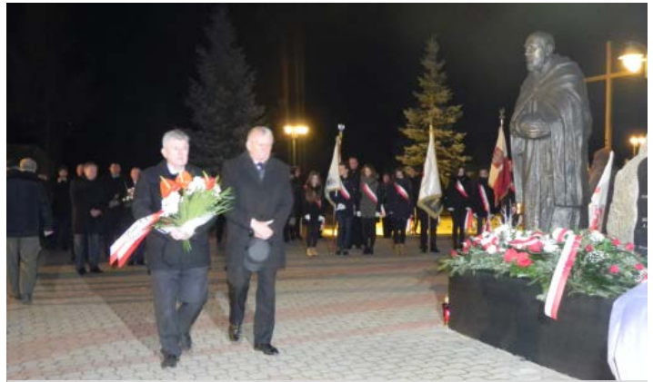
Uroczystości upamiętniające 35. rocznicę wprowadzenie stanu wojennego.