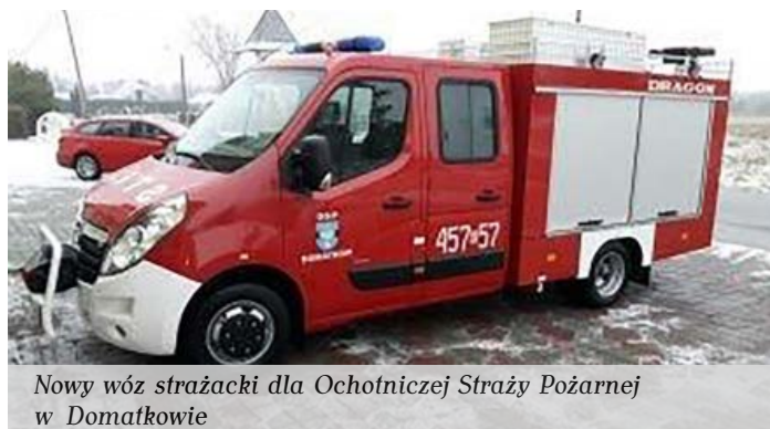
Nowy wóz strażacki dla Ochotniczej Straży Pożarnej w Domatkowie

Współpraca samorządu gminy Kolbuszowa ze strażą pożarną układa się bardzo dobrze. Zarówno burmistrz, jak i radni widzą potrzebę inwestowania w rozwój pożarnictwa i wiedzą, że są to dobrze zainwestowane pieniądze.