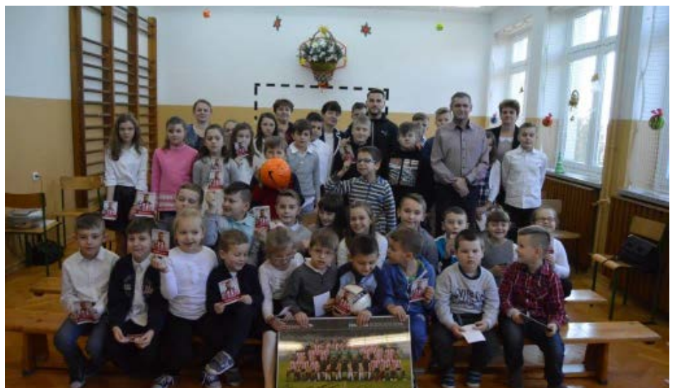
To jest wzór do naśladowania!