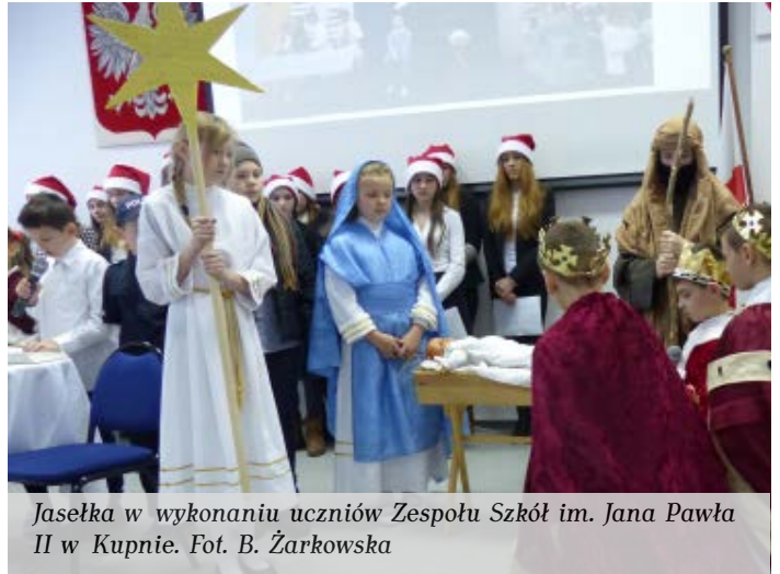
Jasełka w wykonaniu uczniów Zespołu Szkół im. Jana Pawła II w Kupnie.