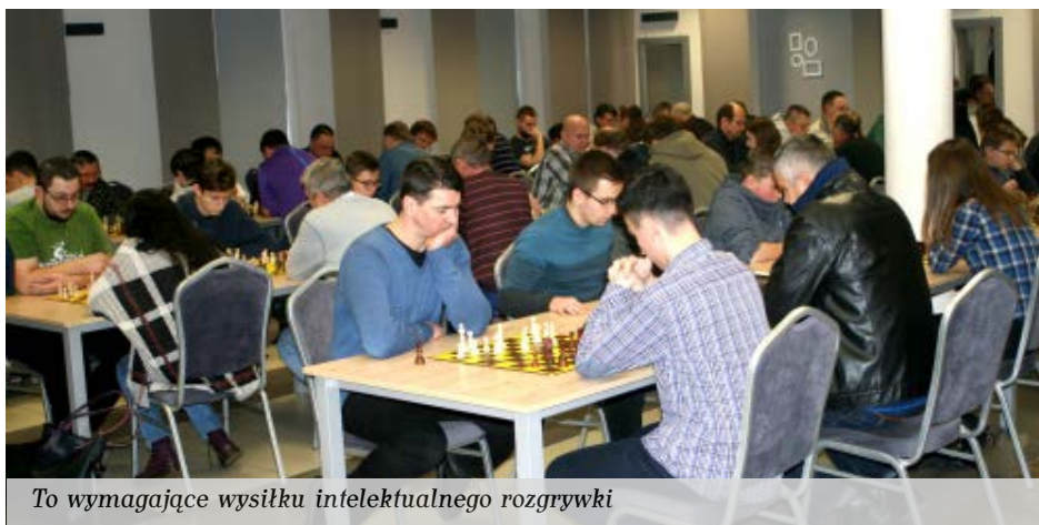
To wymagające wysiłku intelektualnego rozgrywki

Serdeczne podziękowania należą się fundatorom nagród, którymi byli: Gmina Kolbuszowa, firma ZET-BUD z Kolbuszowej oraz firma AUTO COMPLEX z Kolbuszowej Górnjej.