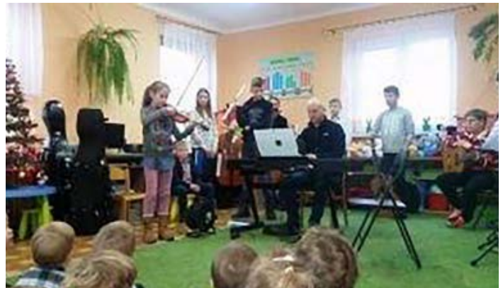
Dzieciaki chętnie wysłuchali koncertu