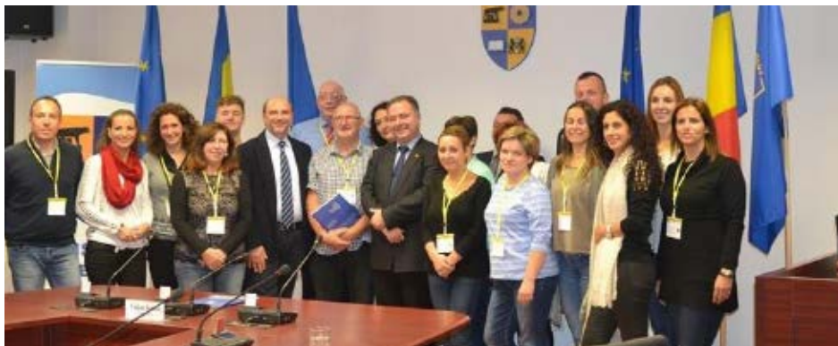
Przedstawiciele ZSS z Kolbuszowej Dolnej w międzynarodowej społeczności realizującej projekt

W ostatnim dniu nauczyciele uczestniczący w szkoleniu oraz w międzynarodowym spotkaniu projektowym brali udział w ewaluacji dotyczącej wizyty i otrzymali certyfikaty udziału.