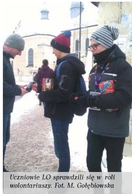
Uczniowie LO sprawdzili się w roli wolontariuszy.