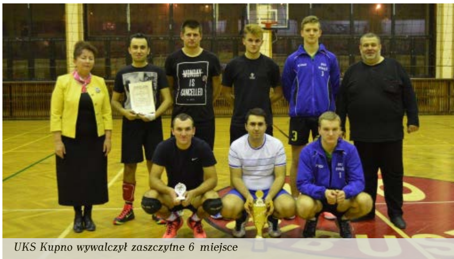
UKS Kupno wywalczył zaszczytne 6 miejsce