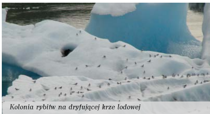
Kolonja rybitw na dryfującej krze lodowej