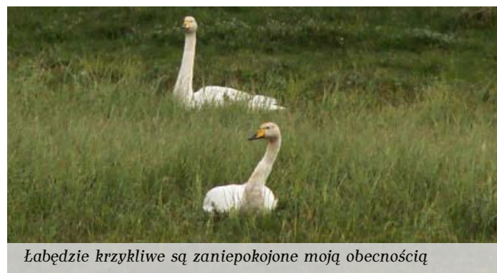
Łabędzie krzykliwe są zaniepokojone moją obecnością