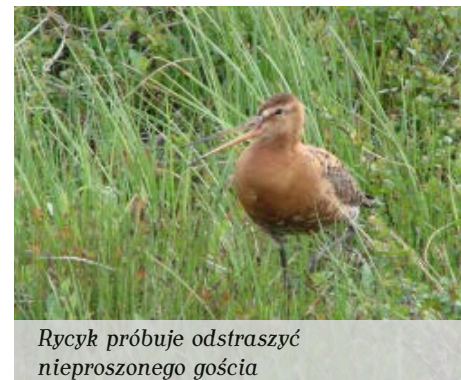
Rycyk próbuje odstraszyć nieproszonego gościa