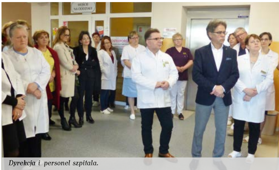
Dyrekcja i personel szpitala.