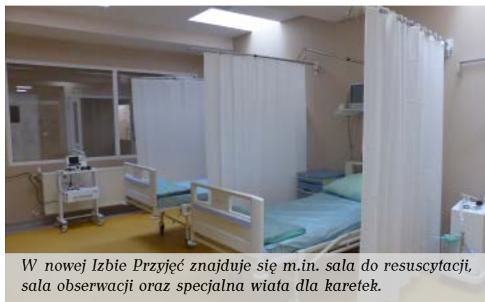
W nowej Izbie Przyjęć znajduje się m.in. sala do resuscytacji, sala obserwacji oraz specjalna wiata dla karetek.