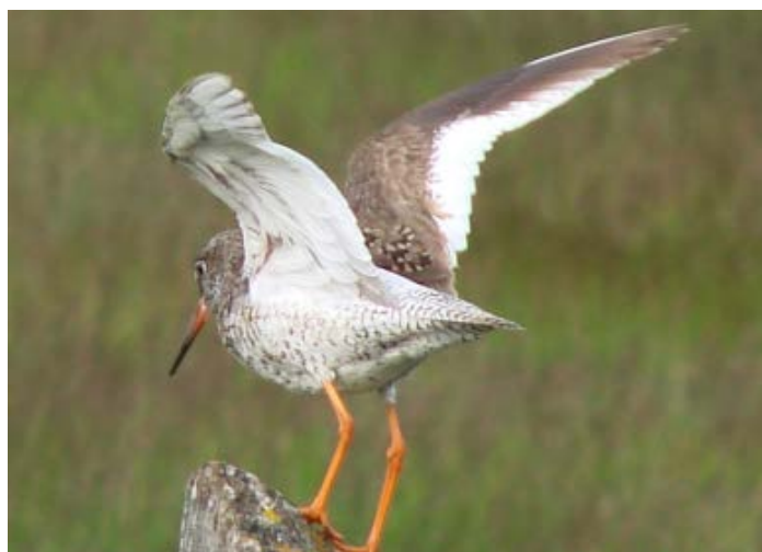
Brodziec krwawodzioby zawsze pilnuje swego terytorium