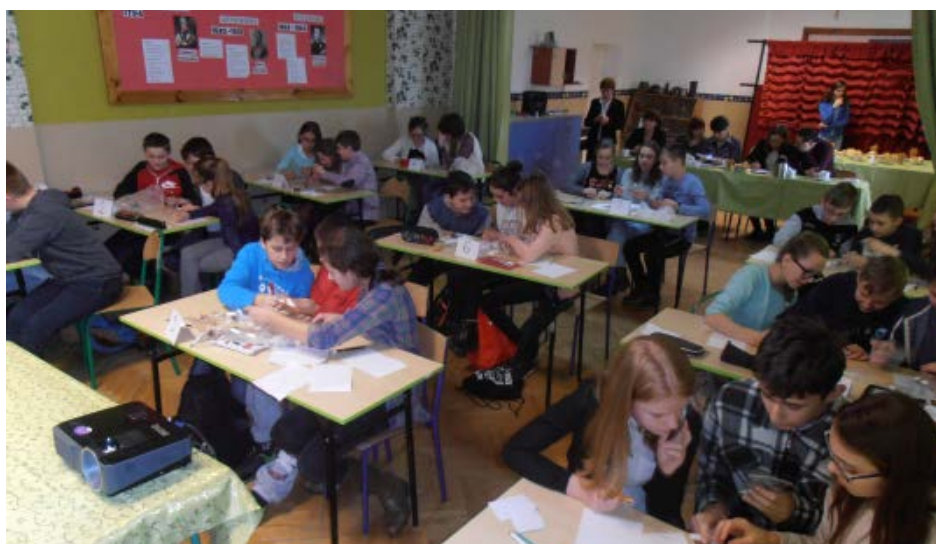
Praca w zespołach