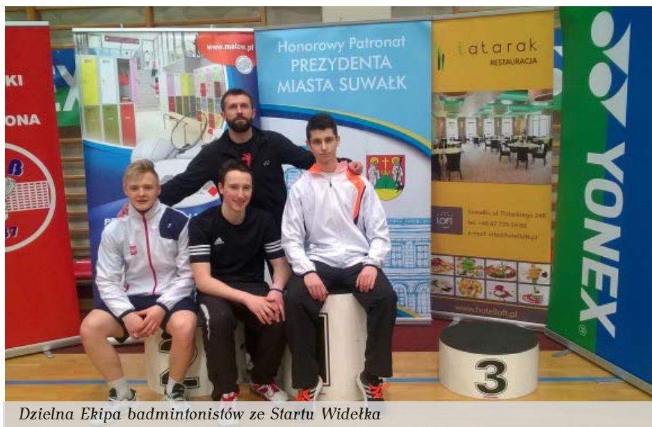
Dzielna Ekipa badmintonistów ze Startu Widełka