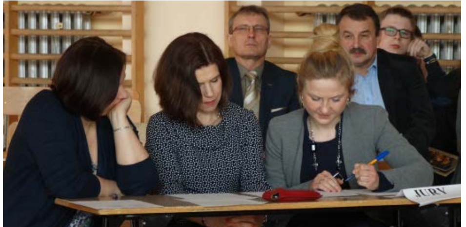
Poszczególne drużyny rywalizowały ze sobą w pięciu konkurencjach, które oceniało jury