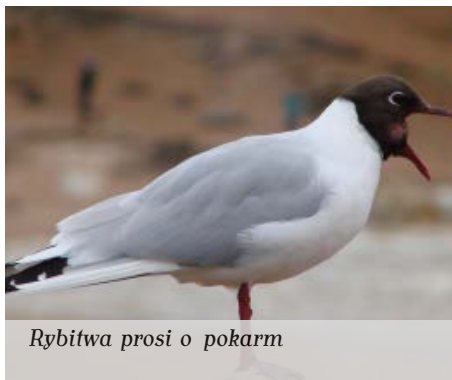
Rybitwa prosi o pokarm