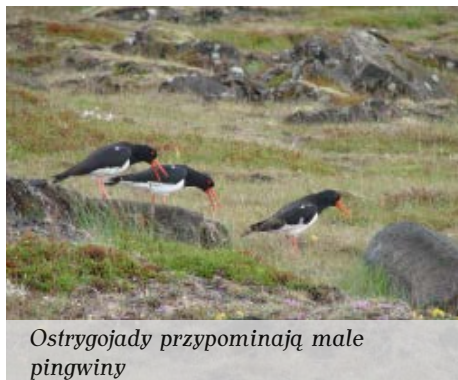
Ostrygojady przypominają male pingwiny