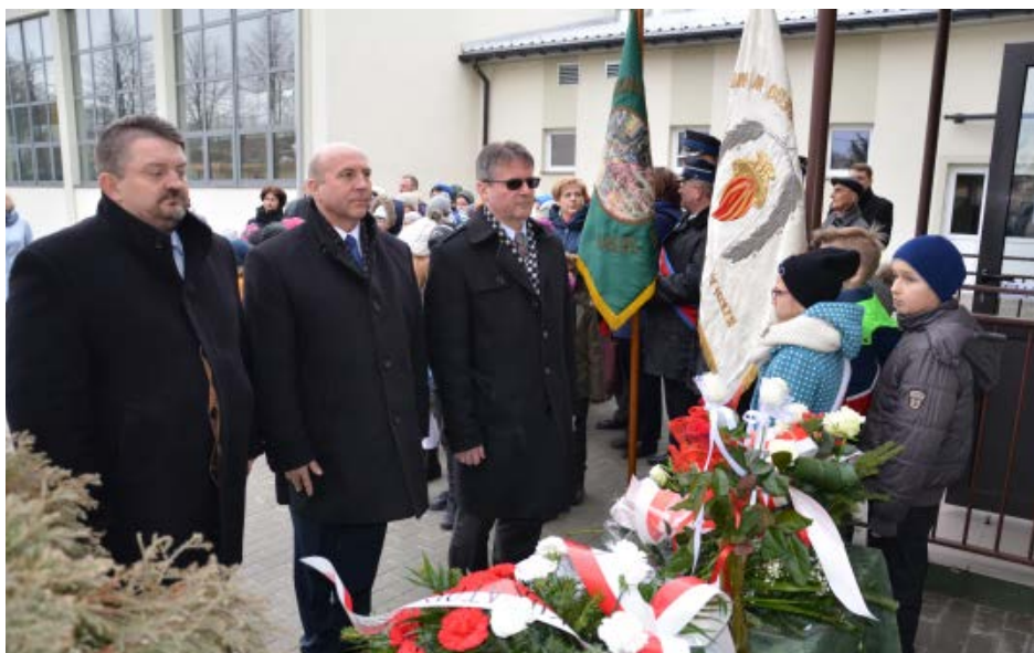
Złożenie hołdu Patronowi Szkoły przez przedstawicieli Samorządu Kolbuszowskiego