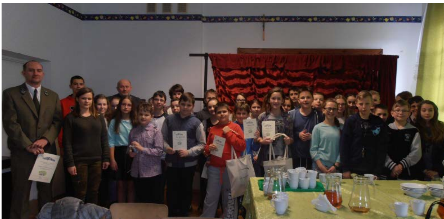
Wybitni matematycy i przyrodnicy