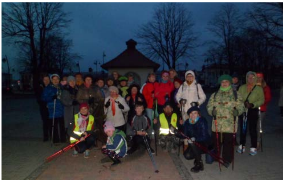
Mieszkańcy Kolbuszowej sportowo uczcili Dzień Kobiet

Każda okazja do świętowania jest szansą na wspólne spędzenie czasu w towarzystwie przyjaciół, znajomych lub ludzi, z którymi dzielimy wspólne pasje i zainteresowania. Taką okazję mieli mieszkańcy Kolbuszowej i okolic, którzy w czwartek, 9 marca 2017 r., uczcili Święto Kobiet wspólnym marszem nordic walking. Organizatorem marszu był Kolbuszowski Klub Nordic Walking, Fundacja na Rzecz Kultury Fizycznej i Sportu oraz Zarządy Osiedli 1, 2 i 3. Kolbuszowski Klub Nordic Walking od kilku lat aktywnie działa na rzecz popularyzacji nordic walking jako wspaniałego sposobu rekreacji oraz dyscypliny sportowej, w której każdy, niezależnie od metryki, może osiągać sukcesy i bić kolejne rekordy. W czwartek jednak nie chodziło o rekordy, lecz o miłe spędzenie czasu, na które zdecydowało się 30 osób. Po rozgrzewce i wspólnym pamiątkowym zdjęciu przy krokodylu, ruszyliśmy do przemarszu. Najpierw rundka „honorowa” wokół Rynku, a następnie szliśmy ulicą Piłsudskiego tak, by zakończyć marsz na stadionie, gdzie czekała na nas gorąca herbata, kawa i przepyszne ciasteczko oraz niespodzianki... Tu, przy radosnych rozmowach przy kawie i ciastku, każdy z maszerujących otrzymał prezent – niespodziankę z rąk Prezesa Fundacji