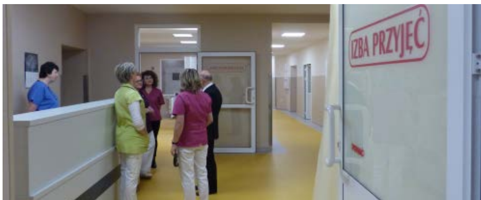
Izba Przyjęć do użytku oddana została 20 lutego br.