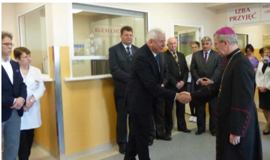
Wizyta ks. bpa Jana Wątroby w Szpitalu Powiatowym w Kolbuszowej.