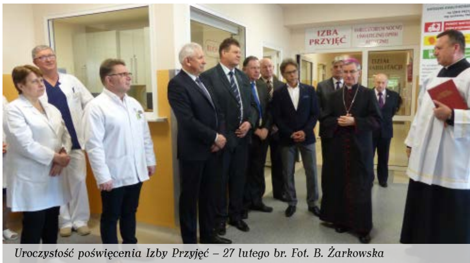
Uroczystość poświęcenia Izby Przyjęć – 27 lutego br.