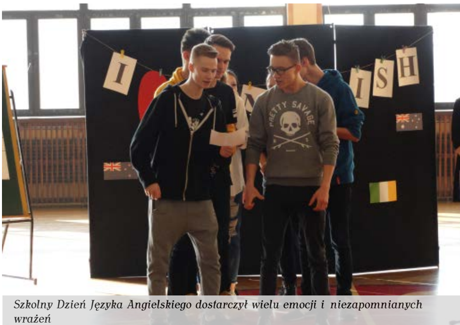
Szkolny Dzień Języka Angielskiego dostarczył wielu emocji i niezapomnianych wrażeń