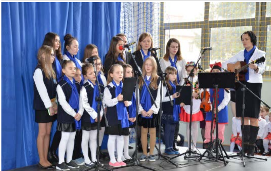
Uczniowie szkoły zachwycili zebranych swoim programem artystycznym