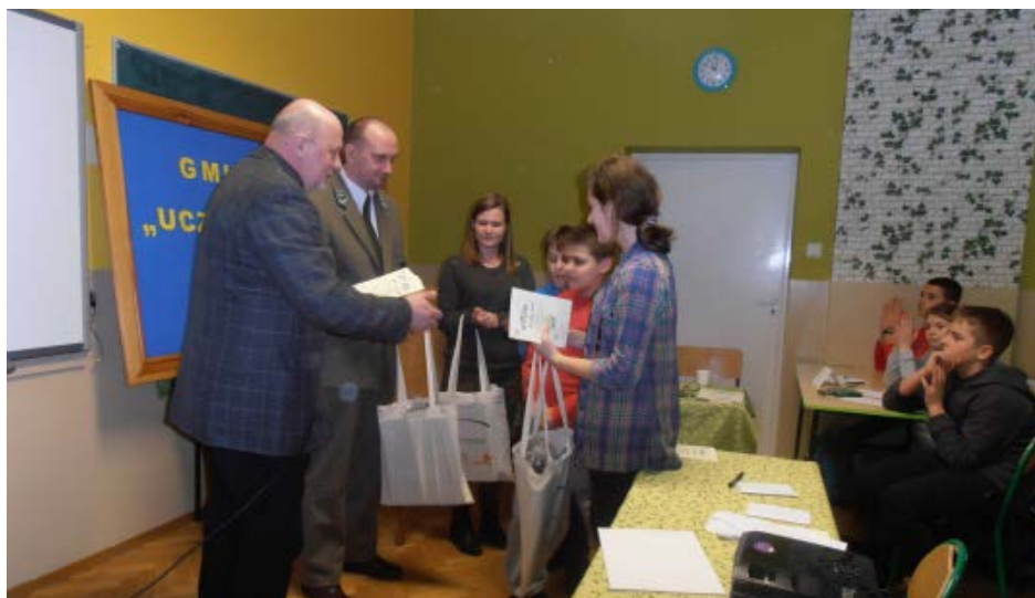
Uroczyste rozdanie nagród

Wszystkim uczestnikom życzymy dalszych sukcesów.