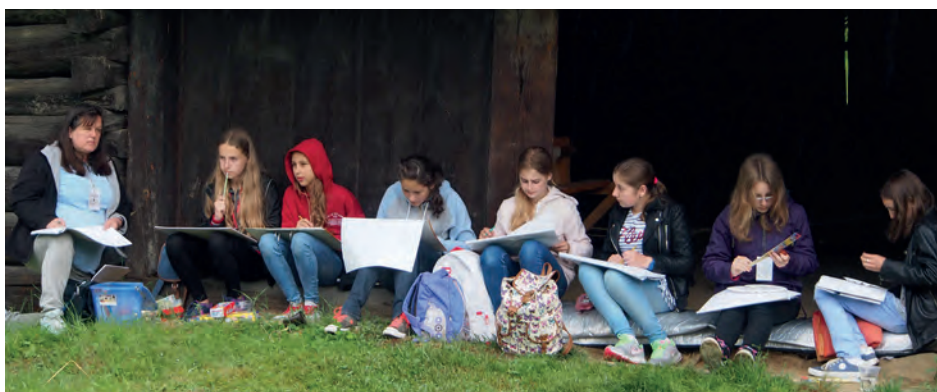
Mimo niesprzyjającej aury artyści pracowali z zapałem

Kolejna plenerowa lekcja wrażliwego spojrzenia na świat została z nawiązką odrobiona!