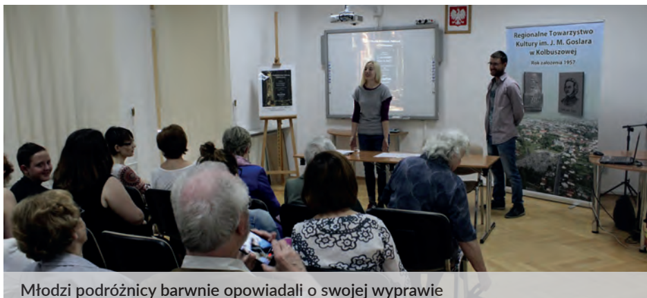
Młodzi podróżnicy barwnie opowiadali o swojej wyprawie

Stolicą Tajlandii jest Bangkok i właśnie od niego młodzi odkrywcy zaczęli opowiadać swą przygodę z Azją. To miasto bardzo przeludnione i zakorkowane, liczące przynajmniej 8 milionów mieszkańców. Często spotykanym środkiem lokomocji są pojazdy znane jako tuk-tuki. Stolica raczej nie przypomina reszty Tajlandii. To serce kraju, gdzie prężnie rozwija się wielki biznes, centra handlowe i wysokie biurowce. W tym ledwo ogarniętym chaosie architektonicznym nowoczesność miesza się z tradycją. Pozostała Tajlandia to tereny rolnicze z polatkami ryżowymi, górskie rejony z bujnymi lasami i piękne plaże na południu kraju. Nazwę stolicy tłumaczy się jako Miasto Aniołów, Wielkie Miasto Nieśmiertelnych czy Miasto Królewskich Pałaców. Pośrodku starego królewskiego miasta, zbudowanego na wzór dawnej stolicy - Ajuttii, znajduje się Wielki Pałac oraz Świątynia Szmaragdowego