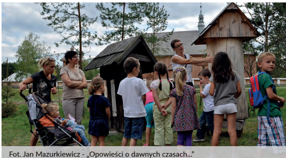
„Opowieści o dawnych czasach...”