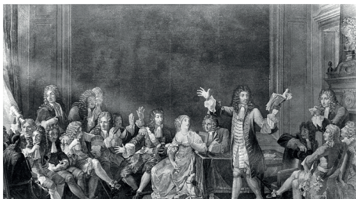
Historyczne tradycje Dyskusyjnych Klubów Książki

Pisząc artykuł zacerpnęłam wiadomości na temat DKK ze strony lubimyczytac.pl