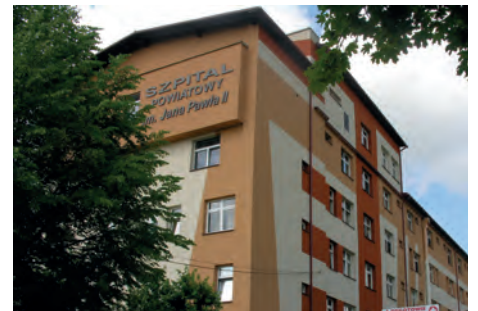
Kolbuszowski Szpital Powiatowy został zakwalifikowany do tzw. sieci szpitali Ministerstwa Zdrowia.

szowie (ul. Fryderyka Szopena), SP ZOZ Górnice,