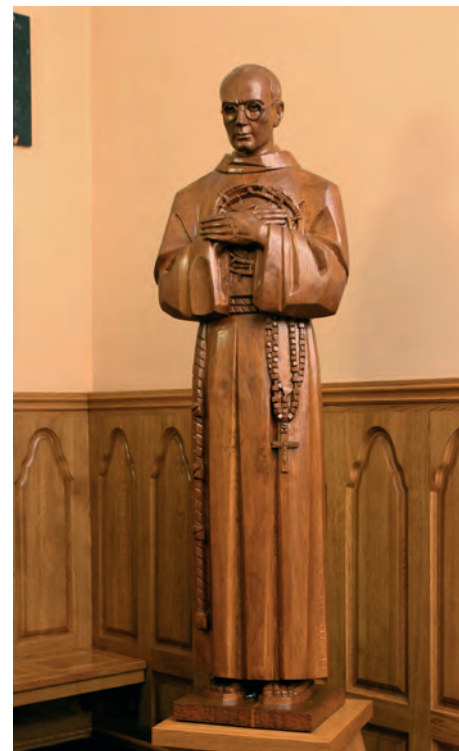
Postać św. Maksymiliana Kolbego w przedsionku kościoła