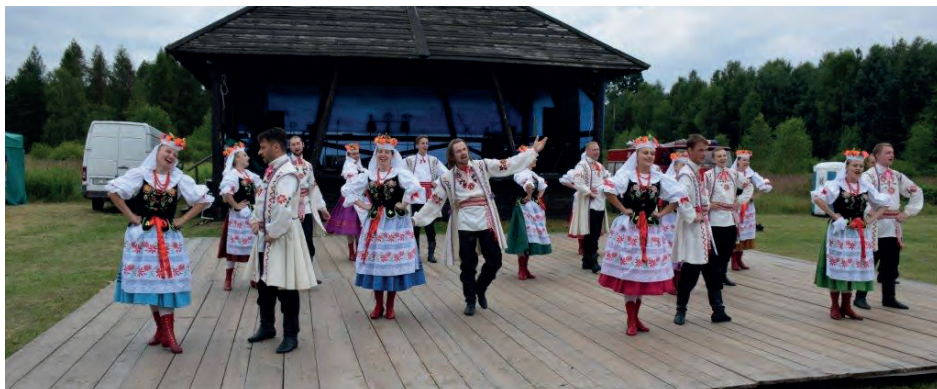
Występ Polonijnego Folklorystycznego Zespołu Pieśni i Tańca „Karolinka” z Białorusi

Zabawa taneczna z zespołem Pro-Dance zakończyła niedzielny festyn.