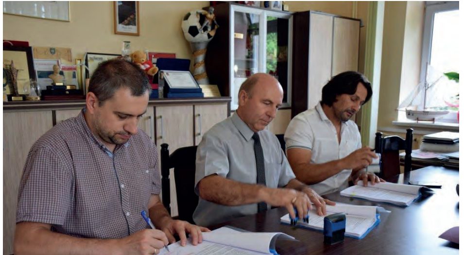
Podpisanie umowy na przebudowę części SP w Hucie Przedborskiej na Dzienny Dom Senior+

Dzienny dom „Senior +” oferował będzie miejsca dla co najmniej 15 osób. Obiekt daje możliwość zwiększenia liczby seniorów do 25 osób. W budynku będzie dostępna m.in. sala komputerowa, biblioteka, sala telewizyjna, sala ćwiczeń i rehabilitacji.