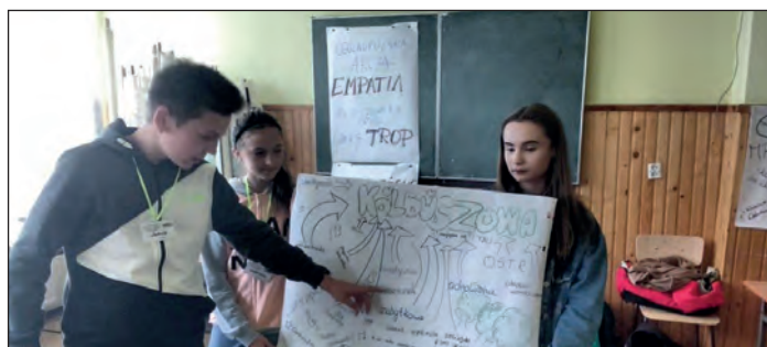
Uczestnicy konferencji dzielili się doświadczeniami ze swojej pracy