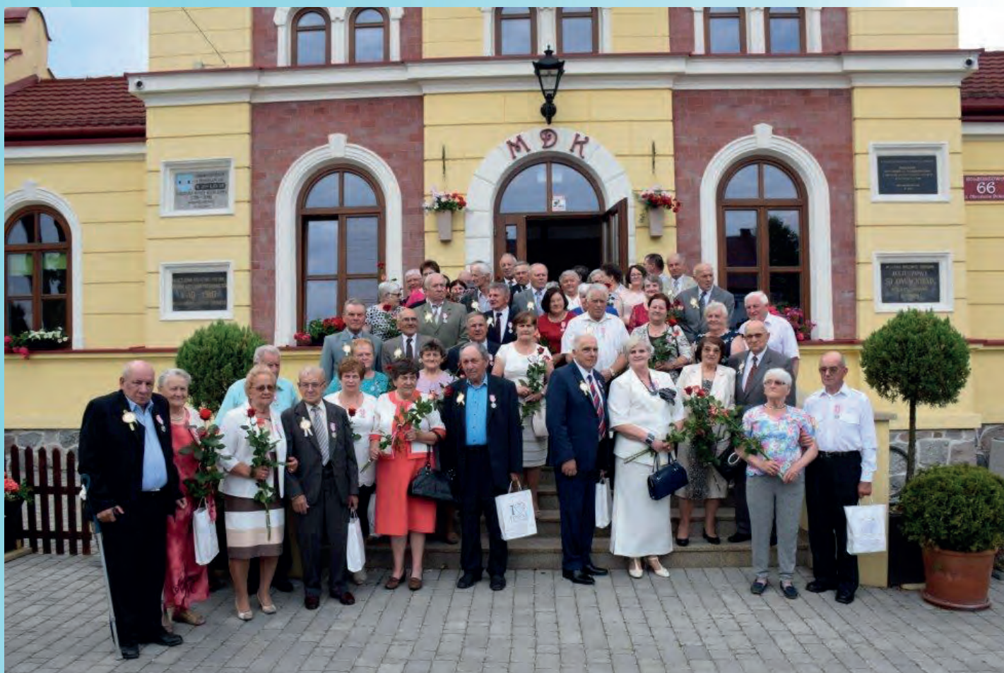
36 par świętowało złote i diamentowe gody. Relacja na stronie 3.

„Mądrość jest córką doświadczenia; życie ludzkie jest nieustanną szkołą». (Leonardo da Vinci)