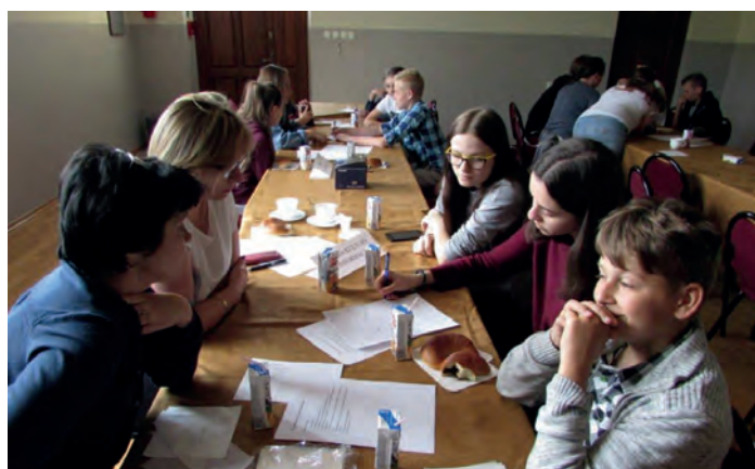
Owocne obrady MRM w Kolbuszowej