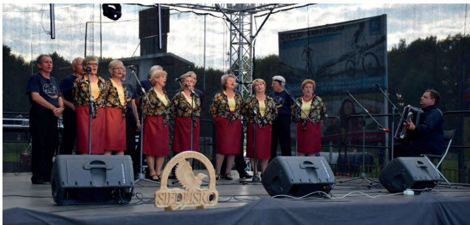
Występ zespołu folklorystycznego seniorów "Ziemia Podkarpacka"