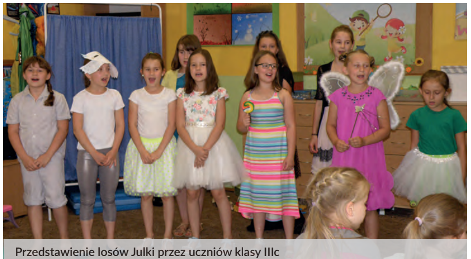
Przedstawienie losów Julki przez uczniów klasy IIIc

Dużo wzruszeń dostarczyło przekazanie podziękowań wszystkim rodzicom za miłą 3-letnią współpracę oraz wręczenie