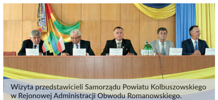
Wizyta przedstawicieli Samorządu Powiatu Kolbuszowskiego w Rejonowej Administracji Obwodu Romanowskiego.

Celem wizyty przedstawicieli Samorządu Powiatu Kolbuszowskiego było uczestnictwo w obchodach Dni Romanowa. Były występy dzieci, młodzieży oraz ukraińskiego Chóru „Dla Duszy”.