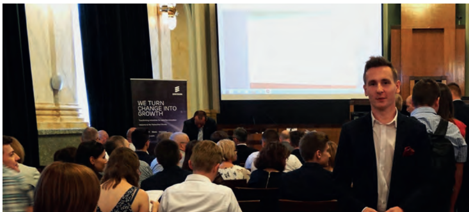
Uroczyste zakończenie olimpiady w AGH