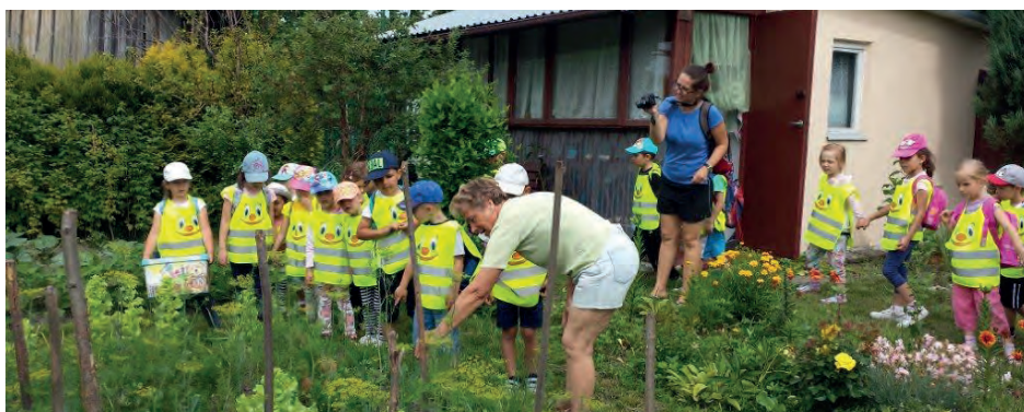
Młodzi działkowicze chętnie rozwijają swoją pasję

Na każde spotkanie z małymi ogrodnikami przygotowuje poczęstunek i wiele innych atrakcji. - Zależy mi, by dzieci nie tylko mogły się wiele nauczyć, ale też miło spędzić z nami czas. Każdej wizycie towarzyszą więc gry i zabawy, ale również zwiedzanie ogrodu i rozmowy z działkowcami - wyjaśnia prezes. Dotychczas w zajęciach wzięło udział ok. 70 dzieci. - Świetnie sobie radzą ze wszystkimi pracami w naszym ogrodzie - przekonuje A. Chmielowski. - Zaskoczeniem jest dla nas ich ogromne zaangażowanie. Do każdej pracy dzieci podchodzą bardzo żywiołowo. Każde chce coś zrobić. Nie ma przy