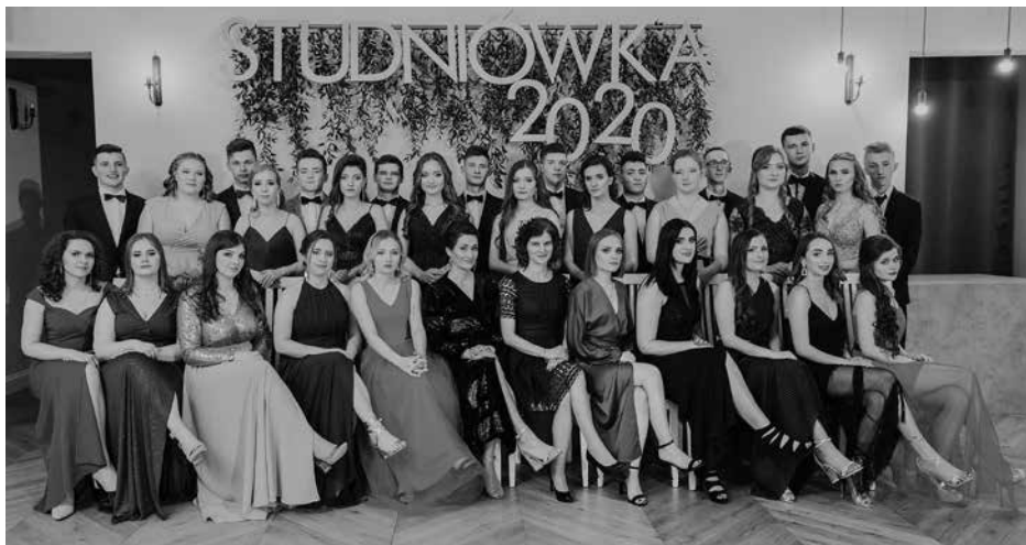
Tegoroczni maturzyści w pełnej krasie.

„Nie byliśmy już niedoświadczonymi pierwszoklasistami, lecz maturzystami wkraczającymi w dorosłe życie... Jak ten czas szybko mija... Nawiązaliśmy nowe znajomości, które zostaną w naszych sercach na długie lata” – wspominają bal studniówkowi maturzyści. Jak mawiała Szymborska: „... Żaden dzień się nie powtórzy, nie ma dwóch podobnych nocy...”, a szkoda, bo ta stud-