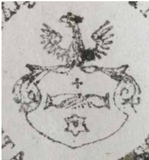
Herb na pieczęci miejskiej z 1875 r. (CPAHU we Lwowie)