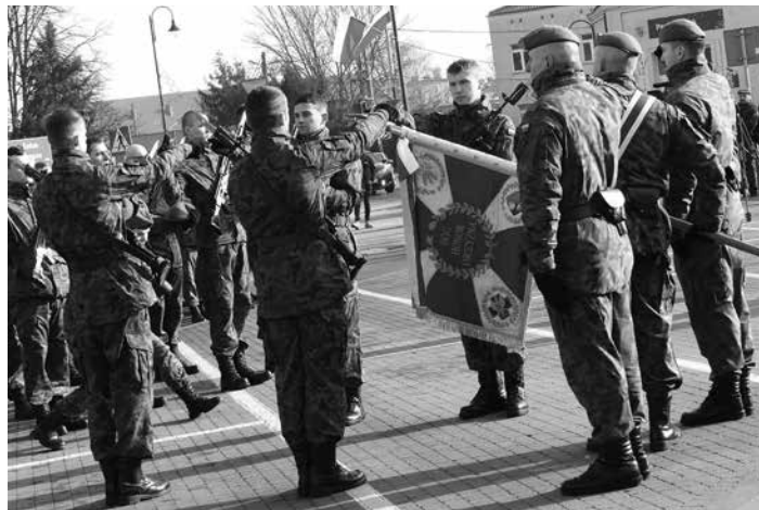
Na kolbuszowskim Rynku przysięgę złożyło czterdziestu trzech żołnierzy