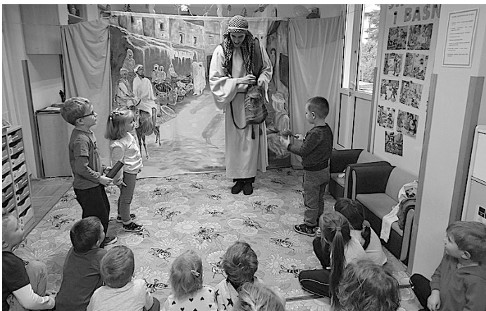
Częstym gościem przedszkola jest Teatr „Eden” z Wieliczki.

Dnia 5 lutego odwiedził przedszkole teatr „Eden” z Wieliczki, który wystąpił z przedstawieniem pt. „Opowieść o dobrym człowieku”. Była to zabawna i wzruszająca historia kupca, który znalazł się w potrzebie, a przechodzący obok ludzie okazali mu obojętność. Na szczęście znalazł się dobry człowiek, który przyszedł mu z pomocą. Z wydatną pomocą przychodziły również dzieci, które uczyły się na czym polega bezinteresowna pomoc bliźniemu. Humorystyczne dialogi, ciekawa dekoracja i kostiumy oraz angażowanie dzieci w przebieg spektaklu przyczyniły się do sukcesu przedstawienia.