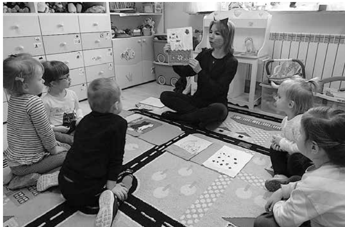
Grupa „Słoneczek” obchodziła Dzień Kota.

Grupa „Słoneczek” obchodziła Dzień Kota. Dzieci wysłuchały wiersz „Kotek” J. Tuwima, oglądały ilustracje z kotkami oraz wysłuchały ciekawostek na temat ich życia. Słoneczka bawiły się przy piosenkach „Kotek Puszek”, „My jesteśmy kotki dwa”, „Uciekaj myszko”.