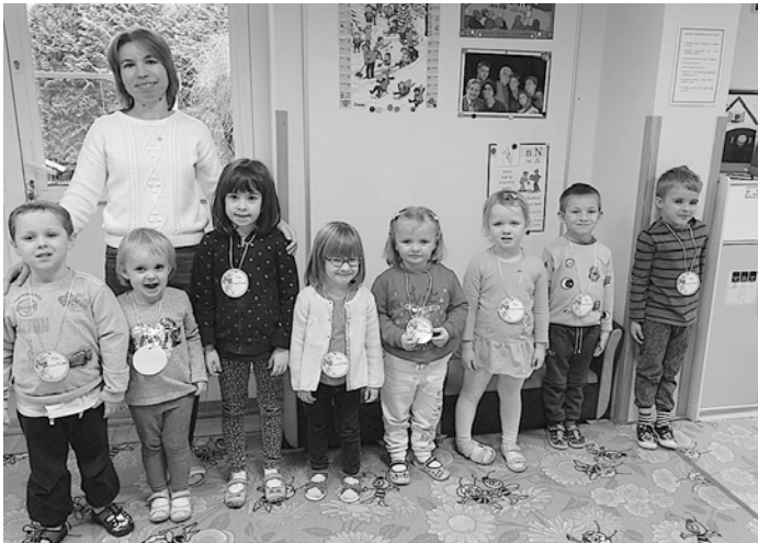
Dumnie przedszkolaki z Kubusiovym medalem.

Uroczę przygody wiecznie głodnego i poszukującego miodu Kubusia, Kłapouchego, który nieustannie gubi ogon, nieśmiałego Prosiaczka o wielkim sercu, rozbrykanego Tygrysa, czy praktycznego Królika i wszystkowiedzącej Sowy mogą być dobrą okazją do rozpoczęcia przygody z czytaniem. Pogodny z natury, oddany przyjaciel Kubuś z pewnością będzie dla kolejnego pokolenia najmłodszych czytelników doskonałym przewodnikiem po świecie literatury.