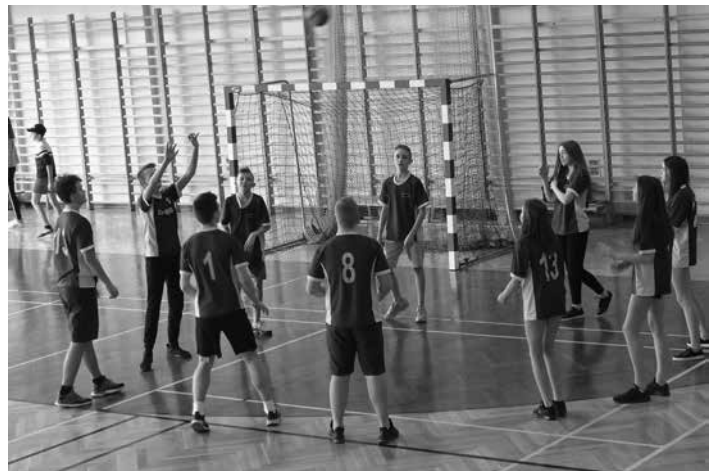
Rozgrywki sportowe pomiędzy uczniami