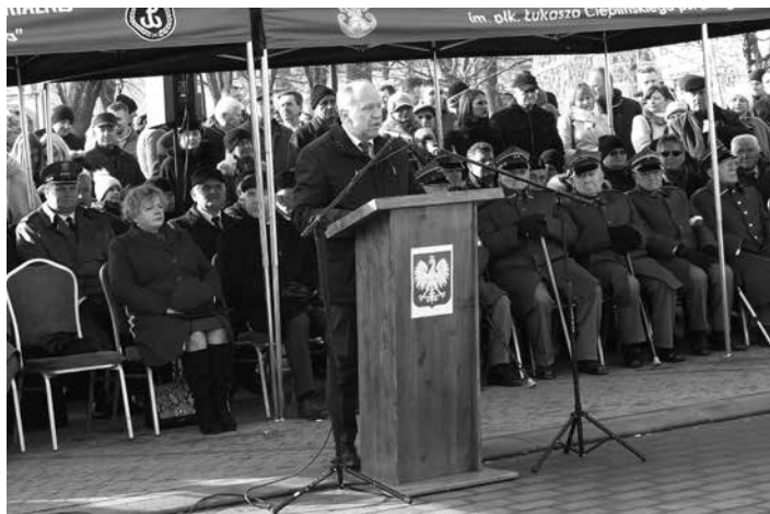
Poseł RP Zbigniew Chmielowiec zabierał głos w imieniu Ministra Obrony Narodowej