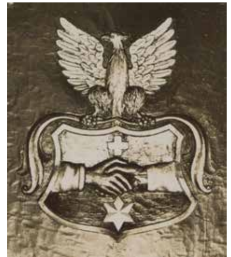
Herb na kolbuszowskiej Tarczy Legionów z 1915 r. (poczt. w AN w Krakowie)