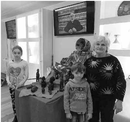
Rodzinna wizyta w Muzeum w okazji Dnia Babci – 21 stycznia 2020 r.