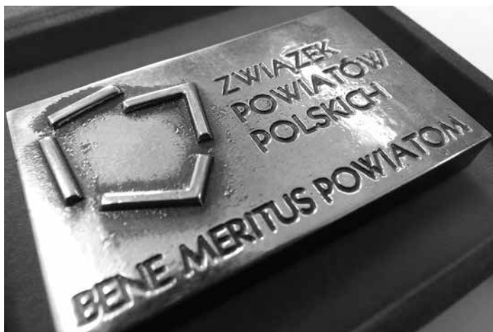
Odznaczenie Bene Meritus Powiatom przyznawane jest przez Zarząd Związku Powiatów Polskich