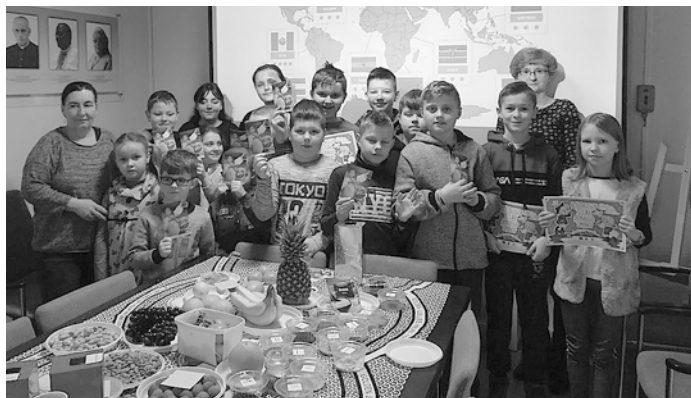
Ferie w Muzeum Kard. Adama Kozłowieckiego SJ – styczeń 2020 r.