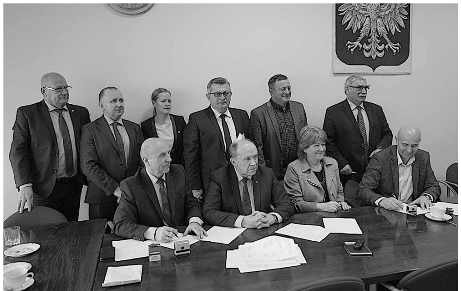
Regionalny Zarząd Gospodarki Wodnej w Rzeszowie

Wspomniana analiza, która jest przedmiotem porozumienia, pozwoli wskazać niezbędne do przeprowadzenia działania w zlewni rzeki Łęg, które wyeliminują zagrożenia spowodowane powodzią oraz obserwowanymi ostatnio niedoborami wody. Analiza stanowić będzie również podstawę do pozyskania środków finansowych na realizację planowanych inwestycji.