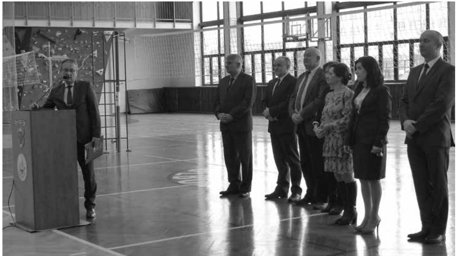
Zajęcia sportowo-edukacyjne rozpoczęły się o godz. 9.00 na hali widowiskowo-sportowej Liceum Ogólnokształcącego

W wydarzeniu tym Samorząd Powiatu Kolbuszowskiego reprezentowali: Przewodniczący Rady