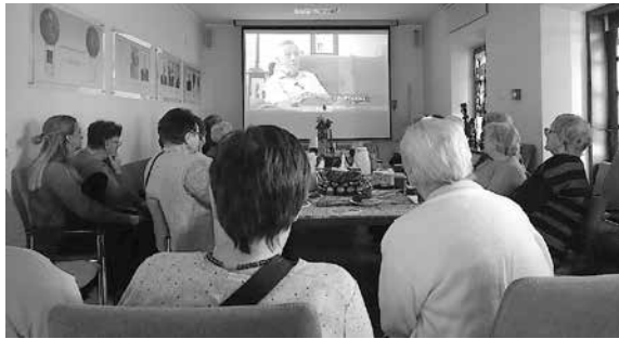
Prezentacja filmów misyjnych w ramach wizyty podopiecznych Domu św. Brata Alberta w Kolbuszowej, 21 stycznia

Przypominamy, że w ramach programu ograniczania przestępczości i społecznych zachowań pn.