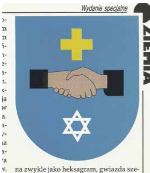
Amatorski wzór herbu J. Bardana uchwalony w 2000 r. (Ziemia Kolb., r. 2000, nr 49, s. 19)

Po krótkiej kampanii propagandowej, przeprowadzonej sprytnie przez dosłownie kilku zwolenników zmiany herbu, zarówno tych jawnych, jaki i utajnionych, w dniu 28 lutego 2000 r. Rada Miejska przegłosowała stosowną uchwałę. Na bazie starego uchwaliła nowy herb w wersji żydomasońskiej. Zaprojektował go, albo jak twierdzą złośliwi „zmajstrował” wyżej wspomniany mgr