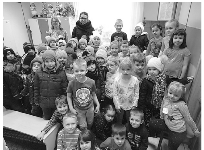
Dzieci z grupy „Zeberek” z Przedszkola Publicznego nr 1 w Kolbuszowej z wizytą w ochronce.