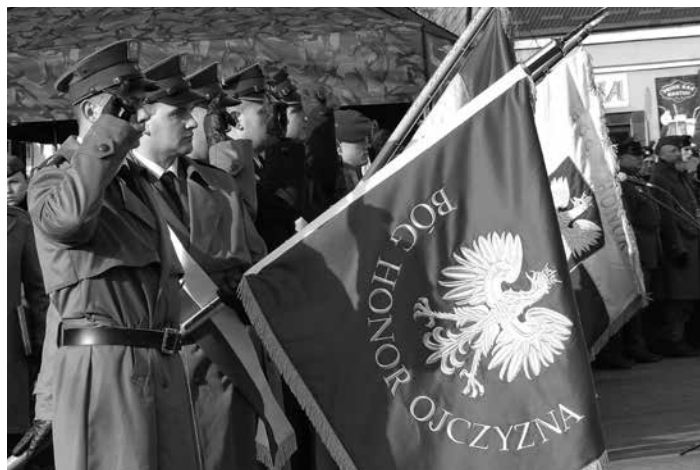
W uroczystości uczestniczyły poczty sztandarowe