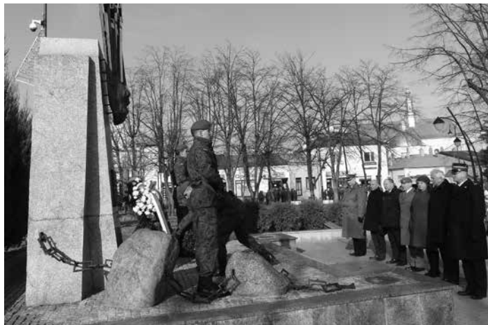
Uroczystą przysięgę poprzedziło złożenie kwiatów przed pomnikiem poświęconym żołnierzom i bohaterom walczącym i poległym za wolność i suwerenność Ojczyzny

Przedsiębiorcy, urzędnicy, medycy, matki i ojcowie, rolnicy, studenci i uczniowie – to oni znaleźli się w gronie żołnierzy 3. Podkarpackiej Brygady Obrony Terytorialnej im. płk. Łukasza Cieplińskiego ps. „Plug”, którzy złożyli uroczystą przysięgę w niedzielę (26 stycznia), na Rynku w Kolbuszowej.