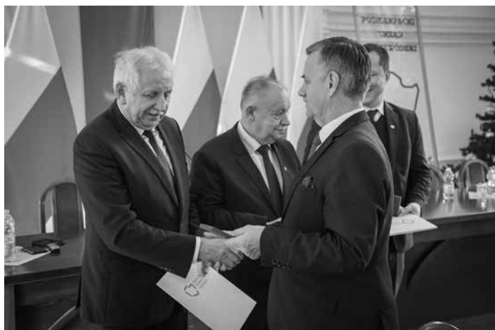
Wręczenie odznaczenia odbywało się w siedzibie Podkarpackiego Urzędu Wojewódzkiego w Rzeszowie