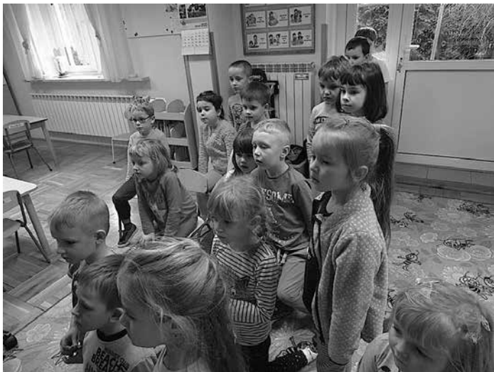
Starszaki w ramach projektu „Magiczna moc bajek” zapoznały się z różnymi rodzajami niepełnosprawności.

Temat inności, niepełnosprawności należy poruszać z dziećmi ucząc je tego, że ludzie różnią się od siebie, nie wszyscy są w pełni sprawni, ale to nie znaczy, że są gorsi od pełnosprawnych. Warto podejmować temat przyjaznego stosunku do osób z niepełnosprawnością w rozmowach z dziećmi, aby dzieci nauczyły się tolerować inne dzieci, dorosłych różniących się od tych zdrowych - wyglądem czy zachowaniem. Najważniejszy niewątpliwie jest przykład dorosłych, którzy dla dzieci są wzorami w zakresie konkretnych zachowań społecznych. Choć osoby niepełnosprawne mogą być w oczach dziecka „inne”, warto zaznaczyć, że każdy z nas jest WYJĄTKOWY.