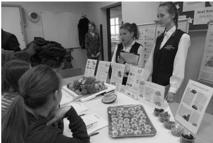
Uczniowie szkół średnich z łatwością nawiązywali kontakt z młodszymi kolegami i koleżankami