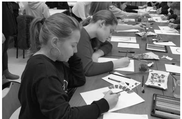
Zajęcia artystyczne cieszyły się dużym zainteresowaniem