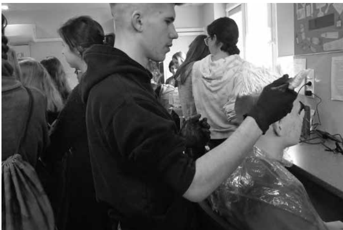
...a może by tak wybrać zawód fryzjera???