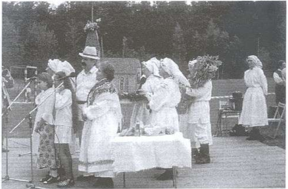
W Mazurach ostatnio imprez nie brakuje a Koło Gospodyń zawsze przyspiewuje...

W okolicznościowym przemówieniu Wójt powitał zaproszonych gości, którzy zechcieli uświetnić uroczystość swoją obecnością, sołtysów, zespoły wieńcowe, rolników oraz publiczność licznie przybyłą na doroczne gminne dożynki. Dostrzegł trudną sytuację miejscowych rolników, którzy niejednokrotnie funkcjonują tylko dlatego, że dochody z wypracowanych emerytur i rent wkładają w rodzinne gospodarstwa. Gmina stara się pomóc miejscowemu rolnictwu poprzez dotacje do zakupu materiału siewnego i sadzenia, inseminacji, usług weterynaryjnych, konserwację rowów melioracyjnych. Jest to za mało, aby zmie-