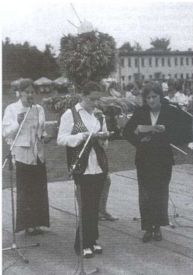
Czy chciałybyś = Porąb chłopaka? Chłopaka = Porąb? Ach tak!

Następnie wystąpił zespół z Woli Raniżowskiej. Chociaż dziewczęta zasługują na pochwałę odnośnie wykonania wieńca, to z przyśpiewkami się rozminęły. Większość z przedstawionych w nich problemów dało się słyszeć na dożynkach w latach ubiegłych. Można by wysnuć