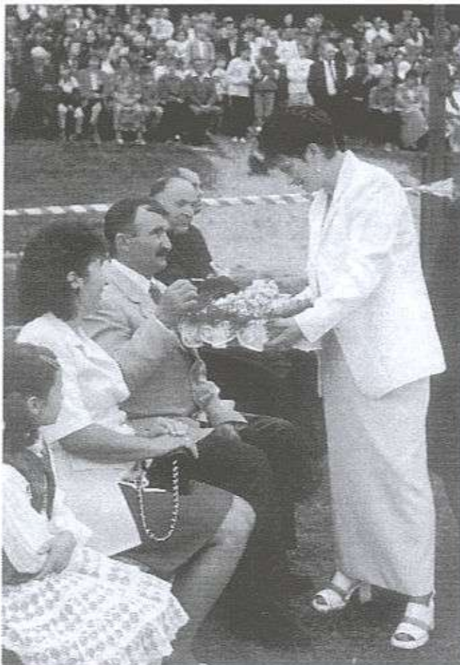
Częstowanie chlebem uczestników Dożynek

się wieńce i kłosy. To dopiero w ostatnich latach - latach ateizacji te dożynki odbywały się pod kościołem. Dlatego też musimy pamiętać, że wszystko Bogu zawdzięczamy i Bogu niesiemy plon, który z Jego szczodrobliwości i dobroci otrzymaliśmy.” Homilę natomiast wygłosił ks. Eu-