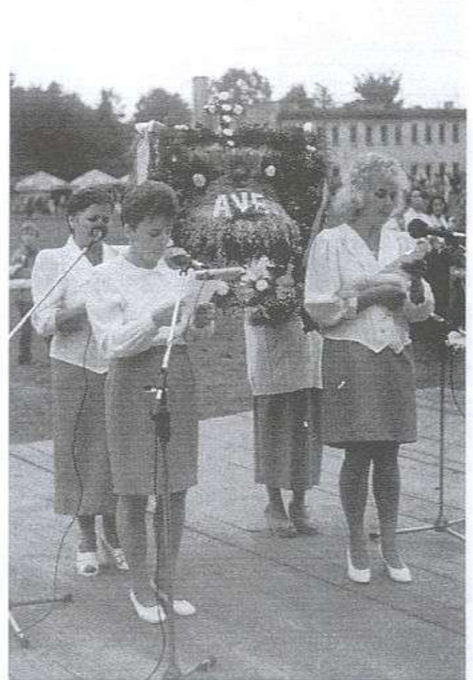
U nas w Staniszewskim od straży się roi, miały być dożynki, plac w pokrzywach stoi...