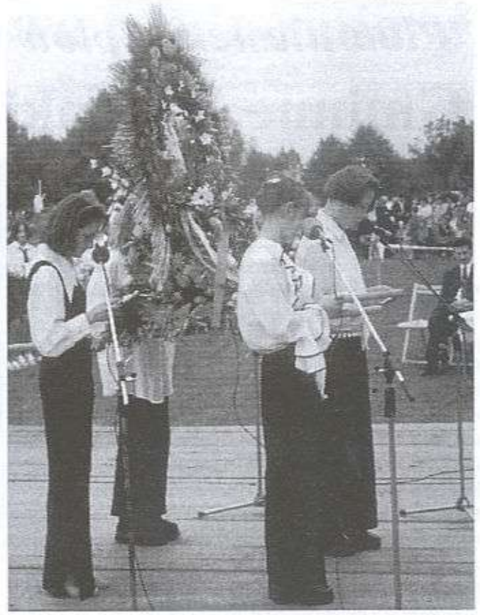
Korczowianki my se, korczowianki znane, choć my nie ładne, ale wygadane...