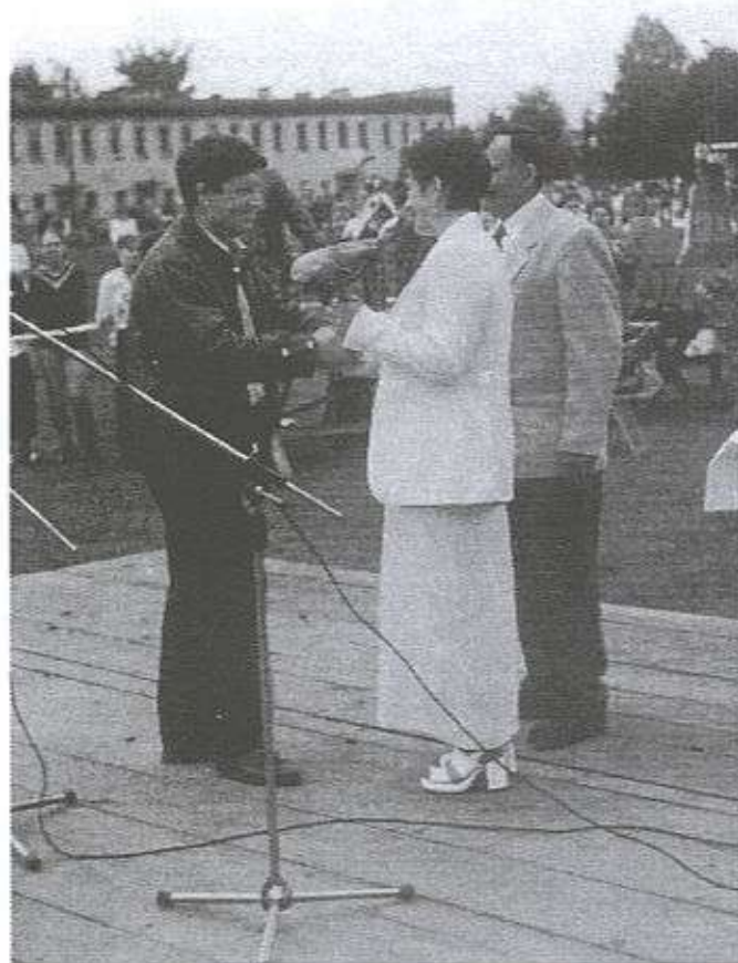
"Starościna, proszę za korzeń trzymać!"

Następnie zaprezentował się zespół śpiewaczy z Mazurów . Wieniec nietypowy, a jednocześnie ładny i precyzyjny przedstawiający kościół parafialny. Było to nawiązanie do 60-lecia parafii Mazury. 14-to osobowemu, wie-