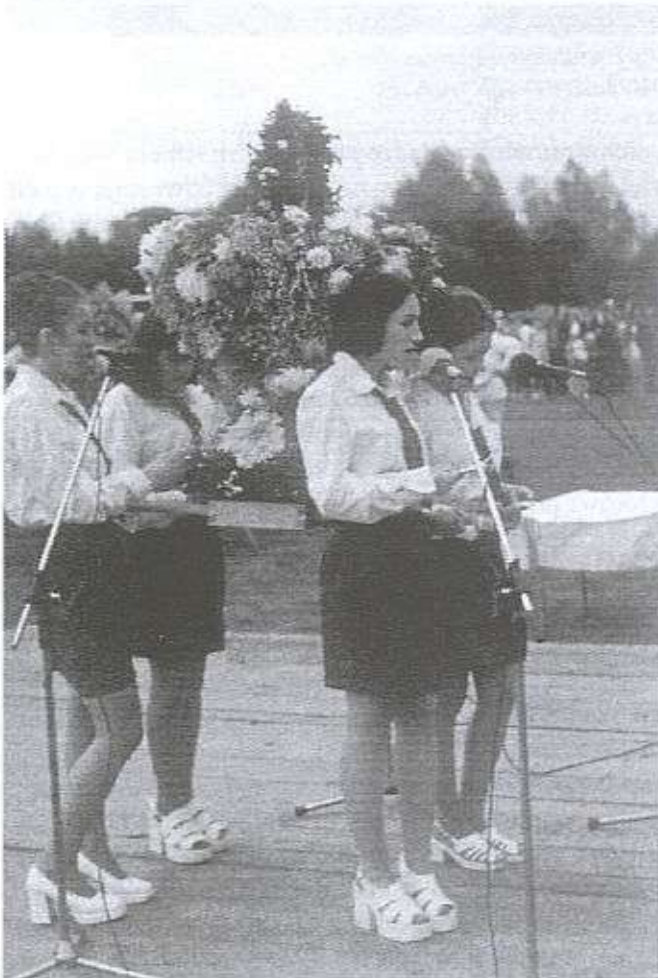
Cztery morgi pola samej koniczyny, są w naszej Zielonce porządne dziewczyny...

nić sytuację w rolnictwie i przybliżyć standart życia do miejskiego. Oprócz tego gmina inwestuje w infrastrukturę - w roku ubiegłym zakończono proces wodociągowania wszystkich miejscowości, w czterech wsiach jest już