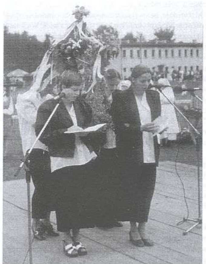
Ranizów - to wioska, gdzie wszyscy się znają, różne więc problemy tu też miejsce mają...