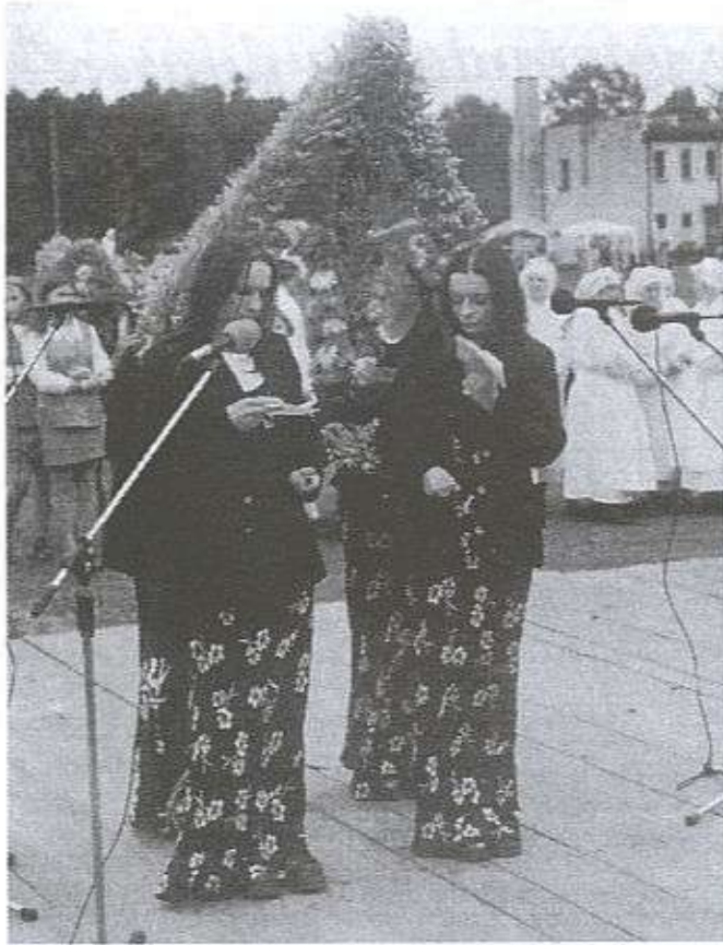
Teraz tobie nasz starosto wieniec przynosimy, od wszystkich rolników w darze oddać chcemy...